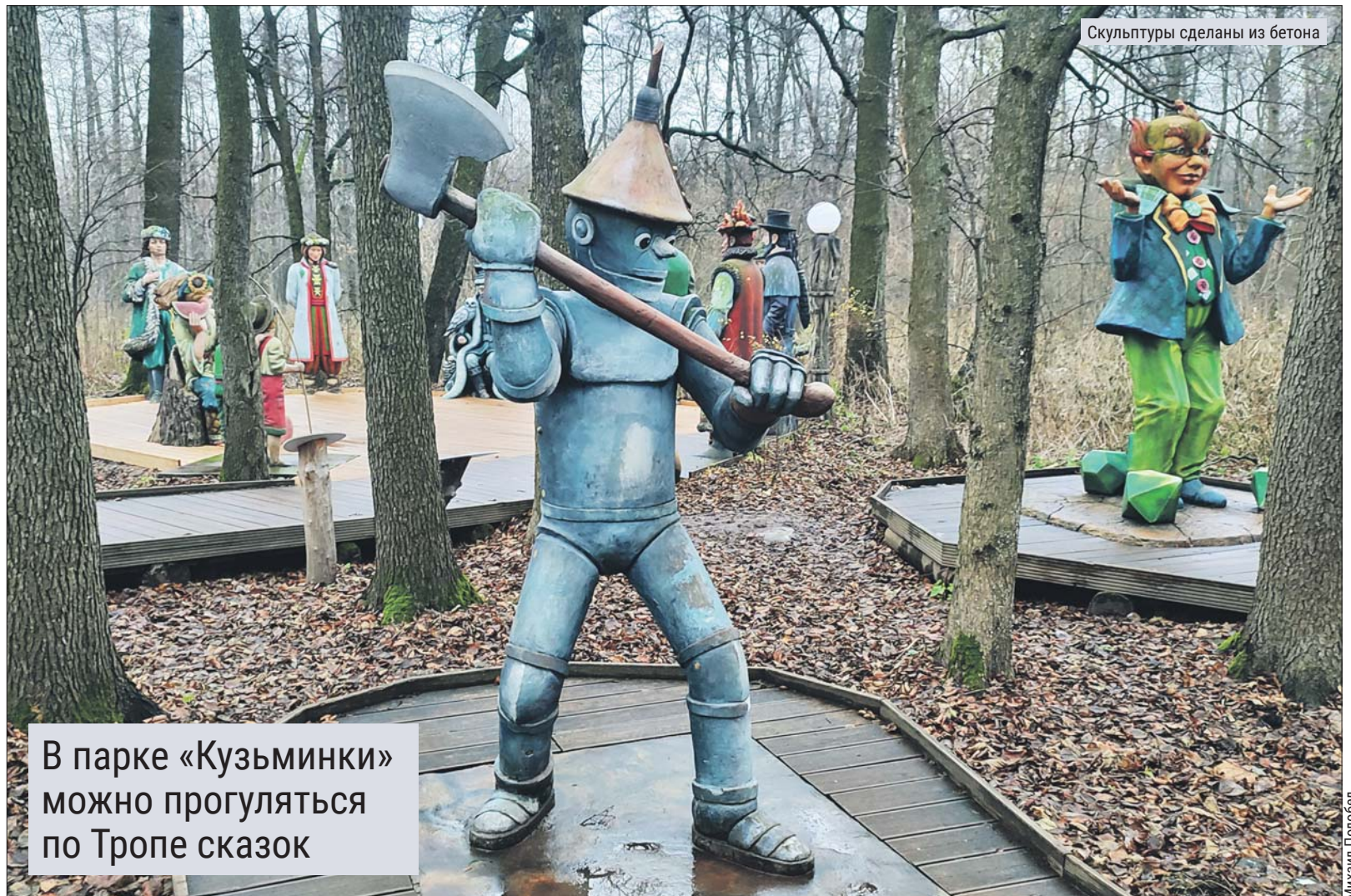
Скульптуры сделаны из бетона

В парке «Кузьминки» можно прогуляться по Тропе сказок