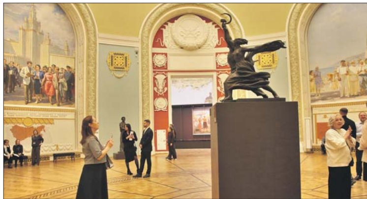
Экспонаты связаны со временем строительства павильона «Центральный»

Павильон «Центральный» открыли в 1954 году. Он крупнейший на главной выставке страны: высота со шпилем — 97 метров. Недавно реставраторы вернули павильону исторический облик.