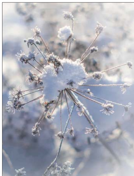
Будет викторина «От снежинки до сугроба»

Обязательна запись по тел. (495) 377-3593 . Возраст 6+