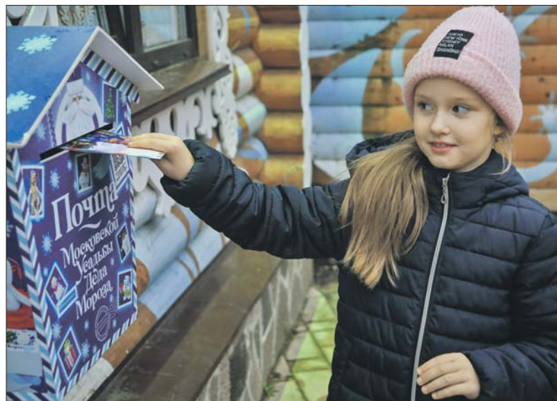
Почтовый ящик в Московской усадьбе Деда Мороза