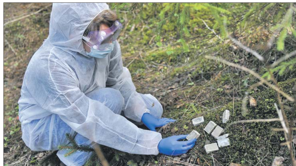
Александр Авилов/Агентство «Москва»