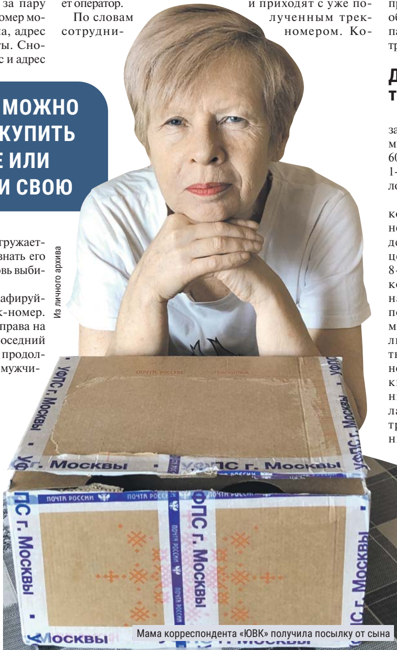
Мама корреспондента «ЮВК» получила посылку от сына