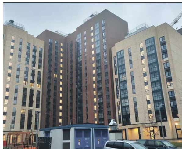
Новостройка на Ставропольской улице, 4/2