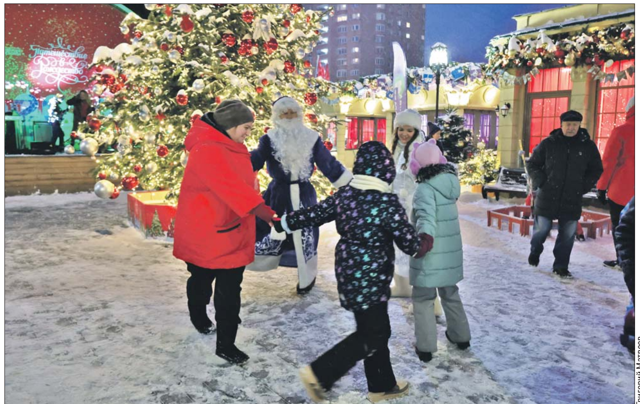
Будет чем заняться не только на фестивальных площадках