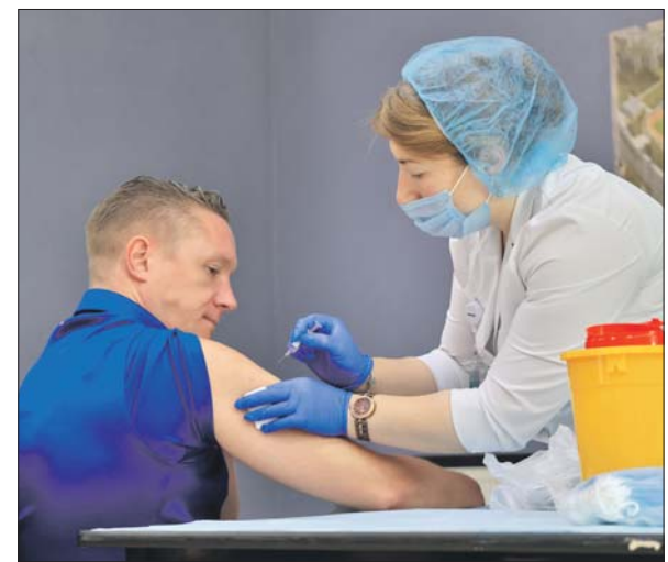
Вакцинация в префектуре

Полный перечень пунктов мобильной вакцинации в Москве размещён на сайте mosgorzdrav.ru/antivirus