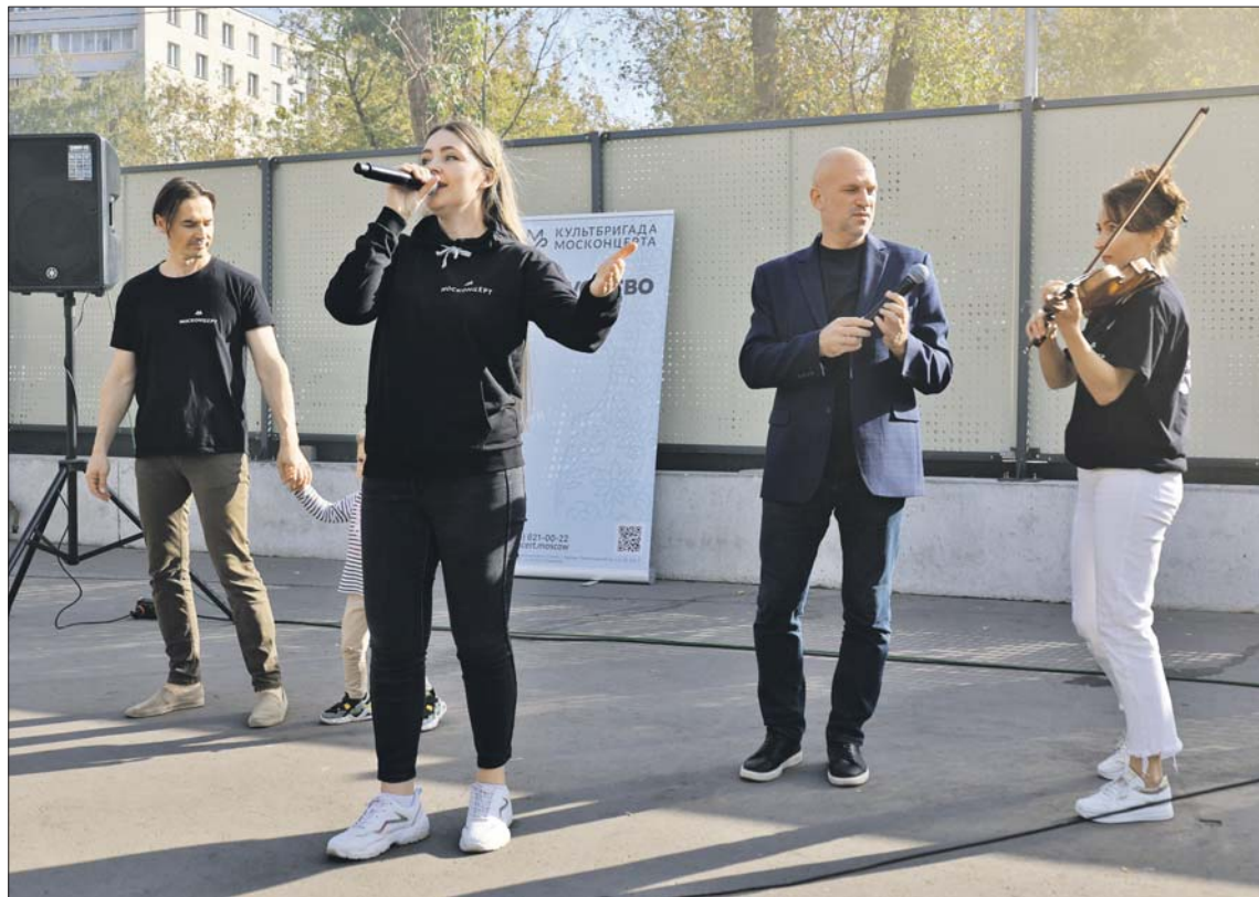
Артисты Москонцерта выступают в пункте отбора с первых дней его открытия

По его мнению, работа в пункте организована очень четко, личные вопросы, сбор докумен-