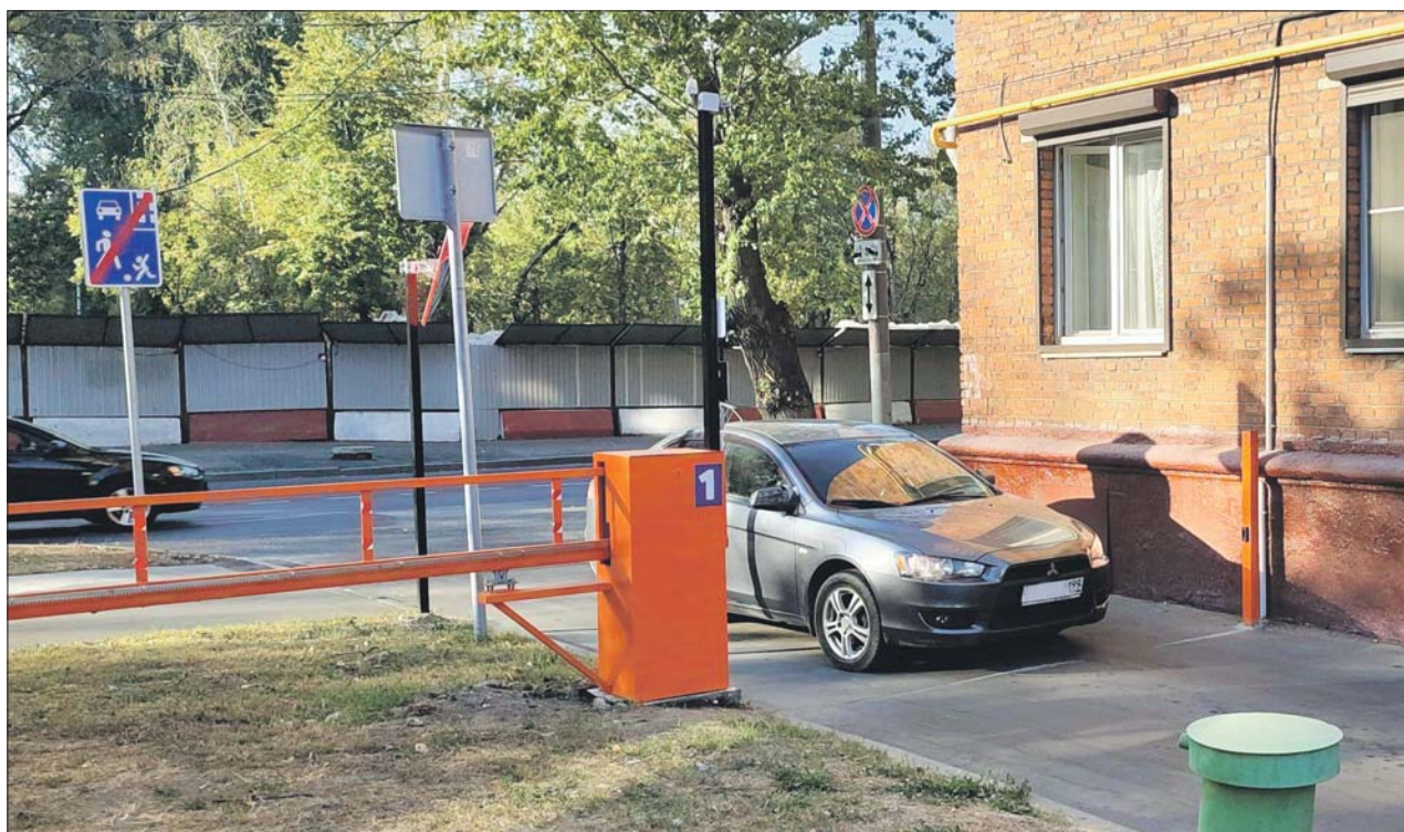
Въезд во двор дома 41/2 на Рязанском проспекте

— На указанной территории в этом году проводятся работы по комплексному благоустройству. Заказчик работ ГБУ «Автомобильные дороги» направил в адрес подрядчика требование