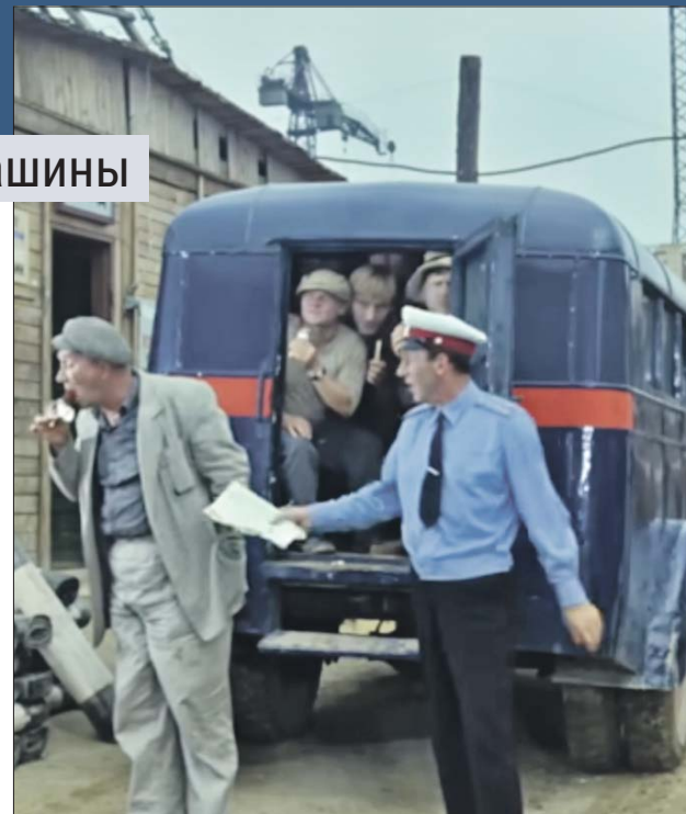
Кадр из фильма «Операция «Ы» и другие приключения Шурика»

Такой же автомобиль, как в культовой комедии, теперь есть в музее на Краснодарской улице