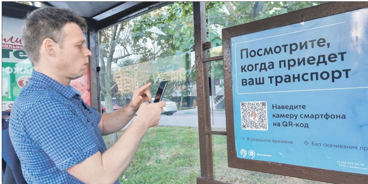
Чтобы воспользоваться QR-кодом на остановке, транспортное приложение скачивать не нужно

С помощью новых технологий пассажиры могут сэкономить на поездке и узнать расписание