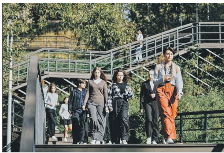
Участники экскурсии посетили современный парк на набережной Москвы-реки

С момента начала экскурсионной программы более 650 москвичей стали участниками пеших прогулок, организованных поездок на велосипедах и электросамока-