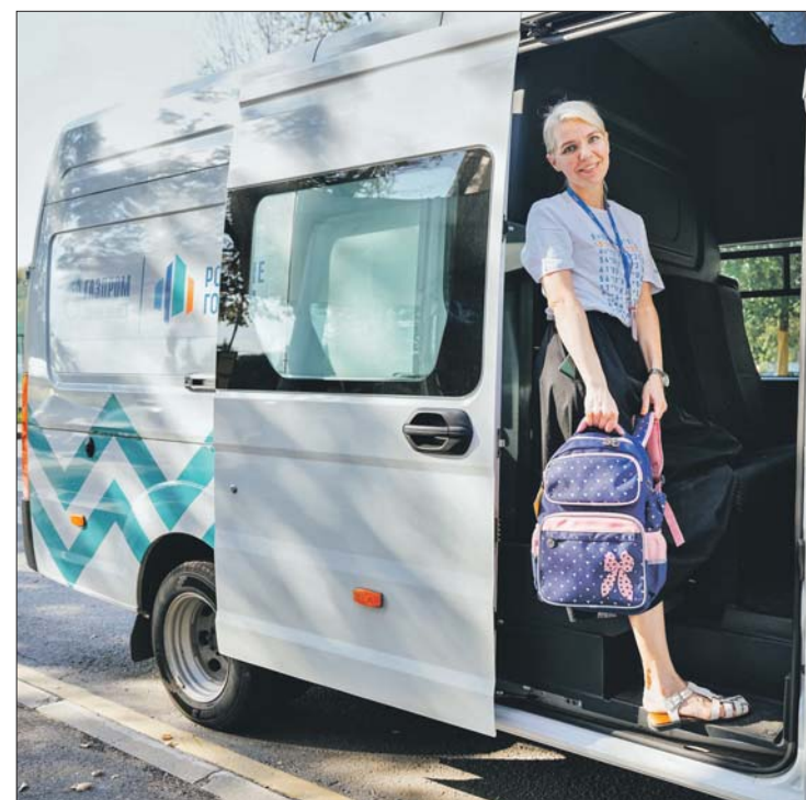
Волонтер МНПЗ перед отправкой подарков детям