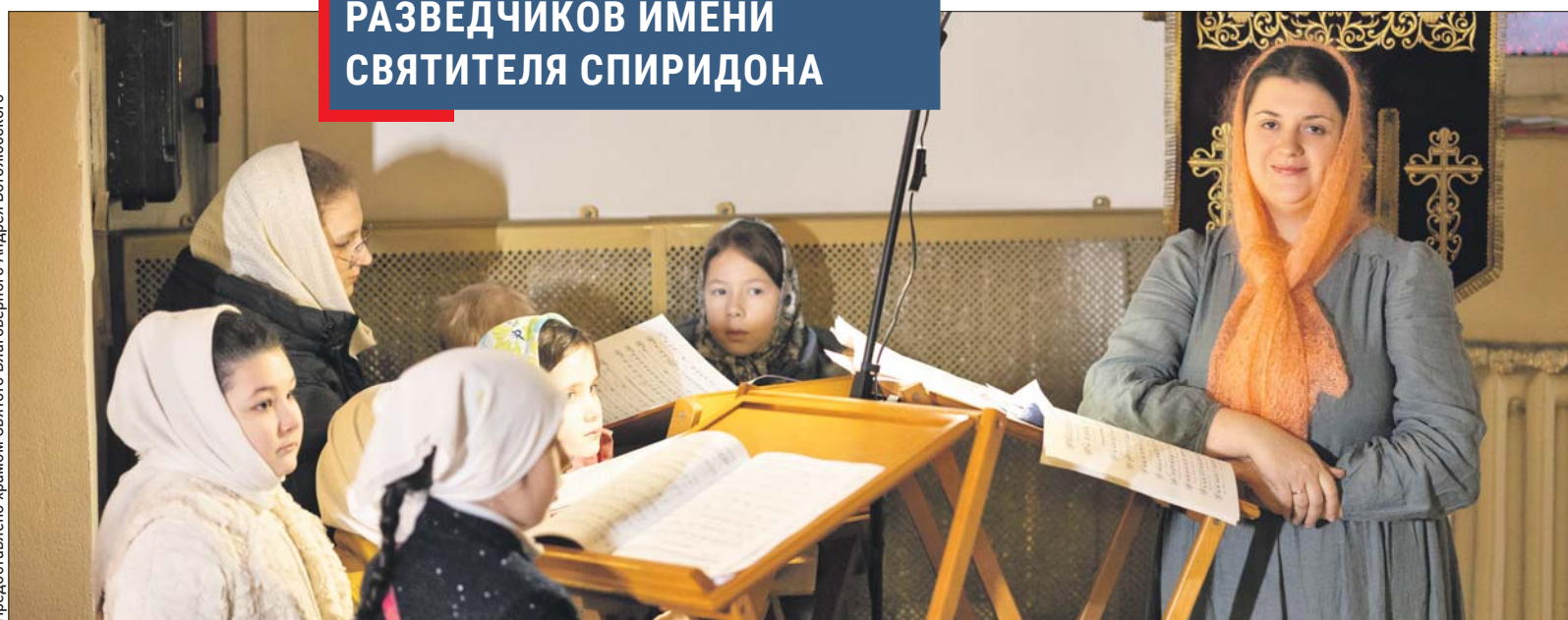
Хор воскресной школы «Княжичи»