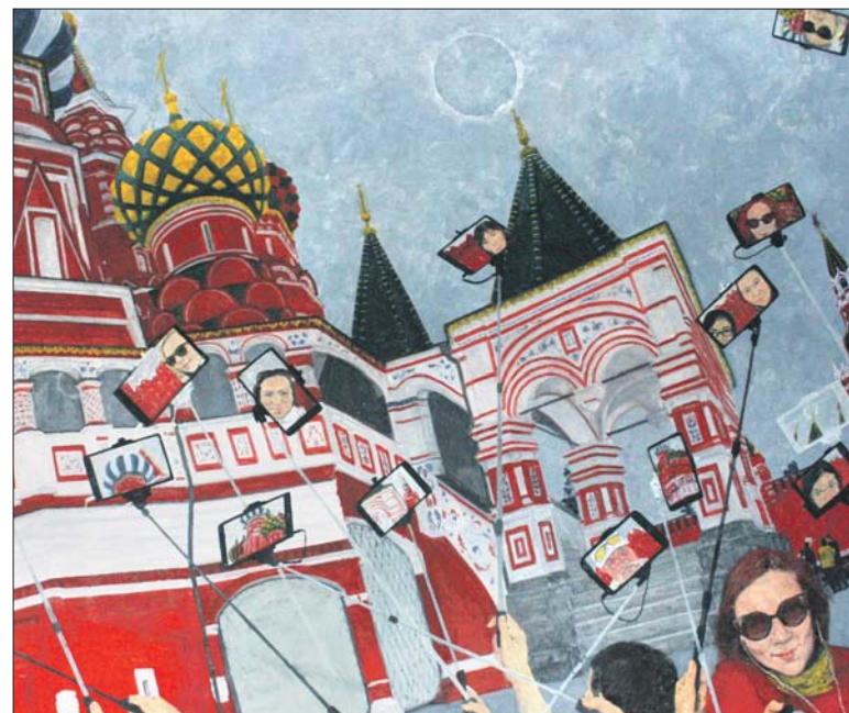
Алла Полковниченко. «В сердце нашей Родины». 2018 год

Выставка продлится до 15 сентября . Стоимость билета — 300 рублей