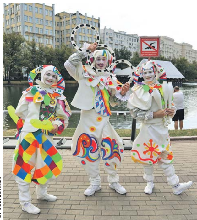
Фестиваль «Театральный бульвар» на Бульварном кольце