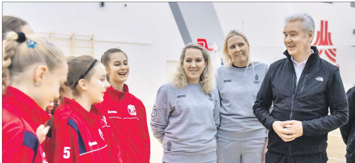
Декабрь 2023 года. Мэр в новом спорткомплексе «Ника» на Волжском бульваре

По словам мэра Москвы Сергея Собянина, на территории Юго-Востока новые квартиры в современных домах получили 30 тысяч жителей.