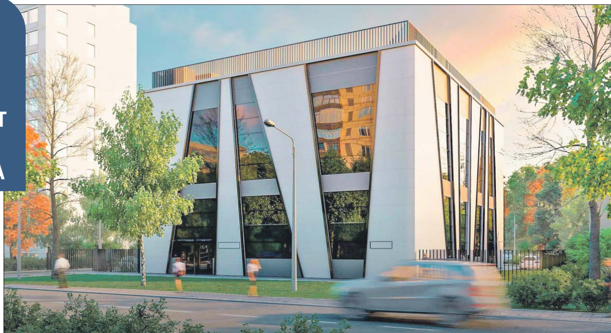
Проект четырёхэтажного культурно-спортивного центра «Печатники» на улице Полбина

В качестве одного из примеров комплексного освоения и застройки территории новых кварталов, возводимых по реновации, мэр Москвы привёл культурно-спортивный центр «Печатники». Четырёхэтажный корпус для него планируют построить на ул. Полбина, вл. 37, недалеко