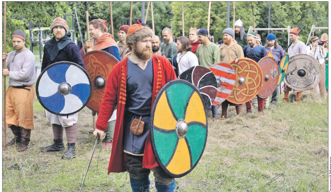
Русская дружина в парке «Печатники»

На Бульварном кольце прошёл фестиваль «Те-