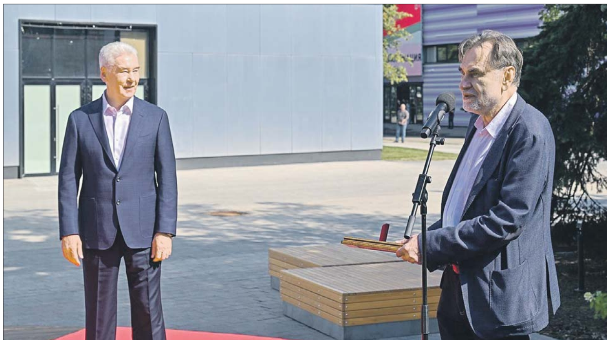
Мэр Сергей Собянин и председатель правления Ассоциации продюсеров кино и телевидения Сергей Сельянов

По словам столичного градоначальника, чтобы создать в этом месте полноценную киностудию, пришлось реконструировать старую промышленную зону, в том числе построить четыре стандартных съёмочных павильона, два павильона для съёмок с технологией расширенной реальности, тематический павильон