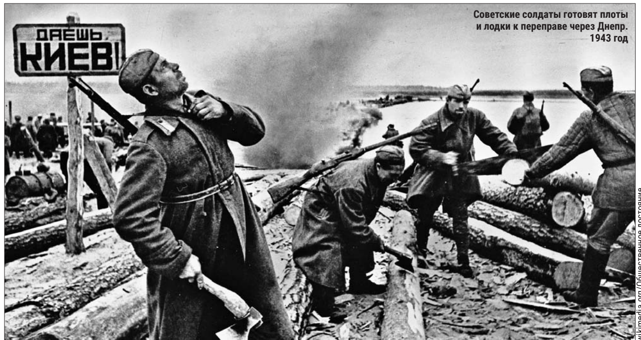
Советские солдаты готовят плоты и лодки к переправе через Днепр. 1943 год