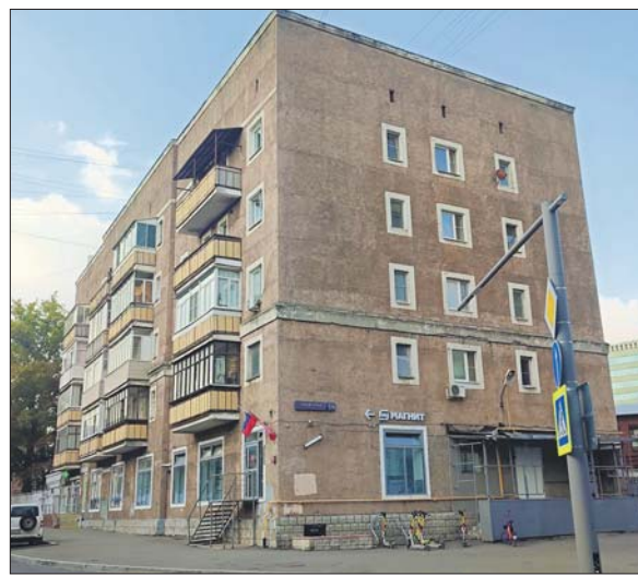
Дом на Таможенном проезде