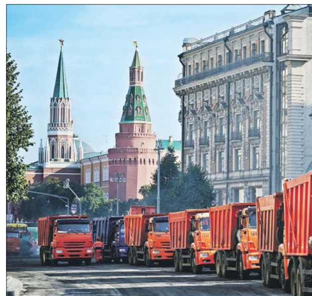
Ремонт асфальта от Моховой улицы до Пушкинской площади был сделан в кратчайшие сроки

К слову, с начала 2024 года в Москве построили 12,3 км дорог, а также восемь искусственных сооружений и один пешеходный переход. При этом за 13 лет в столице проложили более 1,3 тысячи км дорог.