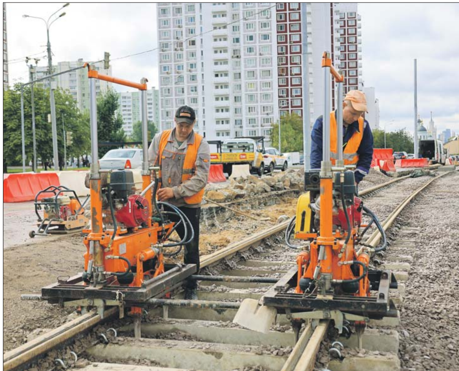
Рабочие поднимают рельсы до необходимого уровня

Новая линия проходит по нечётной стороне улицы. Рельсы находятся не посередине проезжей части, а с краю. Так сделали, чтобы посадка и высадка пассажиров была безопасной.