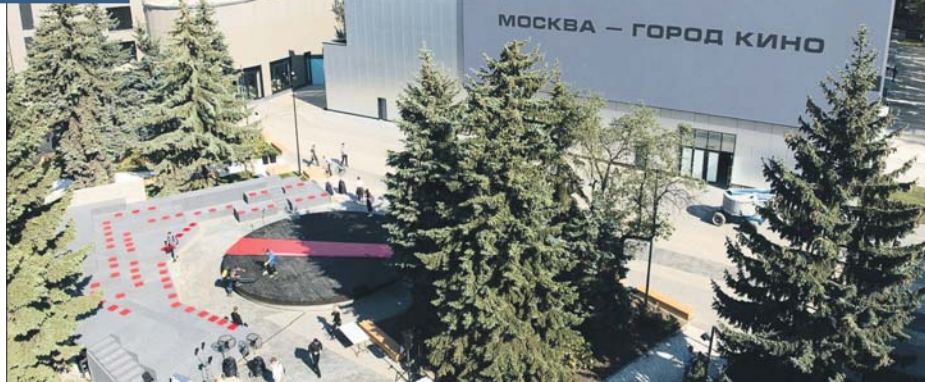
Киностудия на Рязанском проспекте

Во время посещения киностудии мэр Москвы вручил городские награды деятелям российской киноиндустрии