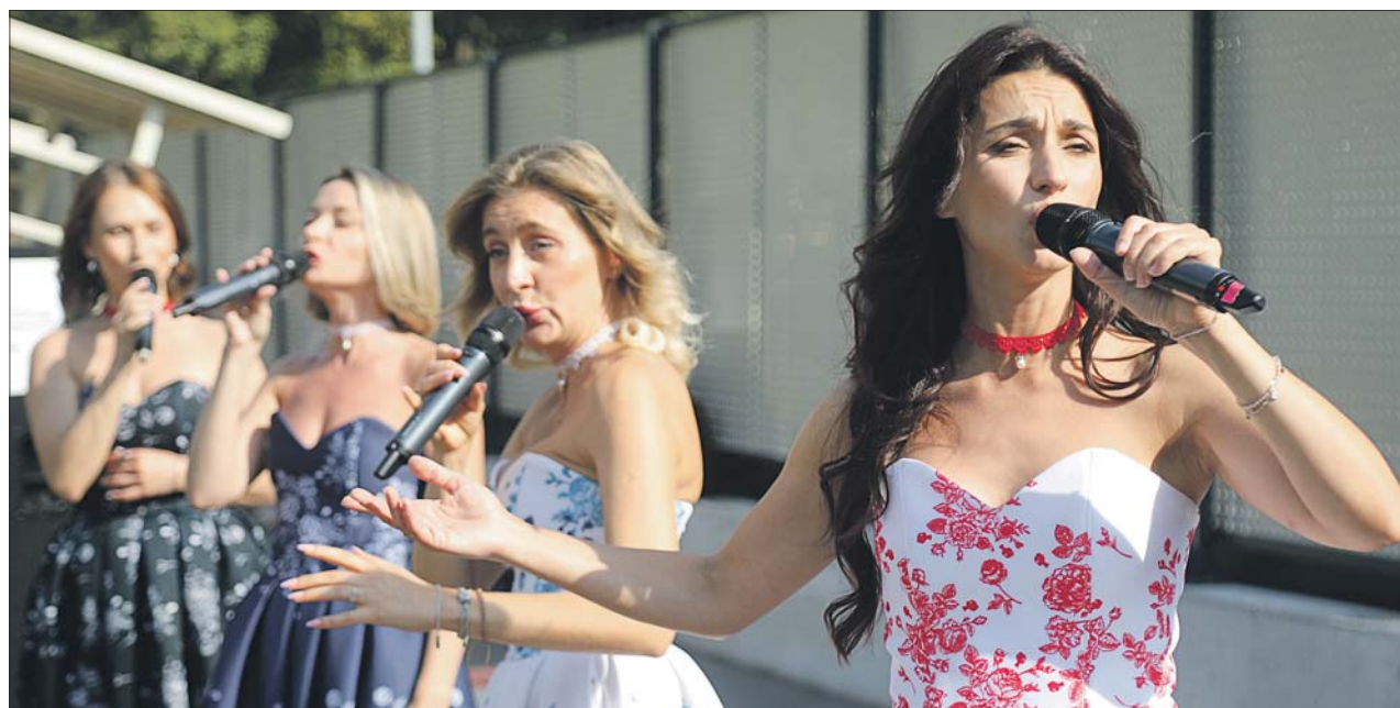
На улице Яблочкова выступила также вокальная группа «ТеАмо». Девушки пели о любви, которая бережёт и спасает жизни

— Чем хороша скрипка? Ей не нужно дополнительное оборудование. Вынул из футляра — и выступай. Она как живая, боевой товарищ. Лет ей уже немало, но она выдержала экстремальные условия: играла и в -5, и в +40, — признался музыкант.