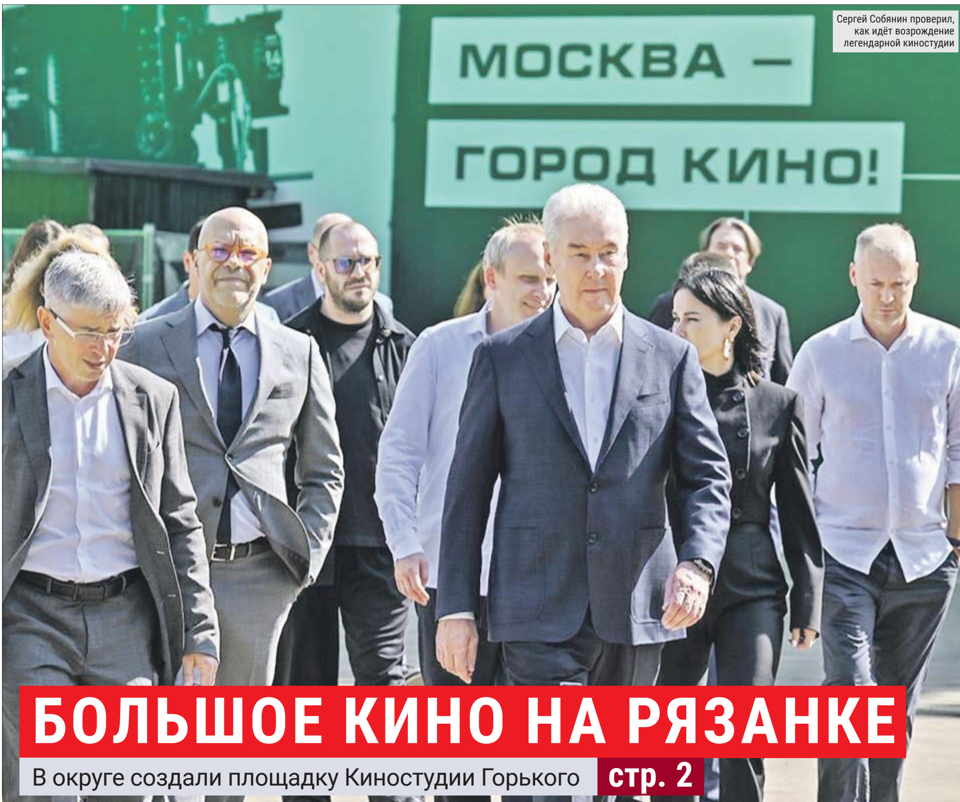
Сергей Собянин проверил, как идёт возрождение легендарной киностудии

ВСЕ НОВОСТИ ОКРУГА ЕЖЕДНЕВНО В ТЕЛЕГРАМЕ UV_KURIER_ UVAO