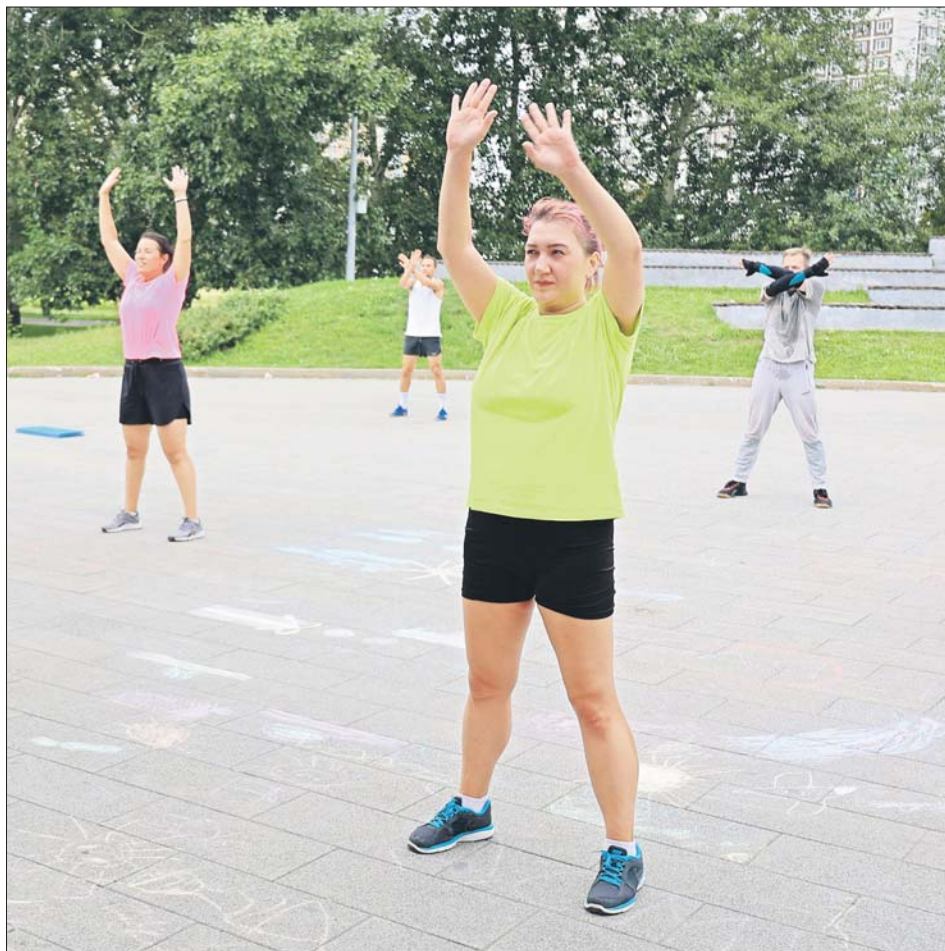
Фитнес-зарядка в Марьине

Как рассказали организаторы программы, в киногороде будут реконструировать съёмку известных кинофильмов, например «Бриллиантовой руки», «Формулы любви», «Берегись автомобиля». Можно попробовать себя в качестве актёра. Работой руко-