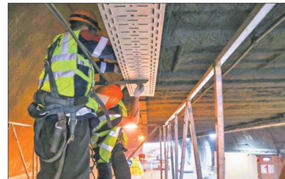
Telegram-канал мэра Москвы Сергея Собянина t.me/mos_sobyanin

«На объектах проведём различные виды ремонтных работ: на мостах, эстакадах и путепрово-