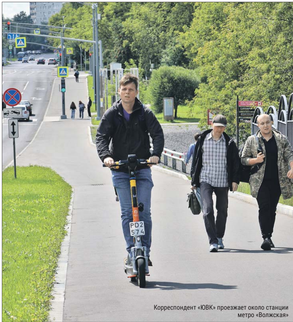
Корреспондент «ЮВК» проезжает около станции метро «Волжская»

Недавно семнадцатилетний парень катил на электросамокате по улице Академика Скрябина и сбил 70-летнюю женщину. Медики диагностировали у неё перелом лодыжки. А за несколько дней до этого девушка сбита женщиной-пешеходом на улице Авиаконструктора Милая. У пострадавшей сильные ушибы.