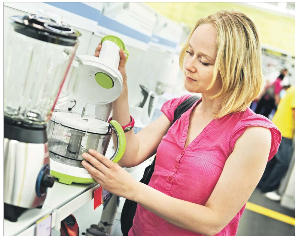
Те, кто предварительно регистрируется, смогут получить баллы в категории «Техника для дома»

— А так как внедрена игровая механика, то она ещё в каждом пробуждает ребёнка, которому интересно и выразить своё мнение, исполнить свой гражданский долг, и получить какие-то призы. Это