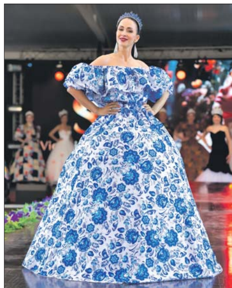
Гостей ждут показы от известных дизайнеров