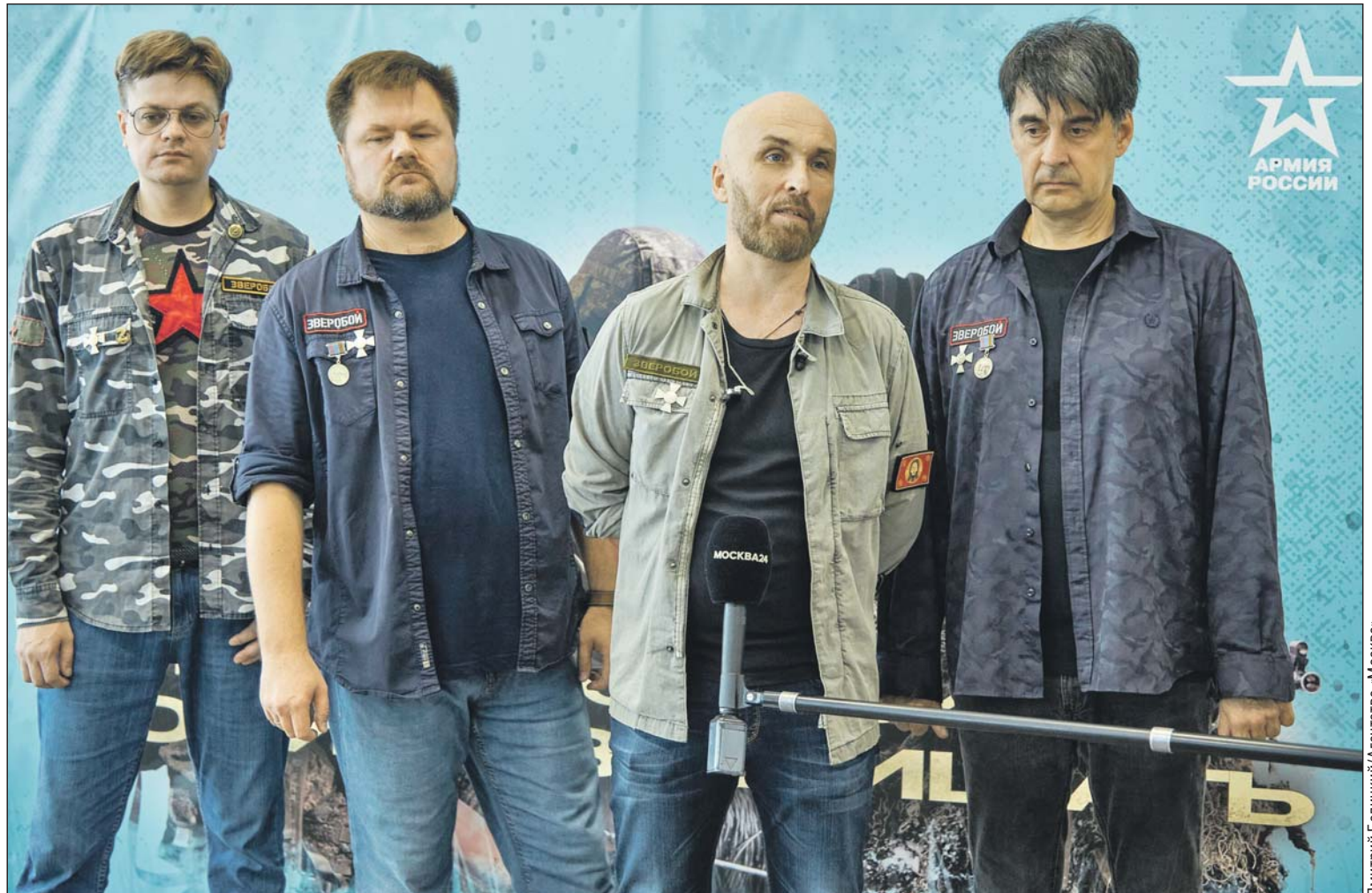
Музыканты группы «Зверобой»

Вместе с инструктором музыканты прошли по пункту. В коридорах многолюдно, но очередей нет. Процесс приёма налажен так, что ждать долго не приходится.