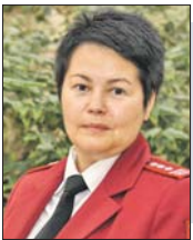
Юлия Ларина, главный государственный санитарный врач по ЮВАО

В Москве открылись сезонные торговые точки по продаже арбузов и дынь, которые будут работать до 1 октября. Вокруг любимой всеми ягоды существует множество мифов. Развеять их помогла главный государственный санитарный врач по ЮВАО Юлия Ларина.