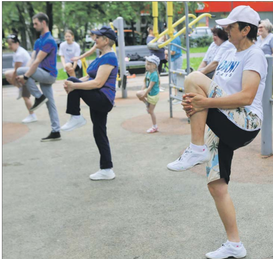
Занятия фитнесом в сквере «Плющево»

Для жителей ЮВАО пройдут спортивные занятия. 9 августа с 16.00 до 20.00 на фестивальной площадке (ул. Перерва, вл. 52) пройдут занятия Семейной школы мяча. Участников (6+) ждут мастер-классы, функциональные тренировки и отработка навыков по тэг-регби, баскетболу, волейболу и стритболу. После разминки можно будет поупраж-