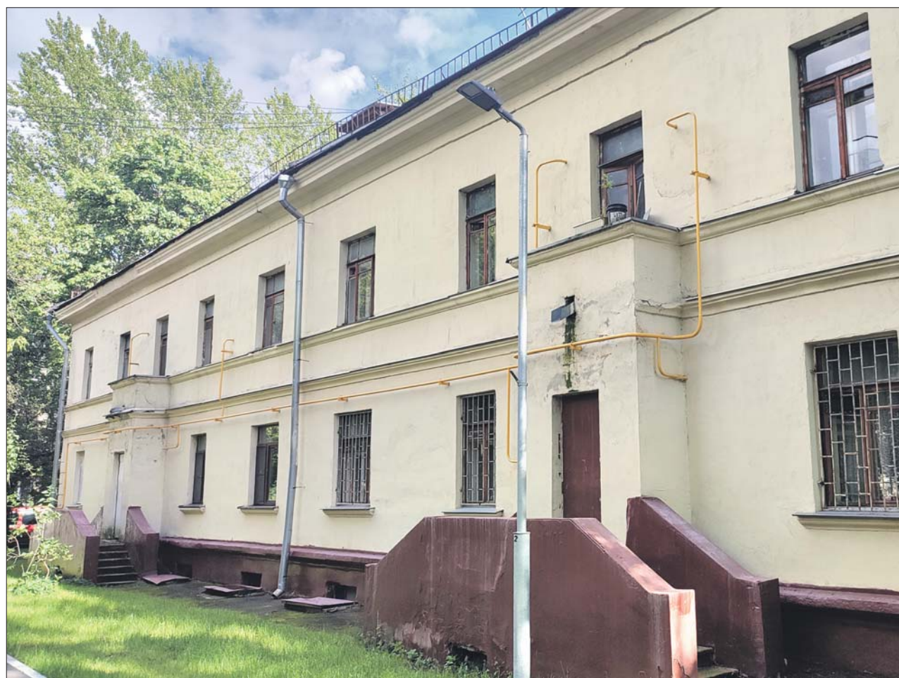
Дом, где произошло страшное преступление