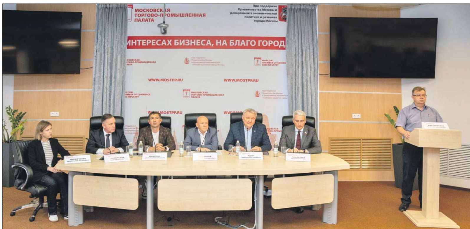
Пресс-конференция в Торгово-промышленной палате

МТПП Подробности акции и правила участия в ней можно посмотреть на ag-vmeste.ru