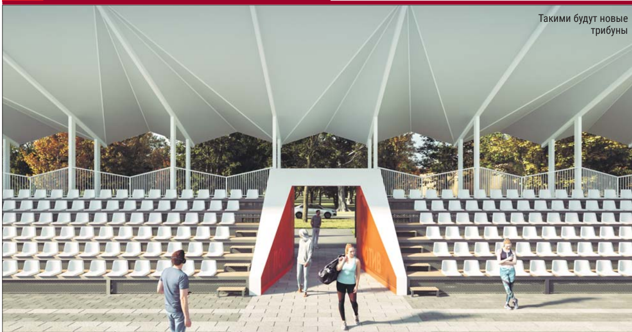
Такими будут новые трибуны