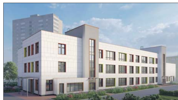
Этот детский сад на 300 мест на Сормовской улице будет с бассейном

Во всех зданиях создадут комфортные группы и залы, спальни, раздевалки, буфеты. Большое внимание уделяют безопасности: устанавливают охраняемые системы, пожарную сигнализацию и системы управления эвакуацией.