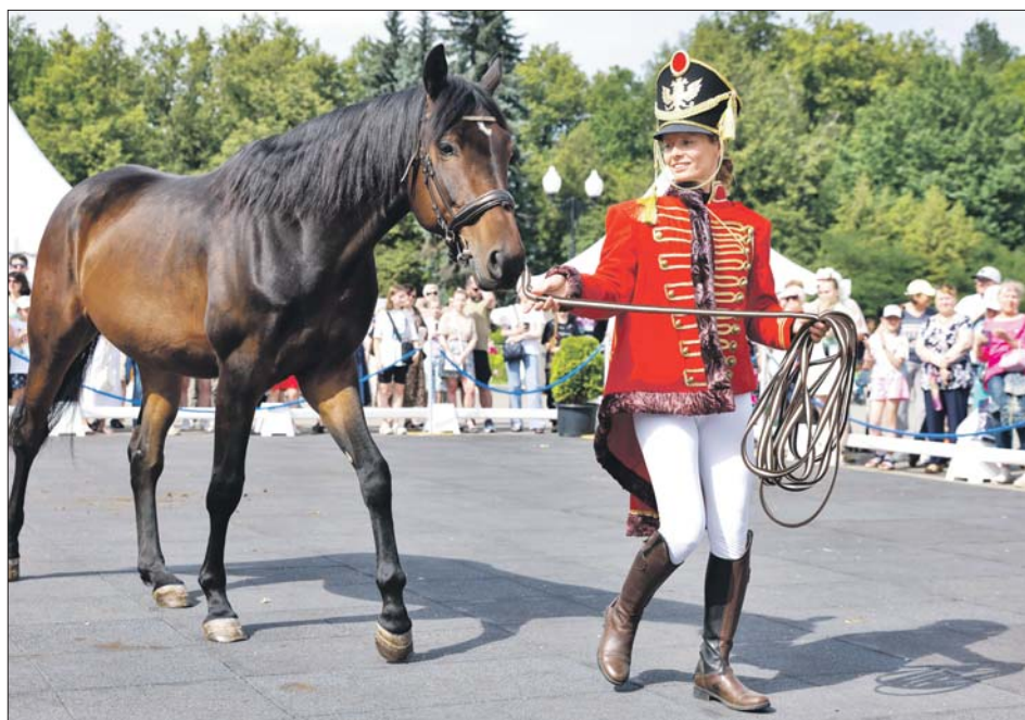
Хендлер демонстрирует русскую верховую

Каждую породу будут показывать хендлеры — специалисты, владеющие мастерством демонстрации лучших качеств лошади, в национальных костюмах. Например, владимирского тяжеловоза про-