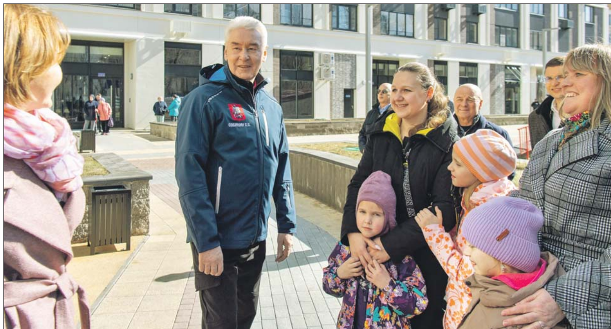
Апрель. Мэр общается с жителями нового дома по реновации на Волгоградском проспекте

В ЮВАО программа переселения из хрущёвок достигла быстрых темпов