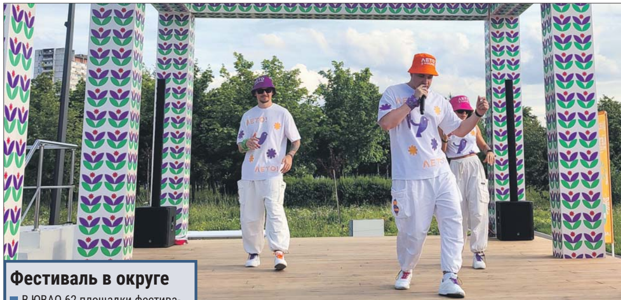
Урок танцев в парке «Печатники» для всех желающих

Для жителей ЮВАО проект «Мой спортивный район» подготовил тренировки по баскетболу, волейболу и бадминтону. Занятия проходят по вторникам, четвергам и субботам с 20.15 до 21.15 на открытых спортивных площадках во дворах и парках. 4 июля в баскетбол можно будет поиграть на спортплощадке на ул. Маршала Голованова, 4, и в сквере «Плюшево» (Зарайская ул., 51, корп. 2). 6 июля в 20.00 любители волейбола соберутся на спортплощадке на ул. Генерала Кузнецова, 28, корп. 1. А на Рождественской ул., 19, корп. 2, всех желающих