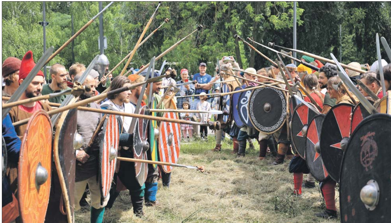
Реконструкция средневекового сражения

Одна из самых интересных реконструкций прошла в ландшафтном парке «Митино». Там посетители стали свидетелями взятия Парижа российскими войсками в 1814 году. Гости увидели парад пехоты и кавалерии двух армий с походом через