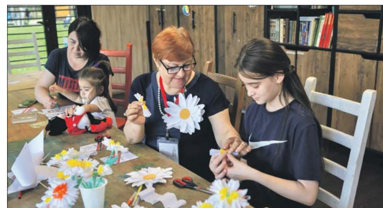
Мастер-класс в летней читальне

Помимо буккросинга и возможности почитать книги, каждые выходные в читальне будут проходить лекции и мастер-классы. Так, 22 июня в 12.00 пройдёт мастер-класс по изготовлению куклы наложке. 23 июня в 12.00 — мастер-класс «Весёлые зверята».