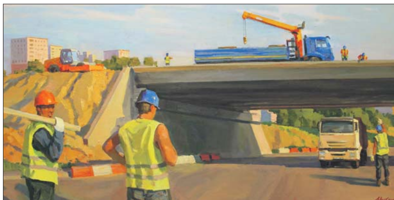
Картина «Юго-Восточная хорда» Александры Михно

Адрес: Батюнинская ул., 14. Время работы: вт.-вс. 11.00-20.00 (6+). Билеты — от 150 рублей