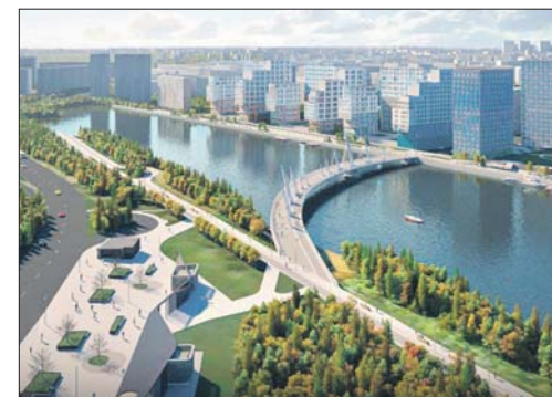
Проект велопешеходного моста через Нагатинский затон

Ещё семь пешеходных мостов появятся в столице до 2026 года. Как написал в телеграм-канале мэр, строятся мосты через Водоотводный канал от парка Горького к Балчугу и «ГЭС-2», через Язузу вблизи МГТУ им. Н.Э.Баумана и через Нагатинский затон. Ещё четыре моста проектируются — в районе набережной Марка Шагала и затона Новинки, через Москву-реку на Островной улице и в сторону парка «Фили».