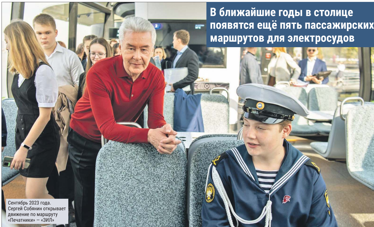
Сентябрь 2023 года. Сергей Собянин открывает движение по маршруту «Печатники» — «ЗИЛ»

В ближайшие годы в столице появятся ещё пять пассажирских маршрутов для электросудов