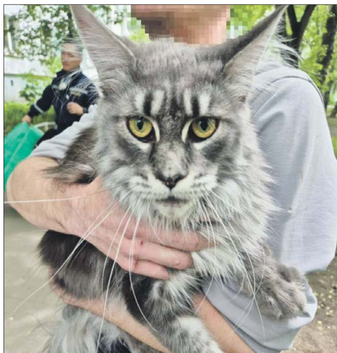
Мейн-кун Виола ещё подросток