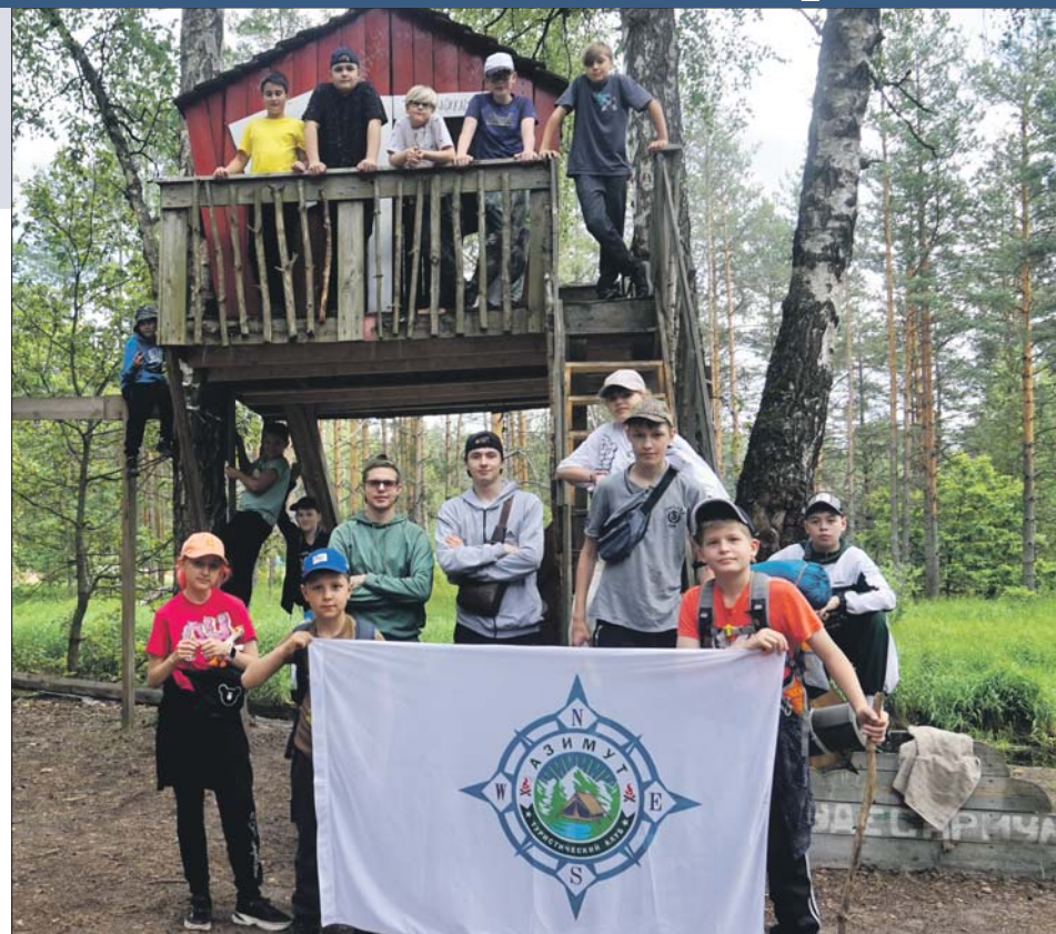
Туристы из клуба «Азимут» в «Чудесариуме»