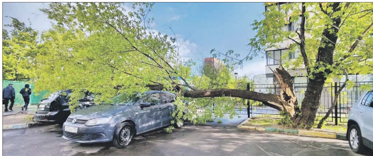
Дерево на Волгоградском проспекте, упавшее во время майского урагана