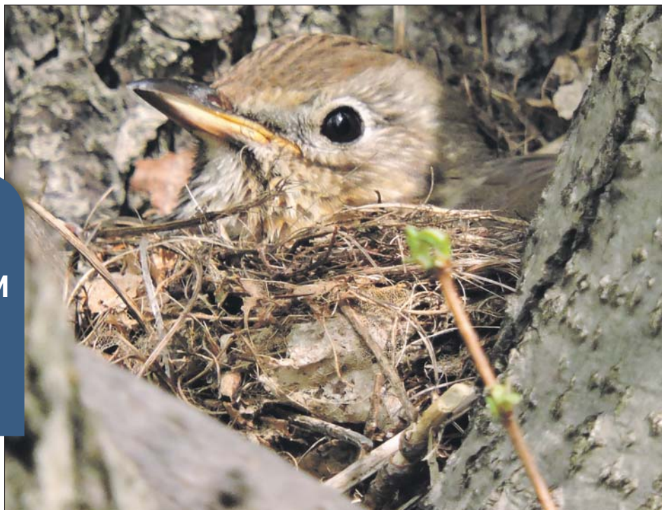
Птенец певчего дрозда в парке «Кузьминки»

Ю ную самку певчего дрозда в гнезде запечатлел в природном парке «Кузьминки-Люблино» фотограф-натуралист Алексей Стефанов. Фотографией он поделился с редакцией.