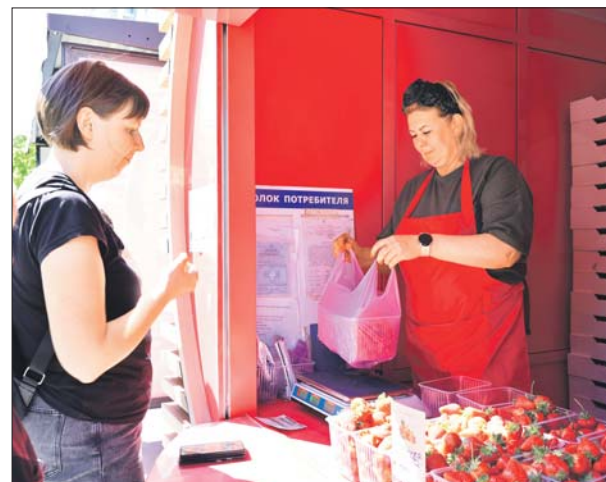
Клубничный ларёк на Новочеркасском бульваре

Адреса ягодных торговых точек в ЮВАО смотрите на нашем сайте: uv-kurier.ru