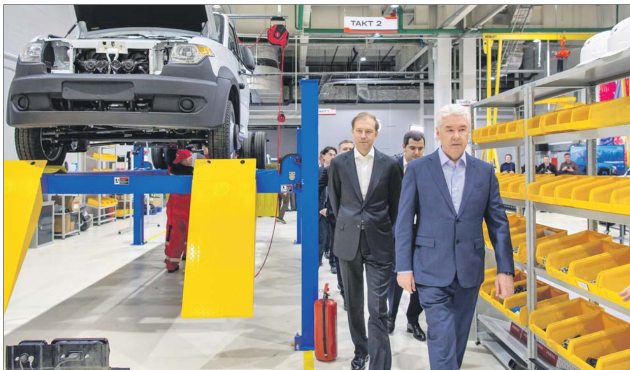
Три новых производства в Печатниках весной прошлого года открыли Сергей Собянин и Денис Мантуров

На площадке ОЭЗ, расположенной на Волгоградском проспекте, инженеры компании «Альтер» разработали многофункционального робота. Он передвигается на гусеницах и может