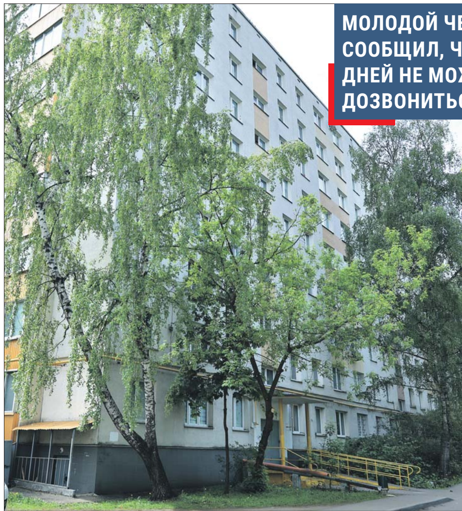
Дом, где произошла трагедия