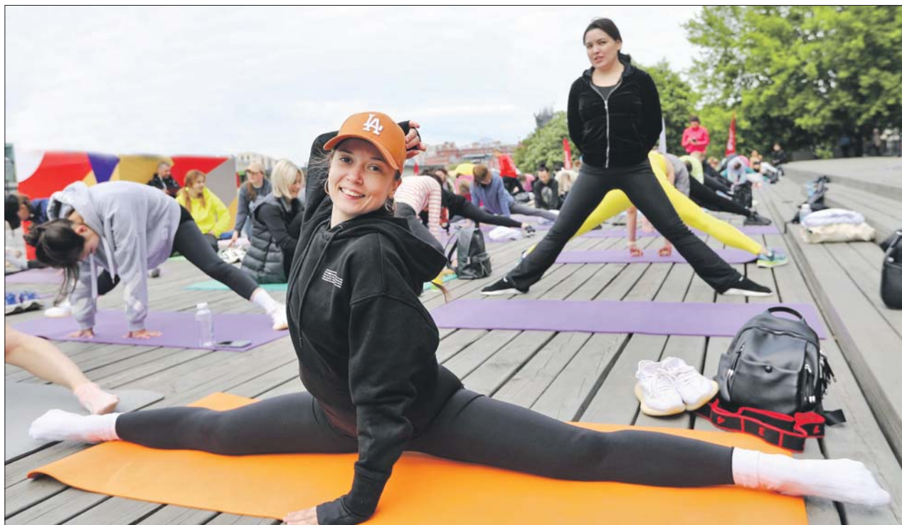
Занятия по стрейчингу

1 июня в 10.00 начнётся мастер-класс по стрейчингу в парке «Печатники» (улица Гурьянова и набережная Москвы-реки), на спортивной площадке в сквере на Перовском шоссе (владение 25-27) и в усадьбе «Люблино» (Летняя ул., 1, стр. 1). В этот же день мастер-класс по силовым видам спорта пройдёт в 10.00 в сквере на улице Артюхиной (напротив дома 8/10) и на Аллее семьи в Марьино (ул. Верхние Поля, 30). Мастер-классы по шахматам проведут в 10.00 в сквере у МЦК «Дубровка» (Шарикоподшипниковская ул., 38) и на площадке