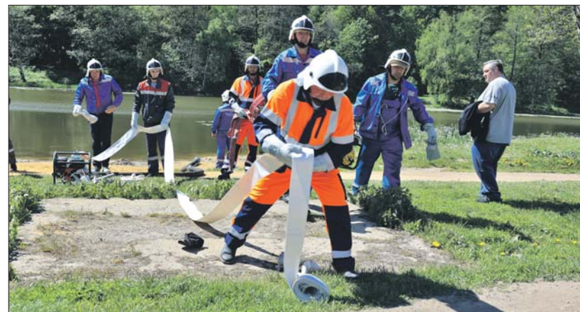
Прокладка магистральной линии