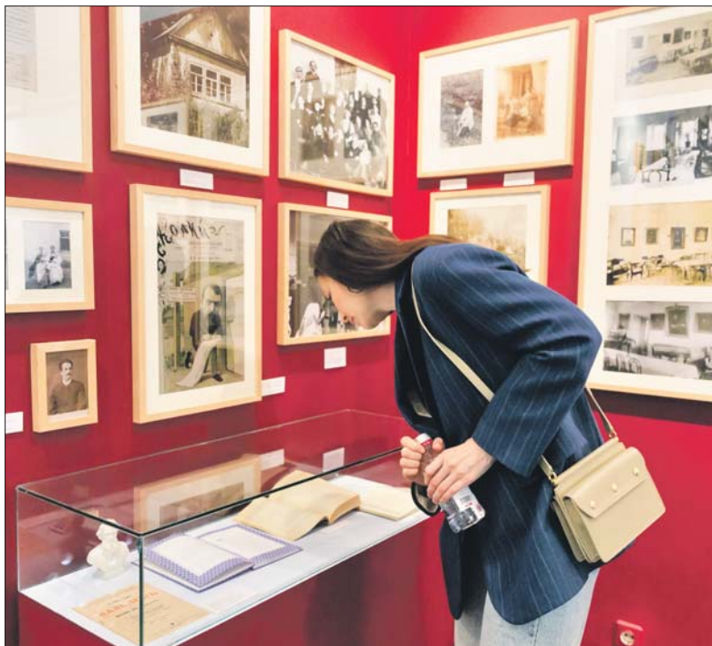
На выставке «Время Надежды»

— Она уехала из России в 60-х годах XIX века, когда девушке было 19 лет. Италия стала второй родиной для Надин, как её называли родные и друзья, но она не теряла связь с Россией: часто приезжала сюда, всю жизнь оставалась православ-