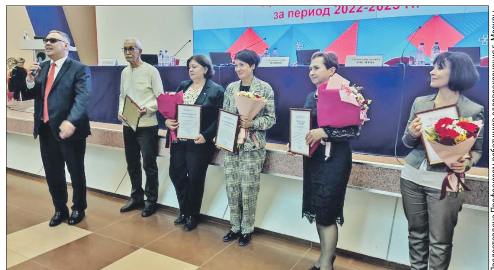
Победители конкурса «Лучший уполномоченный по охране труда профсоюза работников здравоохранения Москвы за период 2022-2023 гг.»