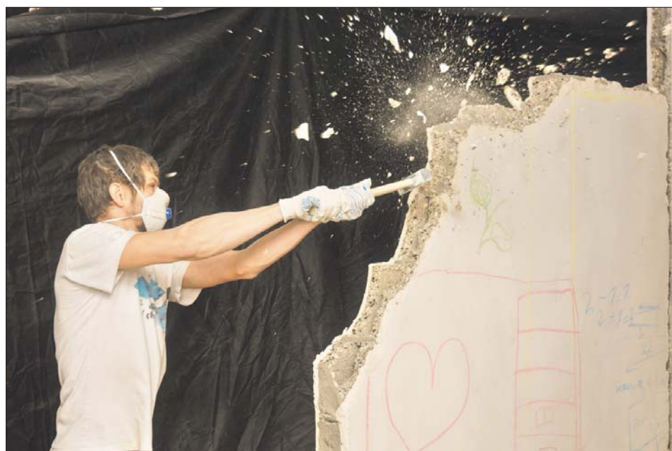
После окончания работ понадобится технический план помещения

— Акт является основанием для внесения изменений в ЕГРН. Обращаться в Росреестр жителю нужно было самому, причём в первые пять дней после получения акта. А для этого требовалось оформить у кадастрового инженера технический план поме-