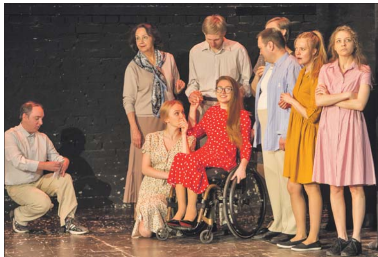
Непрофессиональные артисты на сцене очень органичны

— Я поразился тому, как искренне, эмоционально работают актёры с инвалидностью, не уступая по органике профессионалам, — отметил художественный руководитель Сергей Безруков. — Мы создавали театр, доступный для всех. В Губернском есть услуга тифлокомментирования для незрячих и слабовидящих, субтитры для лю-