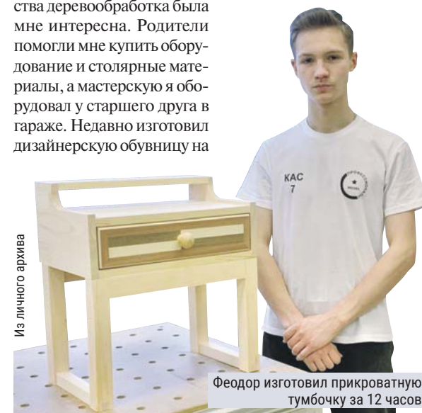
Феодор изготовил прикроватную тумбочку за 12 часов