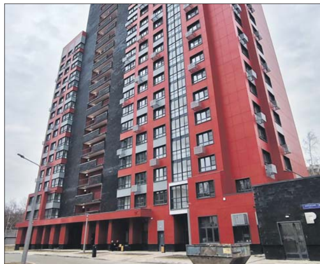
В новом доме 183 квартиры