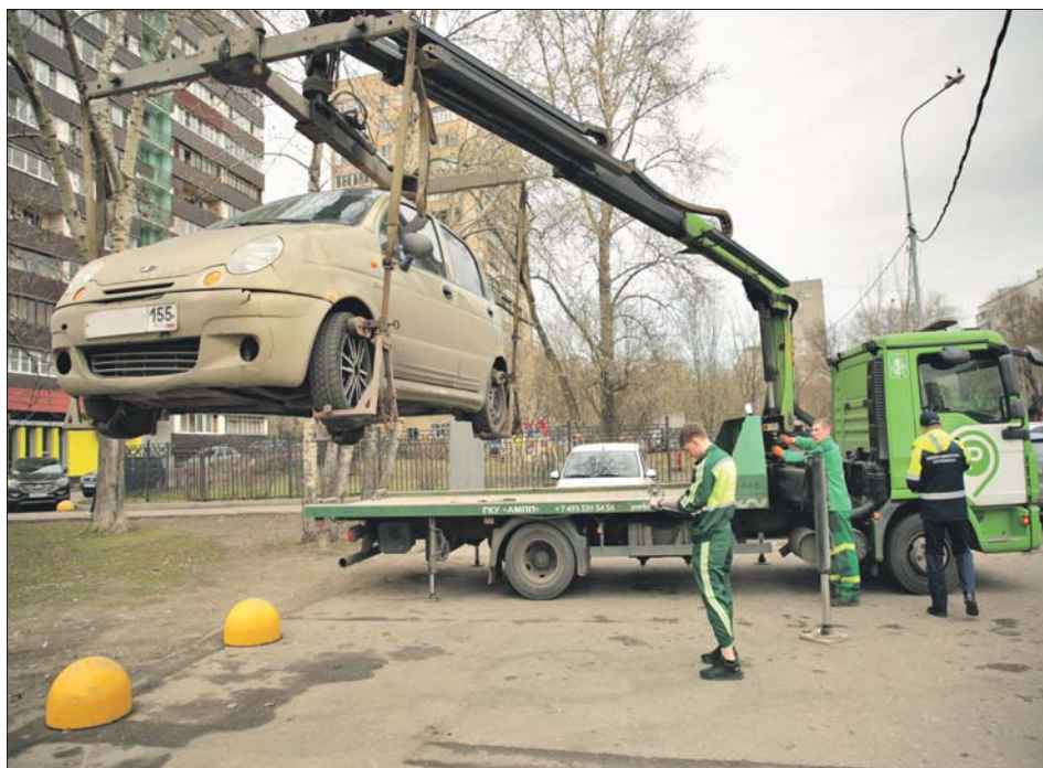
Эвакуация машины в районе Люблино

Оказалось, остановка под «крестом» — самое частое нарушение в округе.