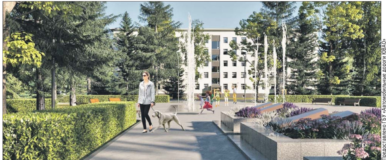
Проект сквера в Лефортове

Появится новое оборудование и на площадке для выгула собак, которая находится в южной части парка. Здесь будут качели, бревно, горка, тоннель, ба-