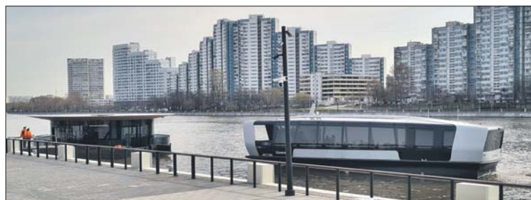
Речной трамвайчик на Южном речном вокзале

«В прошлом году речной транспорт поставил рекорд по числу пассажиров. На круизных теплоходах и прогулочных судах было совершено 2,2 млн поездок — на 22% больше, чем в