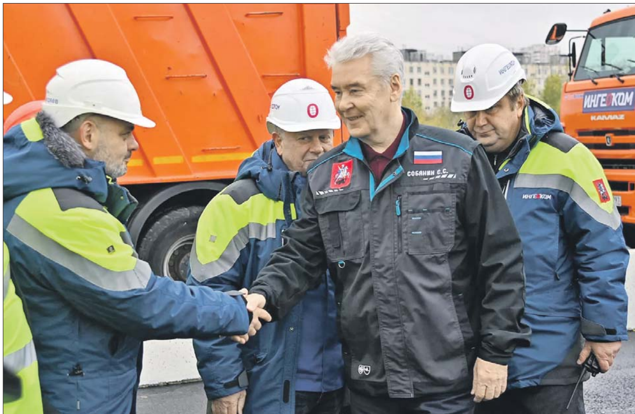
В октябре 2023 года Сергей Собянин открыл эстакаду, связавшую дублёр Люблинской улицы с Московским скоростным диаметром

Один из самых трудоёмких этапов — сооружение будущей связки МСД с Московской кольцевой автодорогой. Её возводят недалеко от пересечения МКАД с улицей Подольских Курсантов. Для проезда по МСД под Кольцом делают прокол. Кроме того, возводят эстакаду, чтобы автомобили могли с внутренней стороны МКАД уйти на диаметр и взять курс в сторону области. Строительство ведётся без остановки движения по Кольцу. Для этого при монтаже эстакады применяют метод надвигки. Части собирают на специальной площадке, затем поднимают и соединяют.