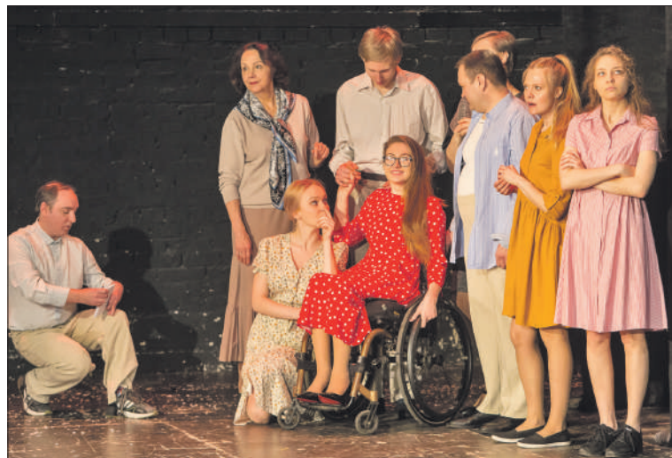
Непрофессиональные артисты на сцене очень органичны

— Я поразился тому, как искренне, эмоционально работают актёры с инвалидностью, не уступая по органике профессионалам, — отметил художественный руководитель Сергей Безруков. — Мы создавали театр, доступный для всех. В Губернском есть услуга тифлокомментирования для незрячих и слабовидящих, субтитры для лю-