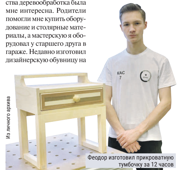
Феодор изготовил прикроватную тумбочку за 12 часов