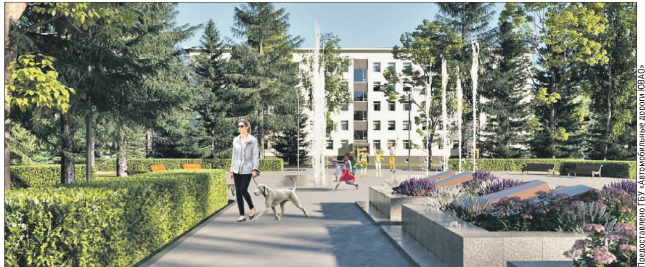
Проект сквера в Лефортове

Появится новое оборудование и на площадке для выгула собак, которая находится в южной части парка. Здесь будут качели, бревно, горка, тоннель, ба-