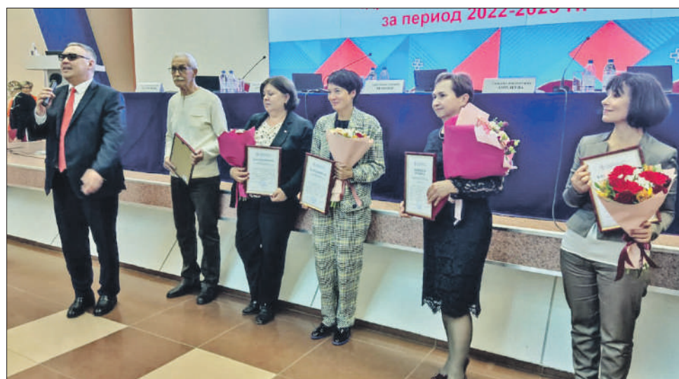
Победители конкурса «Лучший уполномоченный по охране труда профсоюза работников здравоохранения Москвы за период 2022-2023 гг.»