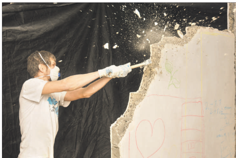
После окончания работ понадобится технический план помещения

— Акт является основанием для внесения изменений в ЕГРН. Обращаться в Росреестр жителю нужно было самому, причём в первые пять дней после получения акта. А для этого требовалось оформить у кадастрового инженера технический план поме-