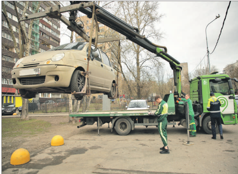
Эвакуация машины в районе Люблино

Оказалось, остановка под «крестом» — самое частое нарушение в округе.