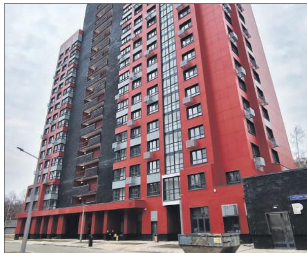
В новом доме 183 квартиры