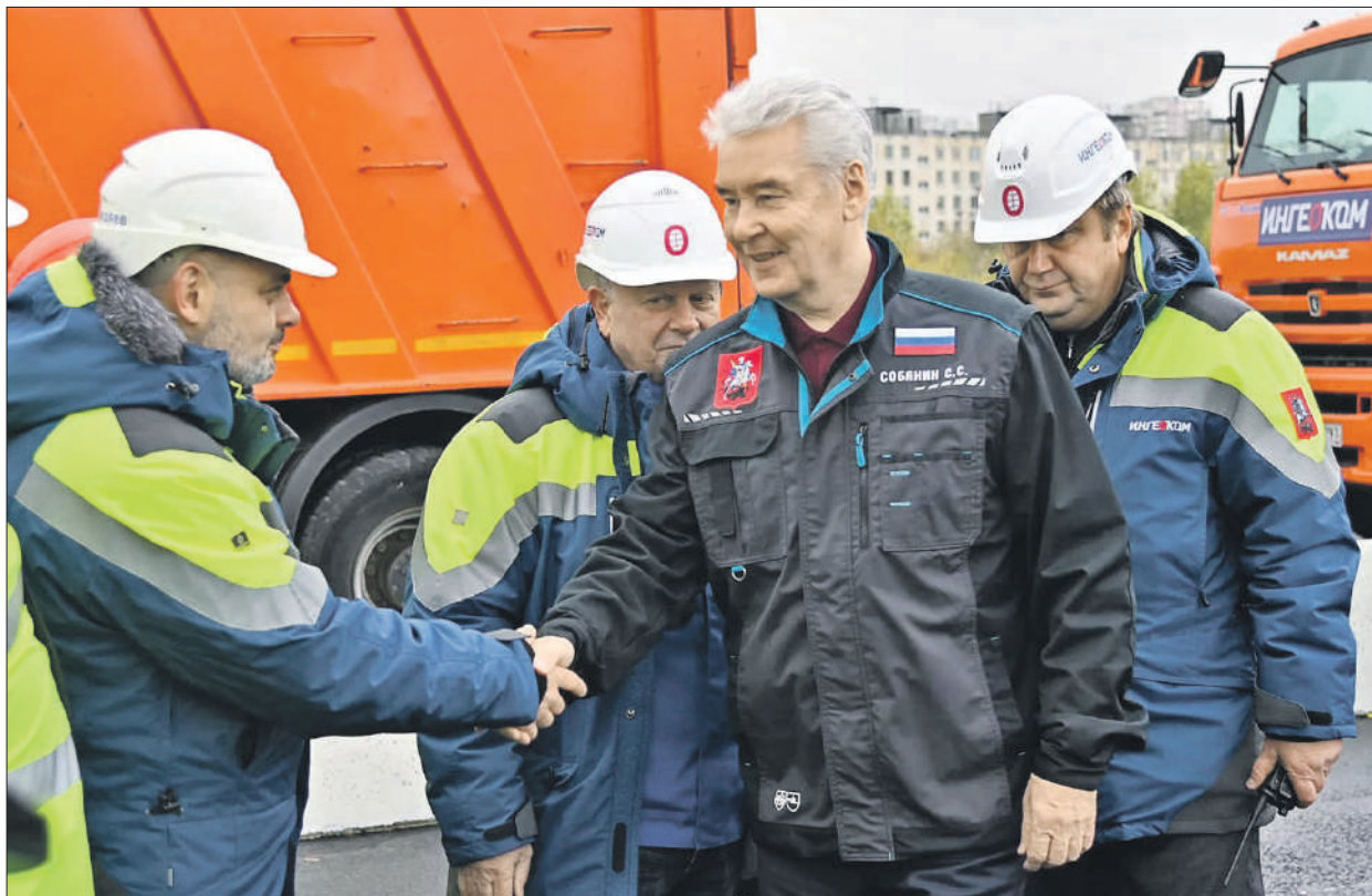
В октябре 2023 года Сергей Собянин открыл эстакаду, связавшую дублёр Люблинской улицы с Московским скоростным диаметром

Один из самых трудоёмких этапов — сооружение будущей связки МСД с Московской кольцевой автодорогой. Её возводят недалеко от пересечения МКАД с улицей Подольских Курсантов. Для проезда по МСД под Кольцом делают прокол. Кроме того, возводят эстакаду, чтобы автомобили могли с внутренней стороны МКАД уйти на диаметр и взять курс в сторону области. Строительство ведётся без остановки движения по Кольцу. Для этого при монтаже эстакады применяют метод надвигки. Части собирают на специальной площадке, затем поднимают и соединяют.