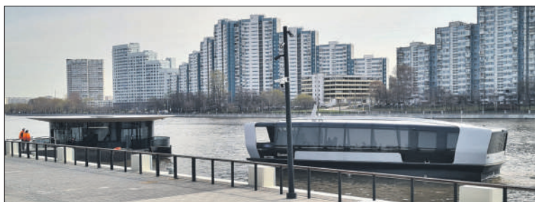
Речной трамвайчик на Южном речном вокзале

«В прошлом году речной транспорт поставил рекорд по числу пассажиров. На круизных теплоходах и прогулочных судах было совершено 2,2 млн поездок — на 22% больше, чем в