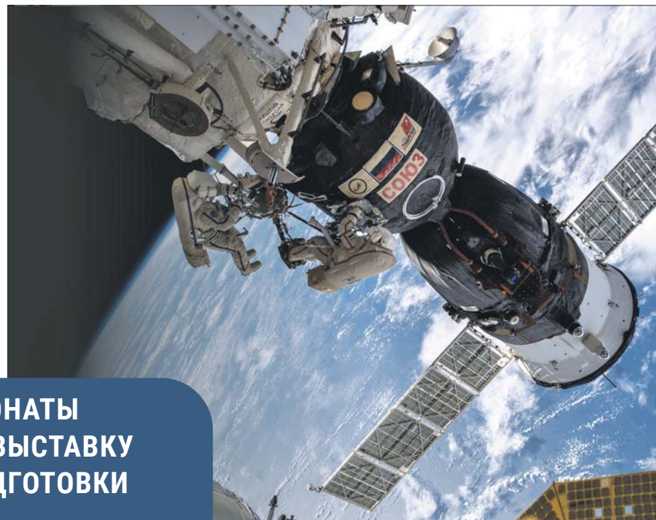
Выход в открытый космос. Фото с выставки «Космос как вызов»

— в центре парка «Кузьминки» — посетители увидят копии архивных документов по подготовке первого космонавта, фотографии истории развития ракетно-космической техники, хронике первого полёта человека в космос. Отдельный блок фотовыставки посвящён послеполётным поездкам Юрия Гагарина по 30 странам.