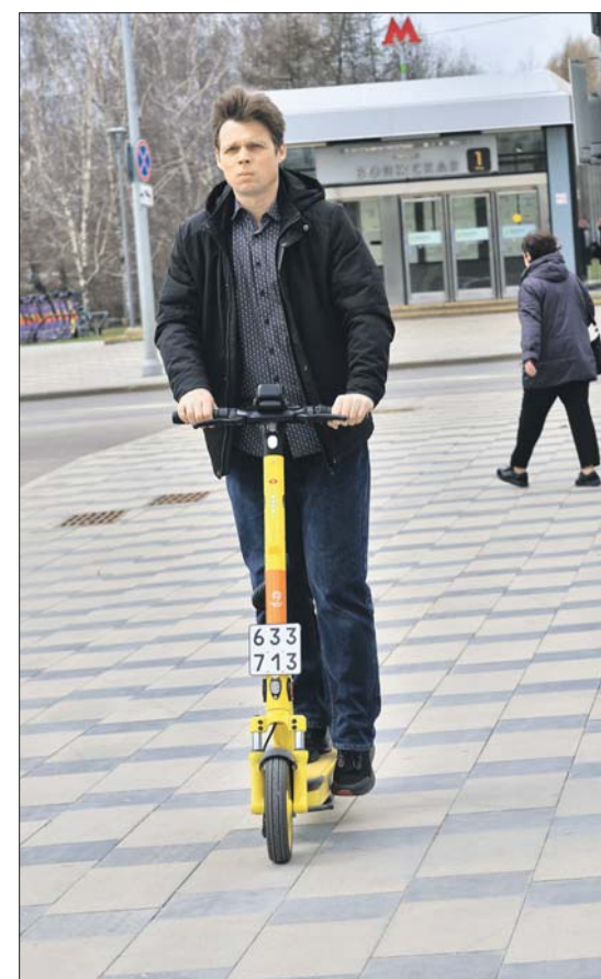
По коду на табличке камера отследит нарушения ПДД