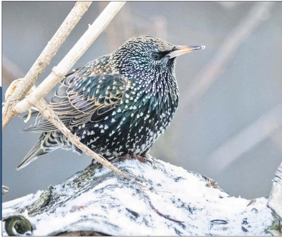
Скворец в Кузьминках

Первых скворцов заметили в природно-историческом парке «Кузьминки-Люблино». Специалисты экоцентра парка рекомендуют всем, у кого во дворах есть скворечники, проверить их, при необходимости почистить.