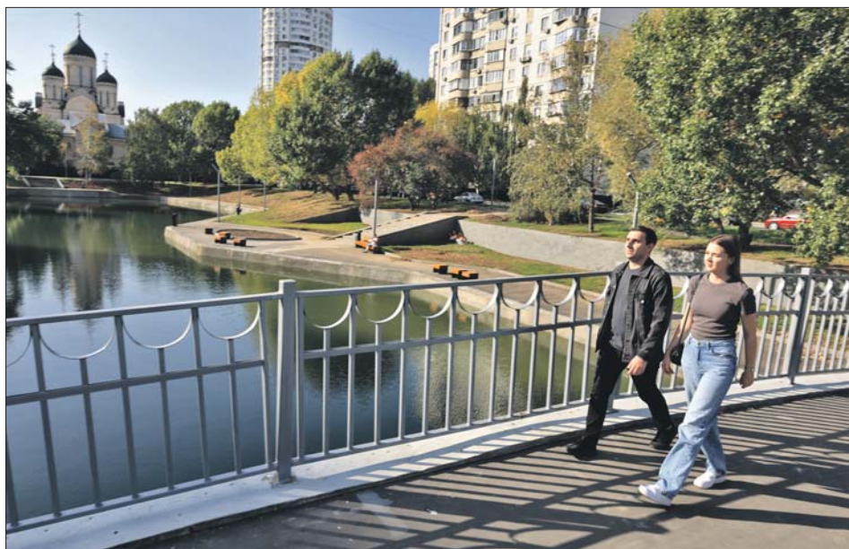
Территорию около марьинских прудов реконструировали

Москву признали самым комфортным местом для жизни в стране