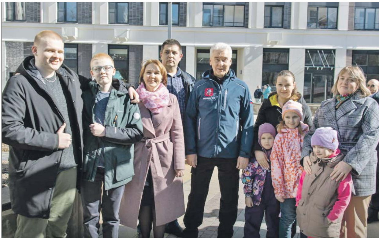
Сергей Собянин с новосёлами дома по реновации на Волгоградском проспекте. Март 2024 года

Рядом с жильём возведут школы, детсады, спорткомплексы