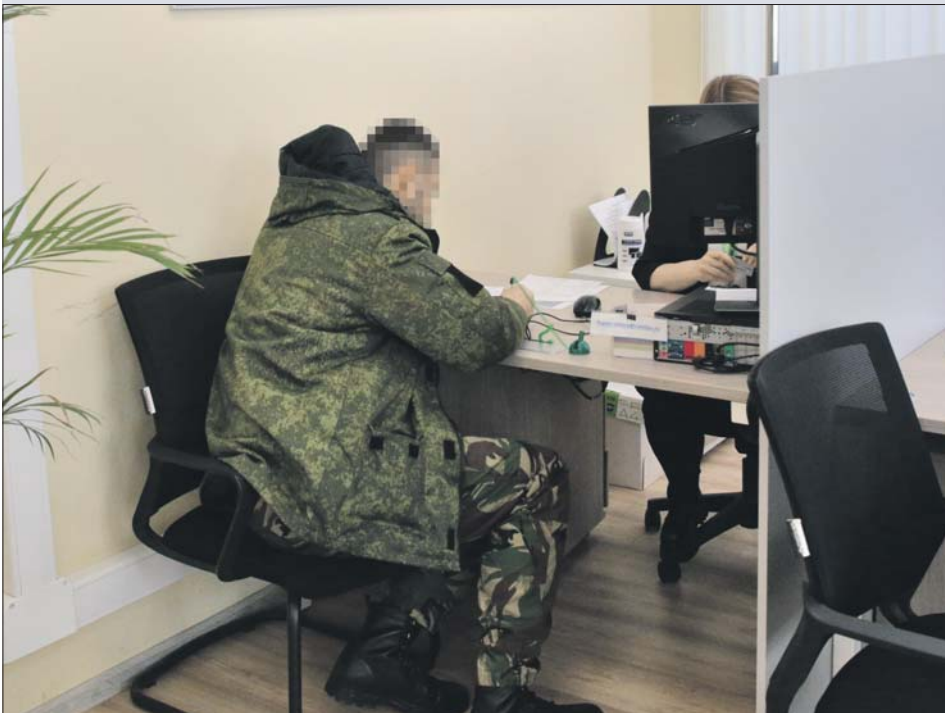
41-летний будущий контрактник в пункте на Яблочкова

На улицу Яблочкова продолжают идти желающие подписать контракт с армией