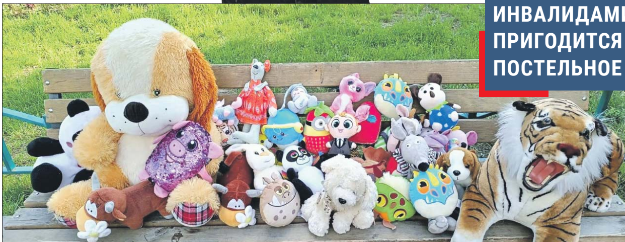
Игрушки надо приносить чистыми