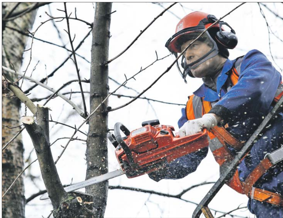
Если надо обрезать ветки высокого дерева, выручает подъёмник

Как в ЮВАО регулируют сезонное цветение и пыление тополей