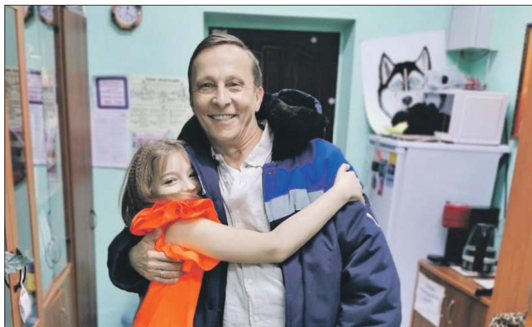
Маша с Иваном Охлобыстиным