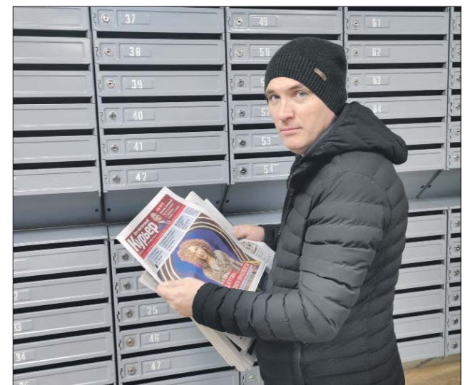
При такой подработке можно самому регулировать свой график