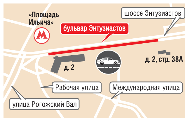
— ограничение движения

Проезд ограничивают от дома 2 на бульваре Энтузи-