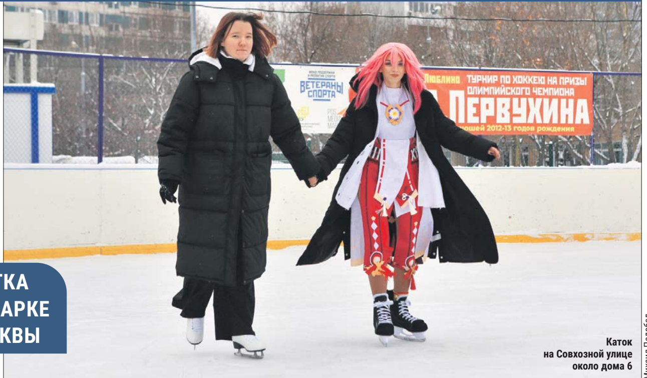
Каток на Совхозной улице около дома 6