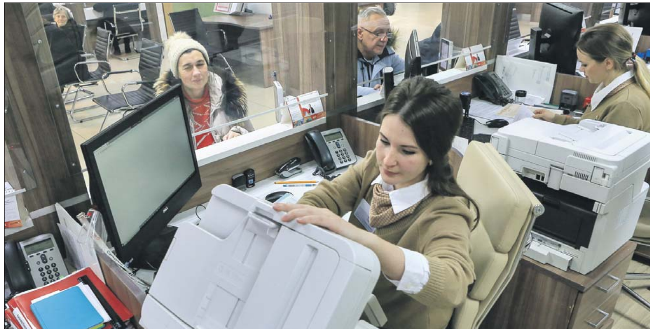
Корреспондент «ЮВК» в центре госуслуг в Лефортове

Я беру дипломы журфака и о втором режиссёрском об-