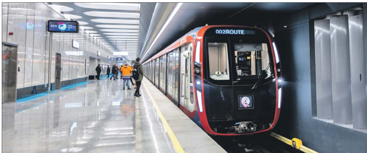
Станция БКЛ «Текстильщики». Транспортная инфраструктура Москвы будет развиваться

ВСЕ ОТРАСЛИ ГОРОДСКОЙ ЭКОНОМИКИ ПОКАЗЫВАЮТ СТАБИЛЬНЫЙ РОСТ