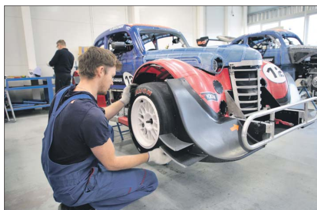
Гоночный автомобиль, стилизованный под ретро-модель

Минувшим летом болид впервые участвовал в гонках в Подмоскowie. Пока, правда, вне зачёта — такое условие поставили организаторы.