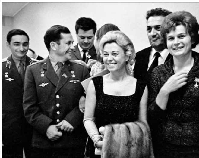
Среди новинок Мультимедиа Арт Музея — снимок Джульетты Мазины и Федерико Феллини с советскими космонавтами

В Музей К.Г.Паустовского поступил архив писателя 1940-1960-х годов. Государственный музей А.С.Пушкина получил в дар от мецената Михаила Карисалова картину немецкого художника Карла Шульца «Казачий разезд» и 14 работ русских мастеров первой четверти XIX — начала XX века. Карисалов также передал городу редчайшие образцы «гротической» скульптуры — «Дантист (Цирюльник)» и «Скупой муж». Новый экспонат появился и в Доме Н.В.Гоголя — шкатулка Марии Александровны Быковой (урождённой Пушкиной).