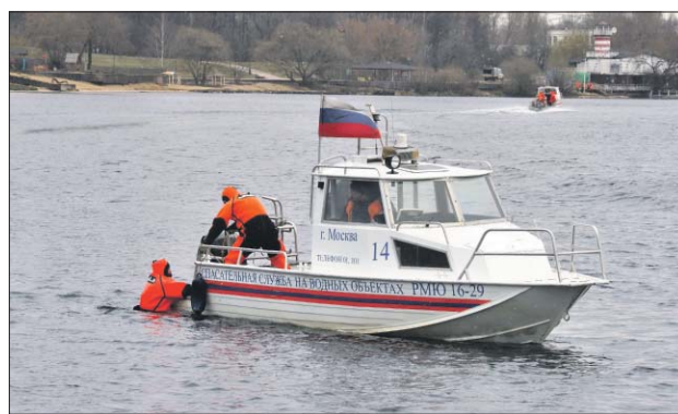
Спасатели демонстрируют журналистам свои навыки

К работе на льду готовы манёвренные лодки на воздушной подушке и аэролодки. В арсенале спасателей также есть автомобили повышенной проходимости. Каждый мобильный пост оснащён оборудованием для помощи пострадавшим. По словам Владимира Волкова, ежедневно более 70 человек патрулируют водоёмы и берего-