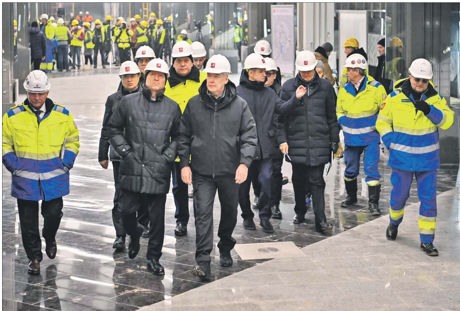
Сергей Собянин во время осмотра строящейся станции «Тютчевская»

Строящаяся Троицкая линия метро станет одним из самых протяжённых радиусов столичной подземки — 43 км. На линии будет 17 станций, она пройдёт от станции «ЗИЛ» МЦК до Троицка. Сейчас ведётся строительство первой очереди — участков Троицкой линии от станции «ЗИЛ» до станции «Коммунарка» общей протяжённостью 26 км с 11 станциями: «ЗИЛ», «Крымская», «Академическая», «Вавиловская», «Новаторская», «Университет дружбы