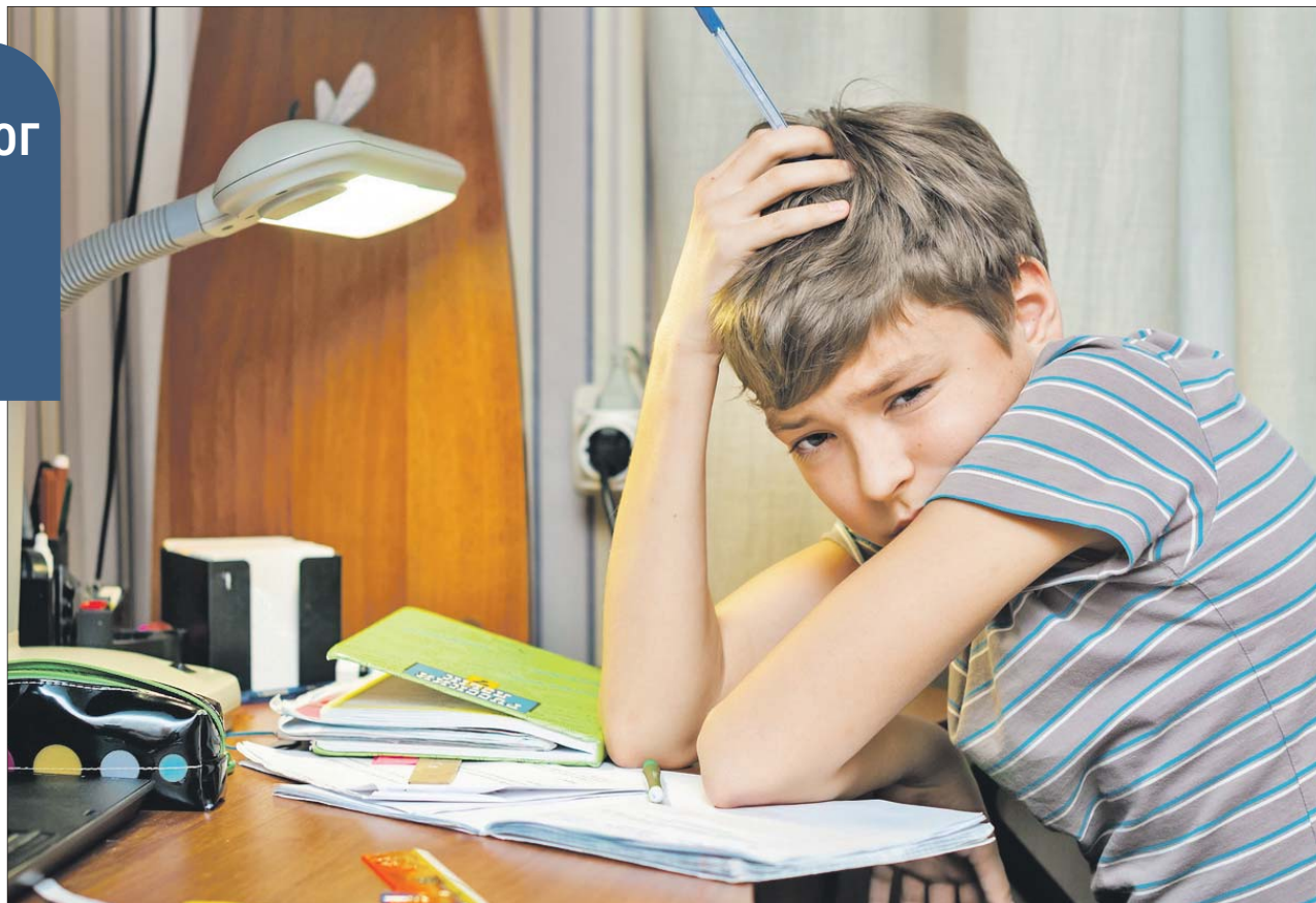
Вопрос, как поставить себя в коллективе, подростка волнует больше, чем школьные предметы

Не готовы сменить школу — заинтересуйте этими предметами сами, покупайте дополнительную литературу, организуйте экскурсии в тематические места.