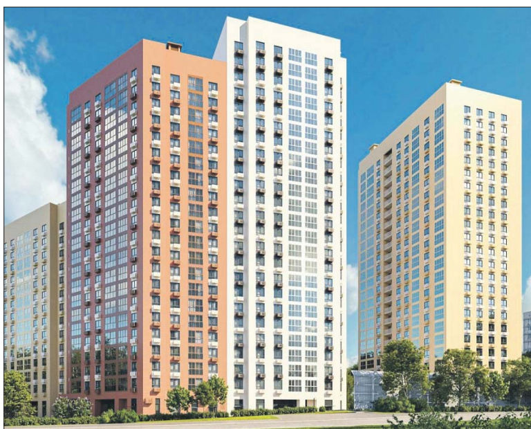
Здание будет состоять из двух строений переменной этажности