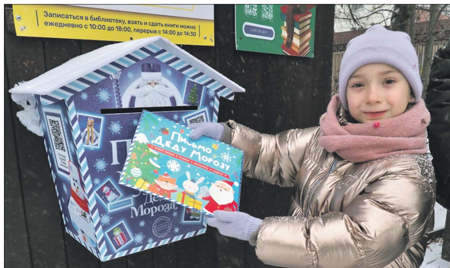
Почтовый ящик в парке «Кузьминки»