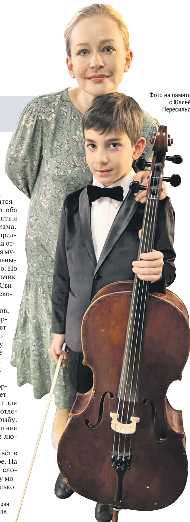
Фото на память с Юлией Пересильд

креплены к Свято-Димитриевской православной общеобразовательной школе и находятся на домашнем обучении. В старших классах перейдут на очное обучение. Учатся по проверенным временем учебникам, которые зарекомендовали себя ещё в конце советского периода. Мама знает три