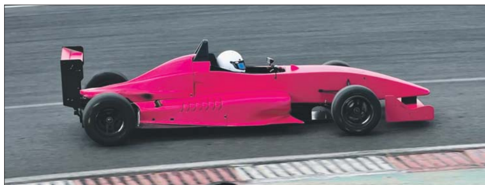
Гоночный болид на трассе

— Мы испытывали болид на трассе в Мячкове. В целом двигатель показал себя достойно. Появлялись, конечно, недочёты, но мелкие. Мы их быстро устраняли, — рассказывает Владислав Фомин.