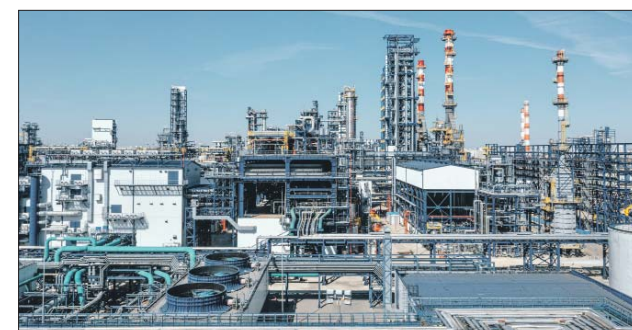
Установка гидроочистки дизельного топлива на МНПЗ

Эксперт МНПЗ также советует: не нужно ждать наступления сильных морозов — как только ночные температуры достигают неболь-