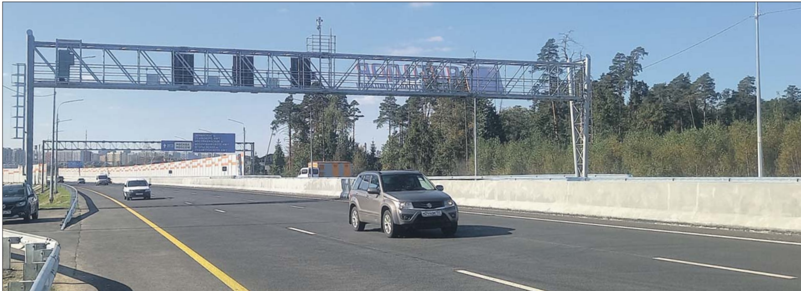
Новая магистраль начинается за мостом через реку Пехорку

Корреспондент «ЮВК» протестировал новую скоростную магистраль «Восток»