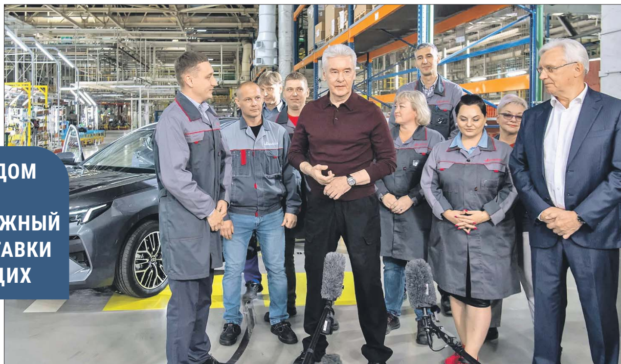
Сергей Собянин открыл производство новой модели «Москвича». 4 сентября 2023 года

Однако производство нужно расширять. И не только за счёт увеличения числа выпускаемых автомобилей. Необходимы новые модели, ведь сейчас на заводе налажена сборка только одного типа машин — кроссовера «Москвич-3». Статус промышленного комплекса в этом поможет.