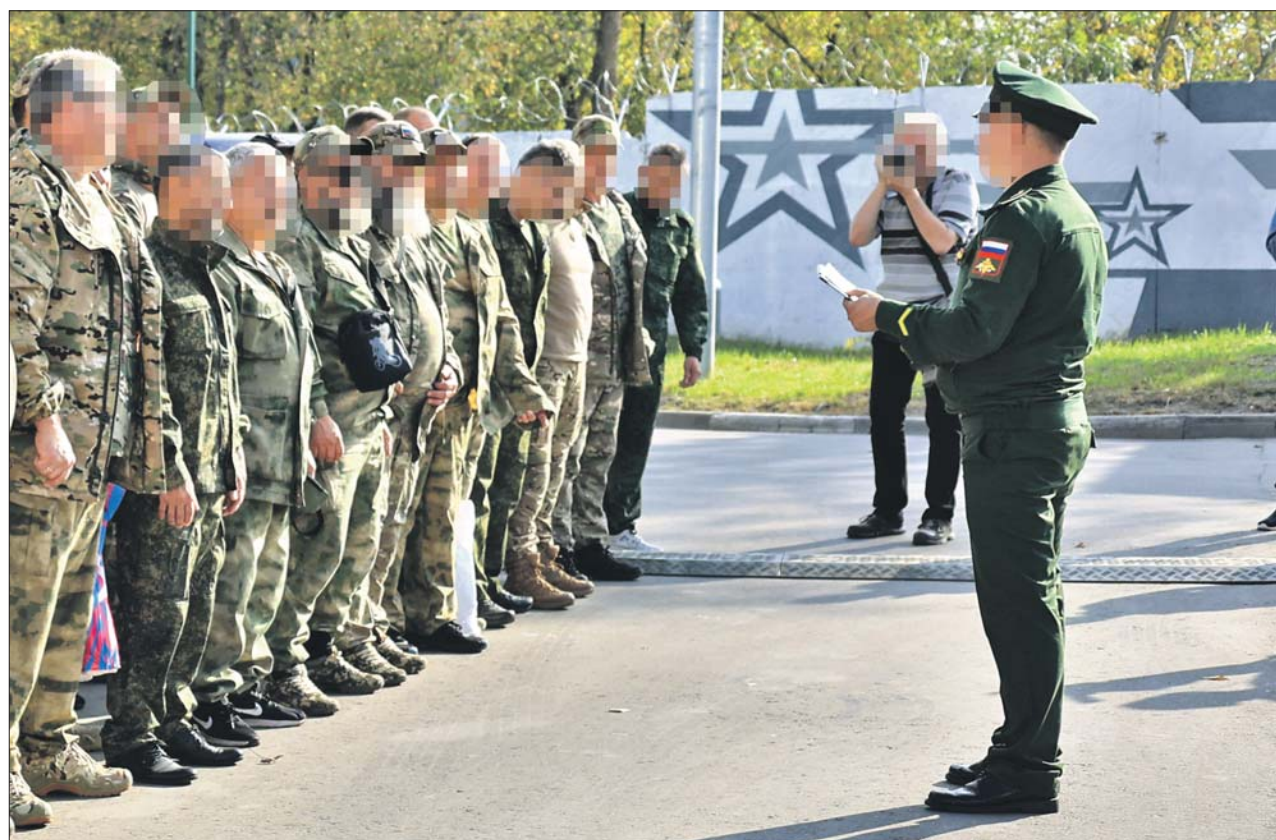
Будущие контрактники перед отправкой в части