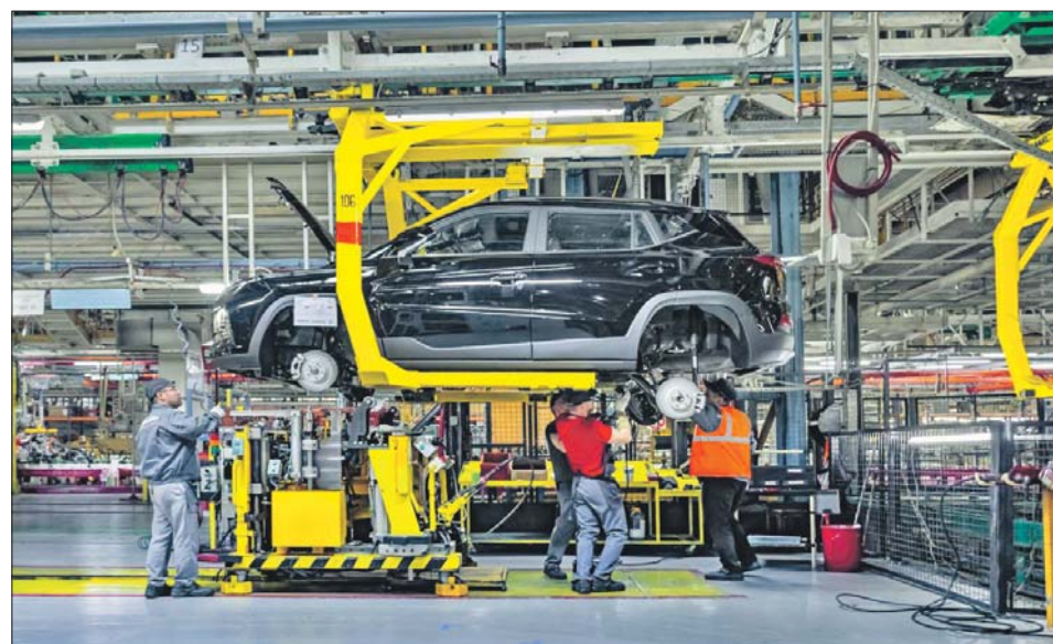
На заводском конвейере

По словам Сергея Собянина, в следующем году завод должен приступить к выпуску ещё двух моделей — «Москвич-5» и «Москвич-8». Характеристики машин пока не разглашаются. Однако, скорее всего, это тоже будут кроссоверы. Мировые автопроизводители уже давно увеличивают выпуск машин такого типа, потому что они одинаково хорошо подходят и для поездок по городу, и для длительных автопутешествий.