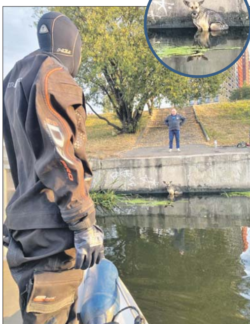
Собака испугалась мотора и опять прыгнула в воду