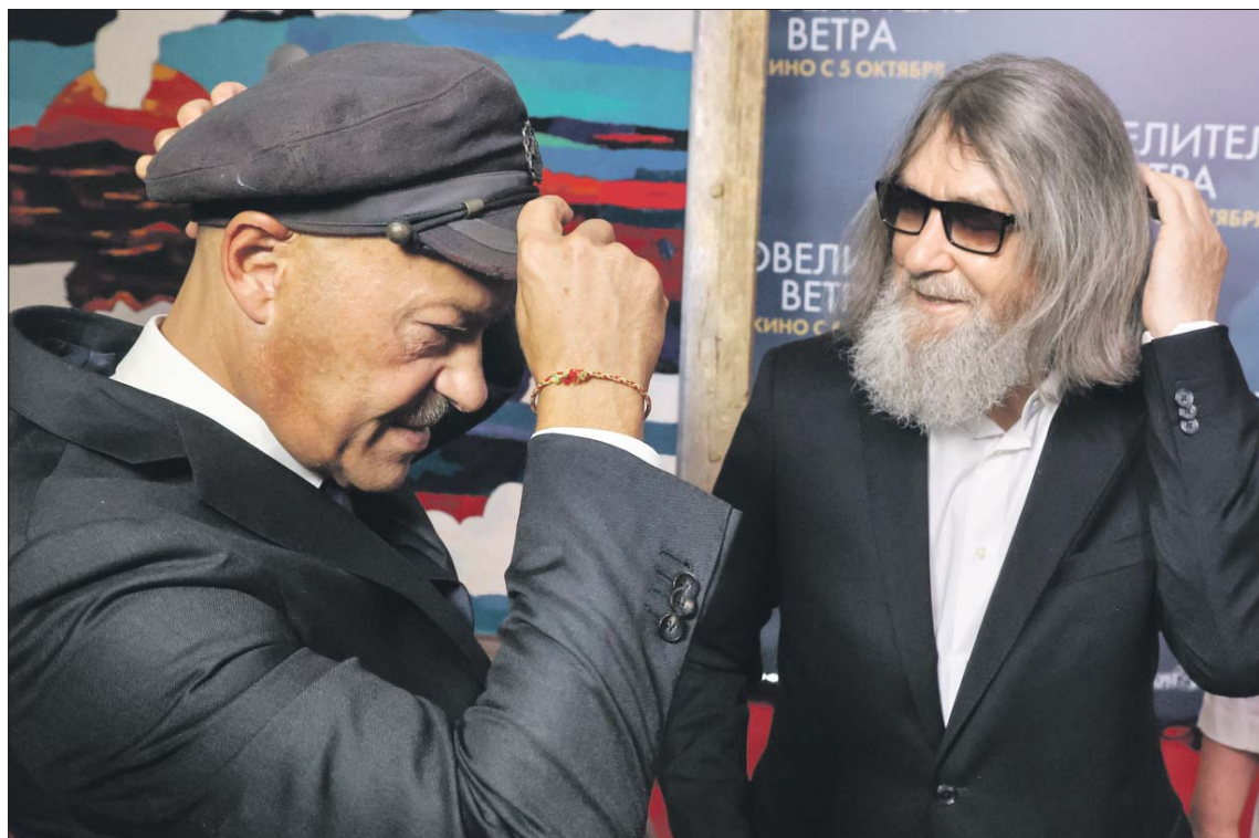
Фёдор Бондарчук и Фёдор Конюхов на презентации картины «Повелитель ветра»

— Я благодарен Фёдору Сергеевичу и всему коллективу, что они сняли такой сложный фильм. Помню, как Фёдор, с которым мы давно дружим, пришёл и сказал, что его вдохновляет мой полёт на воздушном шаре, и он хочет попытаться снять об этом фильм. Когда мы сидели и разговаривали о том, кто будет играть меня, я сказал,