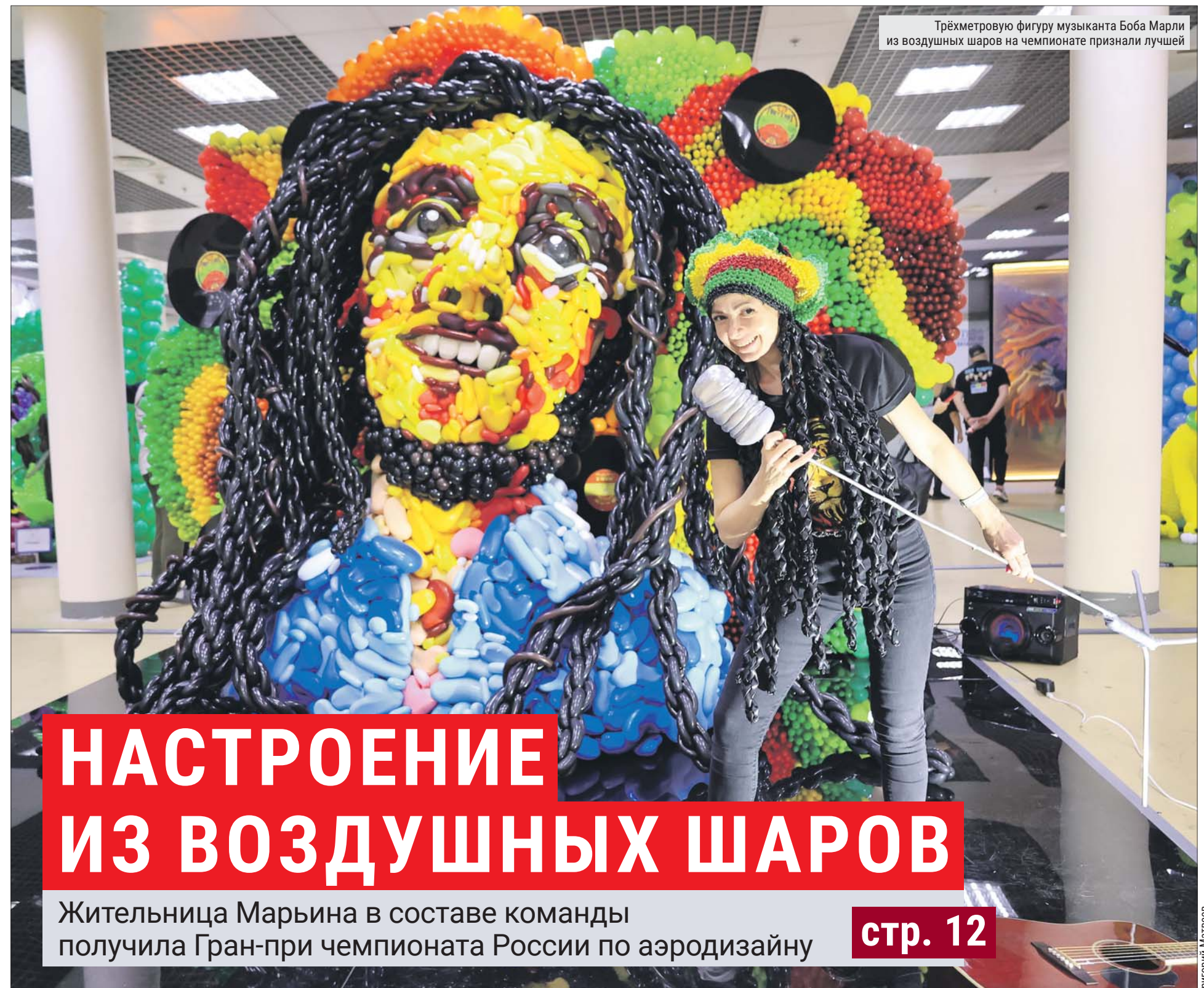
Трёхметровую фигуру музыканта Боба Марли из воздушных шаров на чемпионате признали лучшей