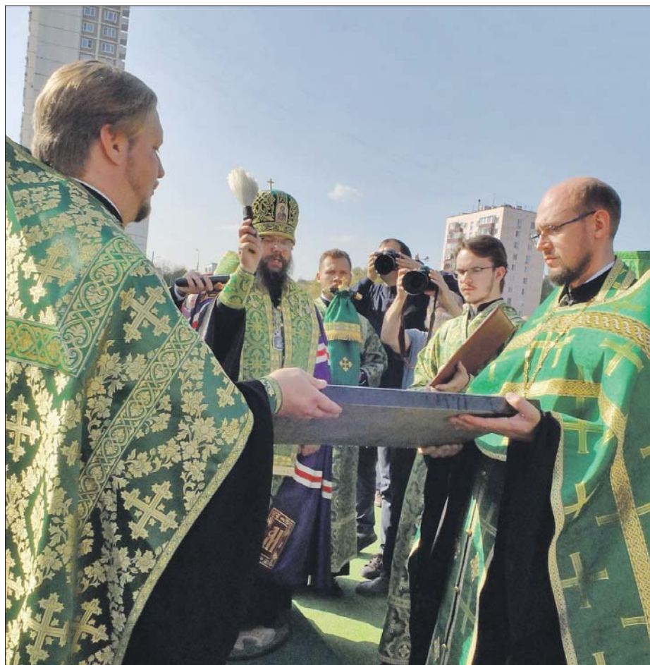
На Ферганской улице архиепископ Егорьевский Матфей освятил закладной камень