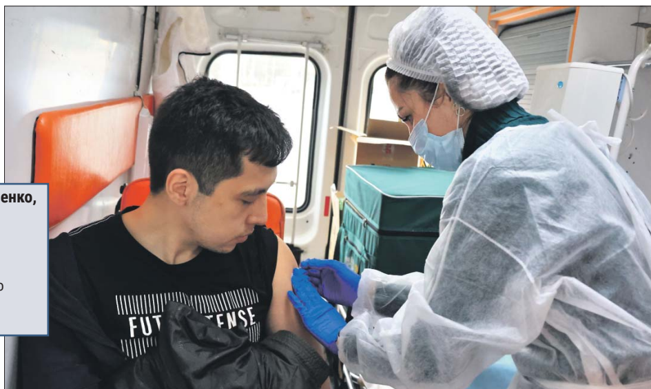
В мобильном пункте вакцинации