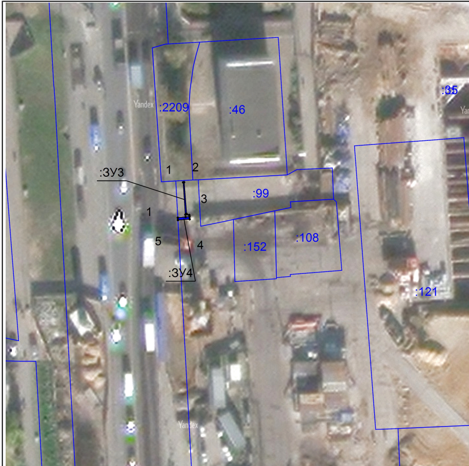
Каталог координат поворотных точек (система координат - Московская)