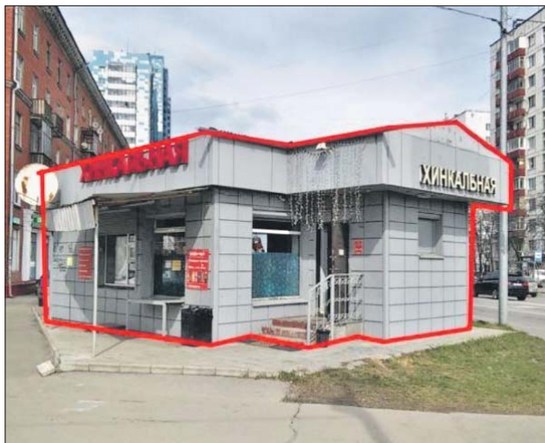
Здание, которое снесли