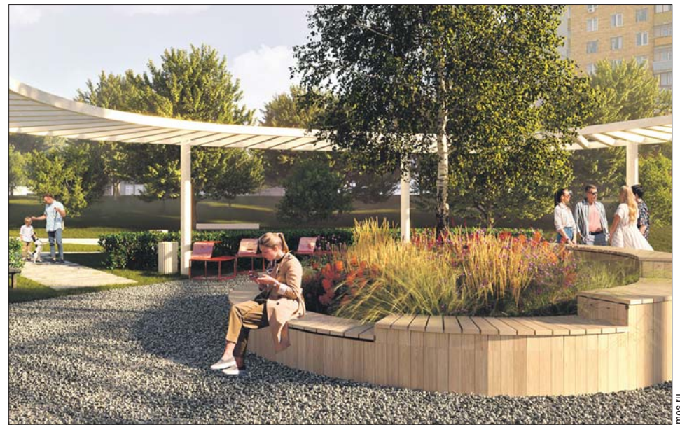
Проект планируют реализовать в этом году