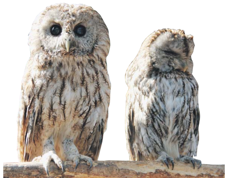
С Рязанского проспекта сову отправили в реабилитационный центр