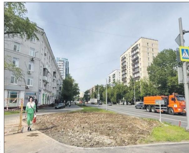
На месте кафе появится газон