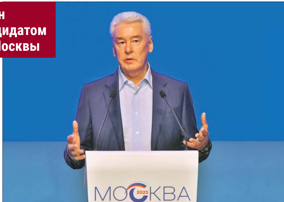
9 июня. Выступление на конференции Московского городского регионального отделения «Единой России»

Как отметил в своём выступлении на конференции Сергей Собянин, он признателен партии за многолетнюю поддержку проектов развития столицы. А