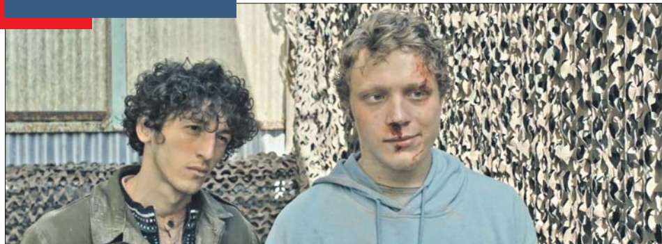
Кадр из сериала «Спасти единственного сына»

По словам Валерия Степанова, играть с Анной Ардовой было одно удовольствие, а вот с Алексеем Серебряковым был снят всего один кадр, поэтому осо-