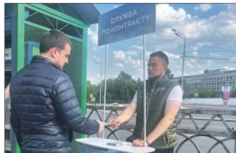
Информационная точка у платформы Выхино