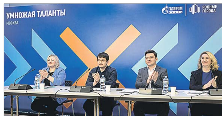
В этом году в состав жюри конкурса вошли инженеры и технологи МНПЗ

«Мы не только активно обновляем производственное оборудование, но и создаём высокотехнологичные рабочие места для химиков, технологов,