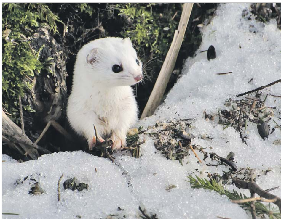
Ласка в парке «Кузьминки-Люблино»

П одведены итоги зимнего маршрутного учёта зверей по следам на природных территориях парка «Кузьминки-Люблино». Маршруты проходили в отдалённых частях парка, сравнительно мало посещаемых людьми. Строчки свежих отпечатков лап животных считали после снегопада.