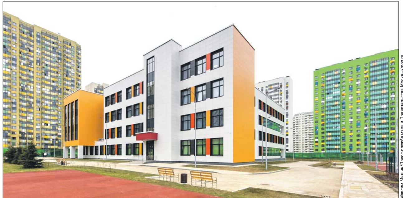
Новый корпус построен по самым современным стандартам

Помимо стандартных учебных классов с комплектами ноутбуков и планшетов, в распоряжении ребят и педагогов есть специализированный IT-полигон для знакомства с компьютерным оборудованием и программным обеспечением, а также кабинеты 3D-моделирования и робототехники.