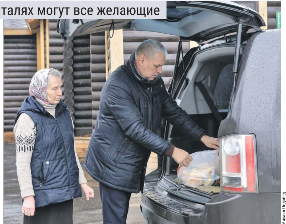
Представитель ветеранов Преображенского полка с собранной помощью для госпиталя им. Бурденко

Команда волонтеров ветеранов готова принять в свои ряды творческих людей, умеющих прочесть стихи, спеть военные и бардовские песни, сыграть на гитаре. Свой номер можно записать, и его покажут пациентам на планшете, а можно по согласованию с добровольцем присоединиться к одному из визитов в госпиталь.