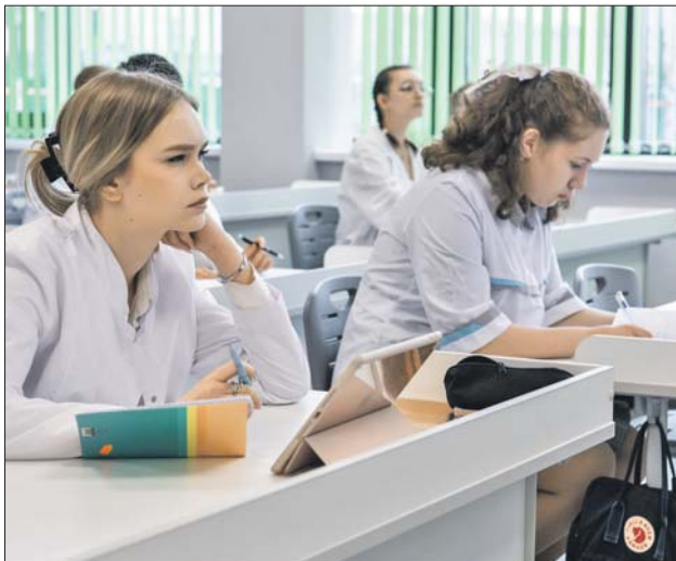
Занятия в школе уже идут

В четырёхэтажном корпусе занимаются более 500 учеников