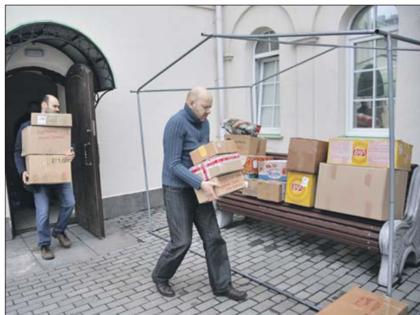
Волонтеры выносят коробки для загрузки в машину

Госпитали прифронтовых зон нуждаются в кос-