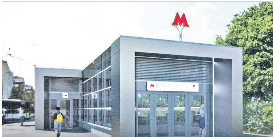
Через новый вестибюль можно будет выйти к улицам Красноказарменной и Авиамоторной

Они свяжут станцию БКЛ с радиальной линией