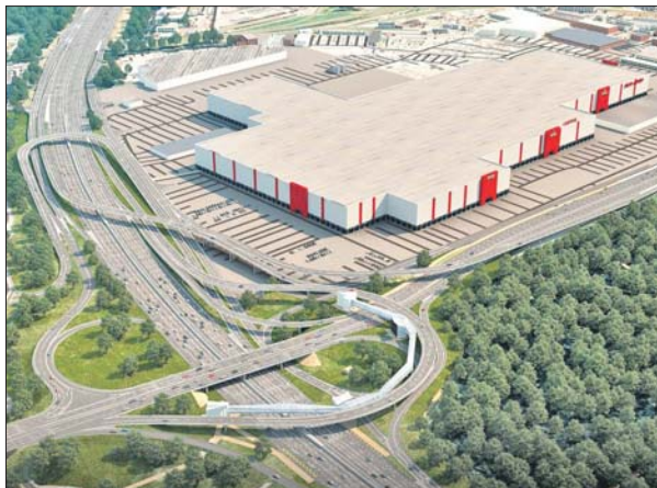
Новая развязка обеспечит прямой пропуск транспорта с Южной рокады в сторону Новогорьевского и Новорязанского шоссе

«Также появится комфортный подъезд к торговым комплексам «Садовод» и «Мега», у которых трафик больше 150 тысяч человек в день», — отметил мэр.