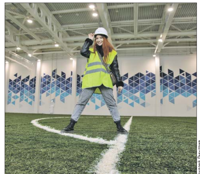
На мини-футбольное поле уложен искусственный газон