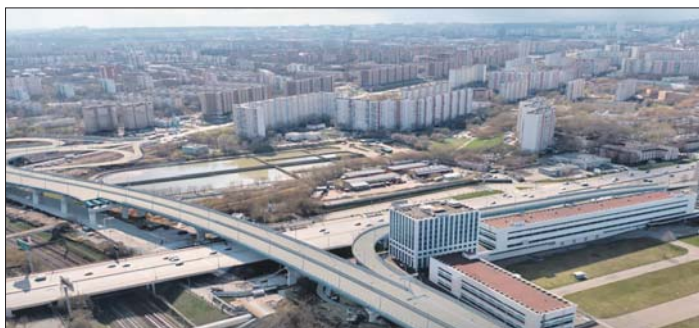
Мост свяжет юго-восток и юг города

«После полного завершения работ движение транспорта будет организовано в четырёх уровнях: МЦД-2, Каширское шоссе, основной ход МСД и направленные эстакады со съездами», — отметил Собянин.