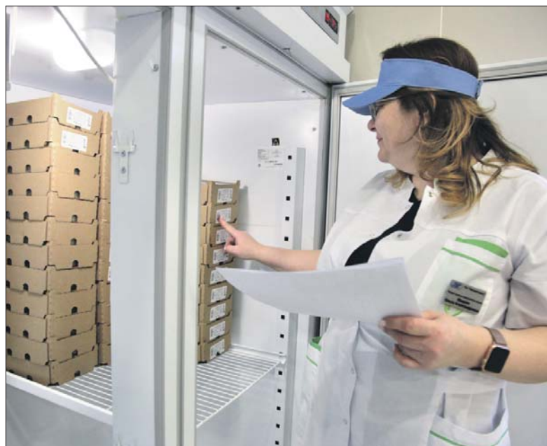
Молочно-раздаточный пункт на улице Гурьянова