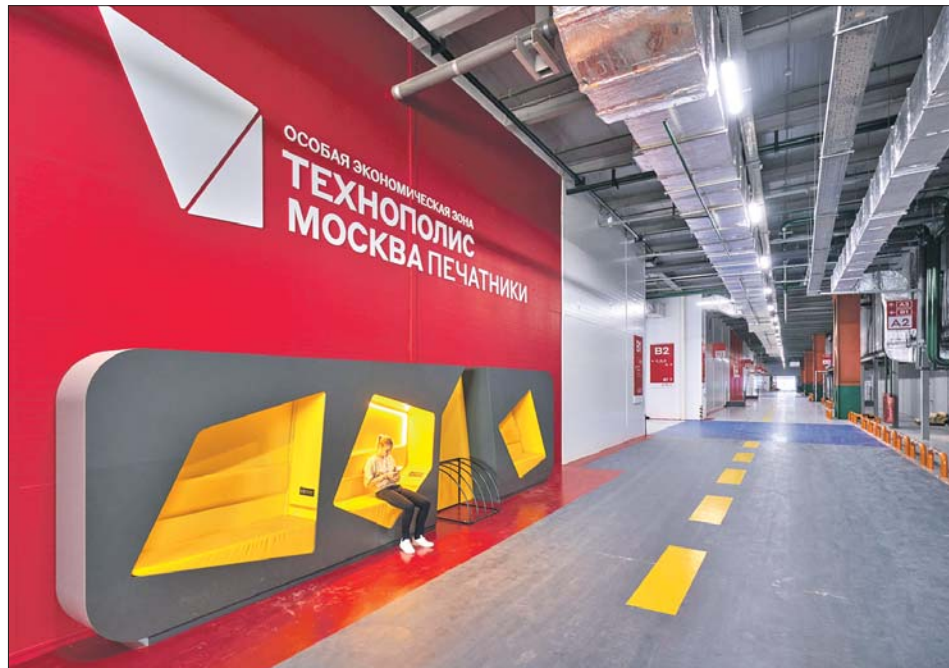
В технополисе «Москва» в 2022 году разработали десятки изобретений

Прежде всего это переносной рентгеновский аппарат. С его помощью врачи могут проводить обследование на месте происшествия или прямо на дому у пациента.