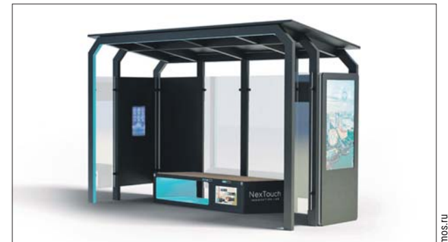
В конструкцию умной остановки встроено электронное оборудование