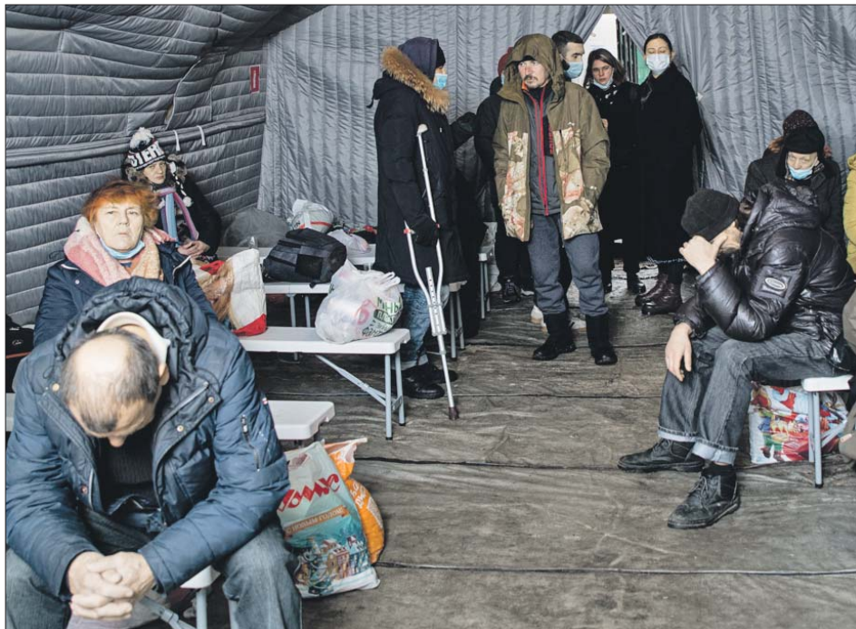
Пункт обогрева на Иловайской улице

Спасти замерзающего на улице человека может любой прохожий