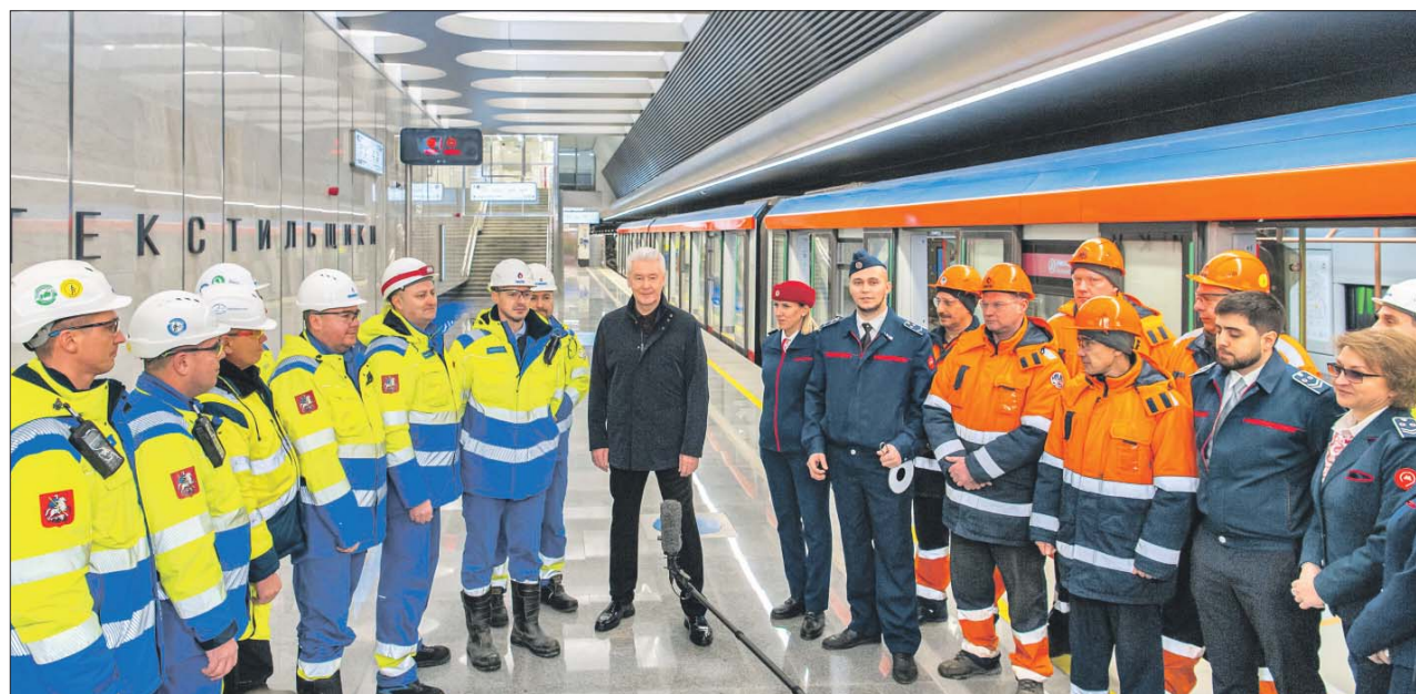
Сергей Собянин во время технического пуска поезда на станции БКЛ «Текстильщики»