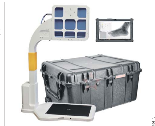
Портативный рентгеновский аппарат