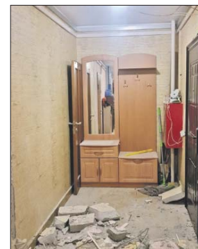
Общий холл перед квартирой