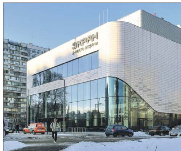
Типовой проект разработан в бюро британского архитектора Аманды Ливит