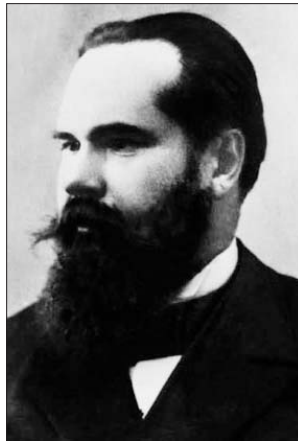
Фотопортрет Танеева. 1880-е годы