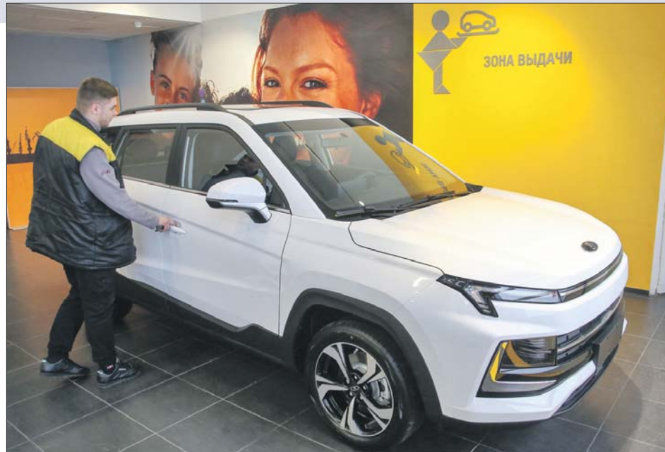
В этом году на заводе «Москвич» планируют собрать около 50 тысяч машин

— Каршеринг является рекламой возможностей китайского автопрома. Во время поездки пользовате-