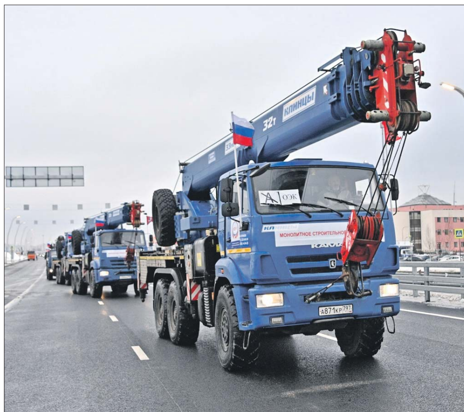
Участок новой автомобильной трассы в Некрасовке

Построенный участок расположен в ЮВАО. Он будет особенно удобен жителям Некрасовки. Фактически вокруг этого района появилась своя «кольцевая» трасса, а в будущем, когда построят оставшиеся отрезки, люди смогут выезжать в центр Москвы,