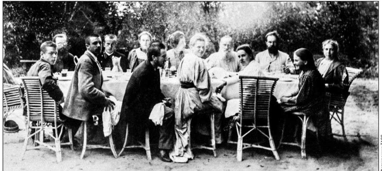
Лев Толстой в кругу семьи и гостей, среди которых композитор Сергей Танеев (рядом с писателем). 1895 год

Никогда не брал Танеев и гонорар за выступления на