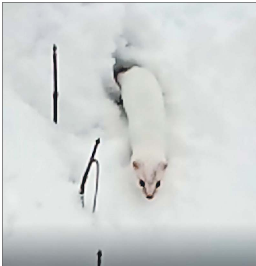
Заметить в зимнем лесу белую ласку непросто