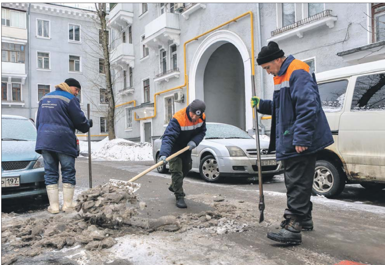
Уборка льда на 1-м Саратовском проезде

Коммунальщики округа до сих пор устраняют последствия аномальных снегопадов