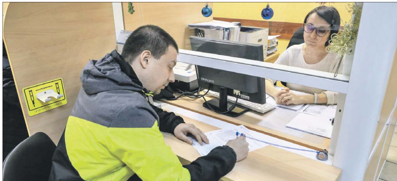
Клиентская служба СФР на Окской улице