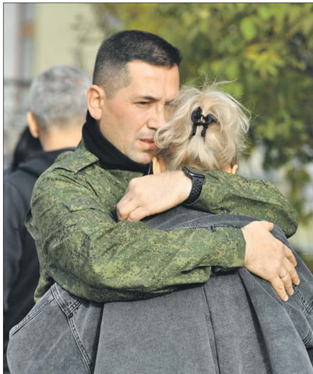
Провожающие надеются на скорую встречу с близкими

— Мама молилась за него святителю Николаю. Я поставил эту маленькую иконку в алтарь храма, где служу. Сейчас по благословению Патриарха в церквях ежедневно молятся о наших воинах, — говорит священник. — Матерям и жёнам я советую прежде всего воспринимать ситуацию спокойно и чаще обращаться со словами молитвы к святителю Николаю, Георгию Победоносцу, воину-мученику Андрею