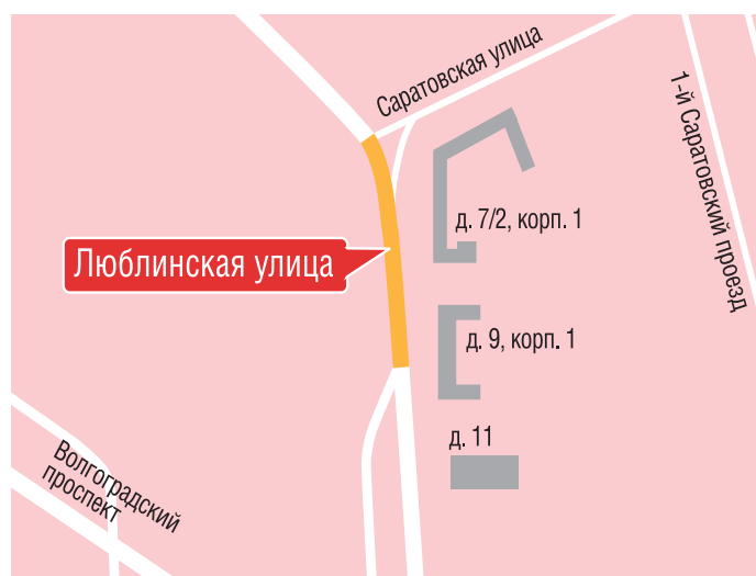
— ограничение движения