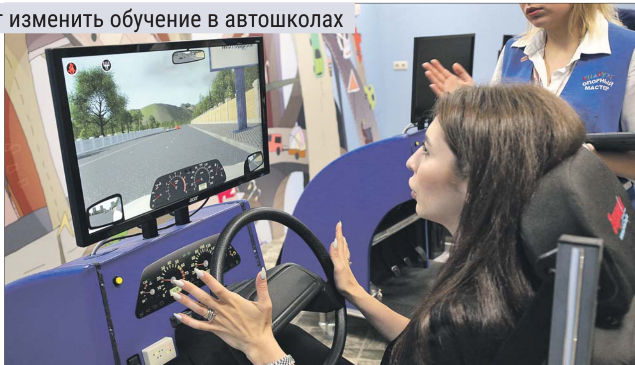
Планируется, что при зачислении в автошколу ученикам предложат пройти психологический тест, чтобы выяснить, не агрессивен ли будущий водитель