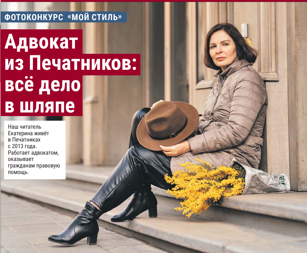
Из личного архива