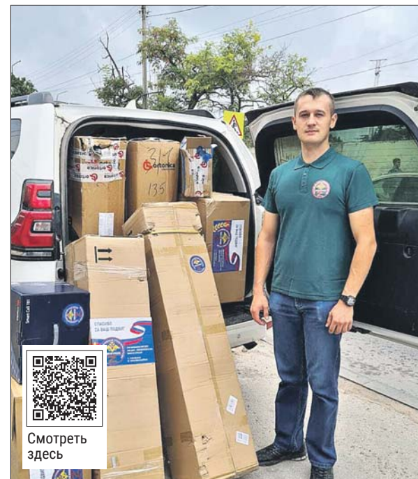
На пожертвования приобретаются лекарства и медицинское оборудование