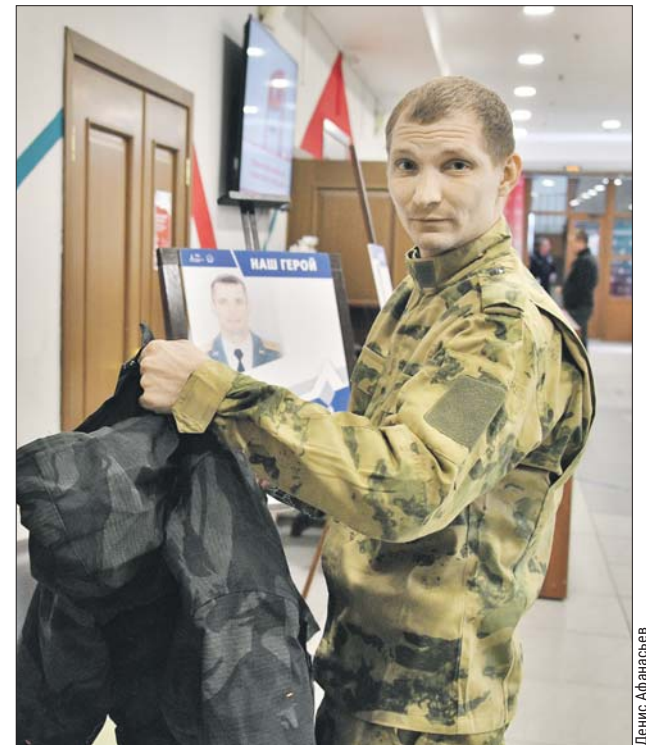
31-летний Александр очень доволен полученной экипировкой