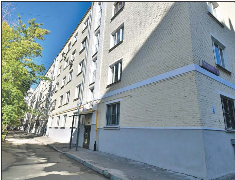
Зданию на шоссе Энтузиастов, 206, без малого 100 лет

Во время капитального ремонта пятиэтажки спе-