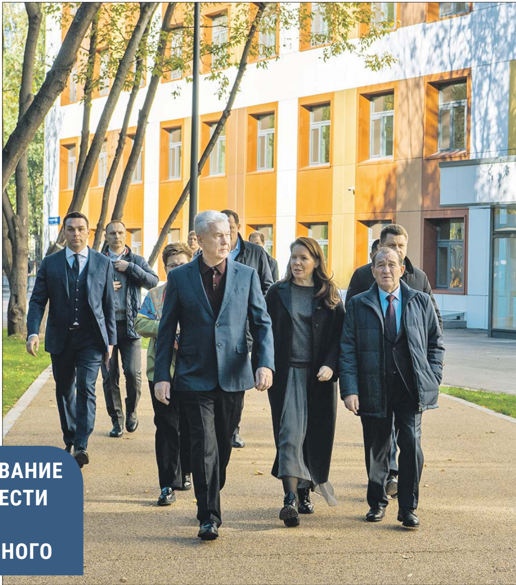
Сергей Собянин во время посещения дома сестринского ухода «Даниловский»

— Дом сестринского ухода «Даниловский» будет обслуживать жителей шести районов Москвы силами выездных бригад и в стационарном режиме. Созданы все современные условия. С февраля начнётся приём пациентов, сейчас завершаются работы, — сказал Сергей Собянин.