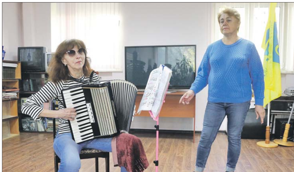
В Обществе слепых ЮВАО рождается собственный вокальный коллектив. Уже идут первые репетиции

Холодильник, который верой и правдой служил обществу 20 лет и повисел на одном из стоек. Приобрести