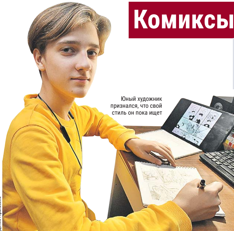
Юный художник признался, что свой стиль он пока ищет

Восьмиклассник из Кузьминок прошёл отбор в престижную Школу научного комикса на ВДНХ