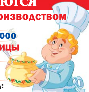
График работы 5/2.