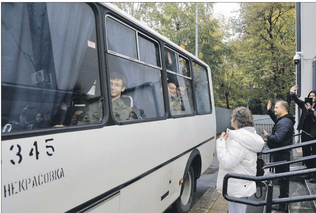
Провожжающие машут вслед

«Я ИЗ СЕМЬИ ВОЕННЫХ. ДОЛГ ДЛЯ МЕНЯ НЕ ПУСТОЙ ЗВУК»