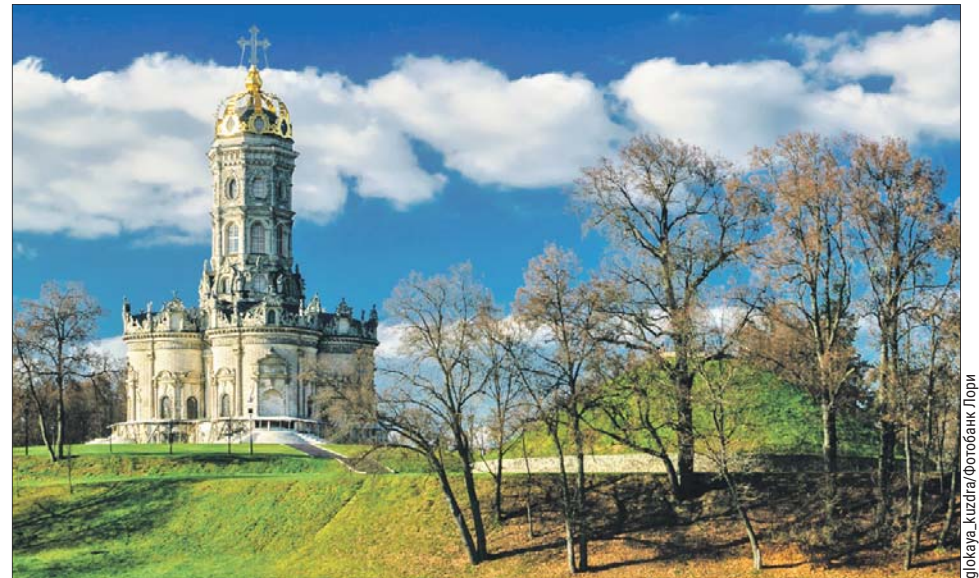
Храм Знамения Пресвятой Богородицы

За всё время своего существования усадьба меняла множество владельцев. Среди них были и Голицыны, и Долгоруковы, и даже фаворит Екатерины II