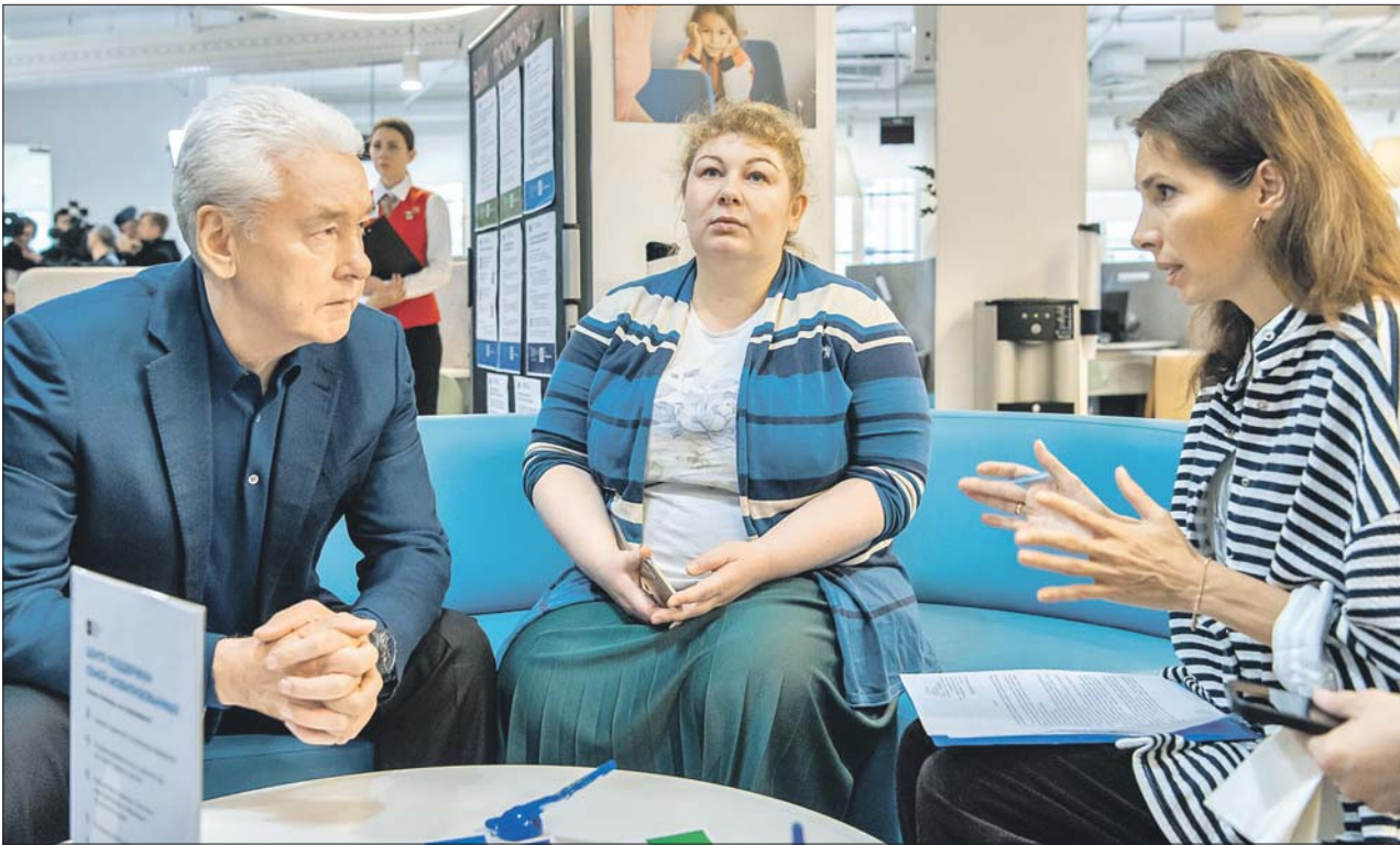
Сергей Собянин посетил городской центр поддержки семей мобилизованных

Открылся центр, где можно получить материальную, юридическую и психологическую помощь