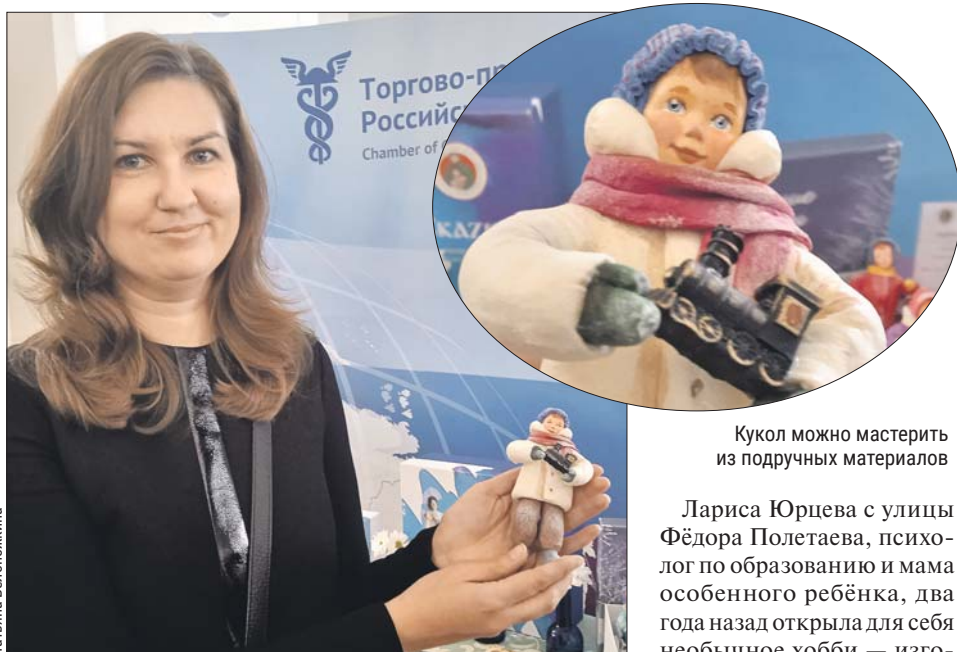
Кукол можно мастерить из подручных материалов

Хотя съёмки в полнометражном фильме у Степана были впервые, кинематографический опыт у него уже имелся. До этого он снимался в короткометражках и рекламных роликах.