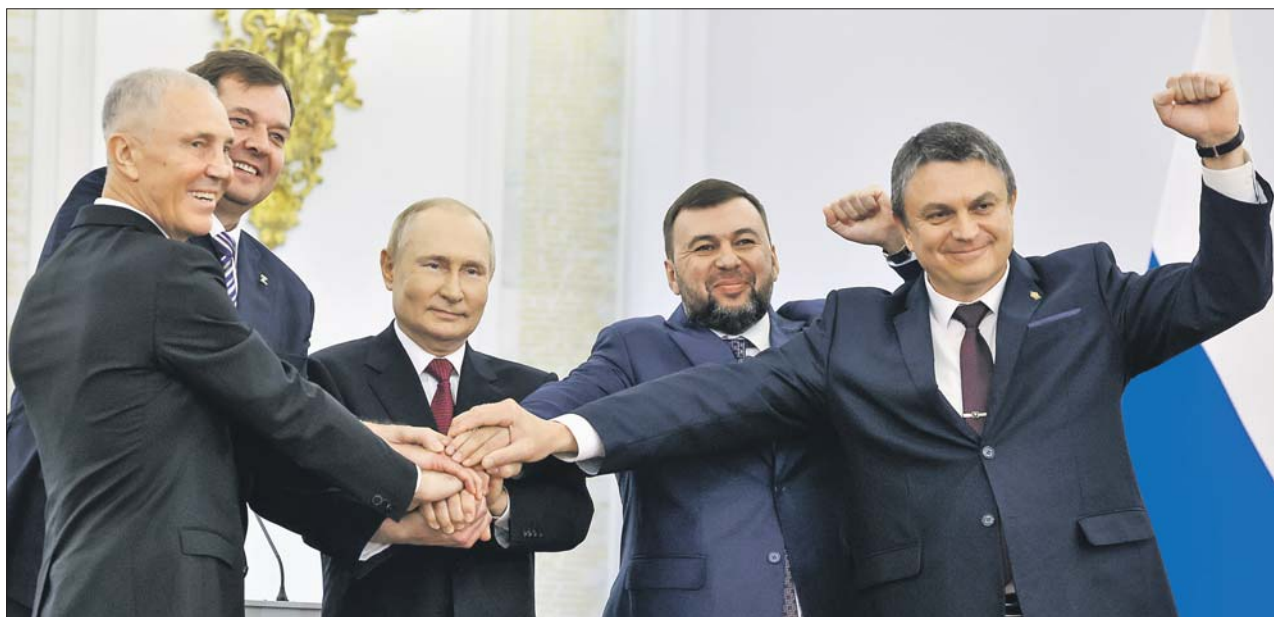
30 сентября, Георгиевский зал Кремля. Так закончилась церемония подписания договоров о принятии в состав России ДНР, ЛНР, Запорожской и Херсонской областей

Жители Донбасса, Луганщины, Херсонщины и