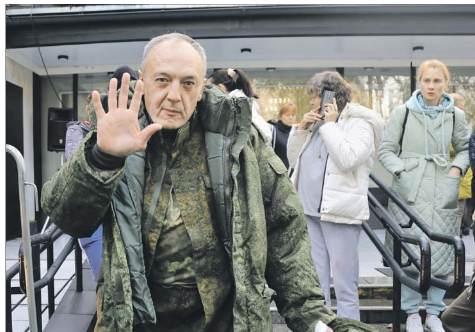
Среди мобилизованных есть добровольцы