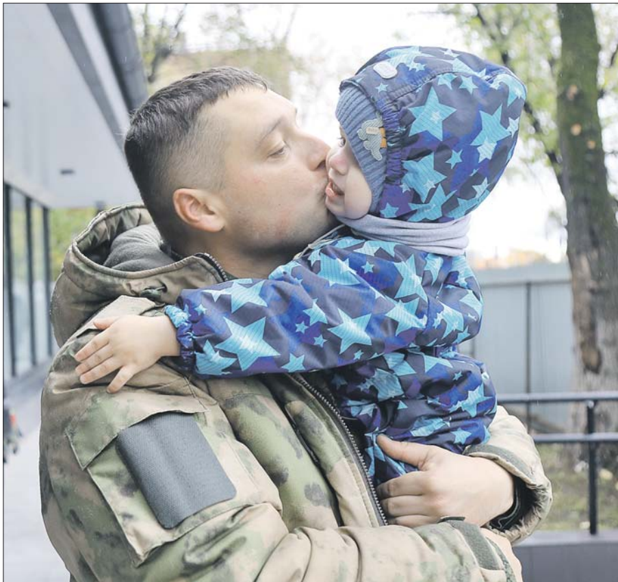
Отец обнимает годовалого сына

но расписали в Люблинском отделе ЗАГС, устроили фуршет и прогулку по Воробьёвым горам.