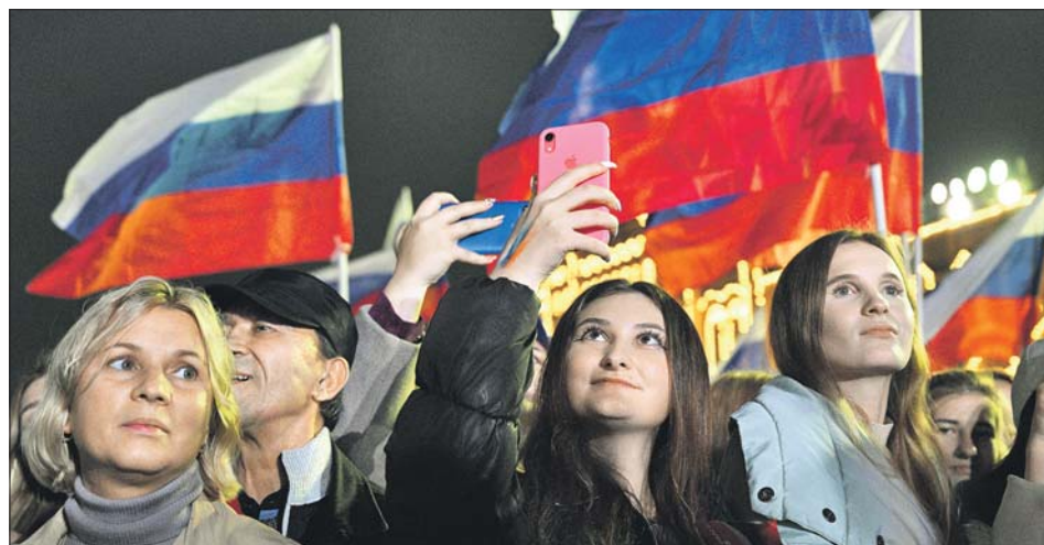
30 сентября на Красной площади состоялся концерт в поддержку присоединения Луганской и Донецкой народных республик, Запорожской и Херсонской областей к России. По сообщению МВД РФ, собрались свыше 180 тысяч человек