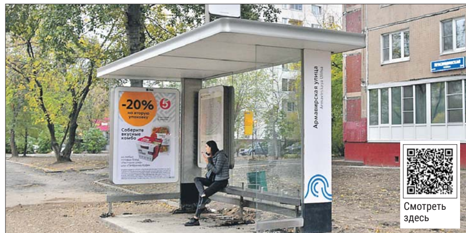
Остановка «Армавирская улица» на маршруте №74 получила название «Музей деревянной игрушки»

Вечером 3 октября трамвай шёл в депо по Угрешской улице. На ходу у трамвая загорелся изолятор силового кабеля, огонь перекинулся на крышу. Водитель позвонил в МЧС. Сотрудники приехали и потушили трамвай. Никто не пострадал. Причиной ЧП стало короткое замыкание.