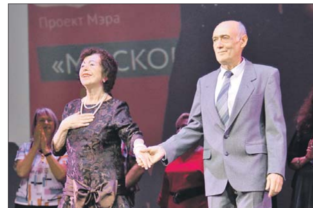
Активные участники проекта «Московское долголетие»

В ДК «Капотня» состоялось праздничное мероприятие, организованное окружным Управлением социальной защиты населения. Его приурочили к Международному дню пожилых людей. В нём приняли участие 260 жителей ЮВАО. Гостям рассказали о возможностях проекта «Московское долголетие», где есть десятки бесплатных кружков для старшего поколения. А также познакомили с самыми активными участниками проекта.