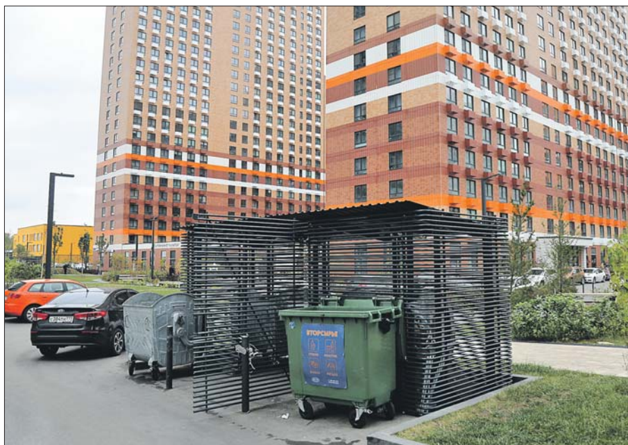
В этом контейнере и обнаружили тело ребёнка

— Она приехала в Москву, уже будучи беременной, — рассказал корреспонденту «ЮВК» первый заместитель люблинского