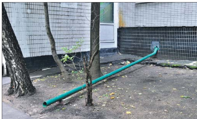
Водосток привели в порядок

ГБУ «Жилищник района Лефортово»: 2-я Кабельная ул., 4, тел. (495) 362-2387. Эл. почта: oolefortovo@mail.ru