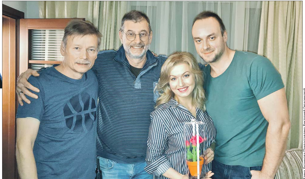
Елена Хусайнова/Предоставлено Викторией Герасимовой

Актриса рассказала о своём пути в кино и о превратностях судьбы