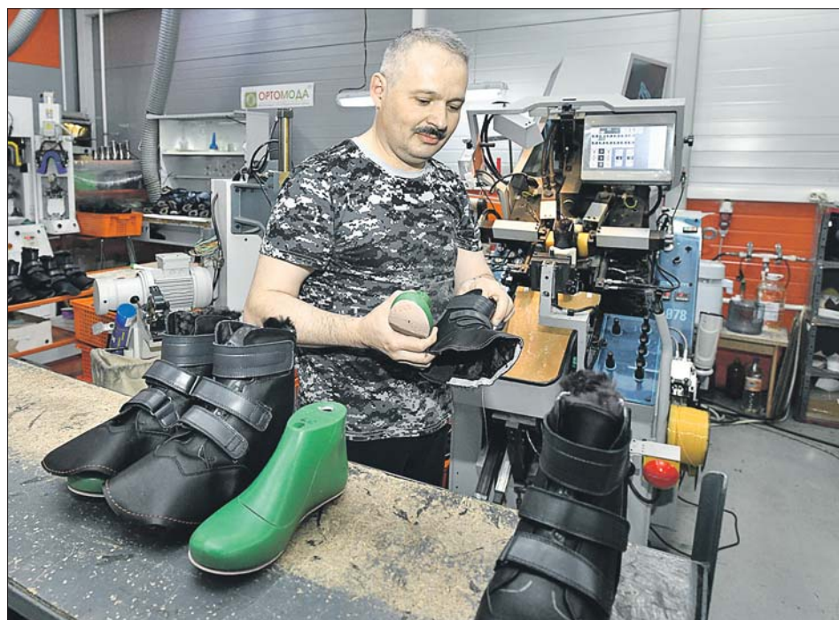
На производстве в ЮВАО в основном делают обувь для больных сахарным диабетом и для тех, кто носит ортезы и протезы

— Импортные ортопедические товары всегда у покупателей были популярны. Люди прочитали, что лидеры рынка уходят, и бросились скупать всё, что видят, — рассказывает женщина. Однако уже к маю ажио-