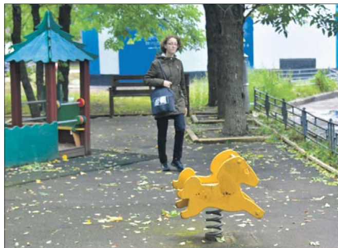
Дети могут играть, не опасаясь упасть