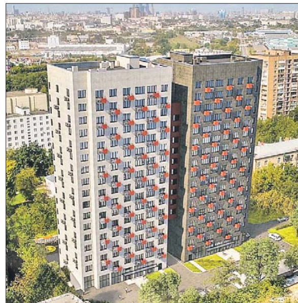
Дом разделён на два семнадцатитрёхэтажных блока