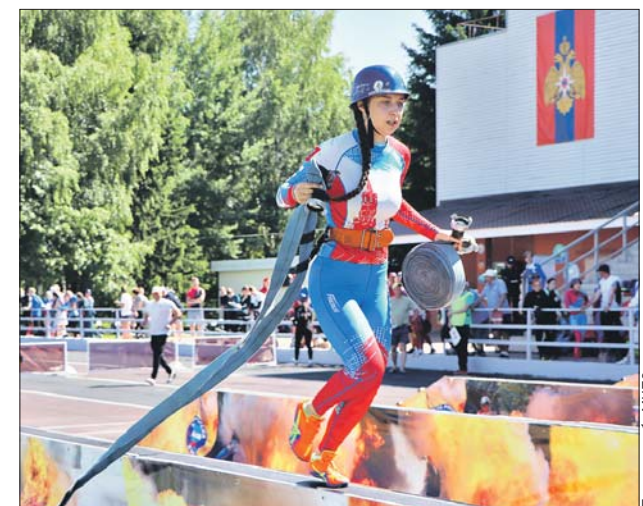
Чтобы доказать своё мастерство, пожарным приходилось подниматься по штурмовой лестнице, преодолевать полосу препятствий

Штат пожарной части Московского НПЗ превы-