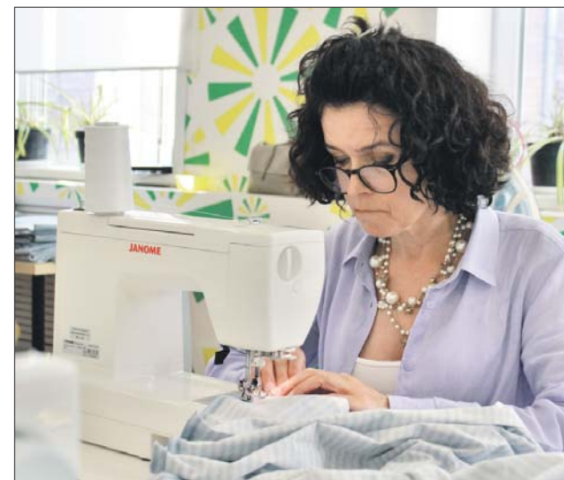
В мастерской «Уютки» можно наладить швейное производство