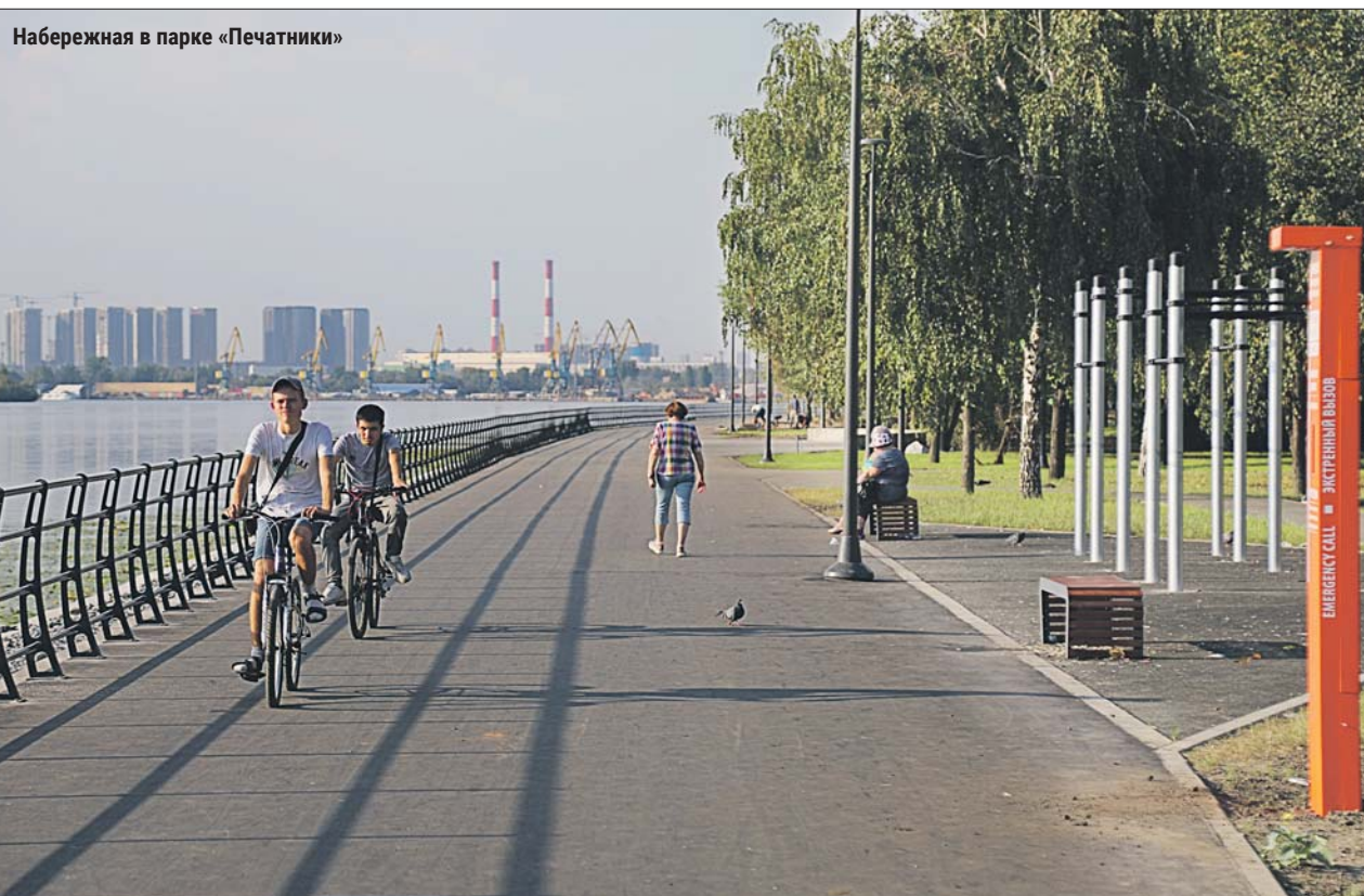
Набережная в парке «Печатники»

По его прогнозу, население района через несколько лет увеличится почти вдвое — до 100 тысяч человек — благодаря строительству нового жилья и возросшей привлекательности Нижегородского района.