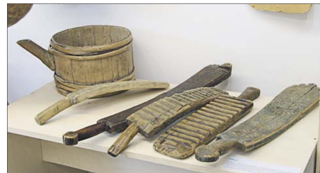
Подойник и рубели (предки стиральной доски)

В «Протомузее» можно увидеть старинные стеклянные бутылки разной величины, жестяные коробки из-под конфет и печенья кондитерской фабрики «Эйнем» — той самой, которую после Октябрьской революции переименовали в «Красный Октябрь», большую коллекцию предметов быта советского времени: ручные мясорубки, утюги, кастрюли, хлебницы, солонки и даже медицинские принадлежности.