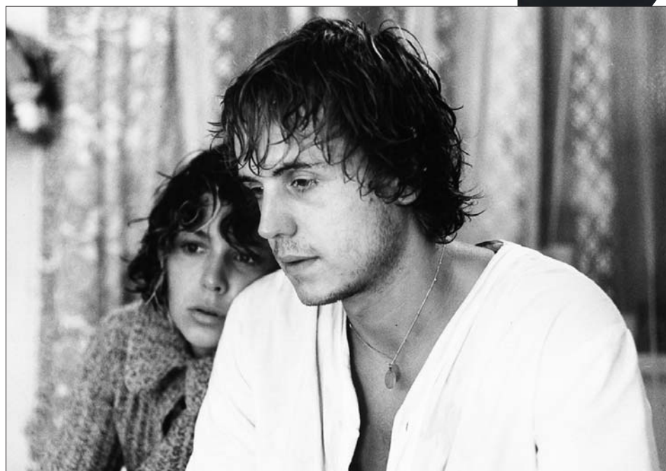
Кадр из фильма «Маленькая Вера» (1988 год)