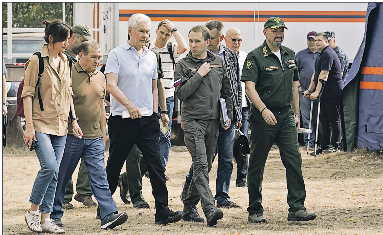
Мэр Москвы Сергей Собянин и его заместитель Пётр Бирюков в Рязанской области