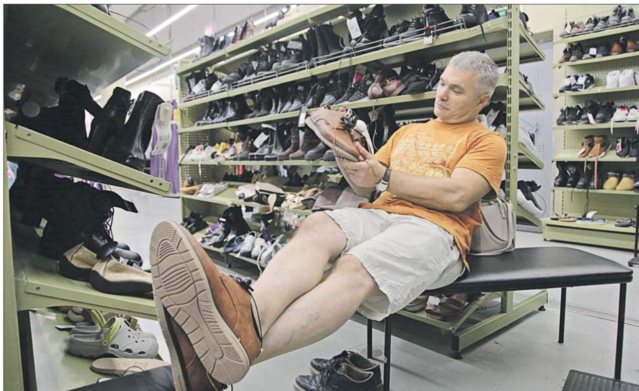
Сейчас к нам привозят много обуви из Китая, Вьетнама, Турции, Индонезии

Отечественные фирмы за полгода увеличили объём производства. Сейчас в стране порядка 1,6 тысячи компаний шьют туфли, сапоги и ботинки. Самые крупные — в Краснодарском и Ставропольском краях, Тверской, Московской и Владимирской областях.