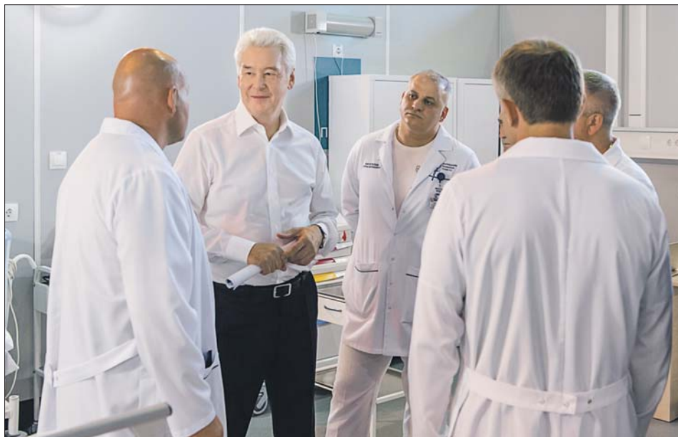
Сергей Собянин в резервном госпитале в конгрессно-выставочном центре «Сокольники». Там будут обучать медиков новому стандарту оказания экстренной помощи

В шести скорпомощных стационарных комплексах Москвы внедрят новый стандарт экстренной медпомощи