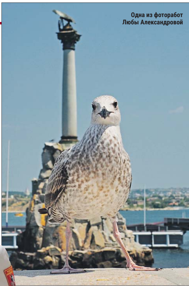
Одна из фоторабот Любви Александровой