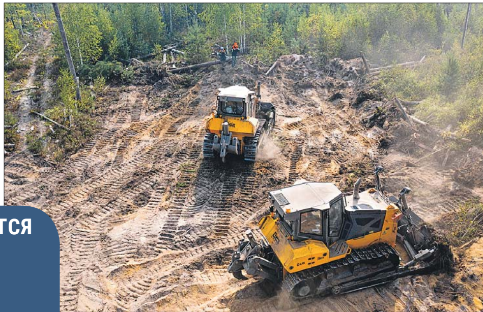
Распространение огня останавливают с помощью бульдозеров

С ОГНЁМ БОРЮТСЯ АВИАЦИЯ И ТЯЖЁЛЫЕ БУЛЬДОЗЕРЫ