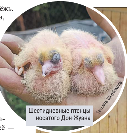
Шестидневные птенцы носатого Дон-Жуана