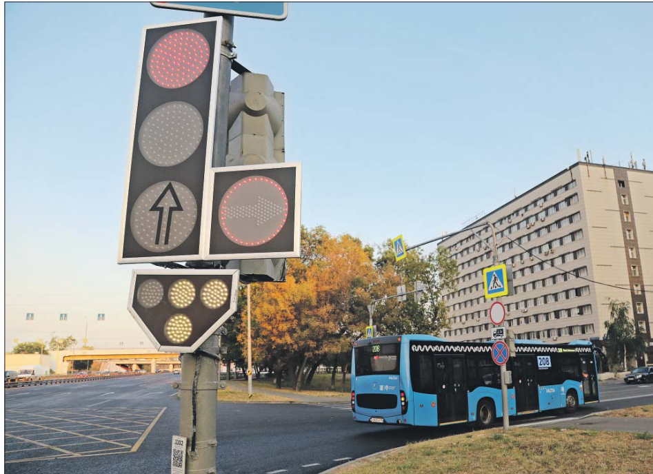
Поворот с Рязанского проспекта на Самаркандский бульвар

Например, изменения в работе светофора произошли этим летом на перекрёстке Красноказарменной улицы и Лефортовского Вала. Поток, едущему по Красноказарменной, зелёный горит теперь не 20 секунд, а 44. Режим работы скорректировали, потому что здесь ходят трамваи. Теперь они проезжают перекрёсток быстрее.