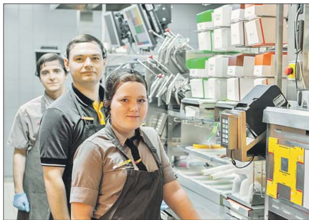
Сотрудники ресторана на Пушкинской площади

В меню остались почти все привычные блюда, хотя некоторые из них появятся в продаже не сразу. Кроме того, новая сеть сохранила передовые технологии предшественника,