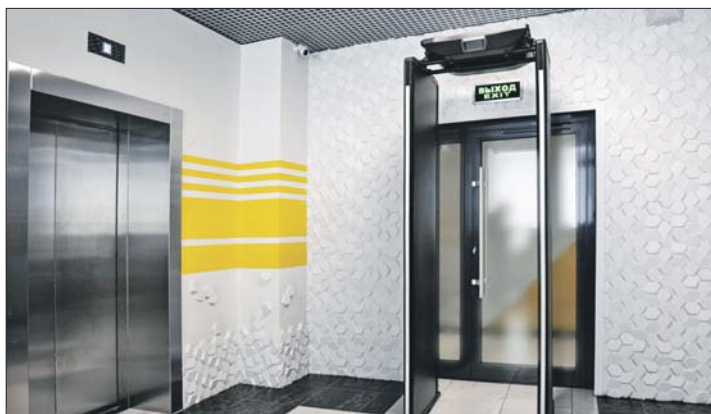
Новый досмотровый комплекс распознает оружие из углепластика

Новости, фото, видео, конкурсы, призы, приколы от любимой газеты — КАЖДЫЙ ДЕНЬ В ВАШЕЙ ЛЕНТЕ!