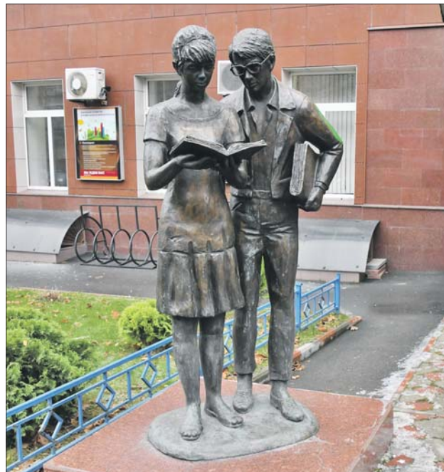
Памятник около Московского экономического института на улице Артюхиной

Стоя у памятника, я вспоминаю, как встречался с режиссёром фильма Леонидом Гайдаем. Он