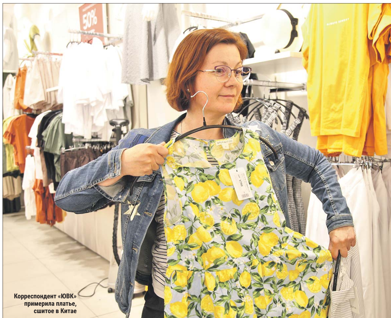
Корреспондент «ЮВК» примерила платье, сшитое в Китае

— Например, год назад базовую белую футболку можно было купить от 300