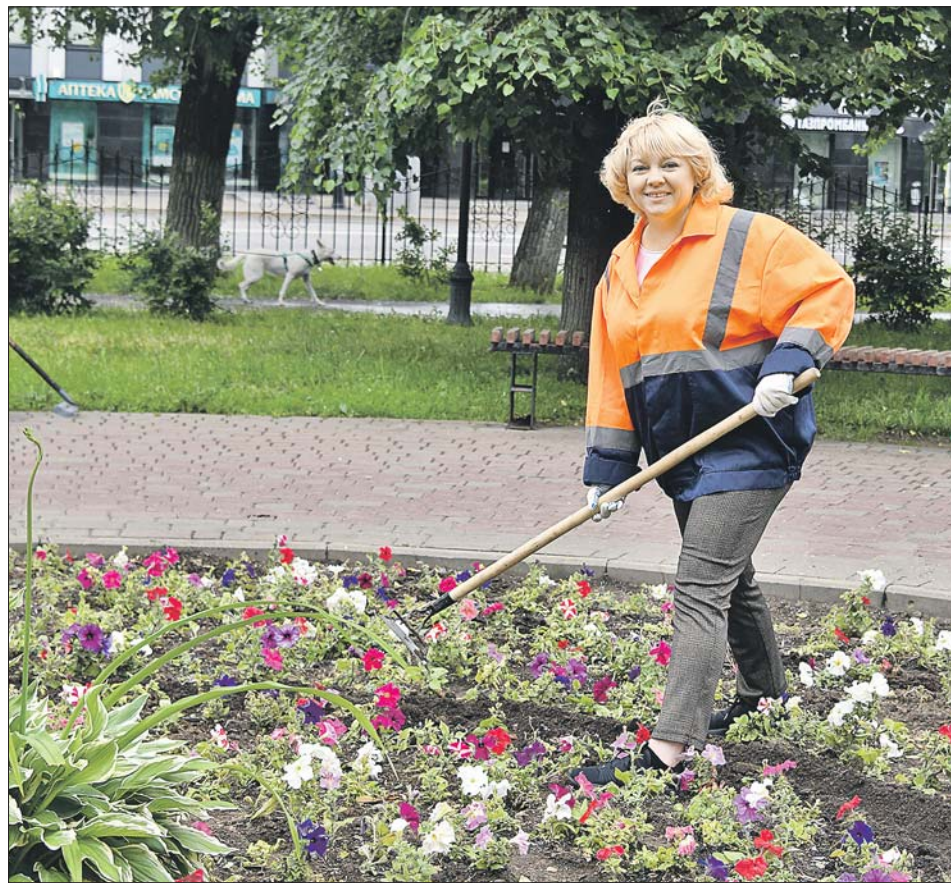
Корреспондент «ЮВК» довольна сделанной работой

Мне доверили делать грядки, куда потом прикапываем саженцы разноцветной бегонии. Её специ-