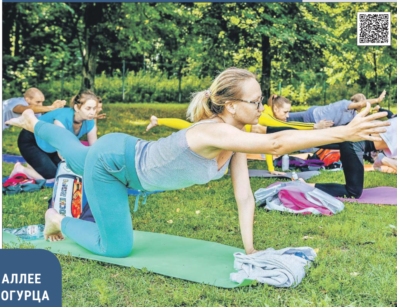
Занятия йогой в парке «Кузьминки»

эрудицию и ответить на разные вопросы. И заключительный этап — творческий: надо будет спеть, прочитать стихотворение, станцевать.