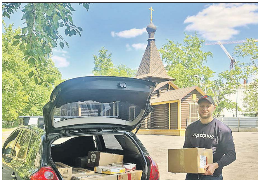
Волонтер грузит коробки в машину для отправки на общий пункт сбора гуманитарной помощи