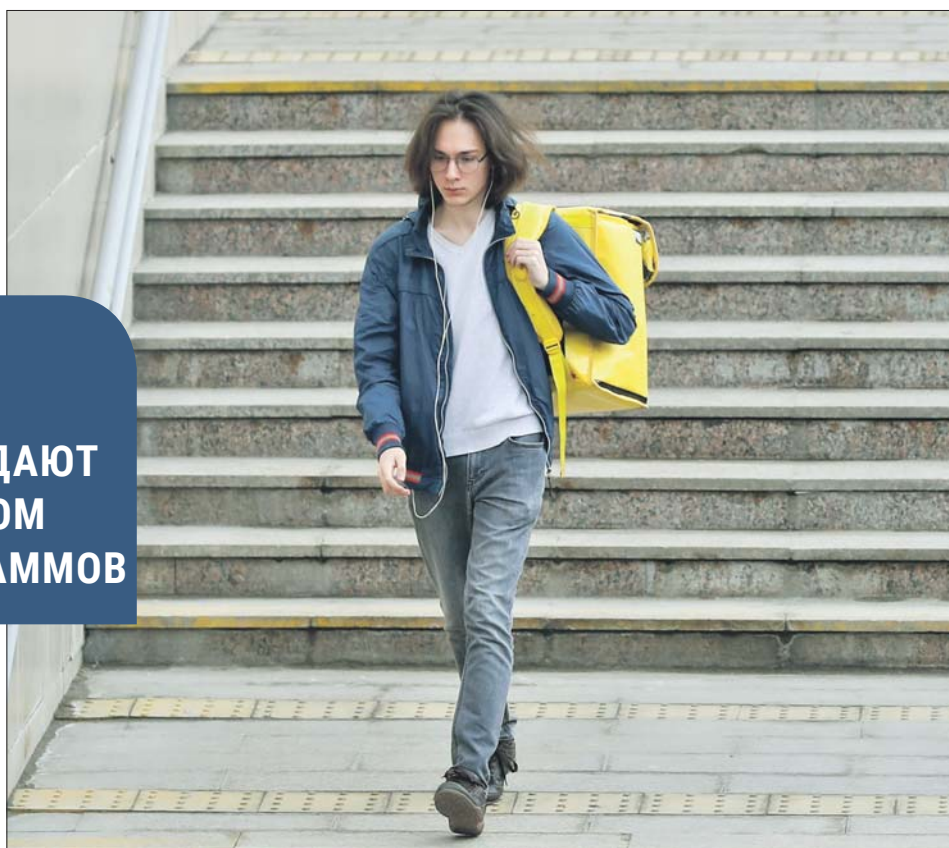
Молодой человек нашёл одну из самых популярных вакансий, не требующих опыта работы

Есть вакансии курьеров, официантов, тайных покупателей