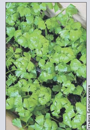
КИНЗА: хороша для салатов и мясных блюд.

ШАВЕЛЬ: удачно сочетается с сырами, подходит для соусов и салатов.