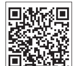
Все новости района: «Марьинский вестник»

В одном из торговых центров в районе Марьино стащили дорогостоящий смартфон прямо из детской коляски, куда мать на минутку положила гаджет. О происшествии со ссылкой на пресс-службу окружного УВД рассказала газета «Марьинский вестник». Потерпевшая заявила о нанесённом ей материальном ущербе в размере 80 тыс. рублей. Преступник, ранее уже неоднократно судимый за кражи, задержан.