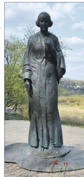
Памятник Марине Цветаевой в Тарусе

А ещё Остров интересен тем, что именно это место, а не конезавод в Хреновом, как уверены многие, — родина орловской рысистости породы. В начале 70-х годов XVIII века сюда доставили легендарного арабского жеребца Сметанку.