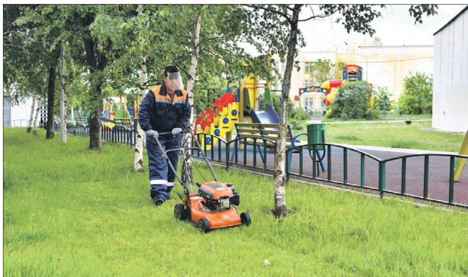
Стрижка газона во дворе дома 32 на Новороссийской улице