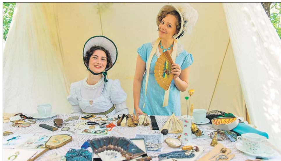
На фестивале проходят театрализованные представления, мастер-классы, спортивные программы