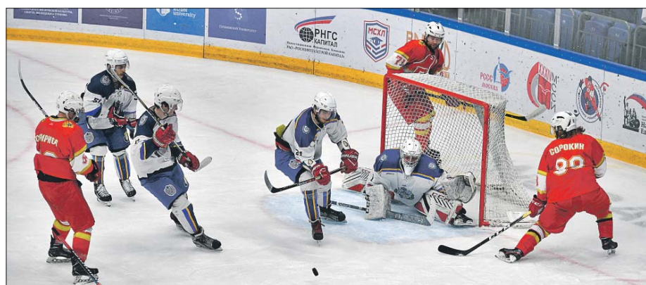
В атаке команда РЭУ имени Плеханова