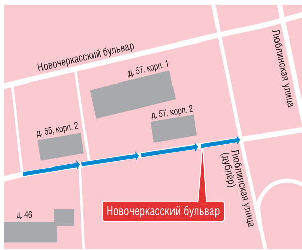
— одностороннее движение