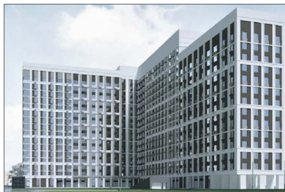
Проект жилого дома по программе реновации в Кузьминках