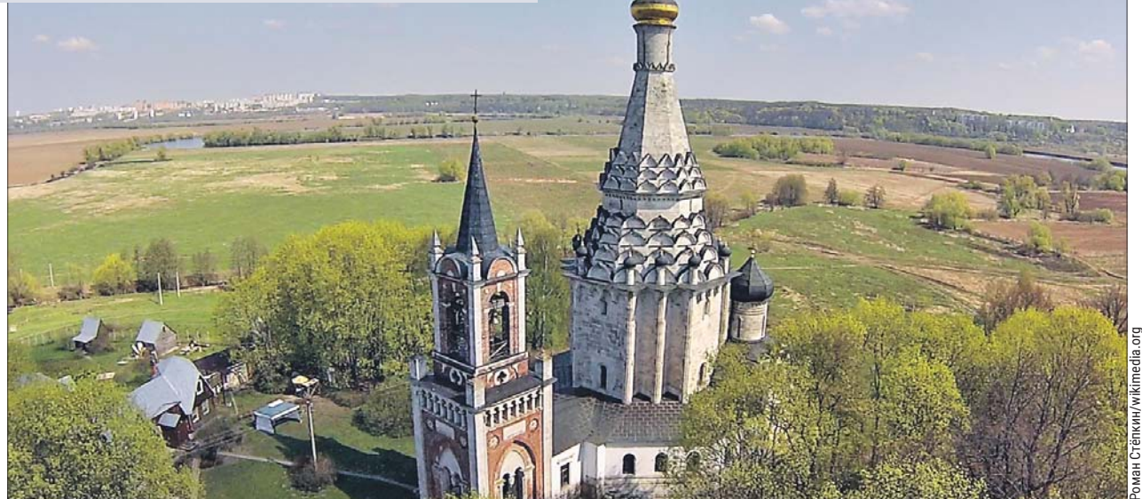
Преображенская церковь в селе Остров

По соседству, буквально через три дома, позже жил поэт Николай Заболоцкий. Именно тут он написал одно из самых своих произведений — про девочку Марусю из Тарусы. Интересна история странного, истеричного отказа