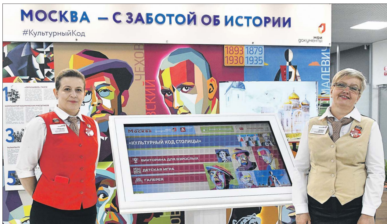
Сотрудницы нового центра госуслуг встречают посетителей

Вход в новый офис — напротив парковки у ТЦ. Пропустить его сложно: на фасаде висит большая вывеска. Как заходишь, удивляешься: светло, просторно и прохладно. Есть два ресепшена, один из которых ниже другого. Он предназначен для маломобильных посетителей. Широкие проходы, много кресел для ожидающих. Посетителей тоже немало, но при этом очередей нет, потому что на этаже работает 71 окно приёма. Ещё есть большая зона с компьютерами, где можно зайти на сайт mos.ru . Пожилой мужчина пытается