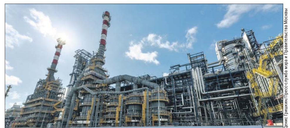
Новейший комплекс переработки нефти Евро+ запущен в 2020 году

— Московский нефтеперерабатывающий завод продолжает свою программу модернизации. Сейчас эффект очевиден и заметен. Когда реконструкция закончится, мы получим на территории крупного столичного мегаполиса одно из самых современных в мире производств, которое с экологической точки зрения будет стремиться к нейтральности, воздействие будет минимизировано, —