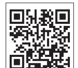
Все новости района: «Эхо района»

Поведение агрессивно настроенного соседа обсудили на днях в районном сообществе «Рязанский проспект (Рязанка)» в соцсети «ВКонтакте». Подробности приводит онлайн-издание «Эхо района»: пожилой мужчина, как сообщается в посте, повадился обстреливать тухлыми помидорами и яйцами проходящих под его окнами собаководов. В комментариях соседи написали, что раньше пенсионер просто кричал на прохожих, а теперь «пошёл в бой». Возможно, у него когда-то был неудачный опыт общения с собаками.