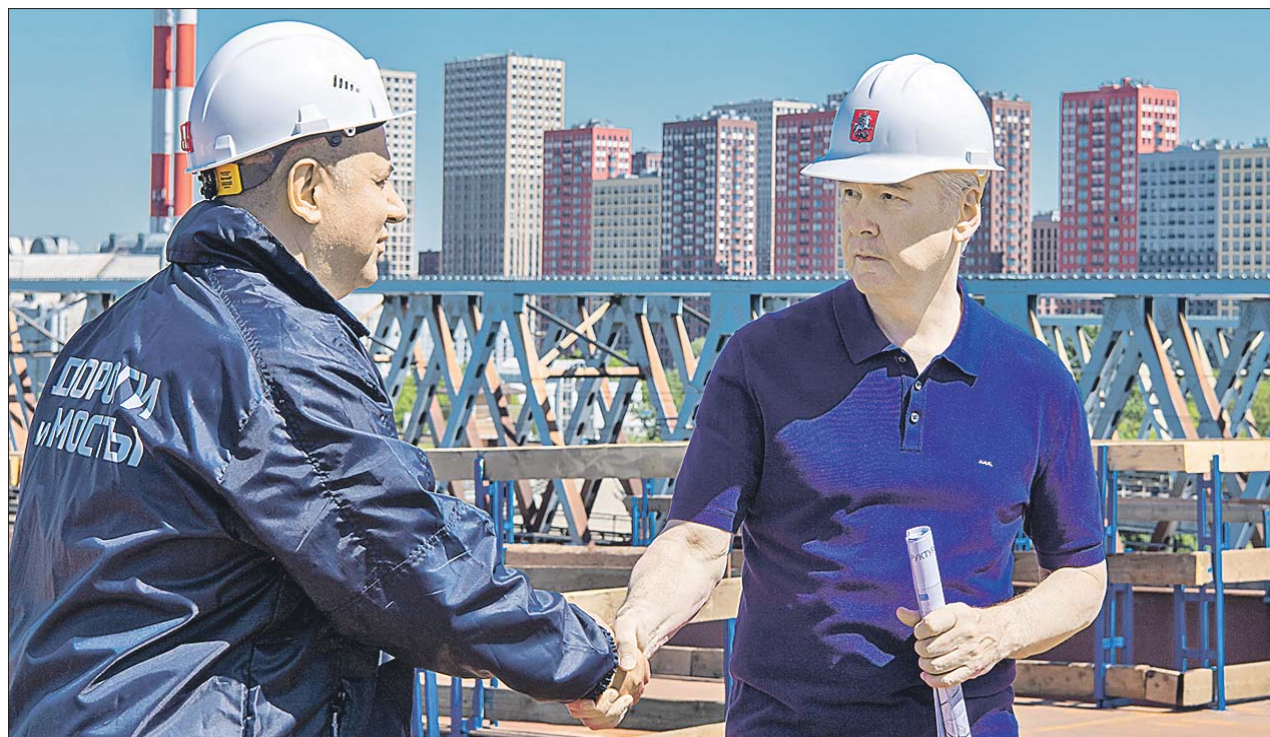
Сергей Собянин на участке ЮВХ от Курьяновского бульвара до Кантемировской улицы

Строительство участка ЮВХ от Курьяновского бульвара до Кантемировской улицы началось два года назад. Шестиполосная трасса длиной около 2,5 км по прямой начнётся в районе Курьяновского бульвара, пройдёт вдоль путей МЦД-2,