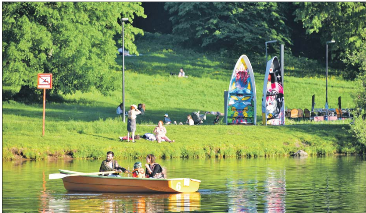
Шибавский пруд в парке «Кузьминки»