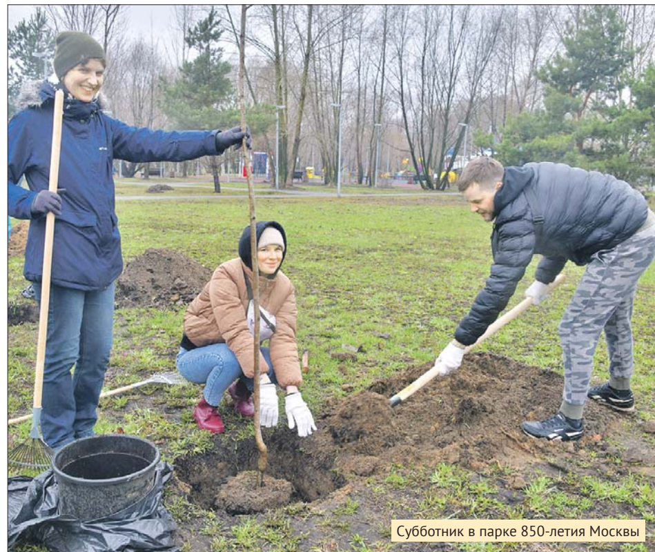
Субботник в парке 850-летия Москвы

В самых массовых местах субботника участники угощали чаем и греч-