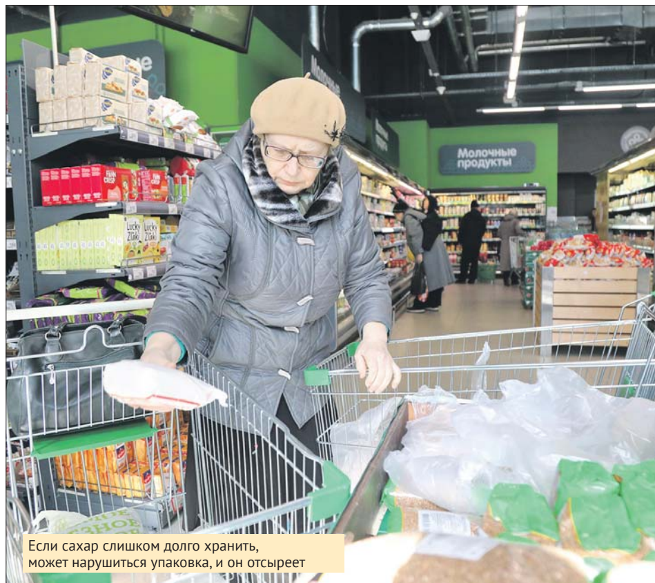
Если сахар слишком долго хранить, может нарушиться упаковка, и он отсыреет

— Мы считаем, что такой продукт употреблять нельзя, — сказала эксперт.