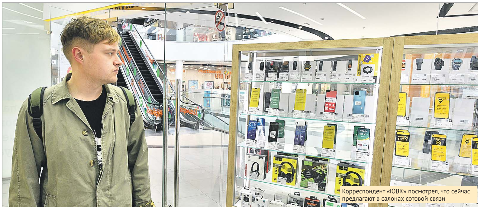
Корреспондент «ЮВК» посмотрел, что сейчас предлагают в салонах сотовой связи