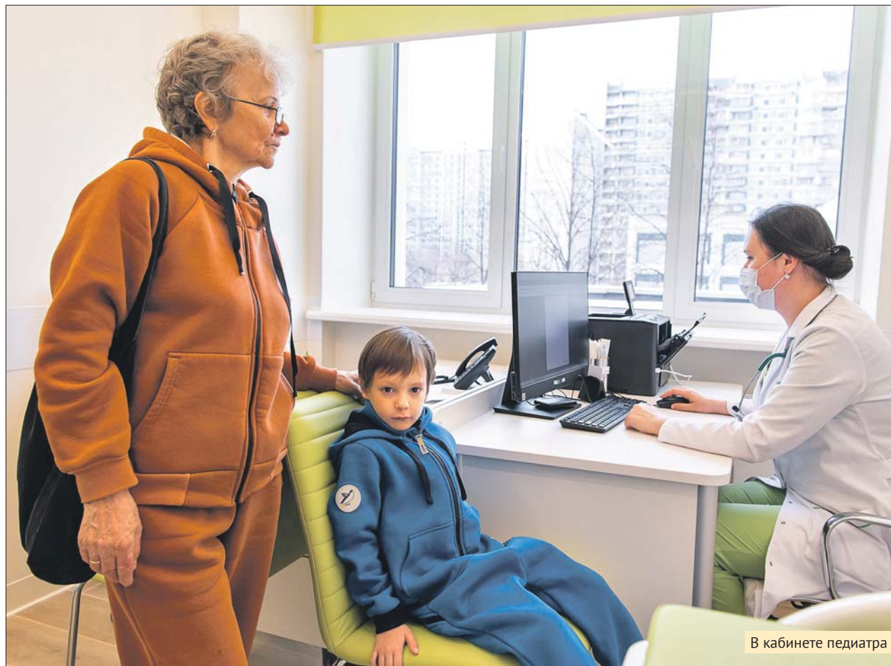
В кабинете педиатра

Появился кабинет лечебной физкультуры, в бассейне установили современное оборудование для водоподготовки, а также подъёмный механизм для маломобильных посетителей.