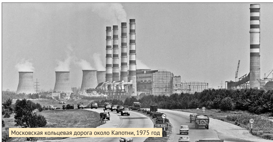
Московская кольцевая дорога около Капотни, 1975 год

...В последний мой приезд в Капотню я видел в парке у набережной лису. Она, затаившись в камышах, караулила уток. Рядом торчали громадные трубы НПЗ. На фоне их небо стригли первые весенние ласточки.