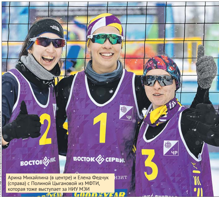
Александр Лукин/Всероссийская федерация волейбола