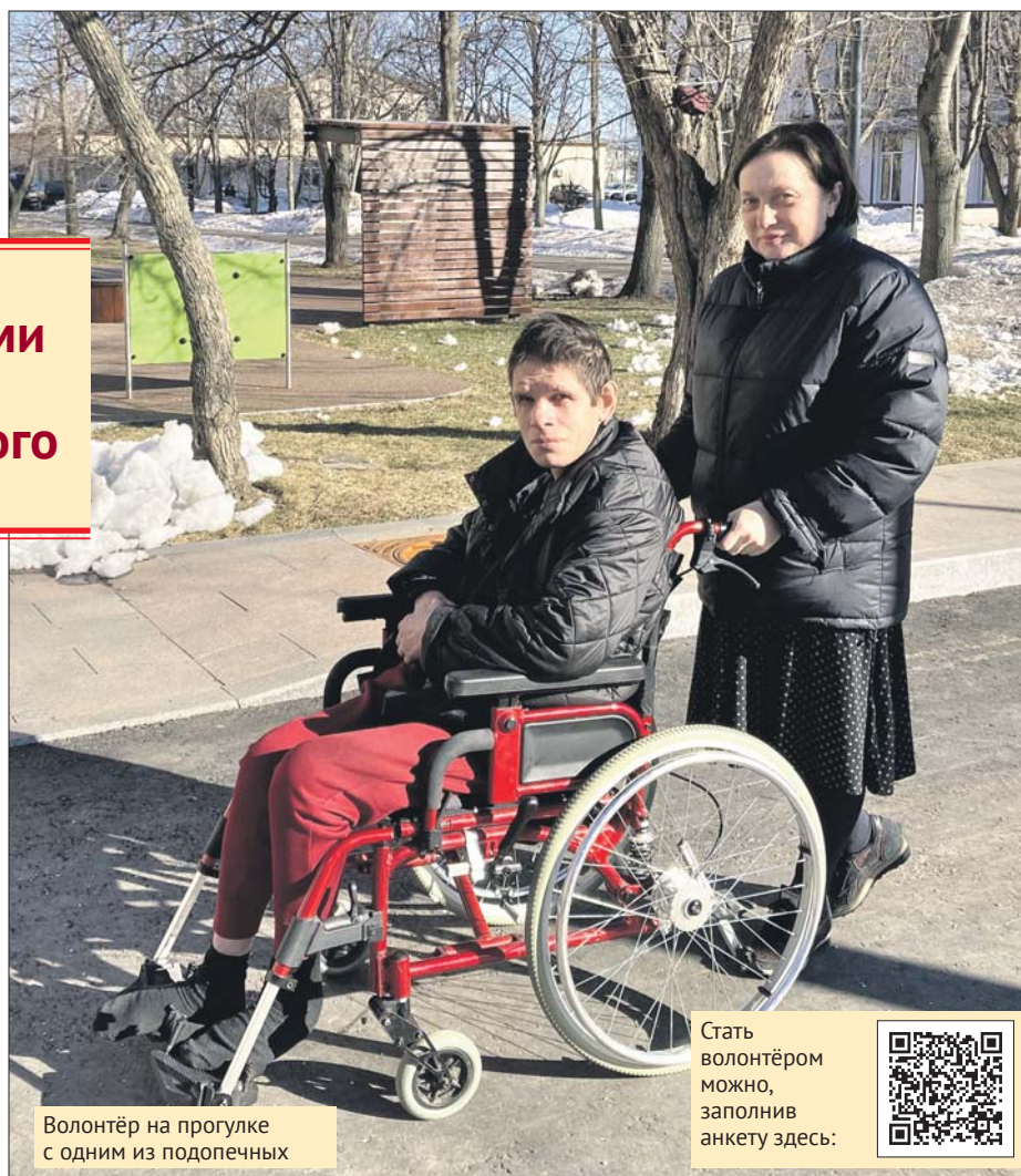
Волонтер на прогулке с одним из подопечных

Стать волонтером можно, заполнив анкету здесь: