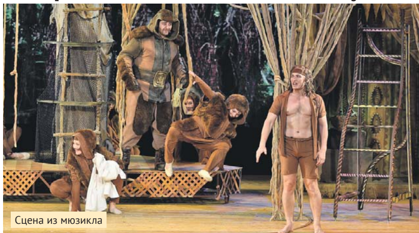
Сцена из мюзикла