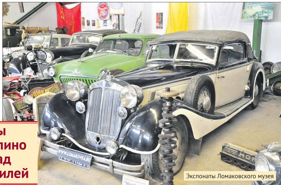
Экспонаты Ломаковского музея

Автомобили из коллекции Ломаковых любят киношники. Раритетные авто снимали более чем в 120 кинофильмах: «Вари-