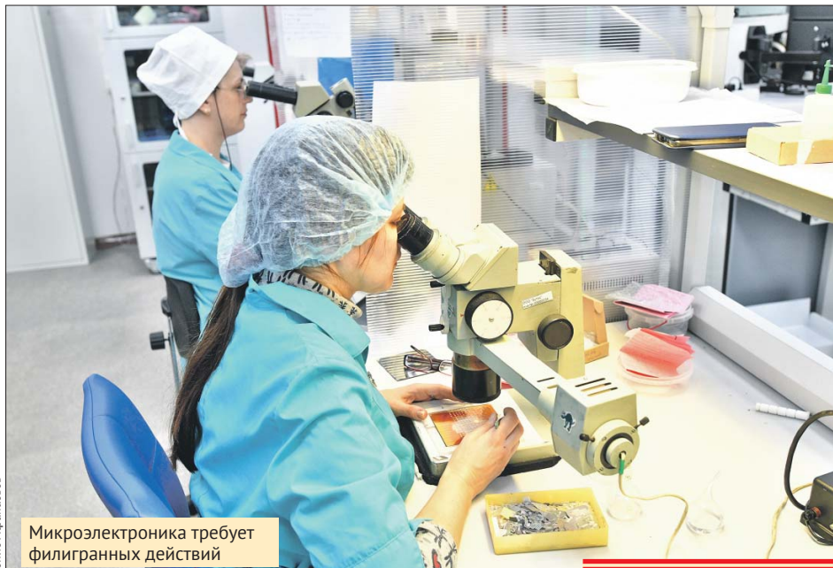
Микроэлектроника требует филигранных действий

В технополисе «Москва» производят радиочастотные фильтры, которые по ряду параметров лучше импортных