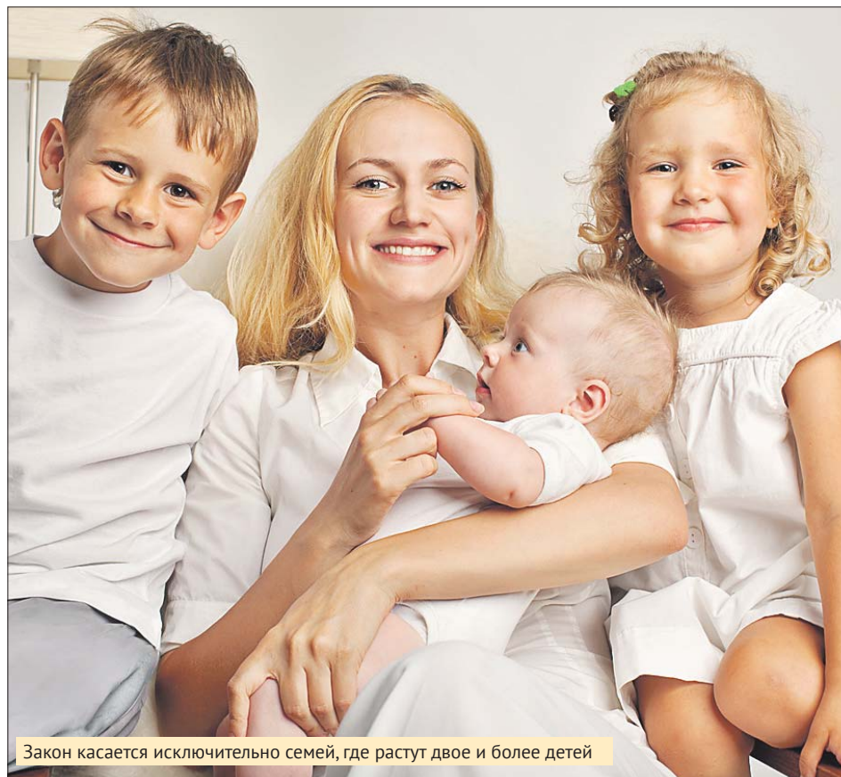
Закон касается исключительно семей, где растут двое и более детей

Закон уже вступил в силу, и, более того, он будет действовать в отноше-