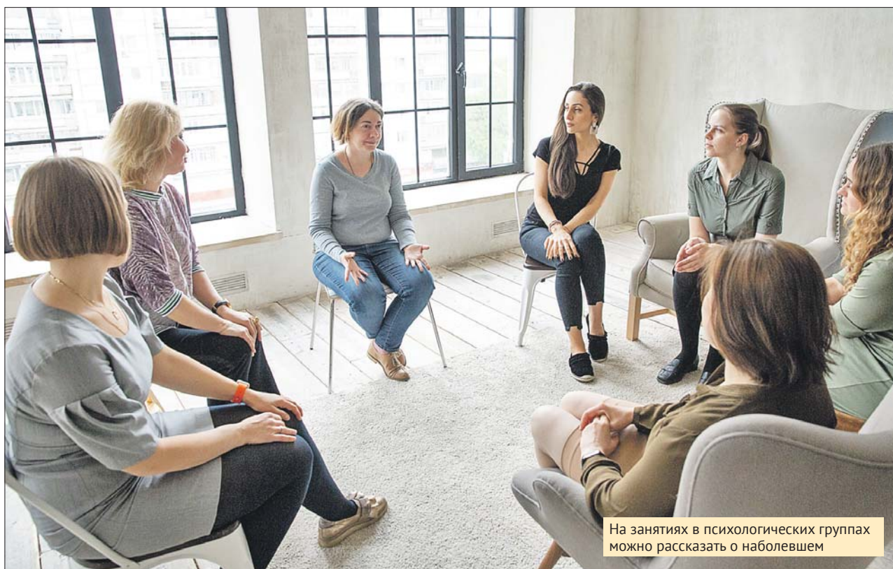
На занятиях в психологических группах можно рассказать о наболевшем

Жители ЮВАО могут стать волонтерами благотворительного фонда