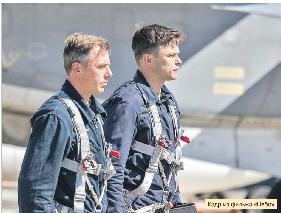
Кадр из фильма «Небо»

В прокат вышел фильм «Небо», где Игорь Петренко сыграл одну из главных ролей — подполковника Олега Сошникова. Фильм основан на реальных событиях и рассказывает о трагическом случае, произошедшем несколько лет назад и имевшем большой резонанс. Турецкий истребитель сбил наш самолёт. Штурмана в результате сложной войсковой операции удалось спасти, а пилот, прототипом которого и стал Сошников, погиб. Игорь Петренко крайне редко даёт интервью, но на этот раз согласился.