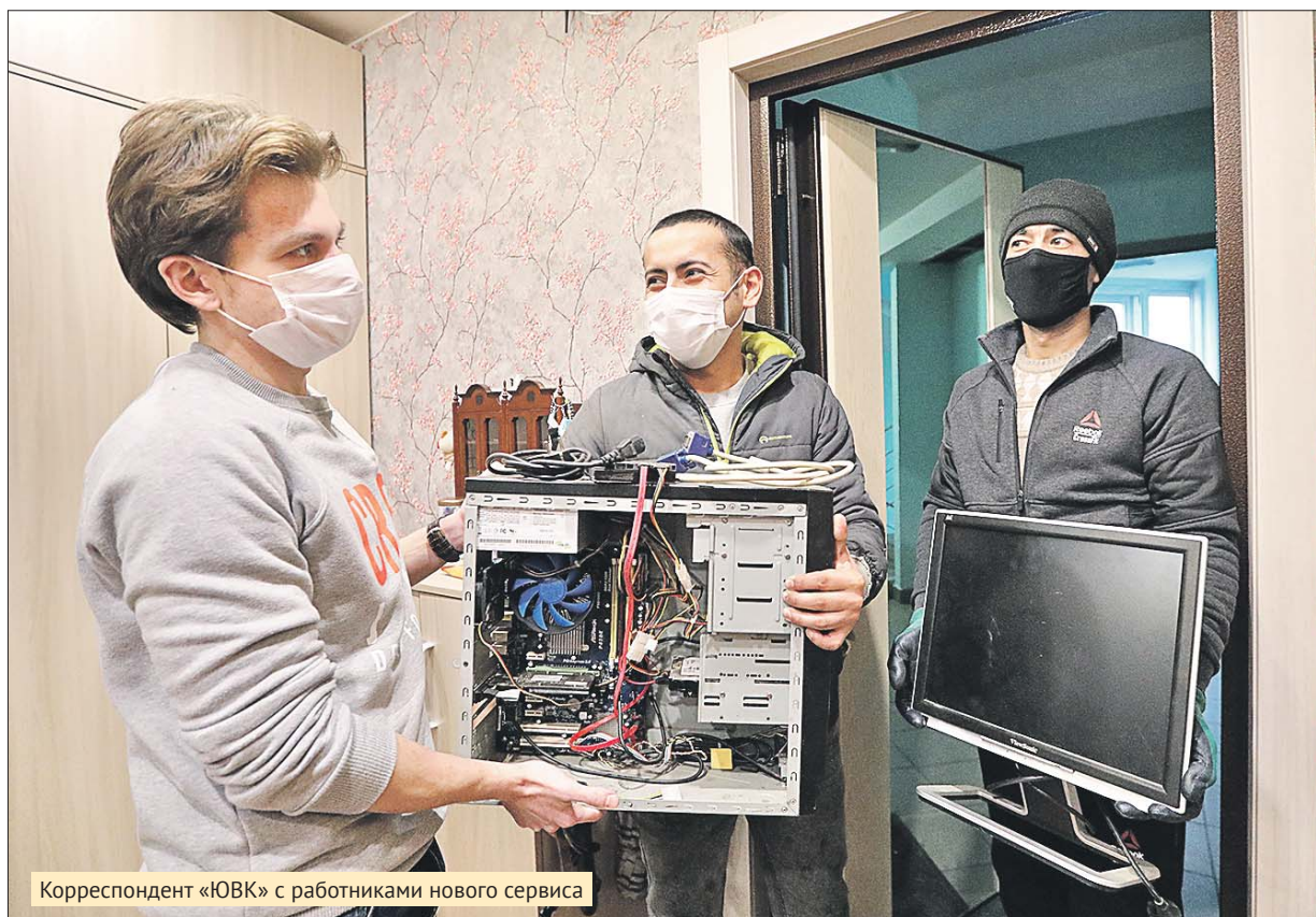
Корреспондент «ЮВК» с работниками нового сервиса