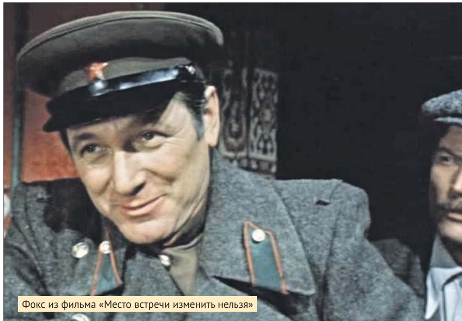
Фокс из фильма «Место встречи изменить нельзя»

Сначала планировалось, что персонажа, который «бабам нравятся», «по замашкам вроде как фраер, но не фраер», сыграет Борис Химичев. Но режиссёра Станислава Го-