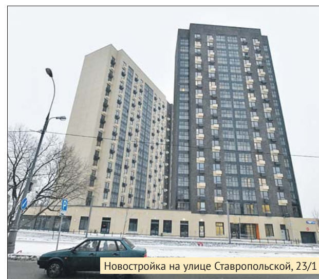
Новостройка на улице Ставропольской, 23/1

В доме три подъезда, здание оборудовали системами охраны, оповещения, пожарной сигнализации и видеонаблюдения. Жить в многоэтажке будут 324 семьи. Из них 43 поселятся в однушках, 238 — в