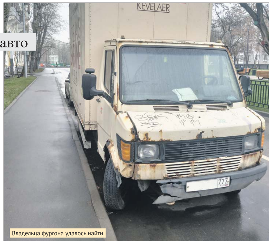
Владельца фургона удалось найти

А если двери и колёса на месте, старую машину мо-