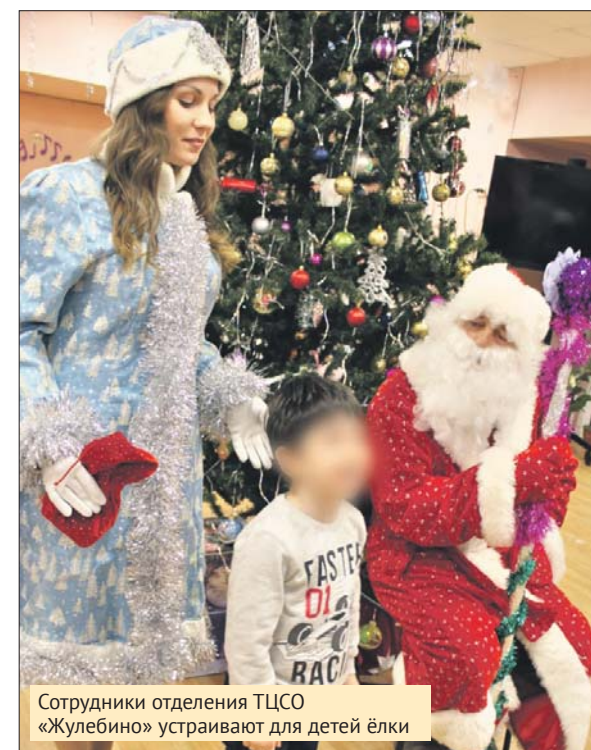
Сотрудники отделения ТЦСО «Жулебино» устраивают для детей ёлки

Подарки можно принести в отделение социальной реабилитации по адресу: Жулебинский бул., 40, корп. 1, секция 5. Подробности на горячей линии ТЦСО «Жулебино»: (495) 706-5642