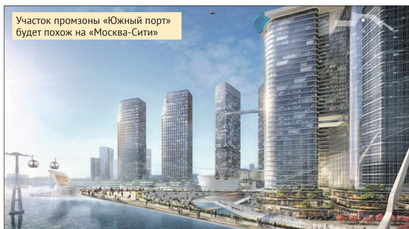
Участок промзоны «Южный порт» будет похож на «Москва-Сити»