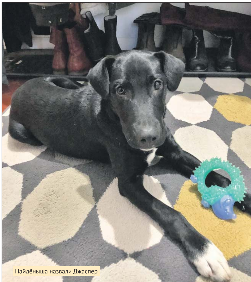
Найдёныша назвали Джаспер