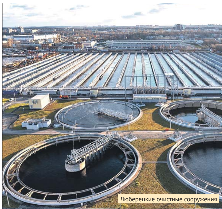
Люберецкие очистные сооружения

Он отметил, что при модернизации упор сделан на повышение качества воздуха вокруг объекта. По словам градоначальника, уже удалось практически полностью избавиться