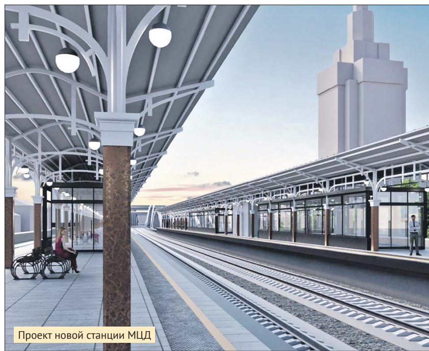
Проект новой станции МЦД