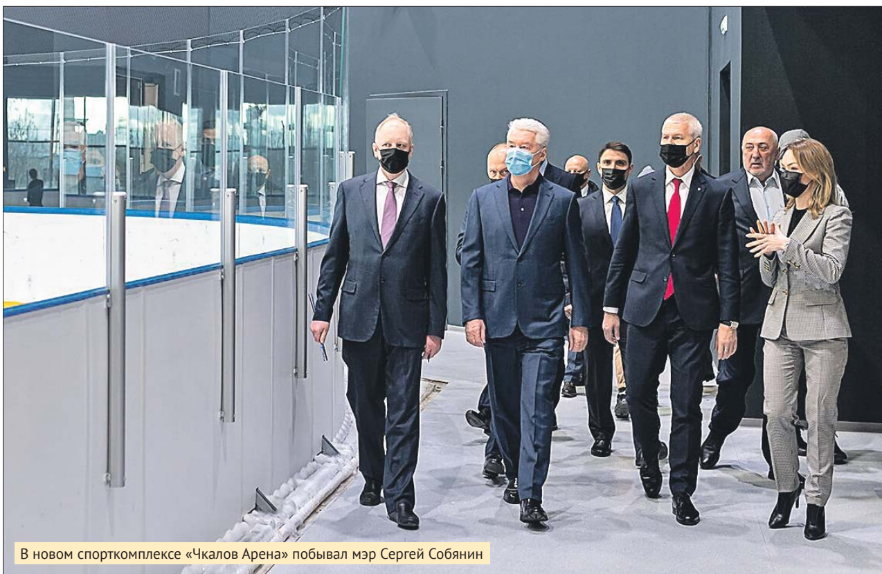
В новом спорткомплексе «Чкалов Арена» побывал мэр Сергей Собянин

В Москве построили ещё один крупный спортивный центр