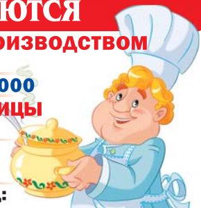
График работы 5/2.