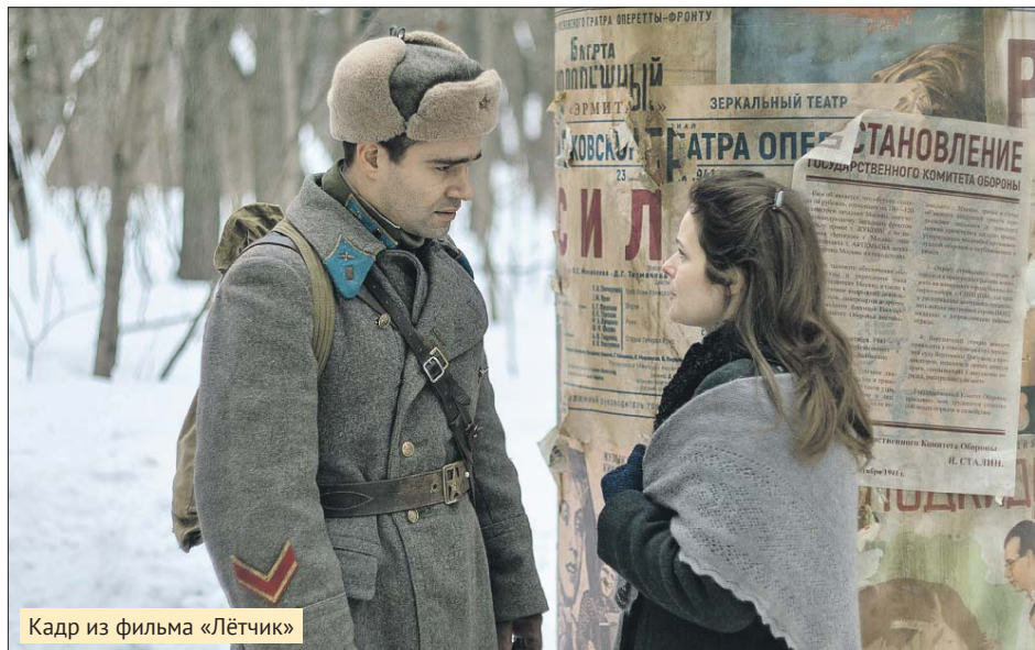
Кадр из фильма «Лётчик»

Актриса рассказала о кинопроектах и о личной жизни