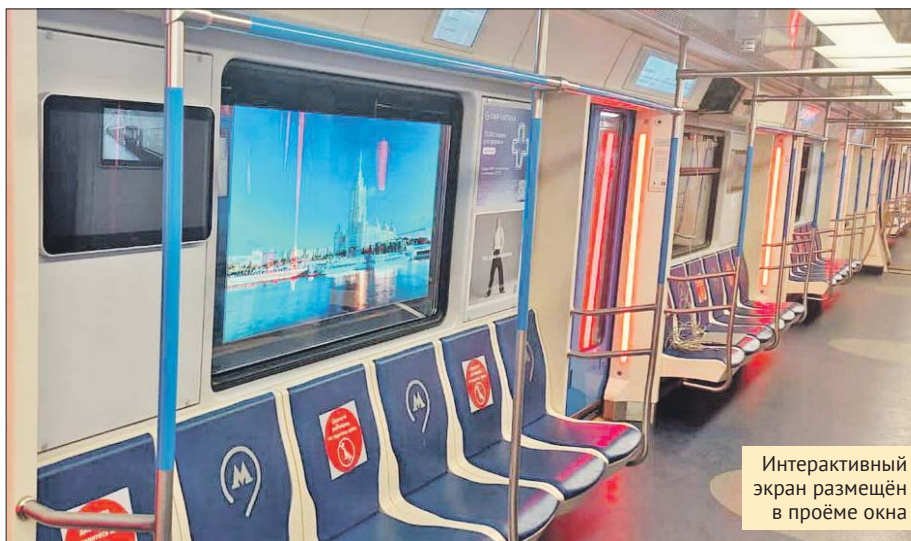
Интерактивный экран размещён в проёме окна

— Во время движения за окном вагона темно. Вместо того чтобы разглядывать стены тоннеля, пассажиры могут узнать полезную для себя информацию или ознакомиться с новостями. На время прибытия на освещённые перроны трансляция прерывается, — пояснили в пресс-службе метрополитена.