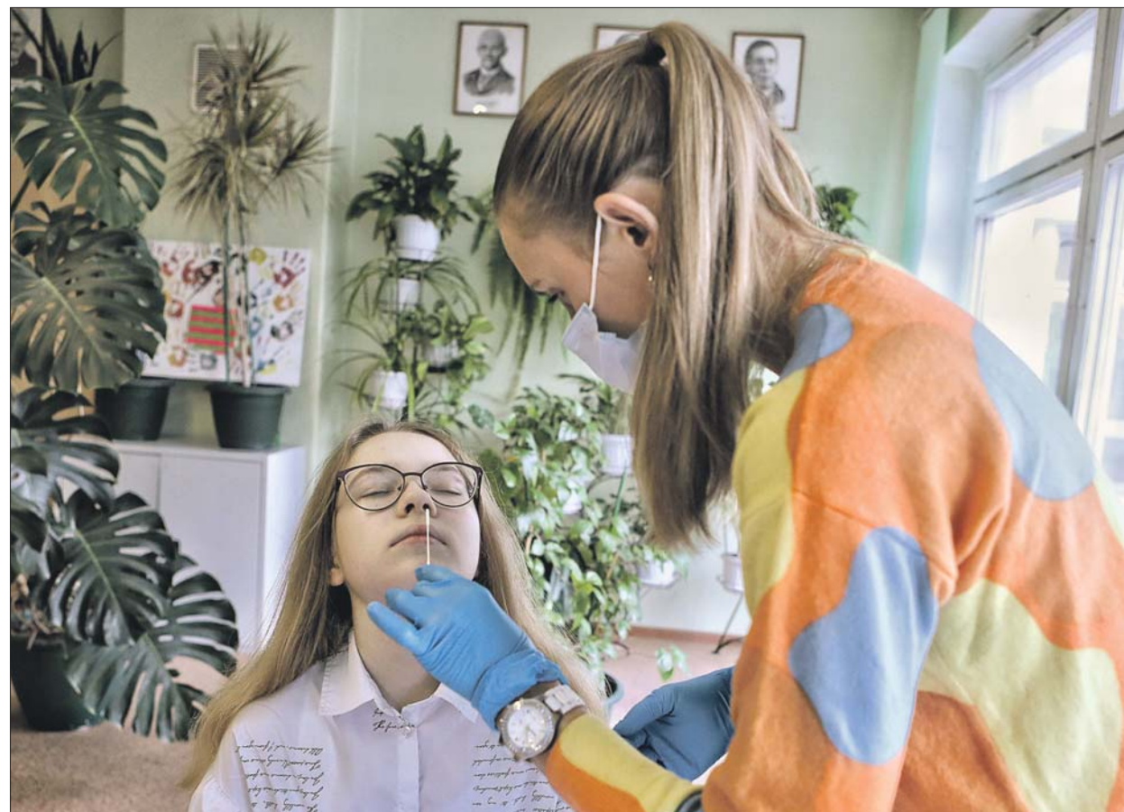
Экспресс-тестирование в школе №1363 на Рязанском проспекте

— Я уже один раз прошла экспресс-тестирова-