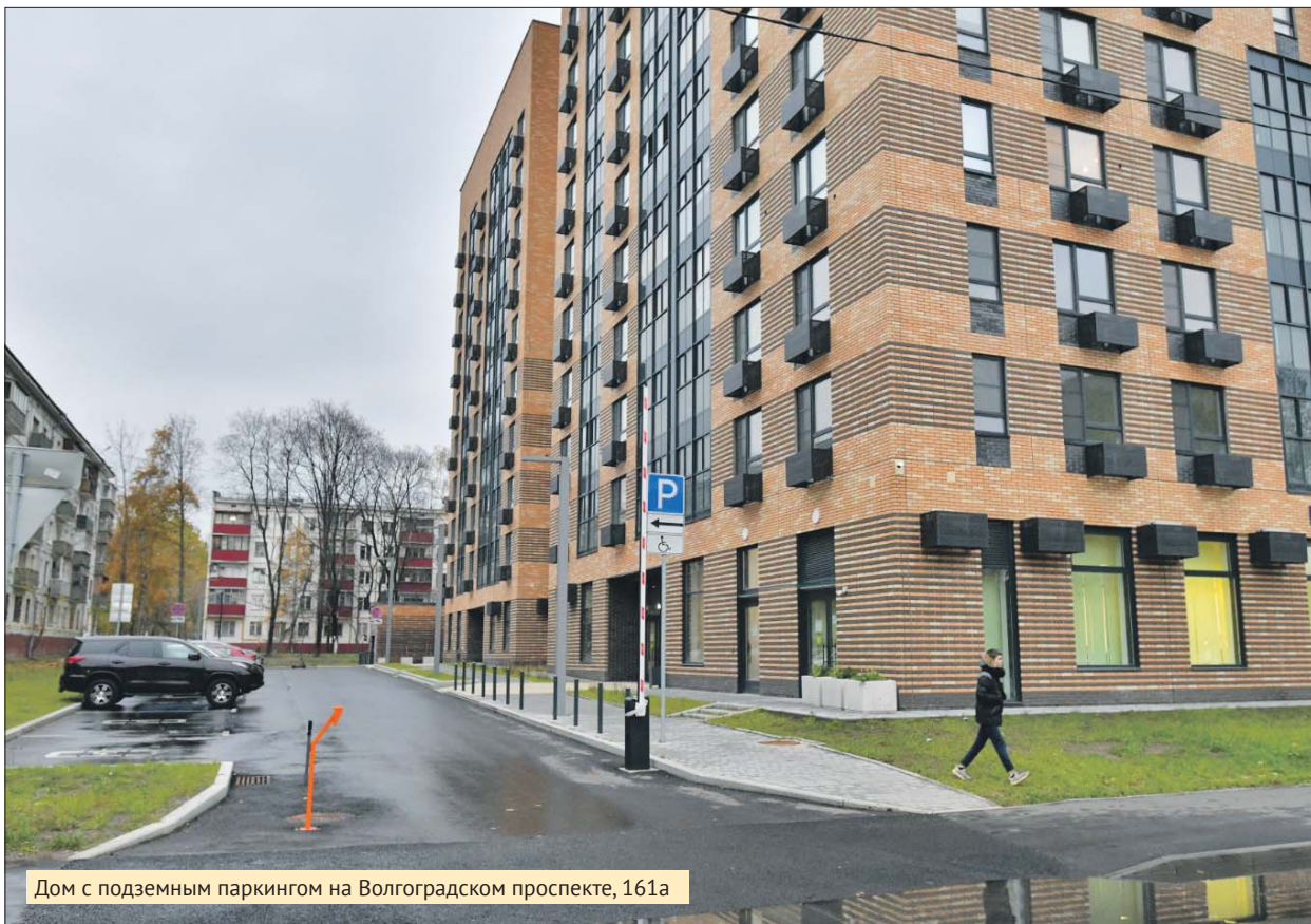
Дом с подземным паркингом на Волгоградском проспекте, 161а

Участники реновации могут купить машино-место по сниженной цене