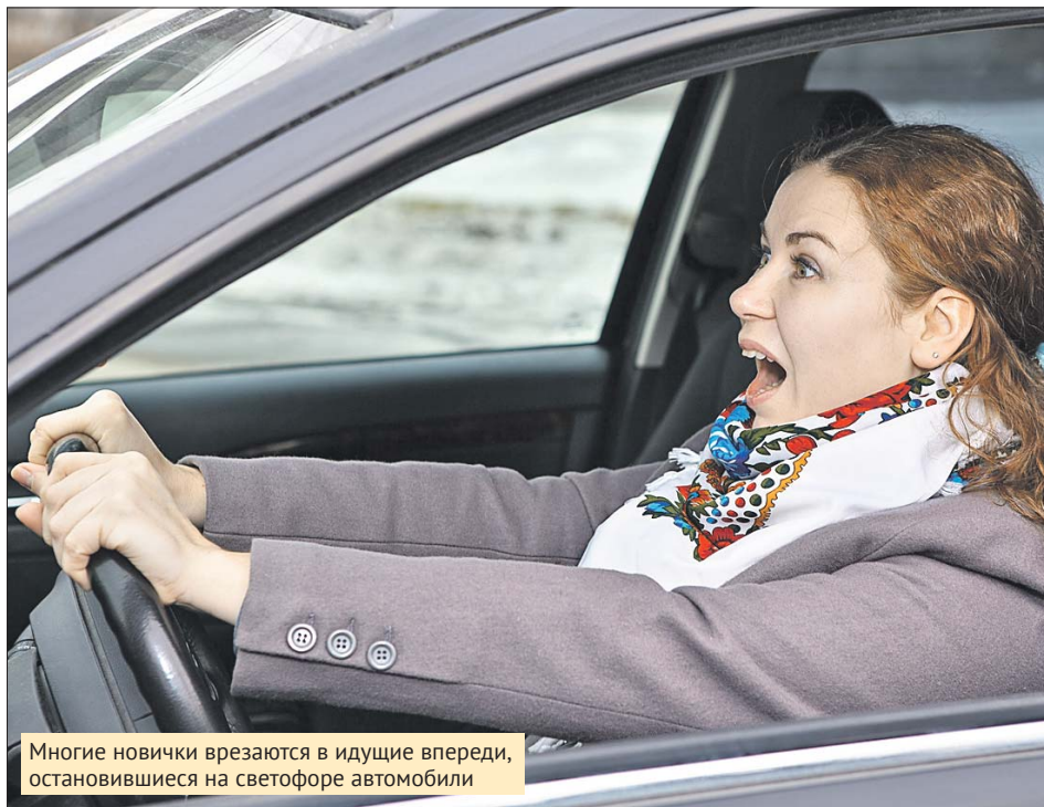
Многие новички врезаются в идущие впереди, остановившиеся на светофоре автомобили

Новичкам подчас сложно считать информацию, которую дают дорожные знаки и светофоры, следить за обстановкой и одновременно управлять авто. Если действия по управлению педалями, рулем ещё не доведены до полного автоматизма, на них приходится постоянно отвлекаться. А ситуация на дороге может измениться: приблизится ещё один автомобиль — значит, от начатого манёвра надо отказаться, но новичку и на это нужно время!