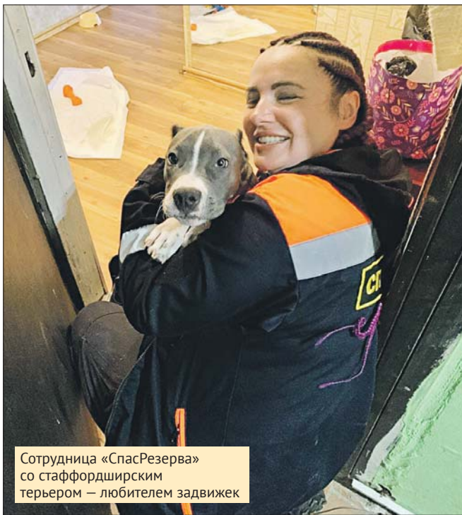
Сотрудница «СпасРезерва» со стаффордширским терьером — любителем задвижек