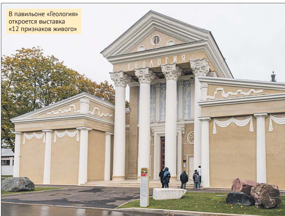
В павильоне «Геология» откроется выставка «12 признаков живого»

Длина пешеходного маршрута составляет 300 метров