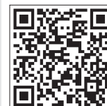
Все новости района: «Капотнинский меридиан»

Самосвал КамАЗ развалился на части в ходе ДТП в районе Капотня. Запись видеорегистратора появилась в группе «ДТП и ЧП. Москва и МО», сообщает районный портал «Капотнинский меридиан». На записи видно кабину, лежащую в нескольких десятках метров от грузовика.