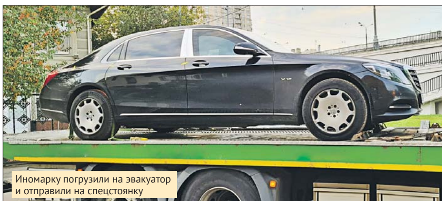
Иномарку погрузили на эвакуатор и отправили на спецстоянку

— Мы проверили имущество компании и выяснили, что у неё в собственности находится ма-