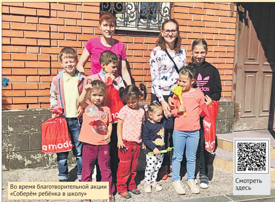
Во время благотворительной акции «Соберём ребёнка в школу»