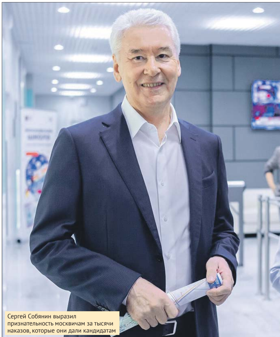
Сергей Собянин выразил признательность москвичам за тысячи наказов, которые они дали кандидатам

Входившие в него кандидаты победили во всех избирательных округах