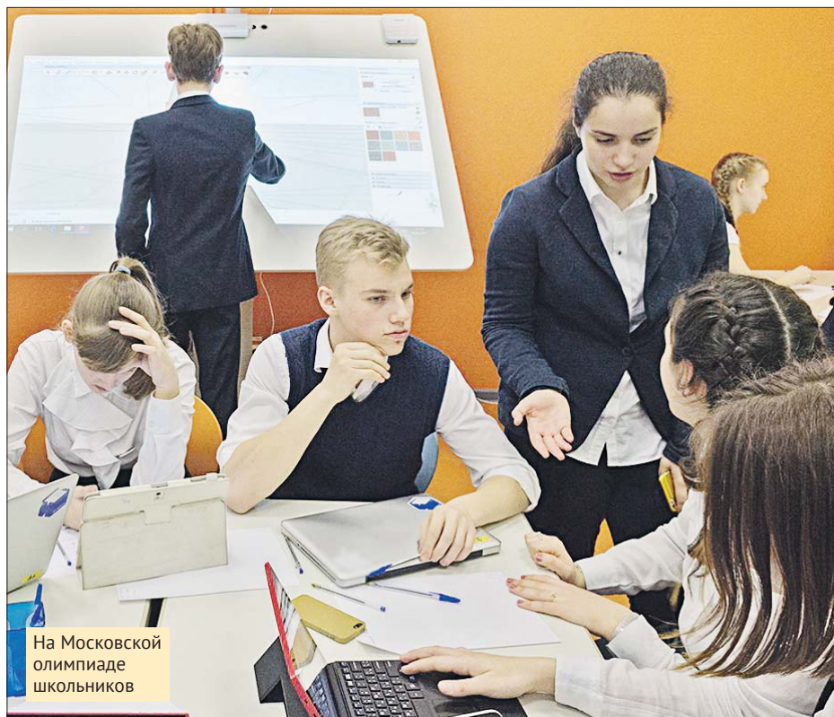
На Московской олимпиаде школьников

В прошлом учебном году в школе №1367 было 12 медалистов, а четыре выпускницы сдали ЕГЭ на 100 баллов. Две девочки получили максимальный результат на ЕГЭ по русскому языку, благодаря чему одна поступила в Высшую школу эконо-