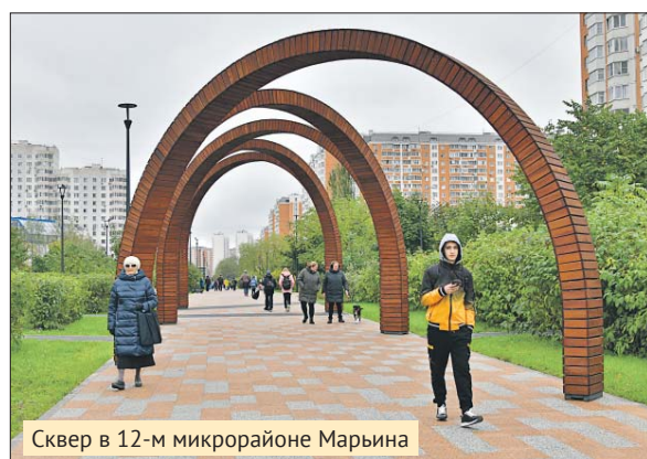
Сквер в 12-м микрорайоне Марьино