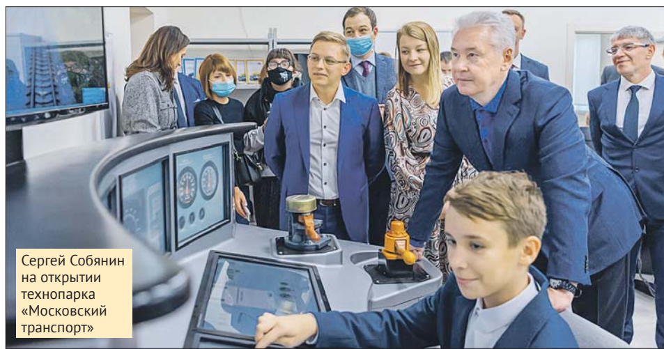
Сергей Собянин на открытии технопарка «Московский транспорт»