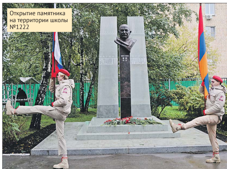
Открытие памятника на территории школы №1222