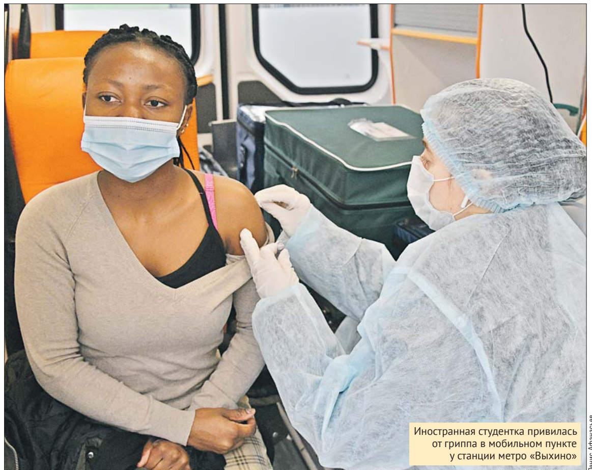
Иностранная студентка привилась от гриппа в мобильном пункте у станции метро «Выхино»

— Совмещать вакцины можно и нужно, потому что они воздействуют на совершенно разные вирусы, — объясняет врач, — но, конечно, делать две прививки одновременно нельзя. Если вы вакцинировались от COVID-19 двухкомпонентной вакциной, то после второй прививки должно пройти 30 дней. И тогда уже можно прививаться от гриппа. Такой же срок — 30 дней — должен пройти после прививки однокомпонентной вакциной.