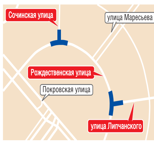
— перекрытие движения