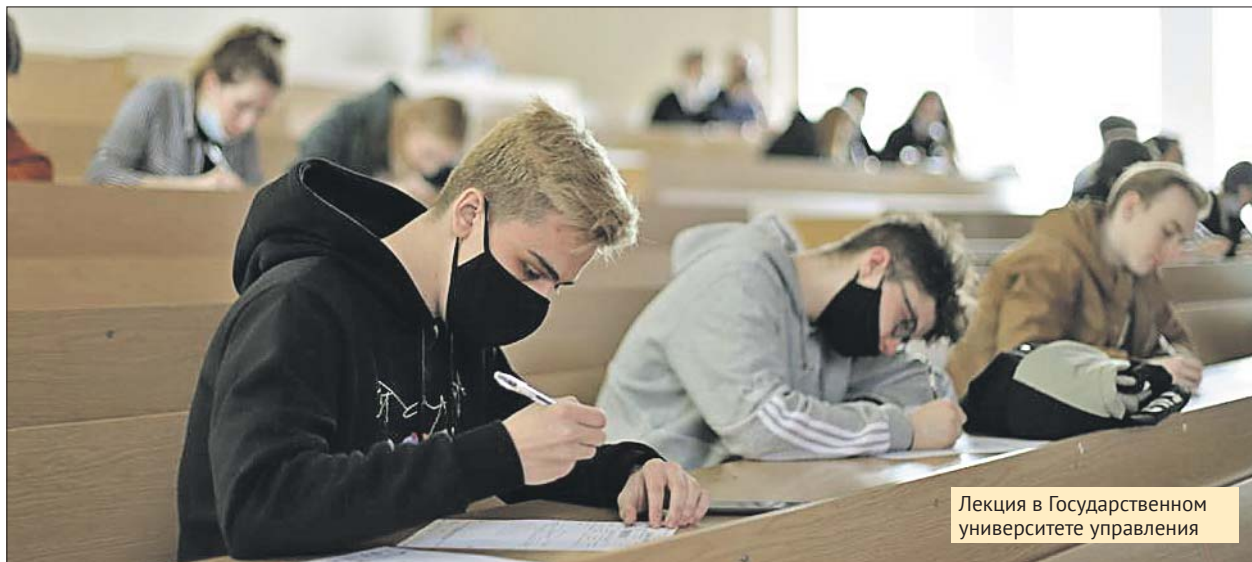
Лекция в Государственном университете управления

Какое высшее образование можно получить в ЮВАО