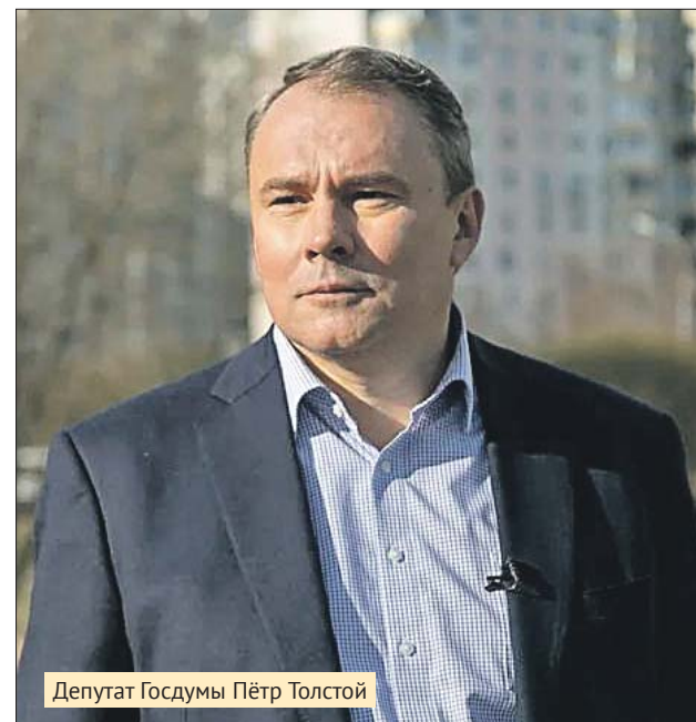
Депутат Госдумы Пётр Толстой

Несколько лет назад на конкурс, предполагающий реконструкцию, было выставлено больше трёх десятков городских кино-