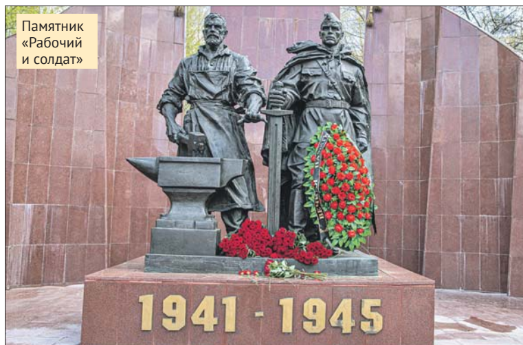
Памятник «Рабочий и солдат»