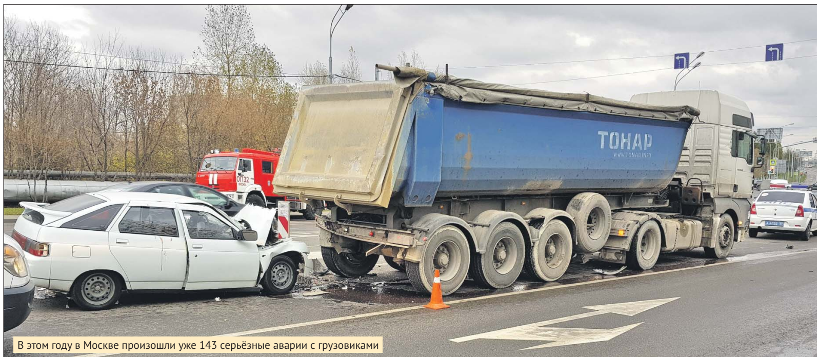
В этом году в Москве произошли уже 143 серьёзные аварии с грузовиками