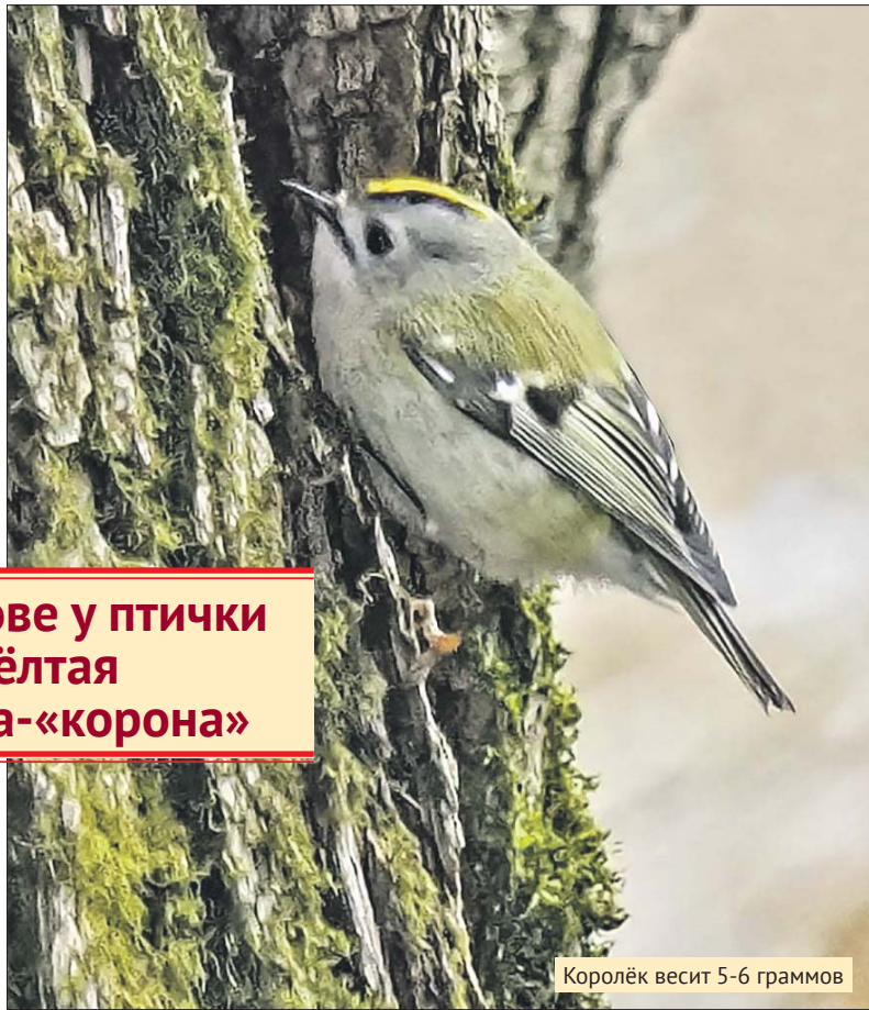
Королёк весит 5-6 граммов