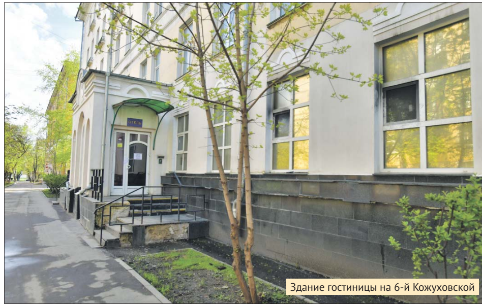
Здание гостиницы на 6-й Кожуховской

К расследованию ЧП подключились Следственный комитет и прокуратура. Как заявила на-