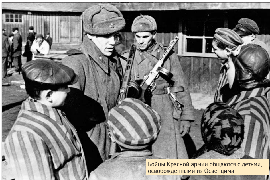
Бойцы Красной армии общаются с детьми, освобождёнными из Освенцима

Пленных погрузили в товарные вагоны без крыш. Долго ехали без воды и пищи. Наконец прибыли в очень большой, обнесённый не-