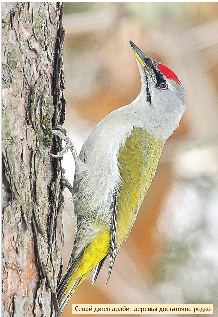
Седой дятел долбит деревья достаточно редко