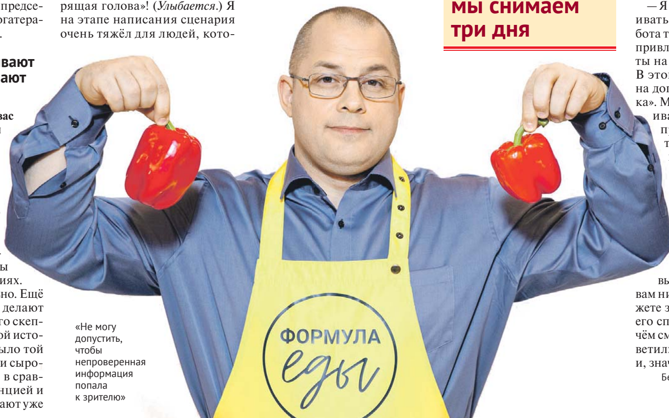
«Не могу допустить, чтобы непроверенная информация попала к зрителю»

Беседовала Валерия Хащевская