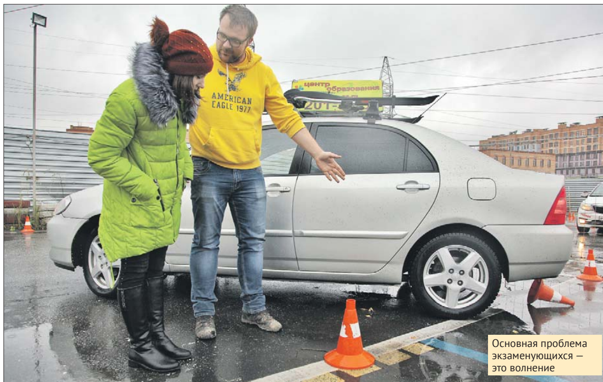
Основная проблема экзаменуемых — это волнение