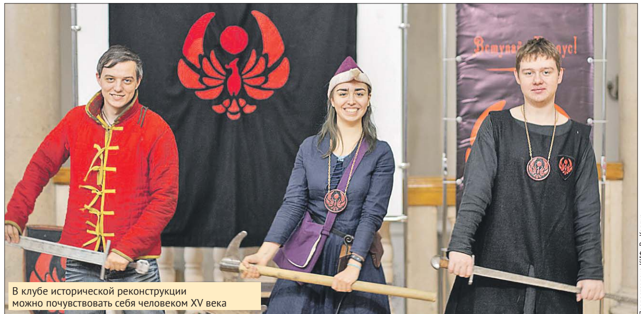
В клубе исторической реконструкции можно почувствовать себя человеком XV века

К луб исторического фехтования и реконструкции «Корпус» в Лефортове отмечает пятилетие и 8 апреля в 19.30 приглашает всех желающих на серию открытых занятий. Можно будет примерить доспехи средневековых воинов, подержать в руках меч и освоить самые простые приёмы фехтования, послушать лекции по истории турниров, узнать о средневековой моде, а также о блюдах.