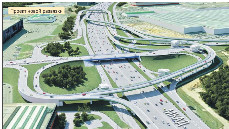
Проект новой развязки

В ближайшие два-три года город приступит к реконструкции ещё четырёх развязок на пересечении МКАД и город-