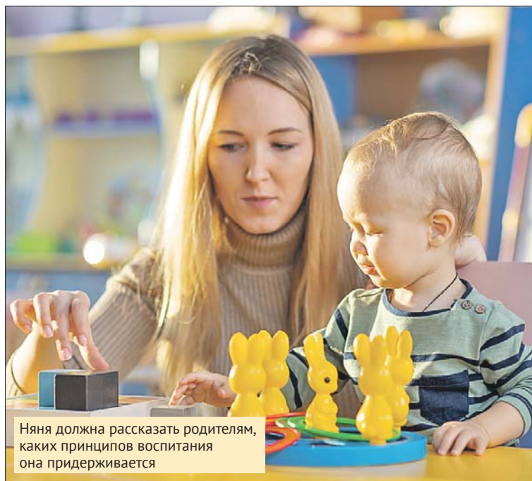
Няня должна рассказать родителям, каких принципов воспитания она придерживается