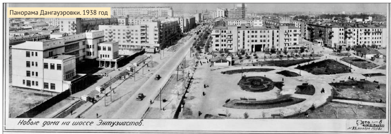
Панорама Дангауэровки. 1938 год