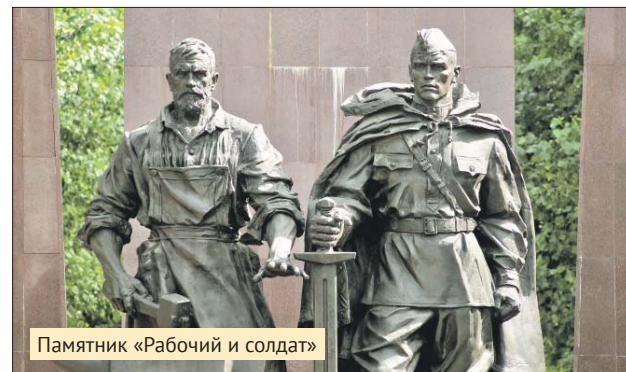
Памятник «Рабочий и солдат»