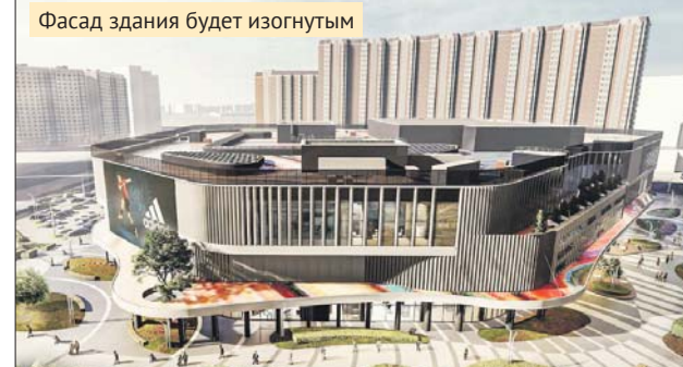
Фасад здания будет изогнутым