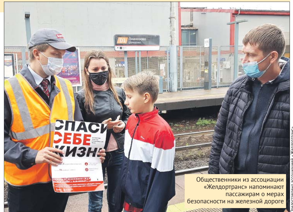
Общественники из ассоциации «Желдортранс» напоминают пассажирам о мерах безопасности на железной дороге

Не ходить по железнодорожным путям — первое