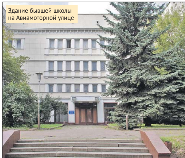
Здание бывшей школы на Авиамоторной улице