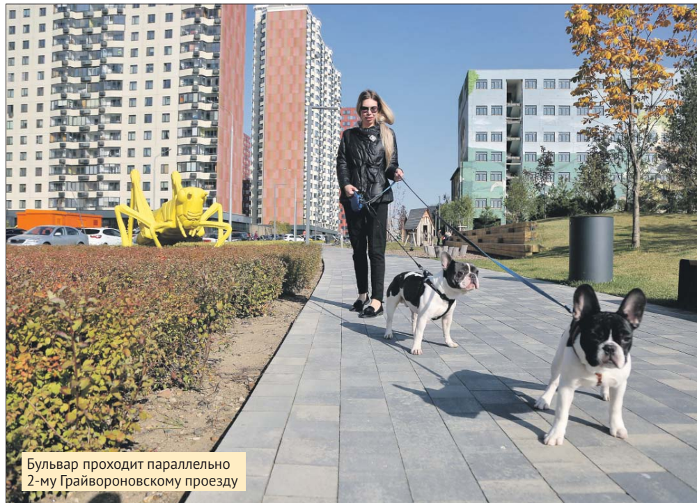
Бульвар проходит параллельно 2-му Грайвороновскому проезду

Первый участок пешеходной зоны был открыт в прошлом году. Тогда на бульваре благоустроили площадку для велосипедистов и катания на скейте. Сейчас на новом участ-