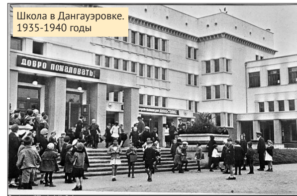
Школа в Дангауэровке. 1935-1940 годы