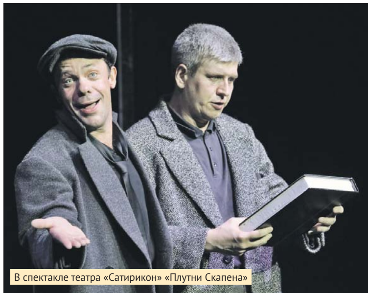
В спектакле театра «Сатирикон» «Плутни Скапена»

— В спектакле «Плутни Скапена» вы лихо выдаёте дробь на