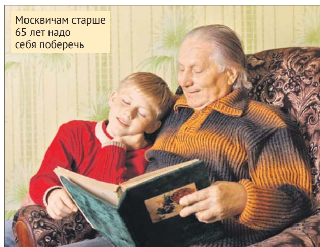
Москвичам старше 65 лет надо себя поберечь

Всем нам очень не хочется возвращаться к жёстким ограничениям нынешней весны. Надеюсь, что мы сможем избежать этого. Но только если будем беречь себя и близких нам людей.