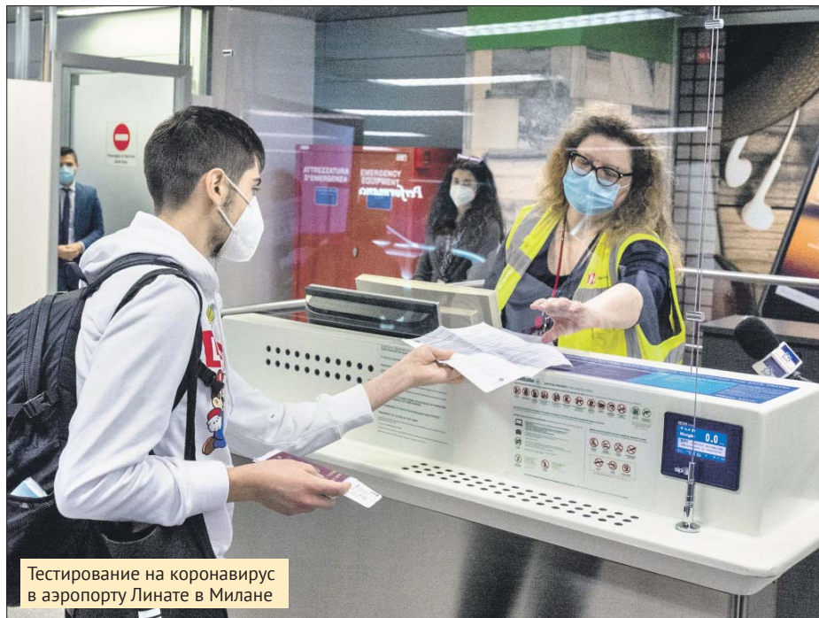
Тестирование на коронавирус в аэропорту Линате в Милане

Не замедляются темпы распространения заболевания в Южной Азии. По данным Национального центра по контролю за заболеваниями Индии, антитела выявлены у 23,48% жителей Нью-Дели. Значит, как минимум бес-