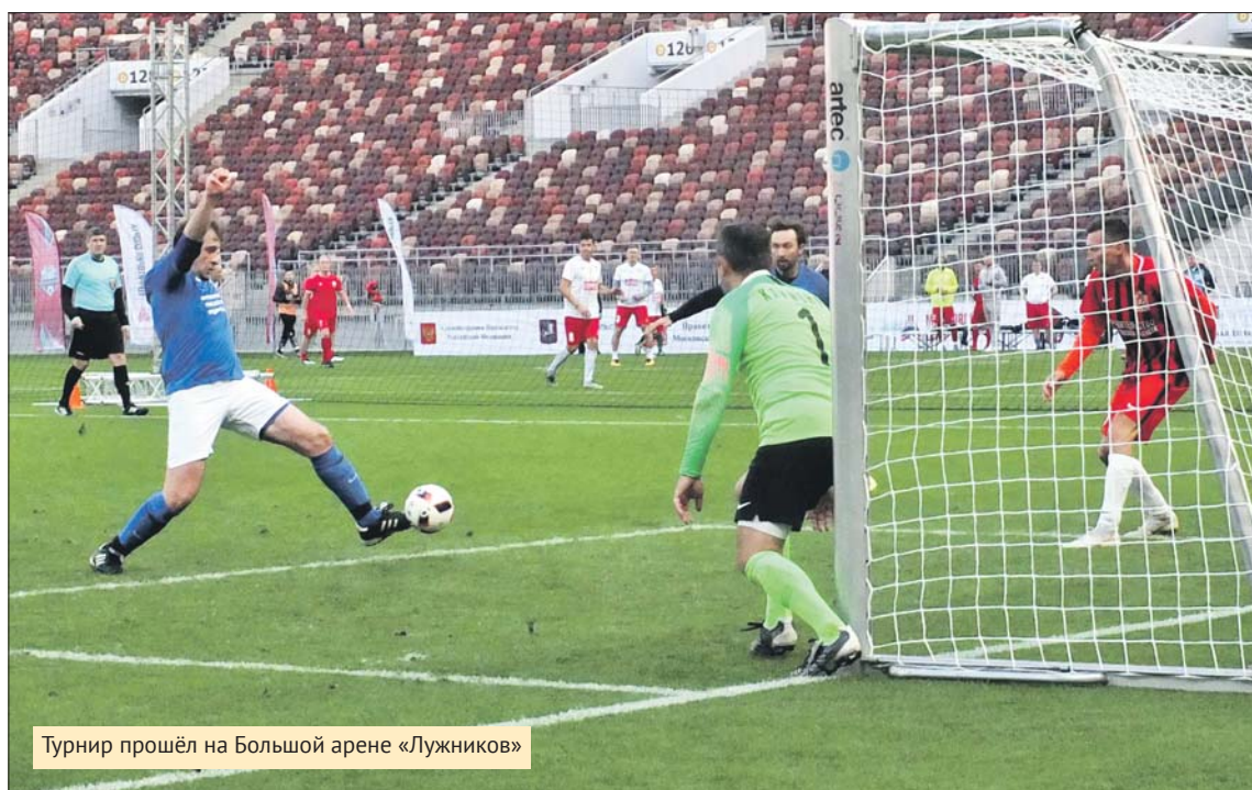
Турнир прошёл на Большой арене «Лужников»