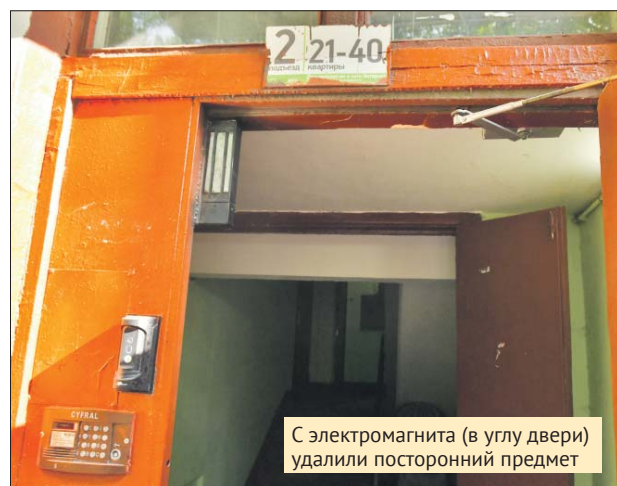
С электромагнита (в углу двери) удалили посторонний предмет

ВСЕ НОВОСТИ ОКРУГА ЕЖЕДНЕВНО НА САЙТЕ WWW.UV-KURIER.RU