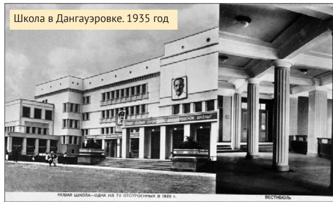
Школа в Дангауэровке. 1935 год