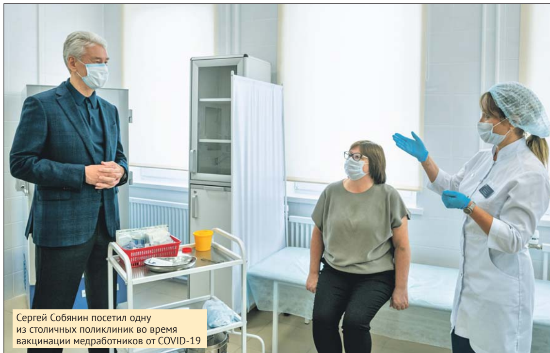
Сергей Собянин посетил одну из столичных поликлиник во время вакцинации медработников от COVID-19

Москва за период пандемии накопила большой опыт, кото-