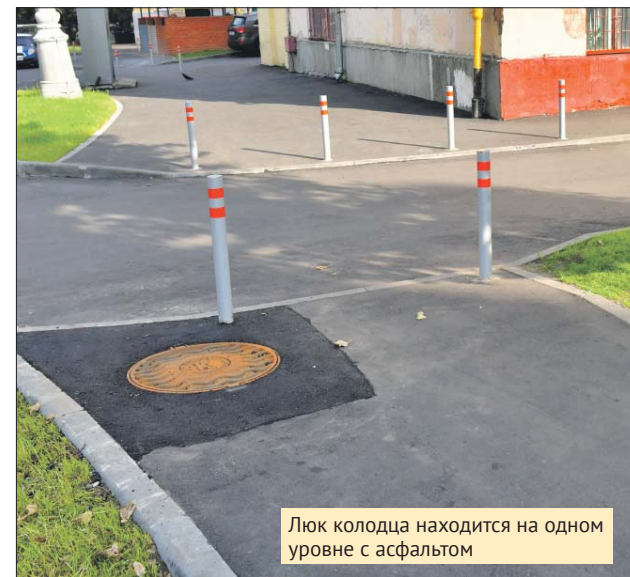
Люк колодца находится на одном уровне с асфальтом

ГБУ «Жилищник района Лефортово»: ул. 2-я Кабельная, 4, тел./факс (495) 362-2387. Эл. почта: oolefortovo@mail.ru . Сайт: lefortovo.uvaogbu.ru