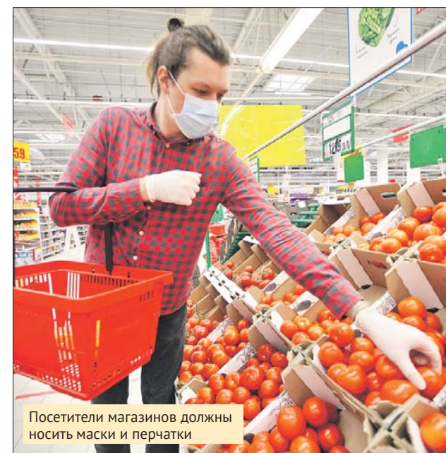
Посетители магазинов должны носить маски и перчатки

— Установлено, что среди лиц, использовавших средства защиты, количество инфицированных