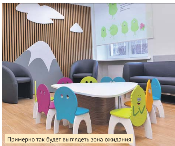
Примерно так будет выглядеть зона ожидания