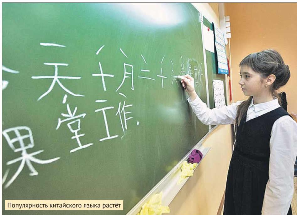
Популярность китайского языка растёт

В школе №1359 им. авиаконструктора М.Л.Миля на Пронской улице преподают два иностранных языка —