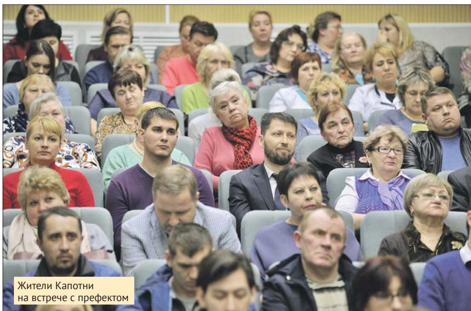
Жители Капотни на встрече с префектом

Он также обратил внимание, что восстановление памятников особенно важно для воспитания молодёжи. Префект взял вопрос под личный контроль и заверил жителей, что реконструкция завершится к 75-й годовщине Победы.