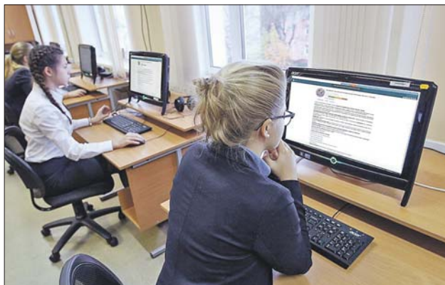
Главной темой олимпиады станет 75-летие Победы