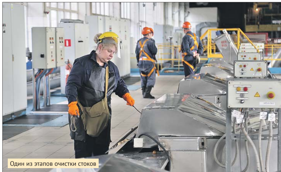
Один из этапов очистки стоков

Затем стоки проходят через установки, называемые песколовками. На этой стадии из воды удаляют песок, глинистые частицы, растворы минеральных солей. Во время биологической обработки стоки очищают от азота и фосфора. Роль санитаров выполняют специальные микроорганизмы.