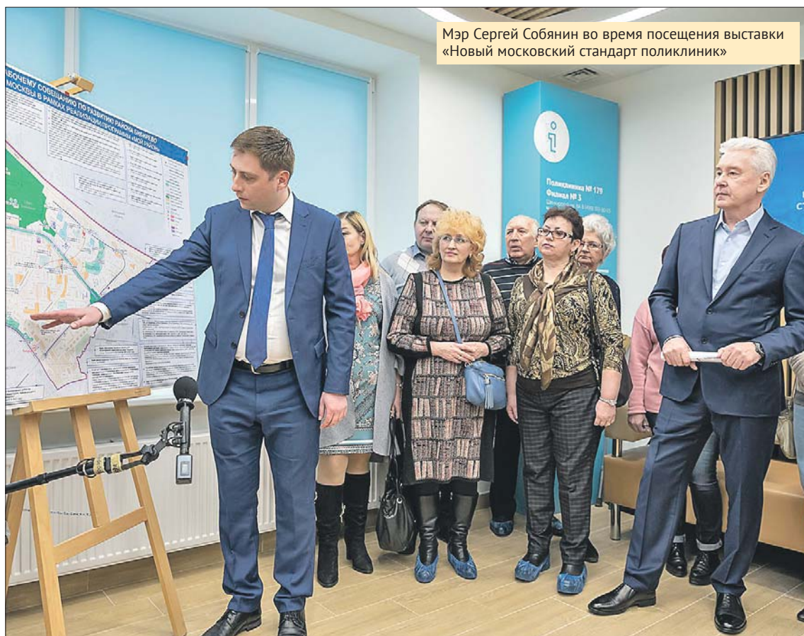
Мэр Сергей Собянин во время посещения выставки «Новый московский стандарт поликлиник»