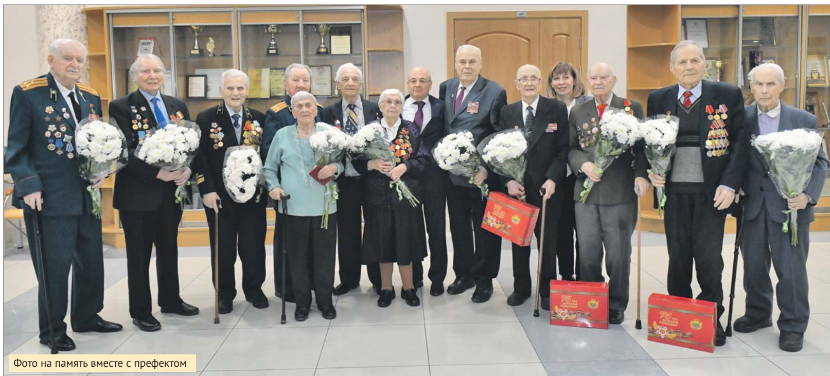
Фото на память вместе с префектом