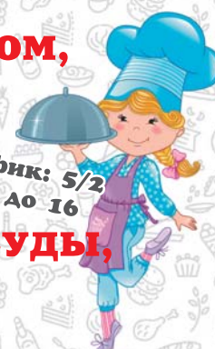
График: 5/2 с 7 до 16