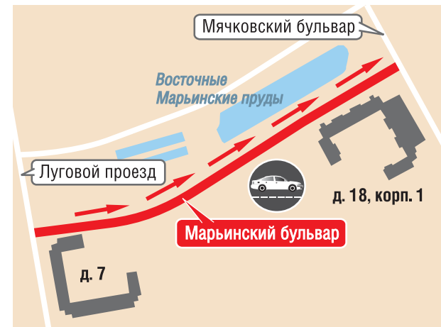
— одностороннее движение