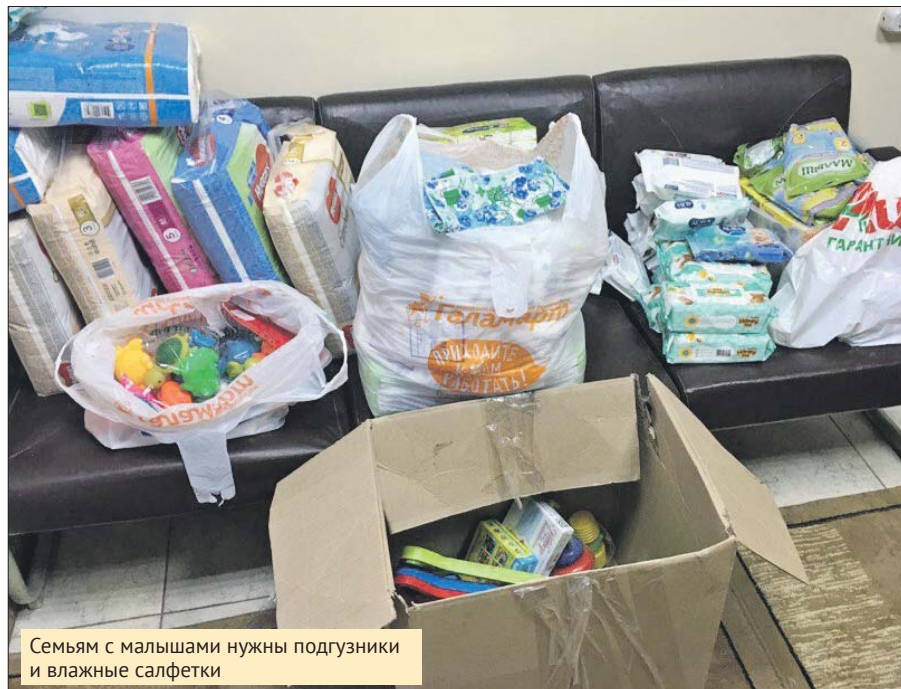
Семьям с малышами нужны подгузники и влажные салфетки

ли небольшими выплатами, которых не хватает. Появилось много обращений от мам из соседних Люберец. Фонд также помогает и многодетным семьям, где все расходы автоматически умножаются, и одиноким мамам, которые вынуждены покупать всё сами — от подгузников до зимней одежды.