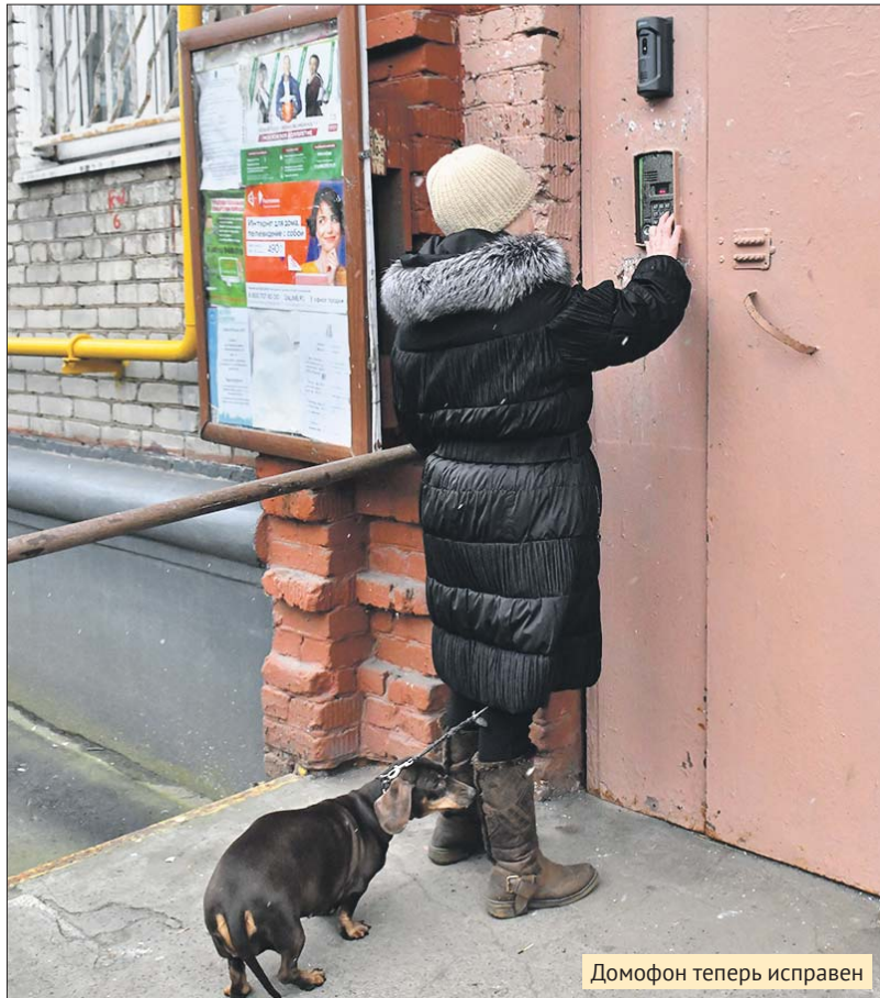
Домофон теперь исправен

ГБУ «Жилищник Рязанского района»: ул. 1-я Новокузьминская, 10, тел. (495) 378-0802. Эл. почта: gbu.ryazanka@yandex.ru