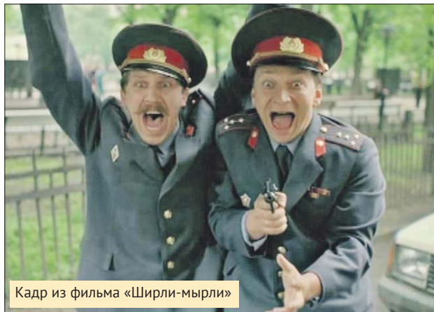
Кадр из фильма «Ширли-мырли»

ло. Это же не павильон, где выстроены декорации и гримёрки: все приготовления — на улице. Вся съёмочная группа во время съёмок в интерьерах дворцов ходила в тапочках, чтобы не испачкались полы, кроме героев в кадре. Больше всего меня впечатлил Екатерининский дворец, там такая красота! А вот в Гатчинском дворце внутри мы не снимали, потому что там музей и трудные интерьеры, довольствовались территорией около дворца. Я был в историческом костюме и в парике, пока переоденешься — обед пройдёт. Поэтому решил использовать этот час для