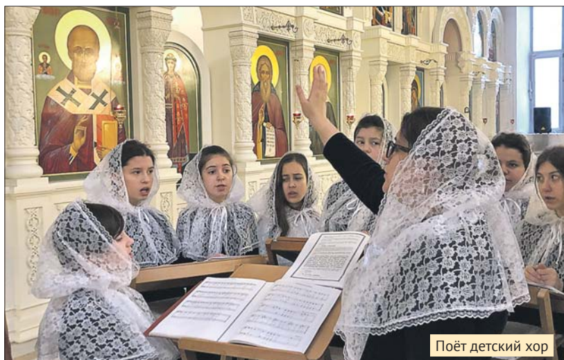
Поёт детский хор