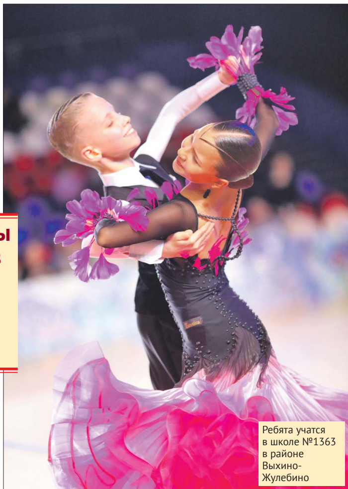
Ребята учатся в школе №1363 в районе Выхино-Жулебино