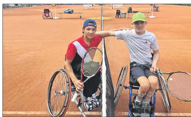
Спортивной подготовки и навыков не требуется, главное — желание

Занятия в секции будут проходить в теннисном парке по адресу: Рязанский просп., 4. Уроки бесплатные, кроме того, фонд