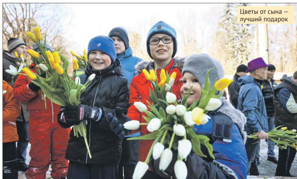
Цветы от сына – лучший подарок

В культурном центре «Лидер» (Лермонтовский просп., 2, корп. 2) 5 марта в 17.00 начнётся концертная программа «Музыка весны». Для женщин прозвучат поздравления от студии