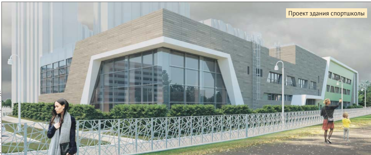
Проект здания спортшколы