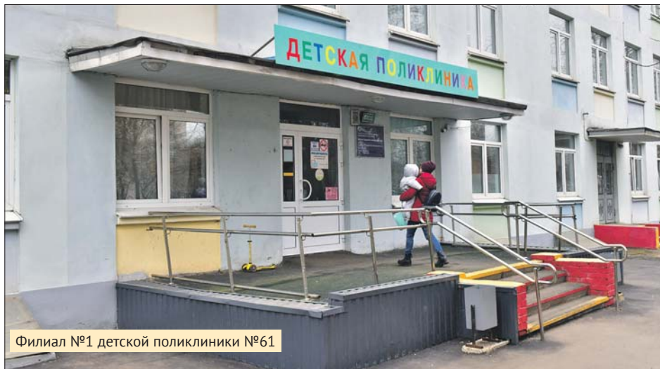
Филиал №1 детской поликлиники №61

В филиале №1 детской городской поликлиники №61, расположенном по адресу: ул. Полбина, 50, последний день приёма врачей будет 20 марта , а последний день приёма дежурного врача — 27 марта .