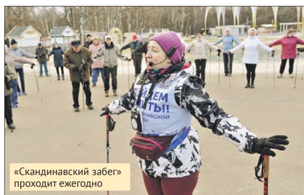
«Скандинавский забег» проходит ежегодно

пытаниях. На музыкальной станции участники должны будут исполнить любимые песни о весне. На танцевальной станции «Летающей походкой» — продемонстрировать свои навыки в разных танцевальных направлениях. Коллективное творчество ждёт участников на станции «Весенний цветок». На станции «Коробка с сюрпризом» участникам