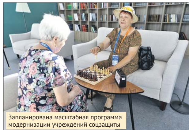
Запланирована масштабная программа модернизации учреждений соцзащиты

партии «Яблоко», Сергей Митрохин, внёс порядка 20 поправок, половина из которых были учтены и приняты, — сказал политолог.