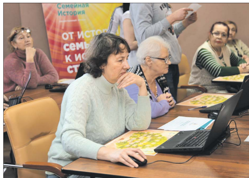
Участники онлайн-тестирования отвечают на вопросы