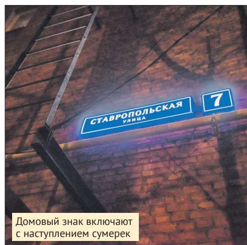
Домовый знак включают с наступлением сумерек