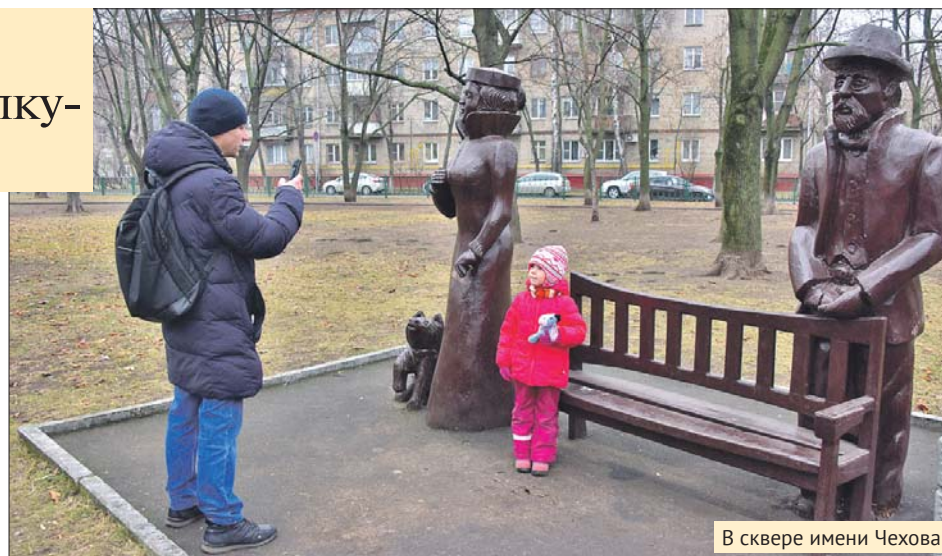
В сквере имени Чехова