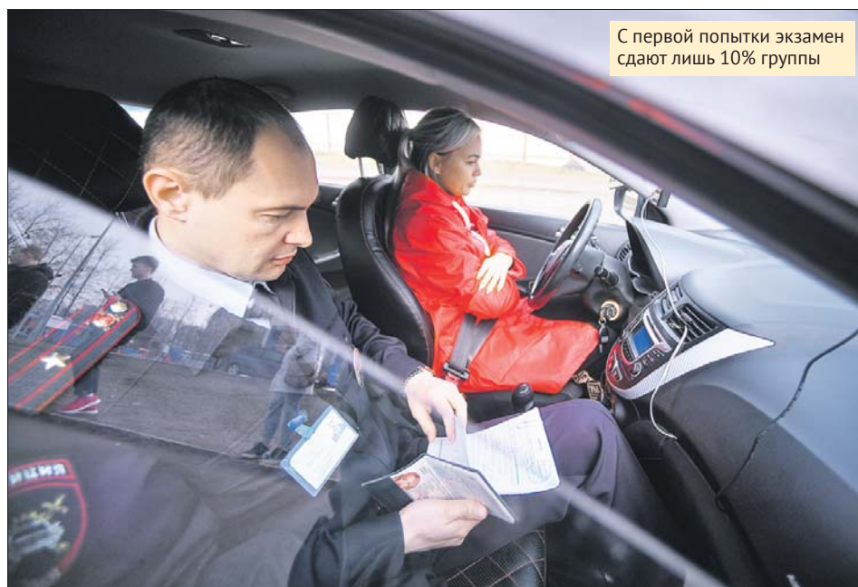
С первой попытки экзамен сдают лишь 10% группы

Похожие показатели мне назвали в одном из экзаменационных подразделений ГИБДД. С первой попытки сдают всё лишь 10% или меньше. Четверть всех претендентов получают права со второго захода. Большинство приходит на экзамены три раза. Остальные — а это чуть меньше трети — сдают оставшиеся части экзамена с четвёртого, пятого или с шестого раза. Правда, в ГИБДД помнят человека, кото-