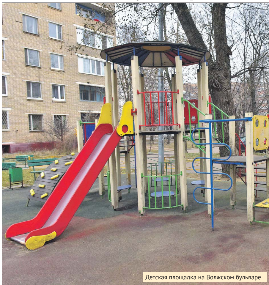
Детская площадка на Волжском бульваре

ГБУ «Автомобильные дороги ЮВАО»: (495) 351-1991. Эл. почта: avd-uvao@mail.ru , office@avtodor-uvao.ru