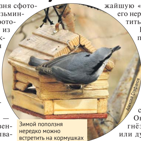
Зимой поползнь нередко можно встретить на кормушках