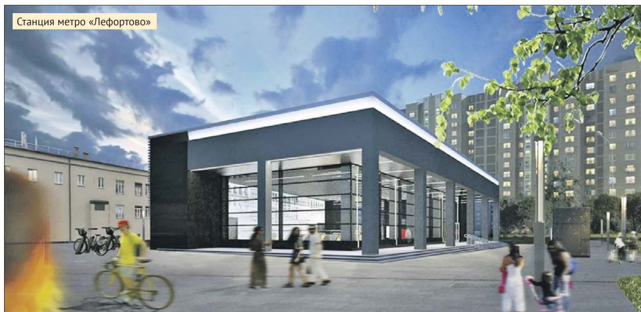
Станция метро «Лефортовое»

Он сообщил, что полностью обеспечены фи-