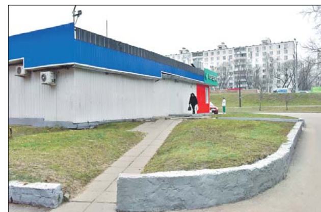
Подпорную стенку отремонтировали