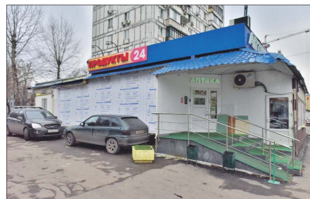
Пристроенные помещения демонтировали