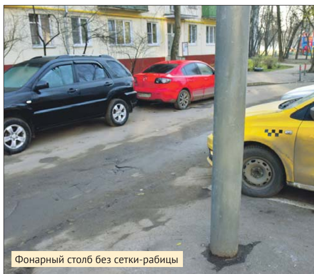
Фонарный столб без сетки-рабицы

ГБУ «Жилищник района Кузьминки»: Волгоградский просп., 130, корп. 3; ул. Фёдора Полетаева, 32, корп. 6, тел. (495) 379-8636. Сайт: kuzminki.uvaogbu.ru