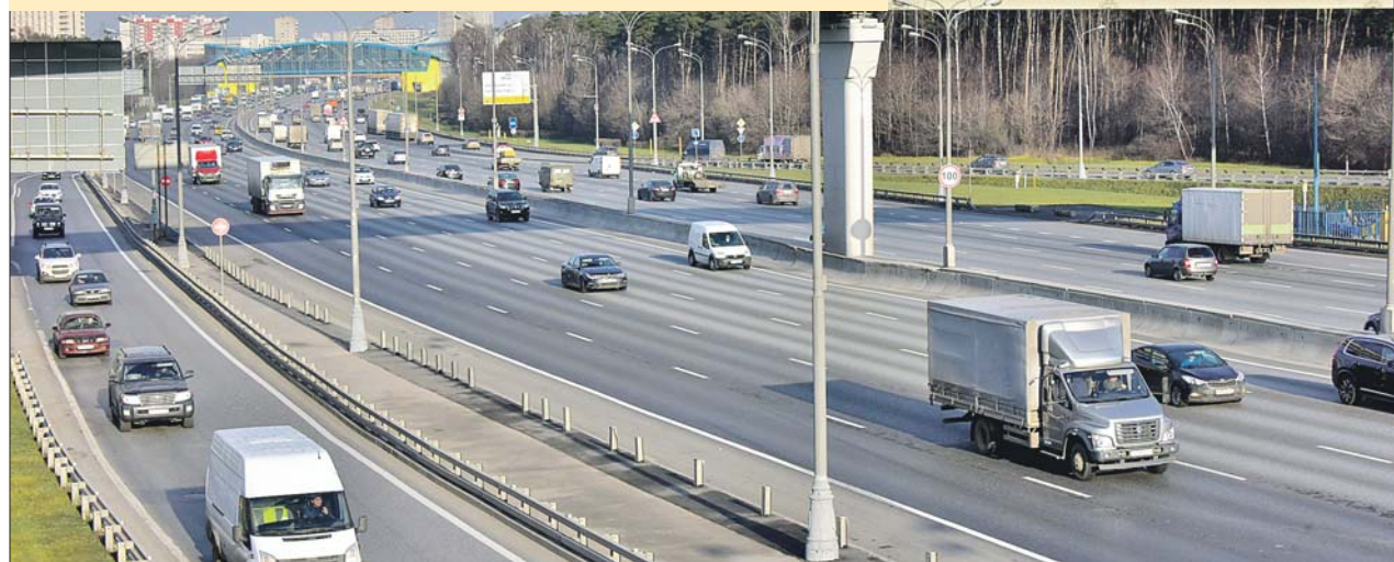
Высокие показатели аварийности объясняются тем, что в статистику включены ДТП на МКАД

ГИБДД составила рейтинг самых аварийных районов города