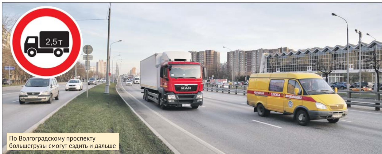
По Волгоградскому проспекту большегрузы смогут ездить и дальше

Н ачиная с 1 декабря в Юго-Восточном округе введут особый режим движения по улицам грузовых автомобилей. Об этом сообщили в городском Центре организации дорожного движения (ЦОДД). — Грузовики смогут транзитно передвигаться только по крупным улицам, например по Рязанскому или Волгоградскому проспектам, шоссе