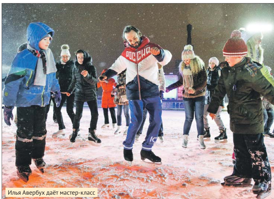
Илья Авербух даёт мастер-класс

Сейчас спорт настолько усложнился, что подготовка начинается в 3,5 года