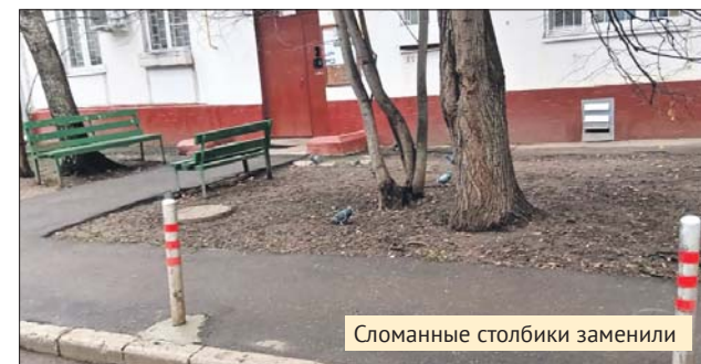
Сломанные столбики заменили