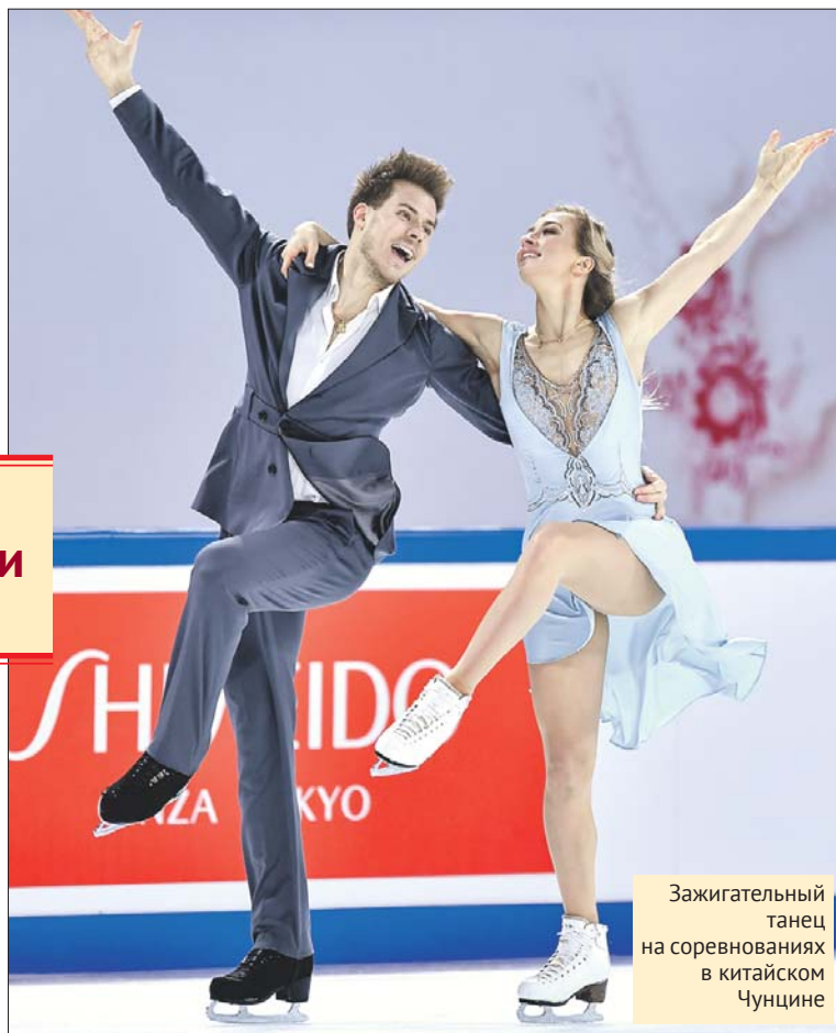
Зажигательный танец на соревнованиях в китайском Чунцине

там сезона мы будем в той форме, в которой сможем бороться с любым соперником, — говорит он.