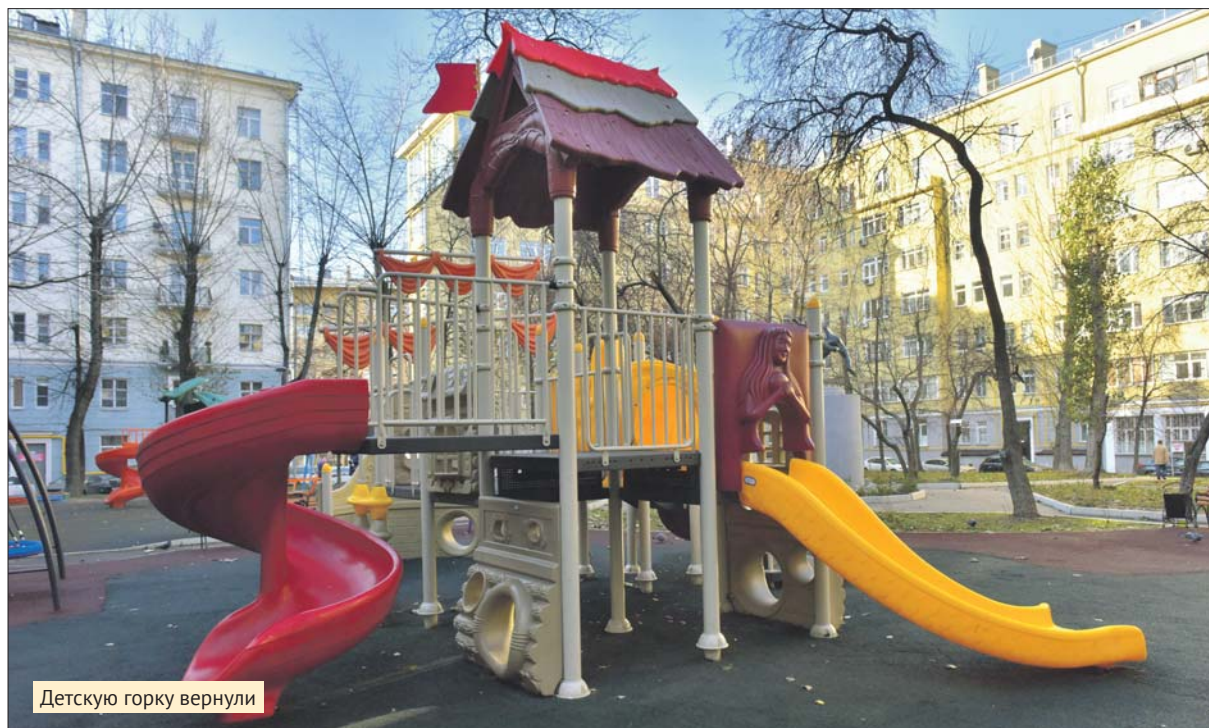
Детскую горку вернули