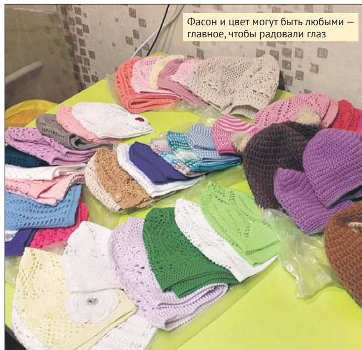
Фасон и цвет могут быть любыми — главное, чтобы радовали глаз