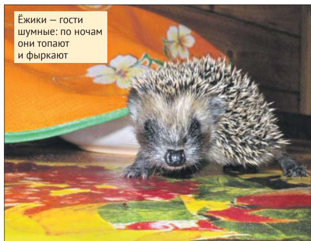
Ёжики — гости шумные: по ночам они топают и фыркают