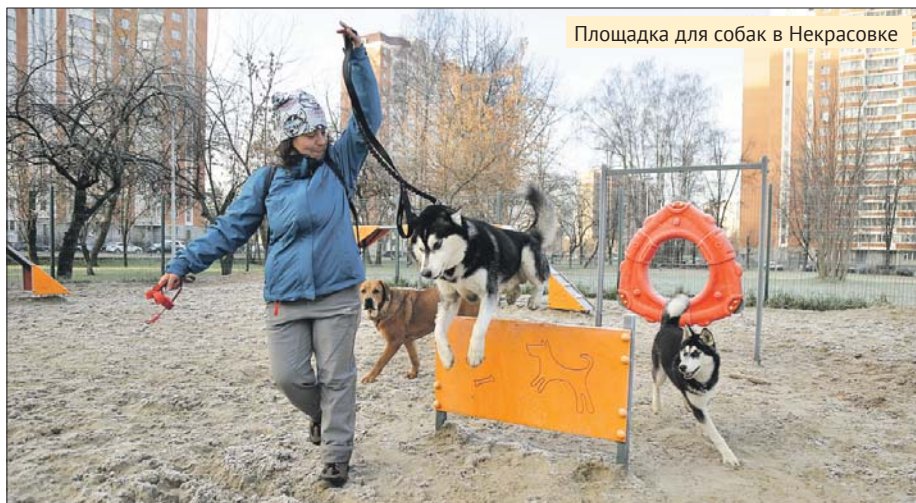
Площадка для собак в Некрасовке