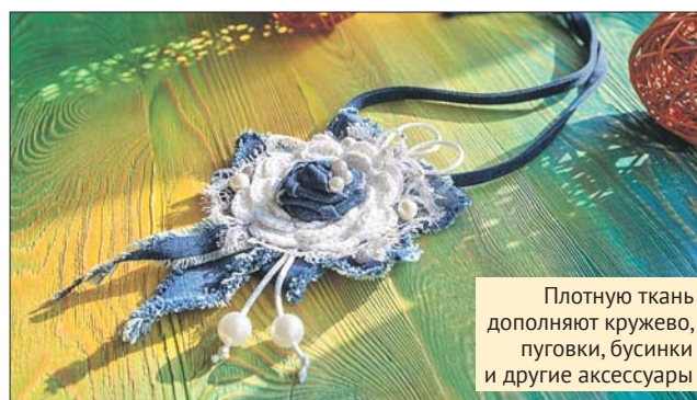
Плотную ткань дополняют кружево, пуговицы, бусинки и другие аксессуары

Обязательна регистрация по тел. (495) 658-0859