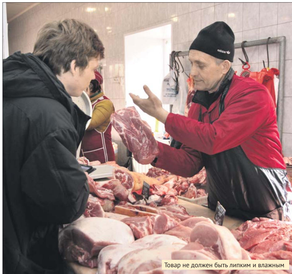
Товар не должен быть липким и влажным