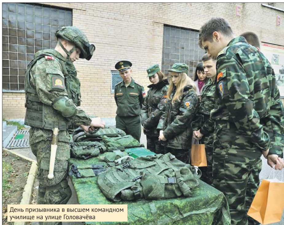
День призывника в высшем командном училище на улице Головачёва

Подводя итоги обсуждению данной темы на координационном совещании по оператив-