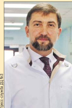
Пресс-служба ДЦ №3

Никотиновое опьянение не столь пагубно для психики человека, как алкогольное, но не менее вредно для тела. Вдыхаемые курильщиком сажа и копоть, которые образуются при тлении табака, способствуют возникновению рака лёгких или в лучшем случае — хронического бронхита, что тоже не подарок. Табакокурение приводит к поражению сосудов головного мозга и нижних конечностей, что завершается инсультом или ампутацией ног.