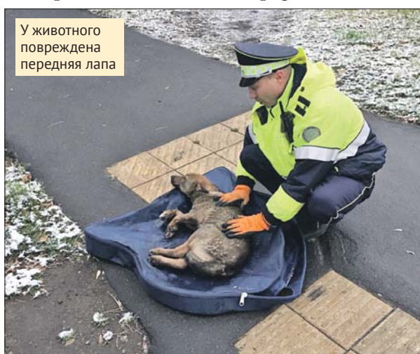
У животного повреждена передняя лапа