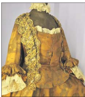
Складка сзади позволяет менять размер платья

Некоторые предметы появились в музее удивительным образом.