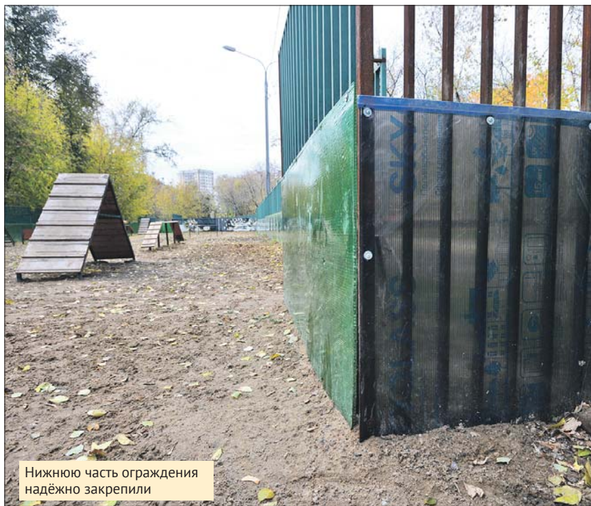
Нижнюю часть ограждения надёжно закрепили