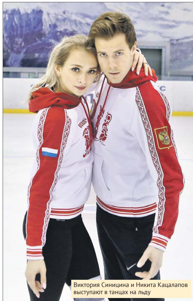
Виктория Синицина и Никита Кацалапов выступают в танцах на льду