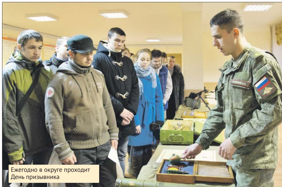
Ежегодно в округе проходит День призывника

— Перед отправкой выдадут обмундирование. Во время пути к ча-