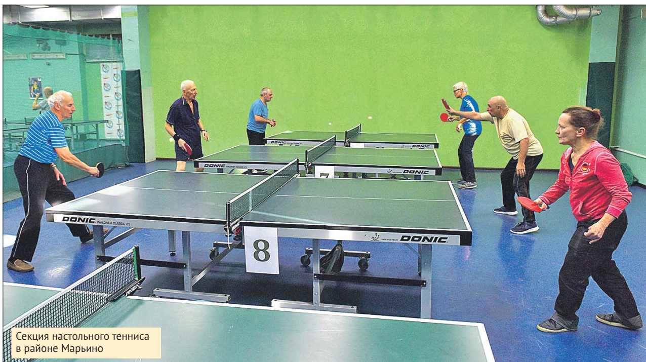
Секция настольного тенниса в районе Марьино