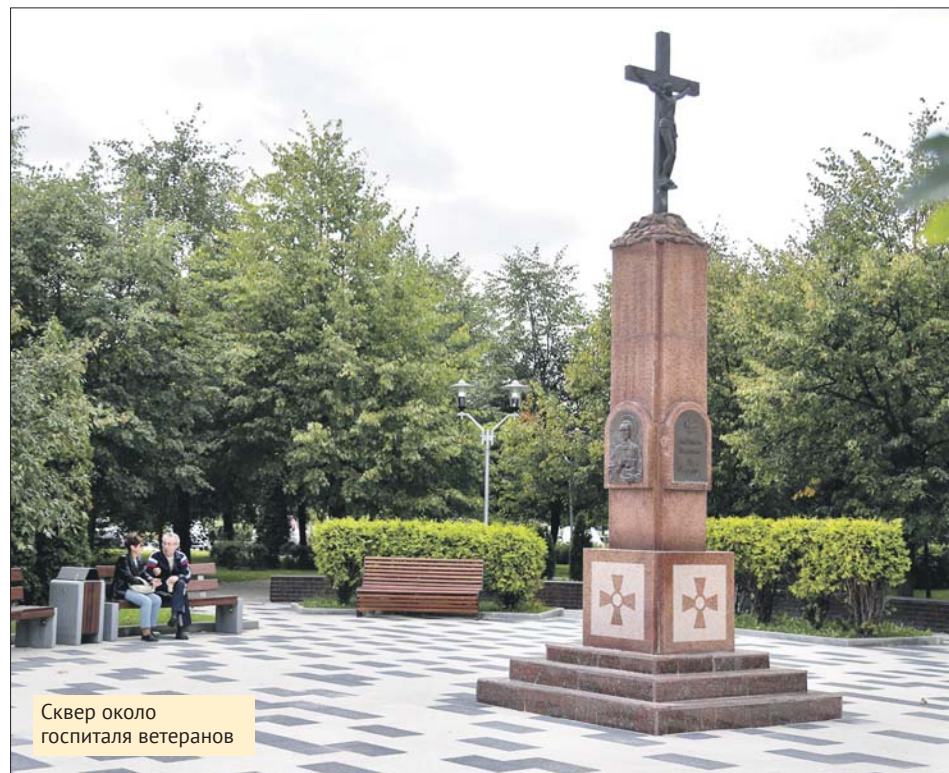
Сквер около госпиталя ветеранов