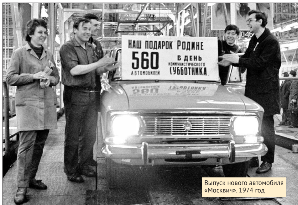
Выпуск нового автомобиля «Москвич». 1974 год

Это потом я понял, что лучшая школа в журналистике — именно практика и именно в газетах некружных, где все умеют всё и где написать любой