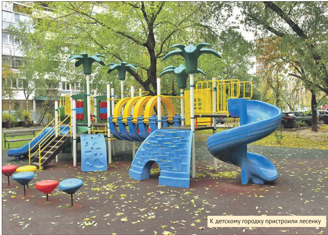
К детскому городку пристроили лесенку

Управа района Южнопортовый: ул. Трофимова, 27, корп. 1, тел. (495) 958-7899 (приёмная главы управы). Эл. почта: uzh_sekretar@uvao.mos.ru . Сайт: uzhnoport.mos.ru