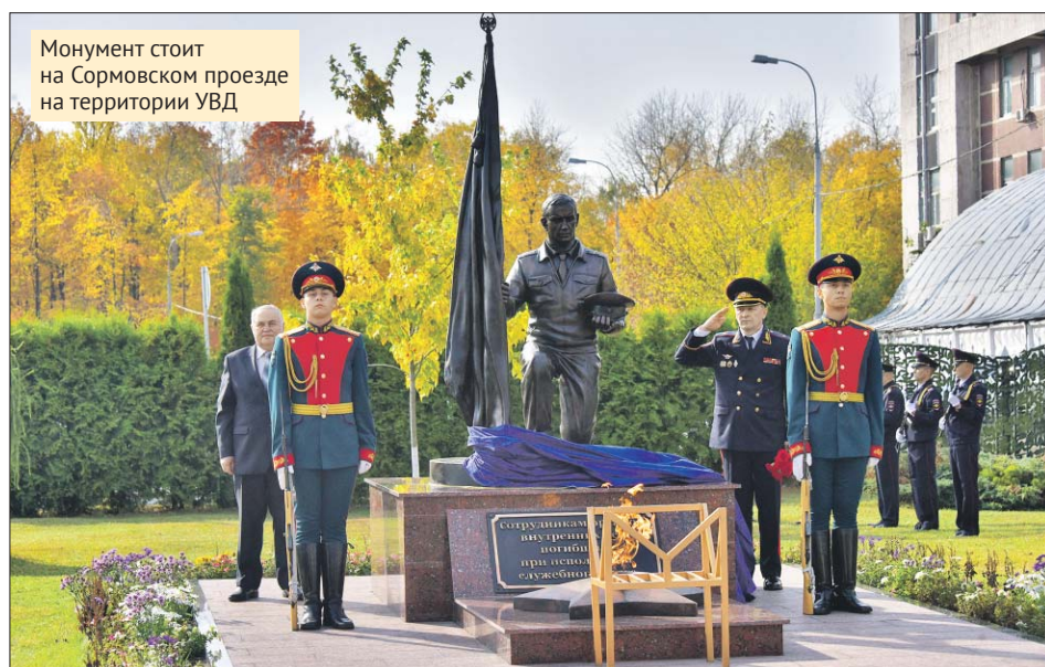
Монумент стоит на Сормовском проезде на территории УВД