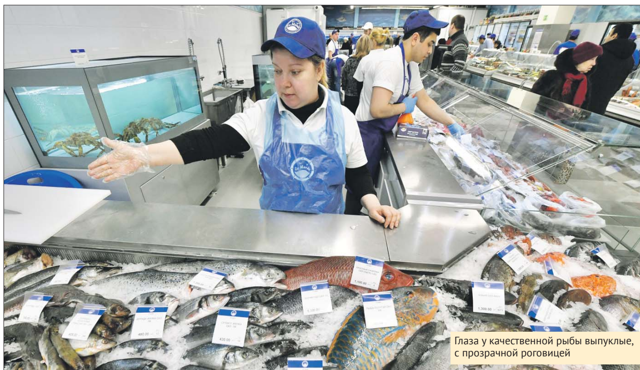
Глаза у качественной рыбы выпуклые, с прозрачной роговицей

Выбирая рыбу, обратите внимание на её глаза: они должны быть выпу-