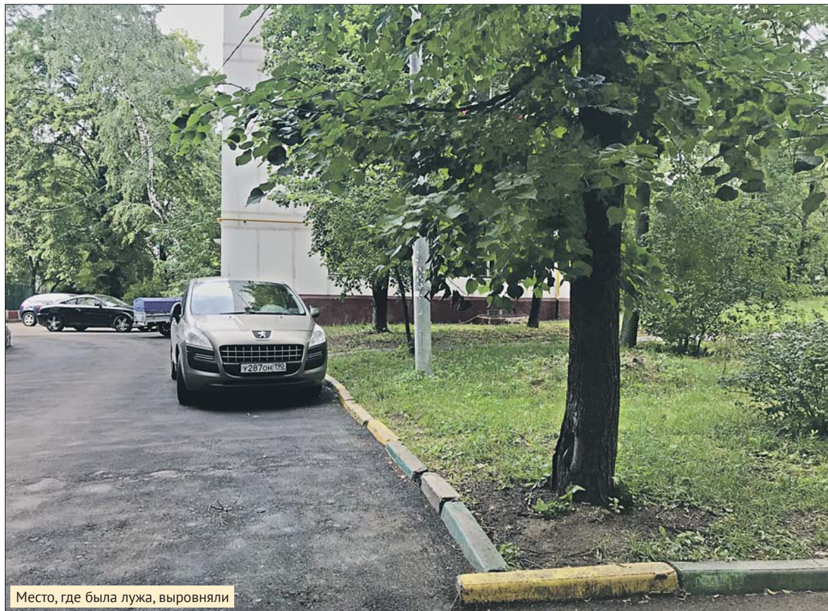
Место, где была лужа, выровняли