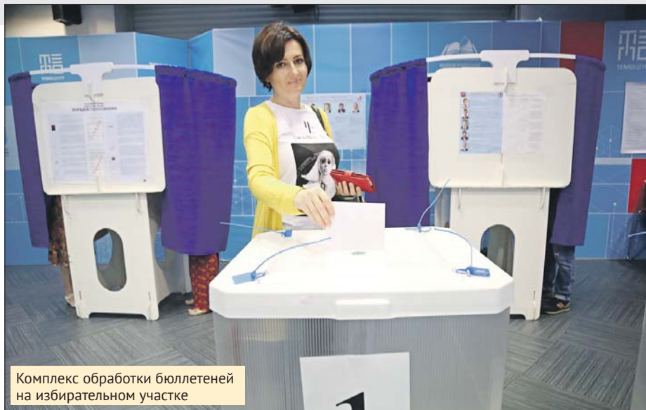
Комплекс обработки бюллетеней на избирательном участке

Громкие скандальные заявления и акции на выборах — скорее правило,