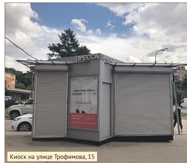
Киоск на улице Трофимова, 15