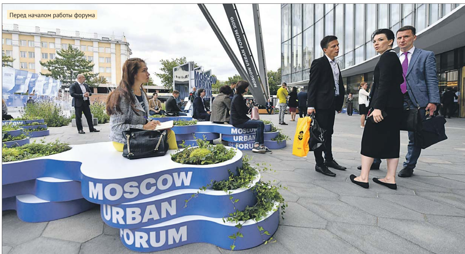
Перед началом работы форума