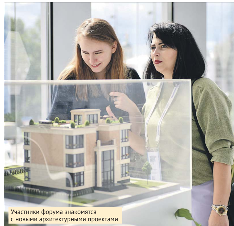
Участники форума знакомятся с новыми архитектурными проектами