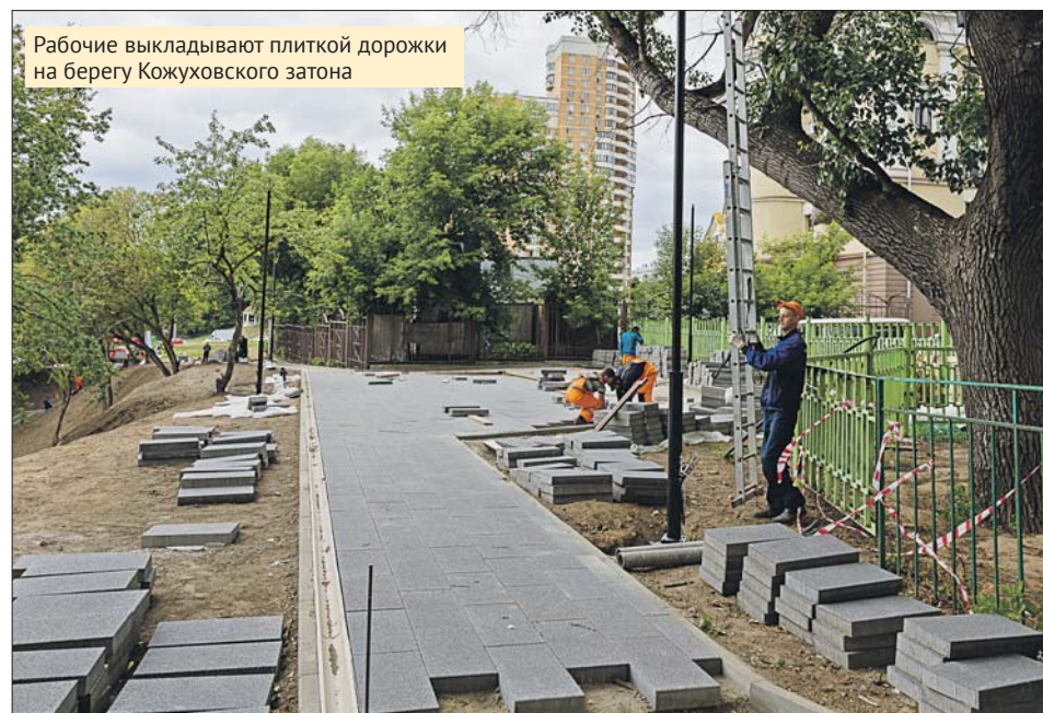
Рабочие выкладывают плиткой дорожки на берегу Кожуховского затона