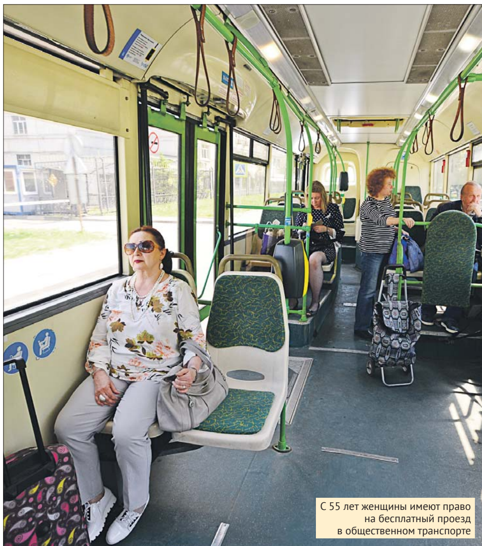
С 55 лет женщины имеют право на бесплатный проезд в общественном транспорте

Какие льготы положены предпенсионерам и с какого возраста