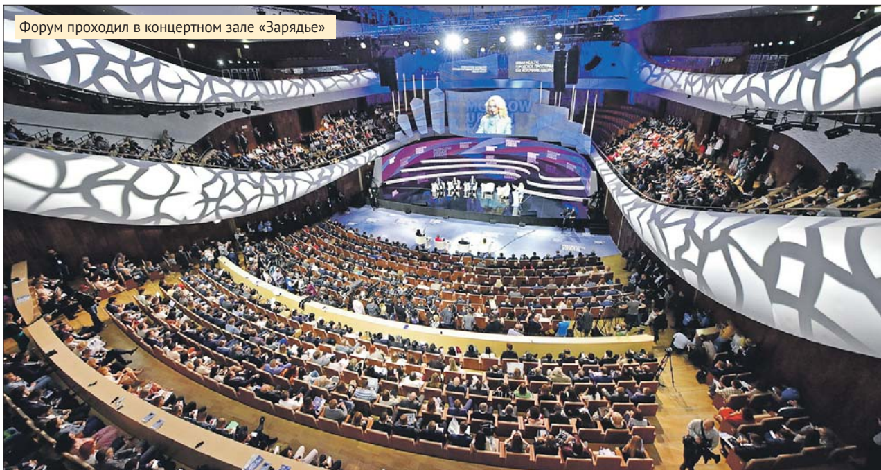
Форум проходил в концертном зале «Зарядье»

Продолжительность жизни в городах растёт с большей динамикой, чем в сельской местности