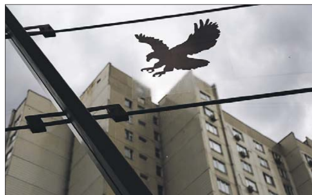
Наклейка на стекле вестибюля метро «Жулебино»

ПИШИТЕ НАМ: uvkurier@mail.ru redaktor-2017@yandex.ru ЗВОНИТЕ: (495) 681-3645