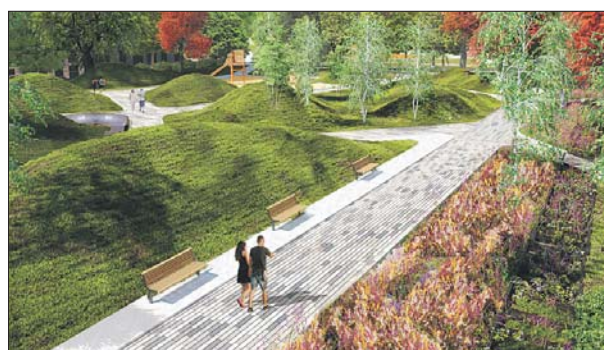
Проект нового парка в Рязанском районе

Аналогичные парки, созданные на месте про-