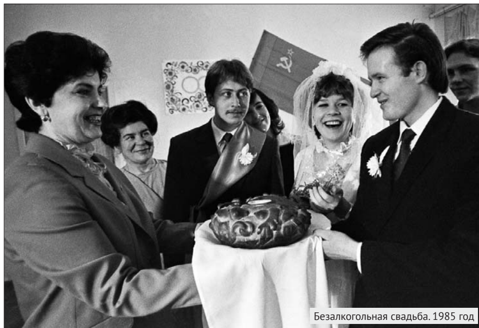
Безалкогольная свадьба. 1985 год

В фойе были накрыты столы. Главный стол, за которым сидели не жених с невестой и не их родственники, а партийное руководство завода, которое и устраивало свадьбу, был накрыт красным ку-