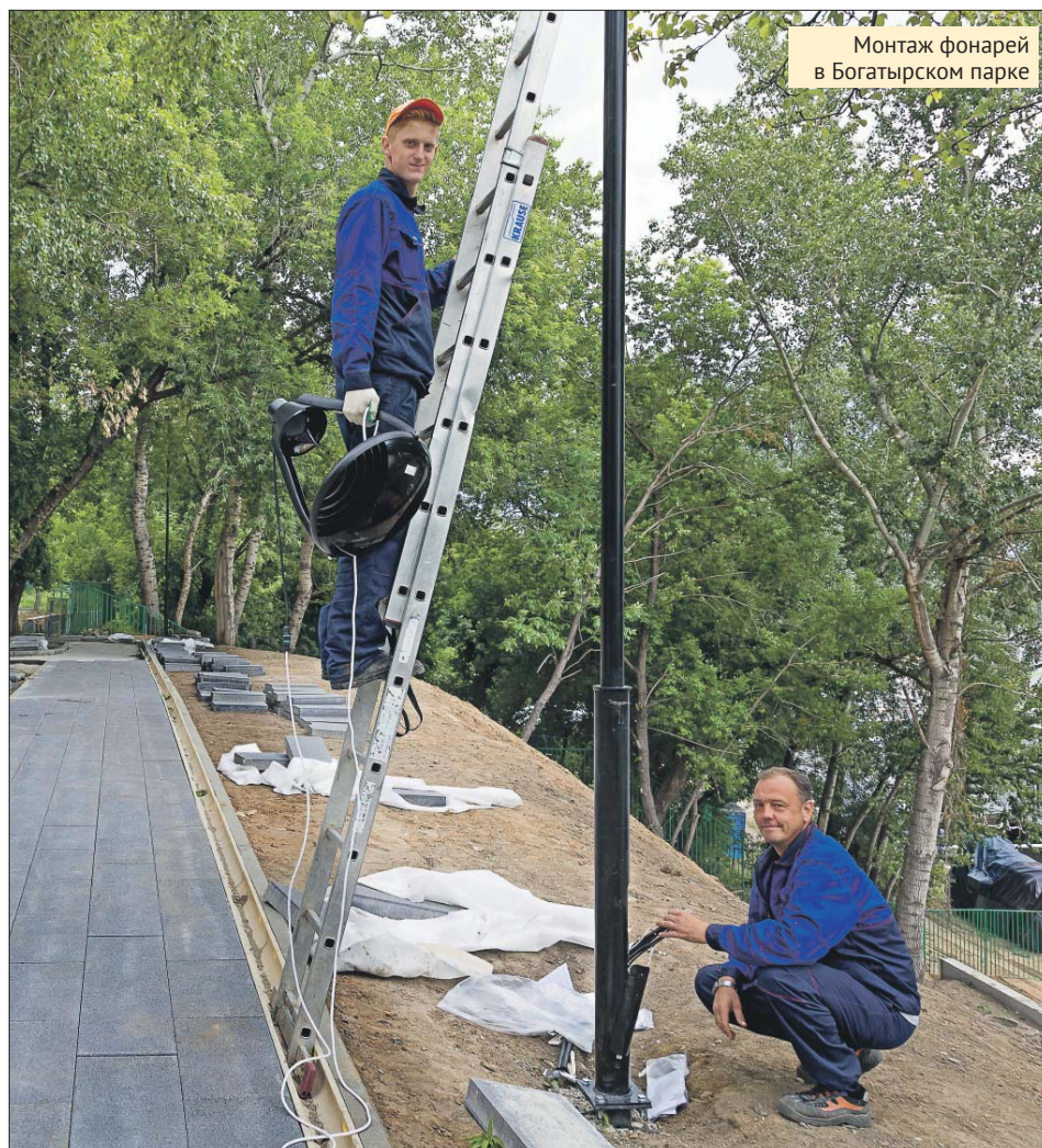
Монтаж фонарей в Богатырском парке

Зелёная зона появится здесь уже к середине июля. Прогулочные до-