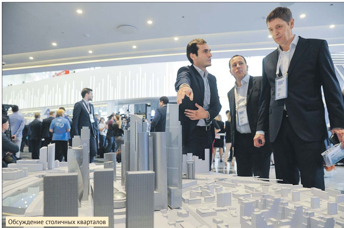
Обсуждение столичных кварталов