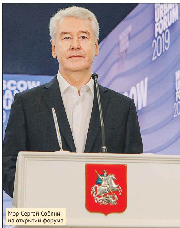
Мэр Сергей Собянин на открытии форума

По мнению мэра, город прошёл стадию индустриального развития: экономика стала экономикой услуг. В этой ситуации появилась необходимость инвестировать прежде всего не в станки, а в развитие человека. В том числе — в создание