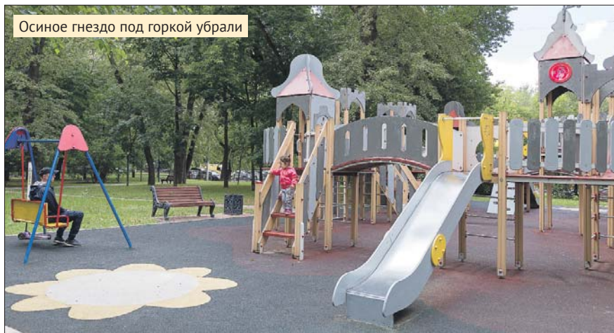
Осиное гнездо под горкой убрали