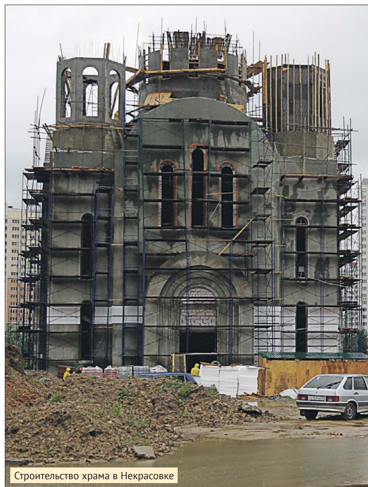
Строительство храма в Некрасовке