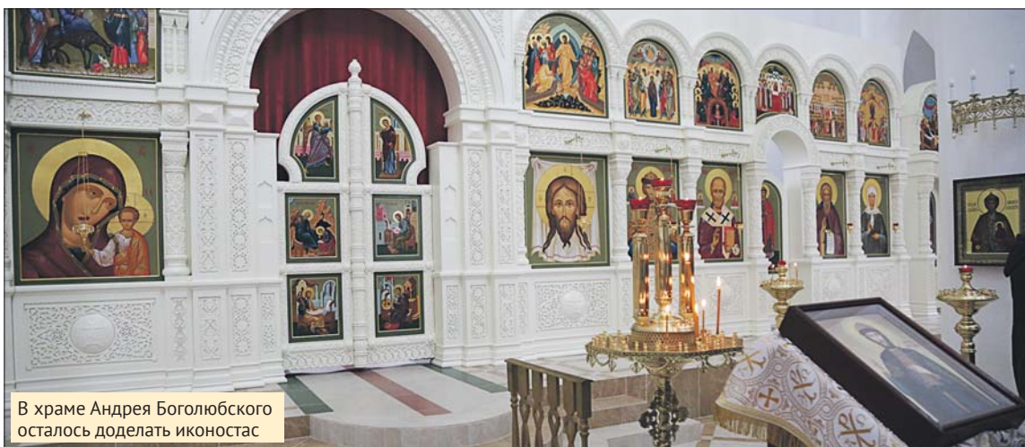
В храме Андрея Боголюбского осталось доделать иконостас

Х рам в честь Покрова Пресвятой Богородицы строят около недавно открытой станции метро «Некрасовка». Он будет белокаменным, с пятью куполами и сможет вместить 500 человек. Как сообщили строители, до конца июля на нём появится кровля. В августе завершат заливку главного барабана (часть здания, которая служит основанием для купола) и оштукатурят фасад. А в сентябре начнут установку центральной главы и креста.