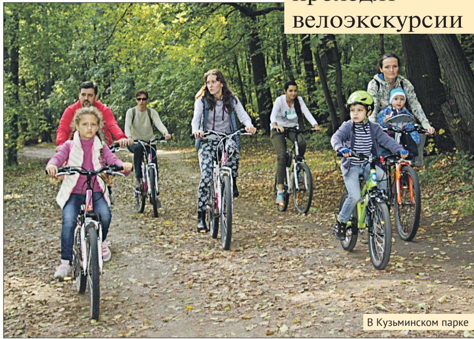
В Кузьминском парке