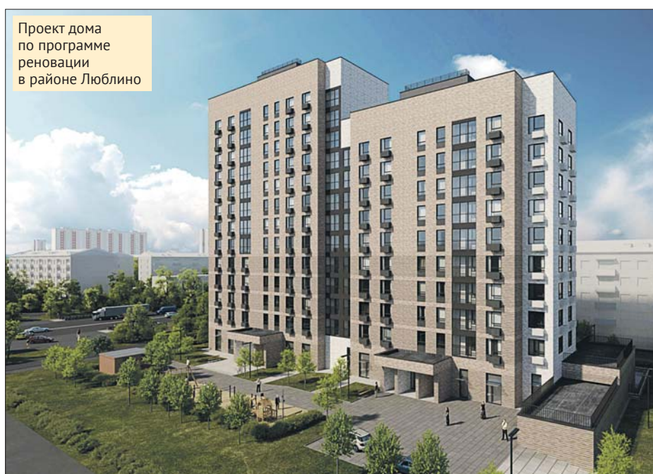
Проект дома по программе реновации в районе Люблино