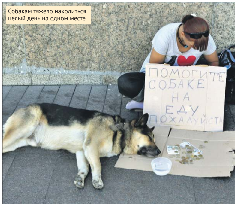
Собакам тяжело находиться целый день на одном месте

Котята на такой «работе» обычно погибают в течение суток