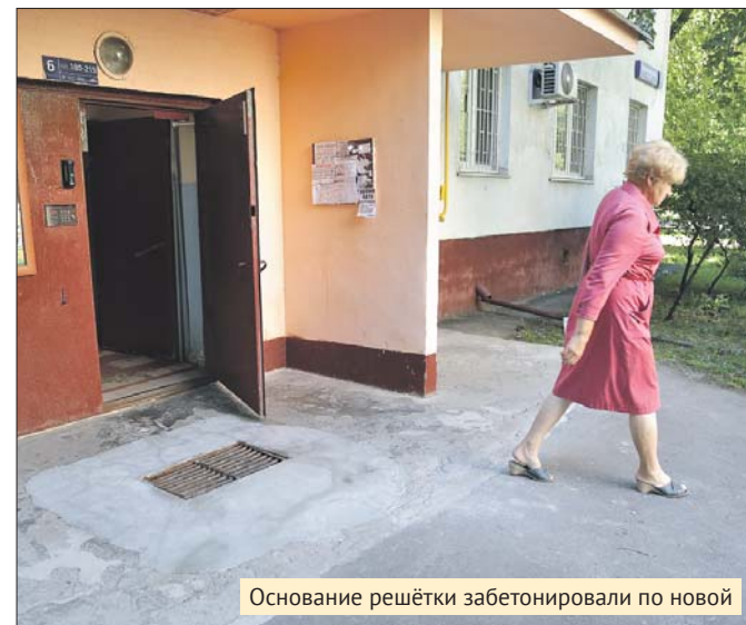
Основание решётки забетонировали по новой

ГБУ «Жилищник Выхино-Жулебино»: ул. Привольная, 5, корп. 5, тел. общего отдела (499) 796-5928. Эл. почта: vxino3@mail.ru