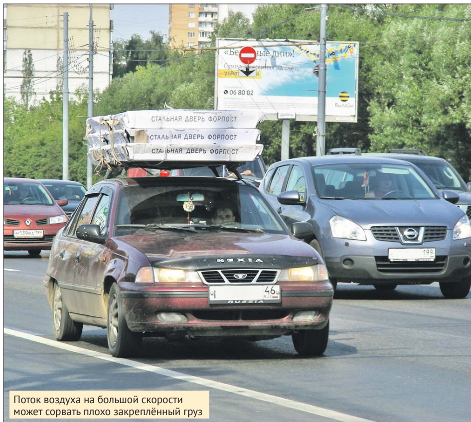
Поток воздуха на большой скорости может сорвать плохо закреплённый груз

Сосед решил перевезти мопед на дачу на верхнем багажнике: зачем гнать своим ходом, если можно сэкономить на топливе? О грузе вспомнил на крутом повороте, когда услышал грохот над головой: мопед сдвинулся, сделав рулём неслабую вмятину и царапины на крыше.