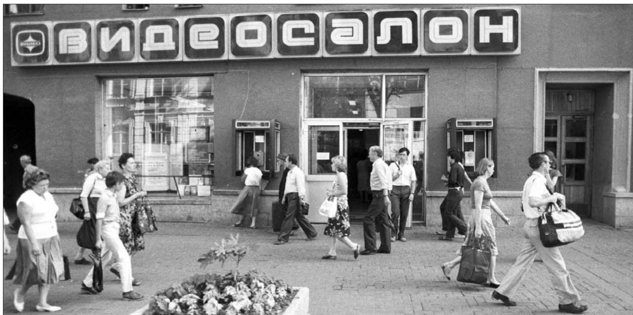
Сергей Меропин / РИА Новости

Но потом стало чуть посвободнее: наверное, чтобы ловить не мелкую рыбешку, а сразу брать стаю, косяк страждущих не на-