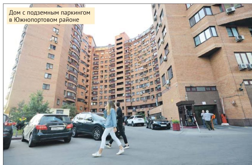
Дом с подземным паркингом в Южнопортовом районе

Машино-места можно взять в аренду на 10 лет. Для этого необходимо подать заявку в службу одного окна департамента или в электронную приёмную на официаль-