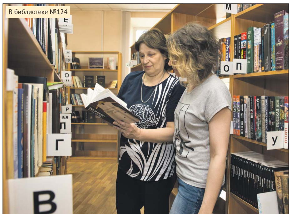
В библиотеке №124