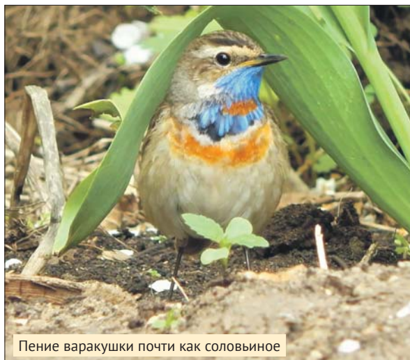
Пение варакушки почти как соловьиное