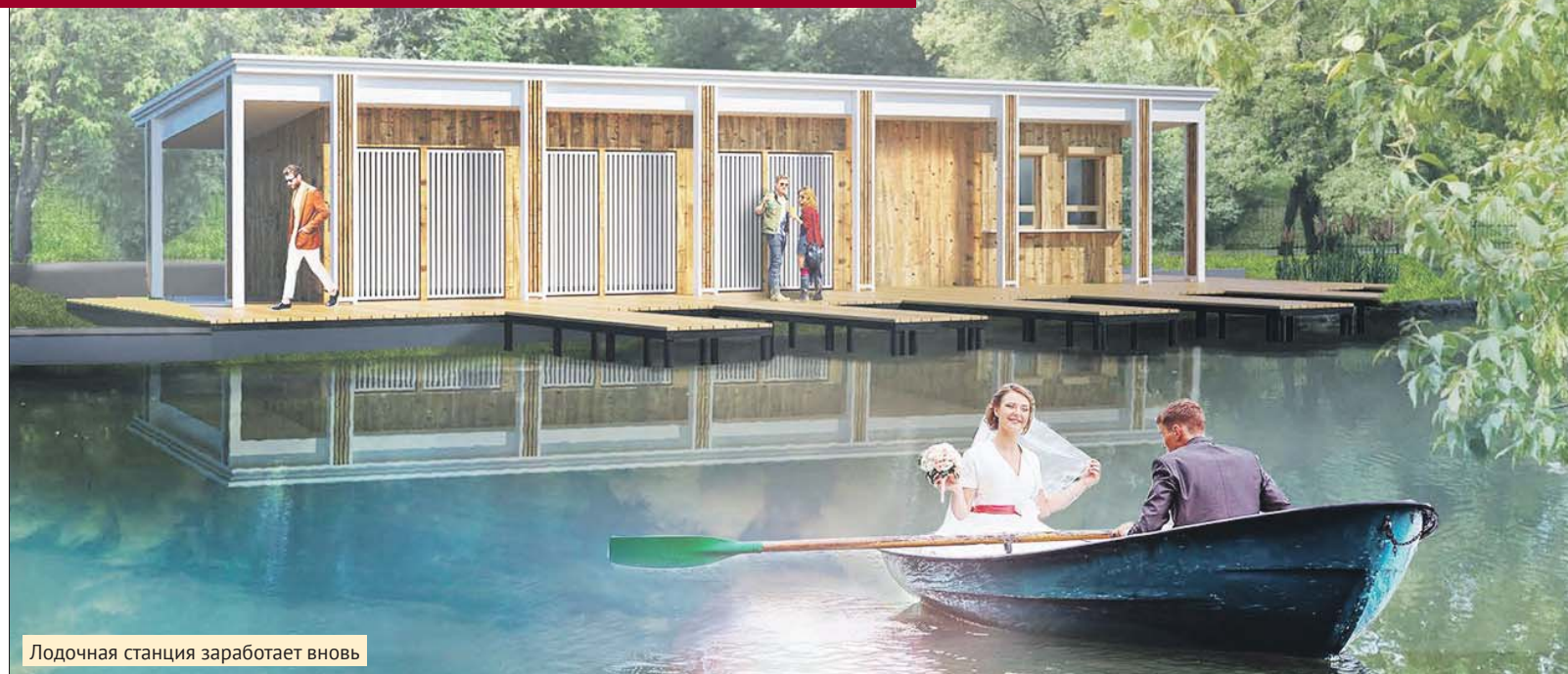
Лодочная станция заработает вновь

По проекту, который зимой обсуждали с жителями, вдоль берега Люблинского пруда решено построить просторную набережную. К воде сделают удобные спуски и мостики для любителей рыбал-