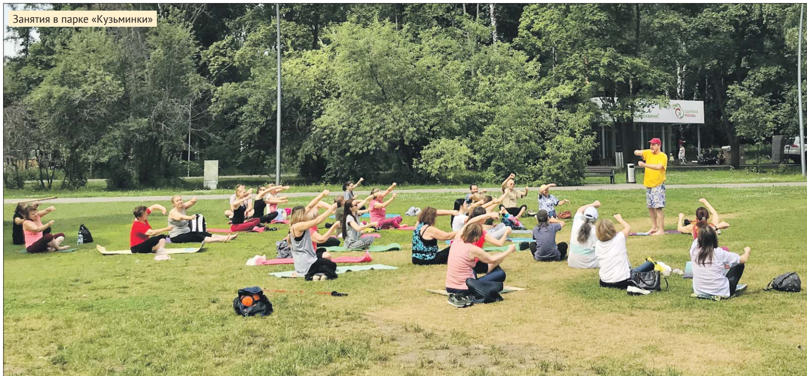
Занятия в парке «Кузьминки»