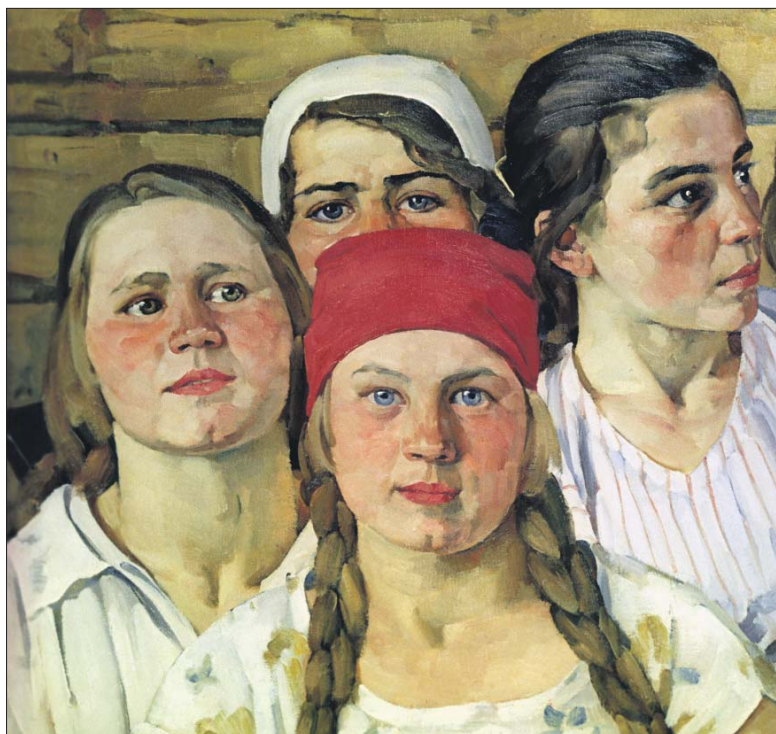
«Комсомолка (подмосковная молодёжь)». К. Юон. 1930 год

Выставка будет работать на постоянной основе, вход свободный