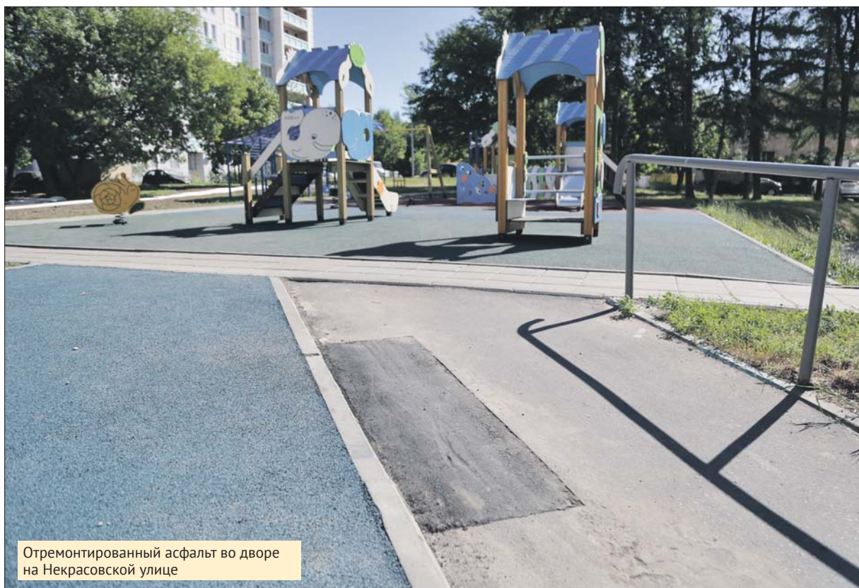
Отремонтированный асфальт во дворе на Некрасовской улице

ГБУ «Жилищник района Некрасовка»: ул. 2-я Вольская, 24, тел. (499) 746-7870. Эл. почта: dir_nekrasovka@mail.ru