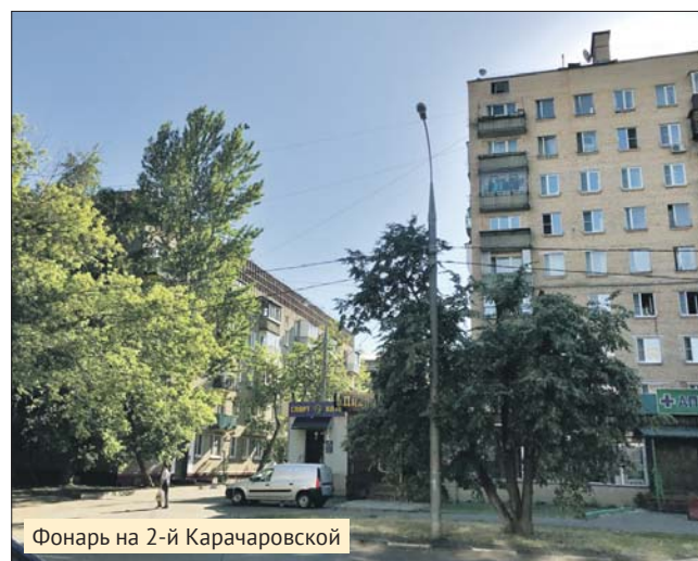
Фонарь на 2-й Карачаровской

ПИШИТЕ НАМ: uvkurier@mail.ru , redaktor-2017@yandex.ru ЗВОНИТЕ: (495) 681-3645