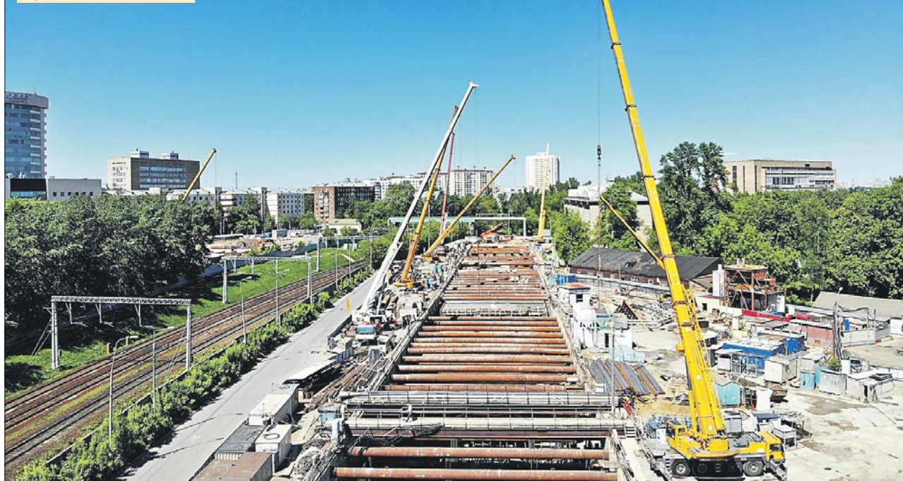
Станция «Авиамоторная» строящейся БКЛ

Второе, большое, кольцо Московского метрополитена готово почти на 50%. Работы уже идут на всех участках, проходка тоннелей ведёт 21 спе-