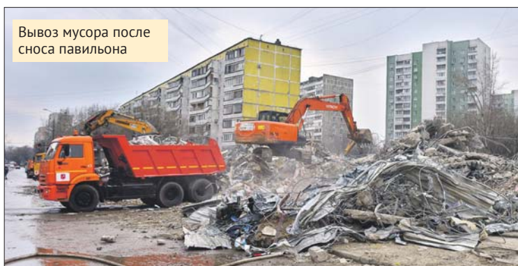
Вывоз мусора после сноса павильона