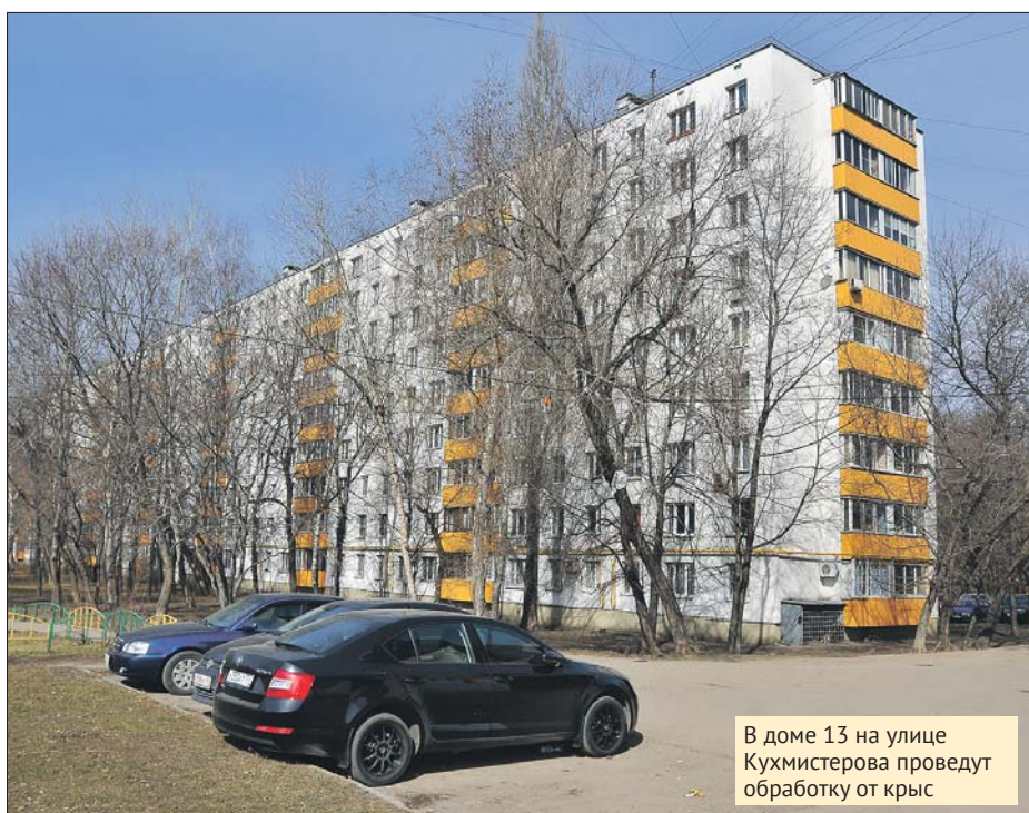
В доме 13 на улице Кухмистерова проведут обработку от крыс