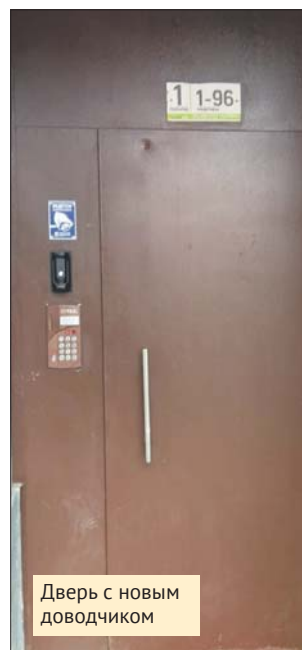
Дверь с новым доводчиком