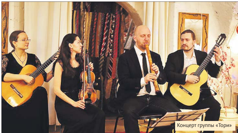
Концерт группы «Тори»

В программе акции также концерт группы «Тори» на основе произведений японского фольклора. Музыканты сыграют на япон-