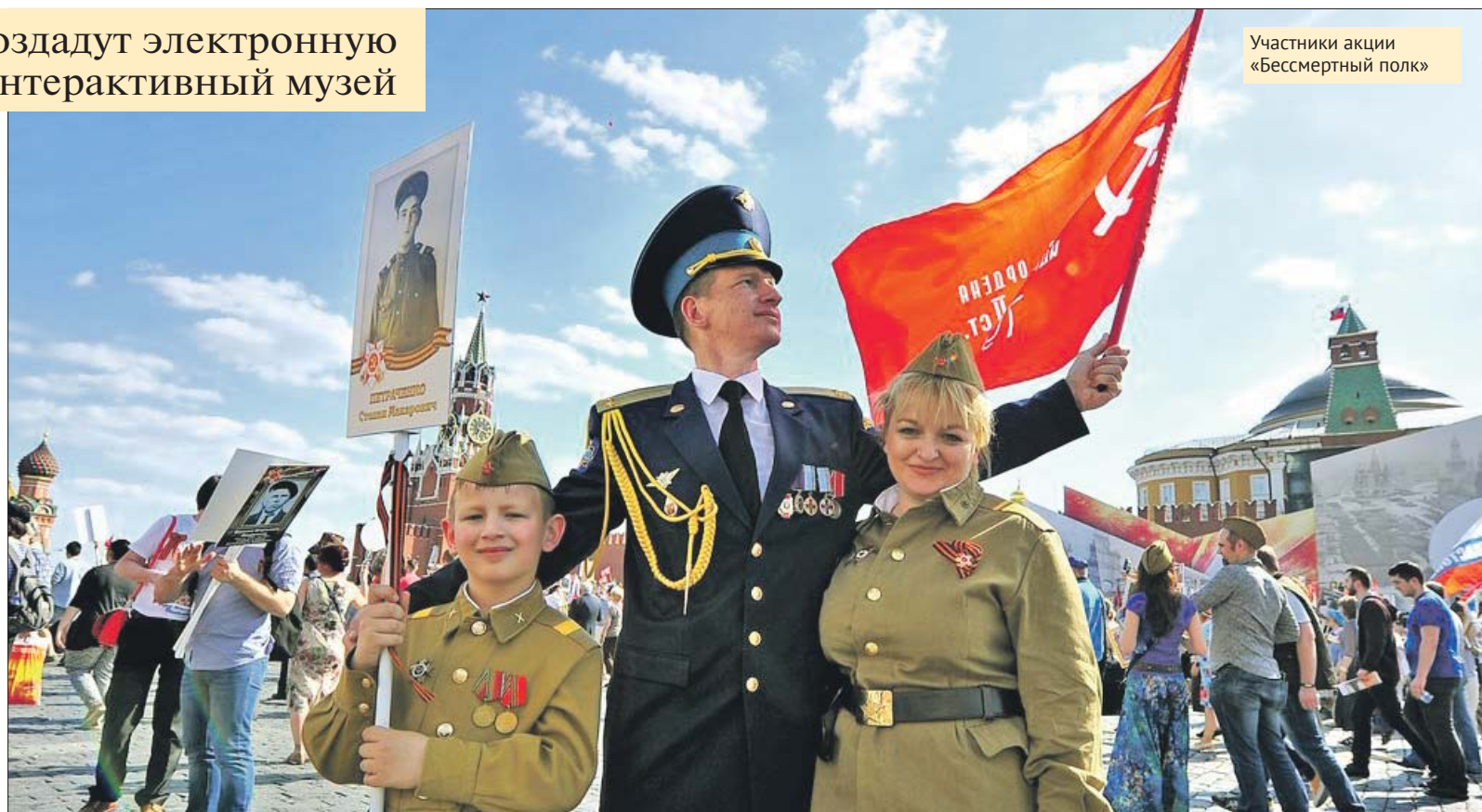
Участники акции «Бессмертный полк»

Сегодня в электронной книге «Бессмертный