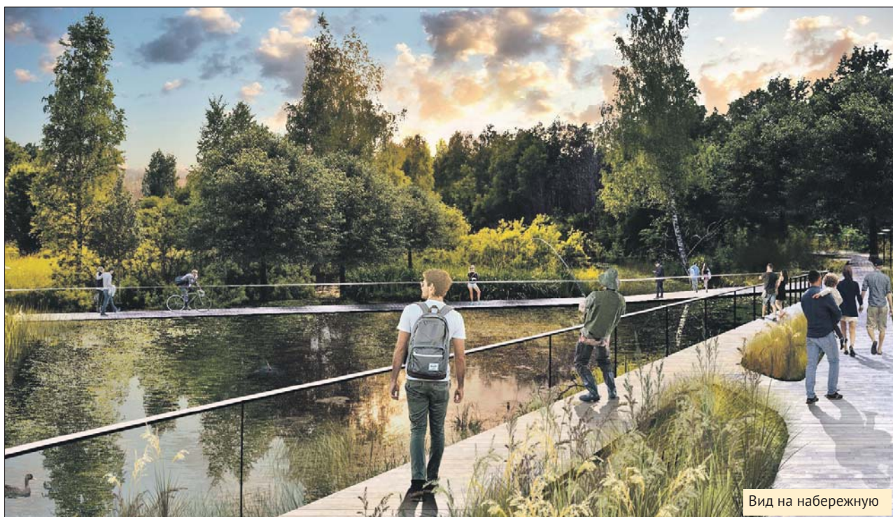
Вид на набережную

Парк 850-летия Москвы протянется вдоль реки на десяток километров