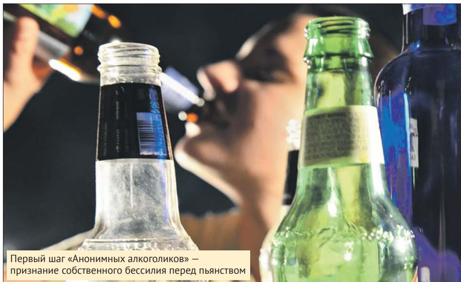
Первый шаг «Анонимных алкоголиков» — признание собственного бессилия перед пьянством

— Сначала я любила вечером выпить бокальчик вина. Потом стала по два выпивать, по три. Увлелась — и угодила в наркологическую больницу! Тогда и решила сходить к