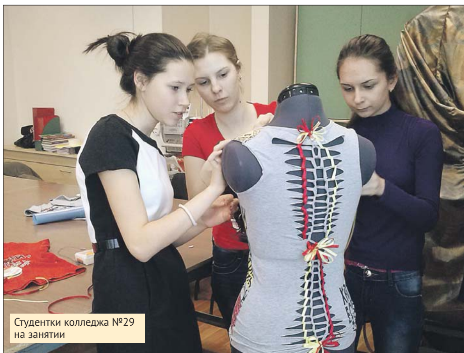
Студентки колледжа №29 на занятии

■ Дни открытых дверей пройдут 18 и 25 апреля по адресу: Волгоградский просп., 58, корп. 4.