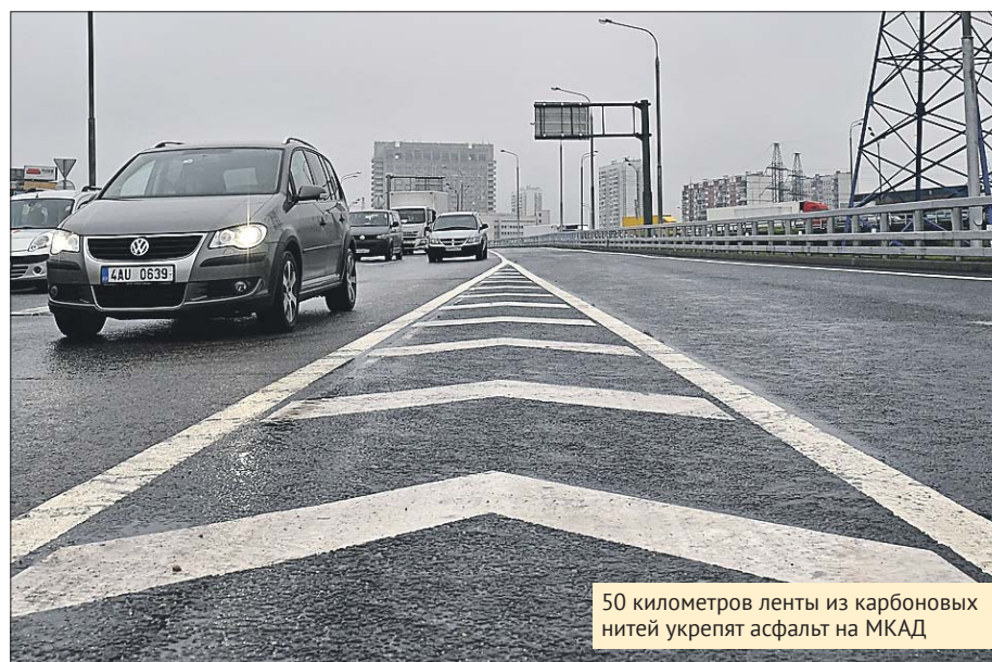
50 километров ленты из карбоновых нитей укрепят асфальт на МКАД