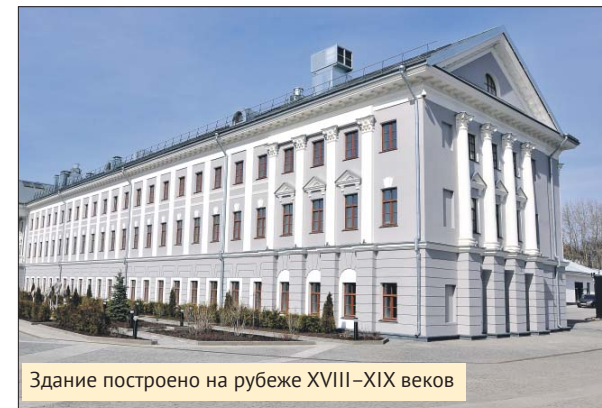
Здание построено на рубеже XVIII–XIX веков