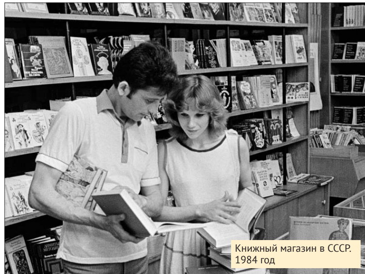
Книжный магазин в СССР. 1984 год

Продавщицы действительно смотрели на меня как на ума-