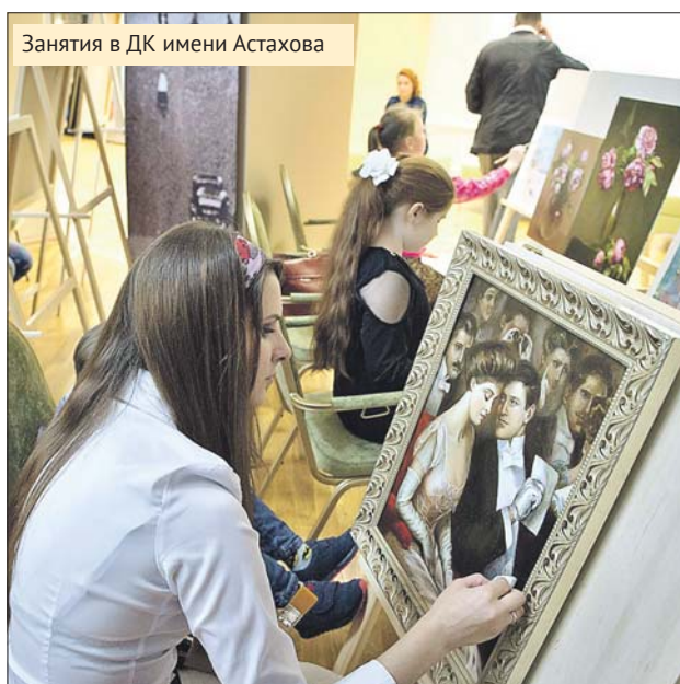
Занятия в ДК имени Астахова