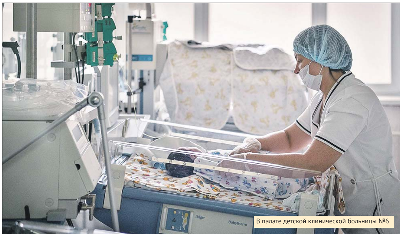
В палате детской клинической больницы №6

В Москве будут построены современные больницы