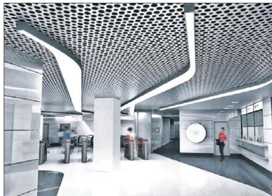
Вход на станцию «Авиамоторная»