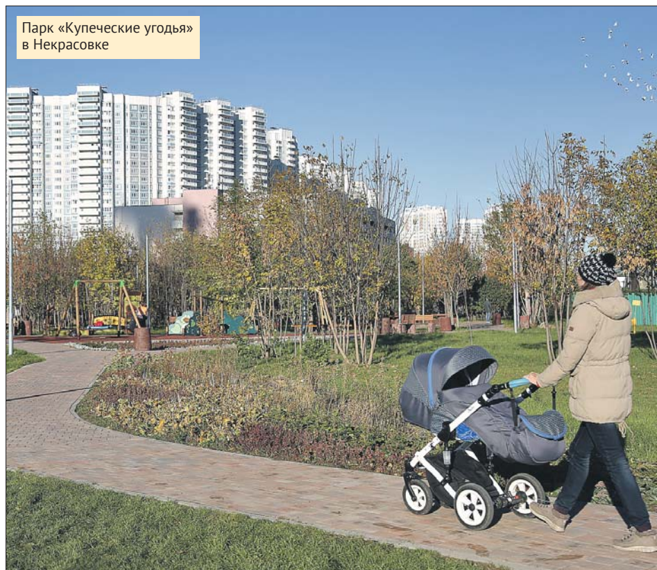
Парк «Купеческие уголья» в Некрасовке