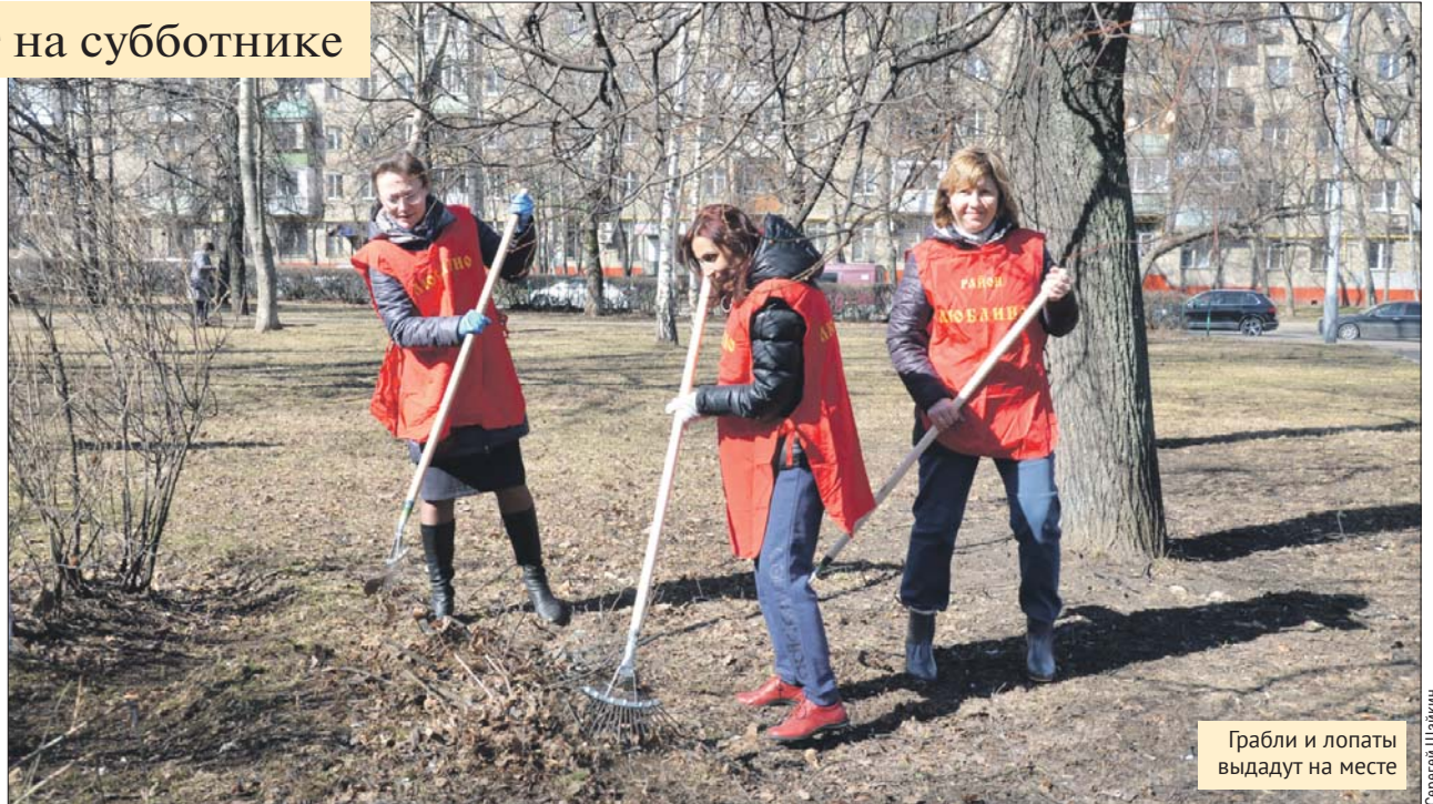
Грабли и лопаты выдадут на месте

Такой вид спорта придумали в Швеции. У него даже есть название: плоггинг. Люди выходят на дорожку в парке, берут с собой мешок и бегут, по пути собирая мусор.