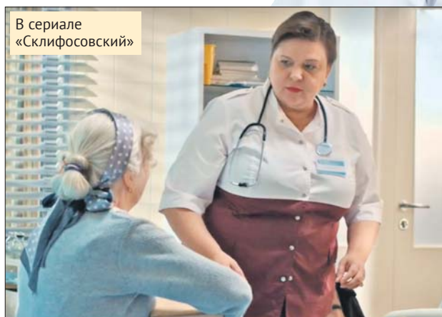
В сериале «Склифосовский»