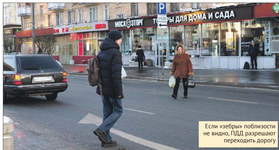
Если «зебры» поблизости не видно, ПДД разрешают переходить дорогу

Грузовик задел тележку с товарами, которая ударила пешехода