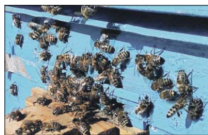
Пчёлы перезимовали благополучно

На пасеке в природно-историческом парке «Кузьминки-Люблино» пчёлы начали покидать ульи. Почувствовав смену времени года и тепло, они совершают свои первые весенние облёты.