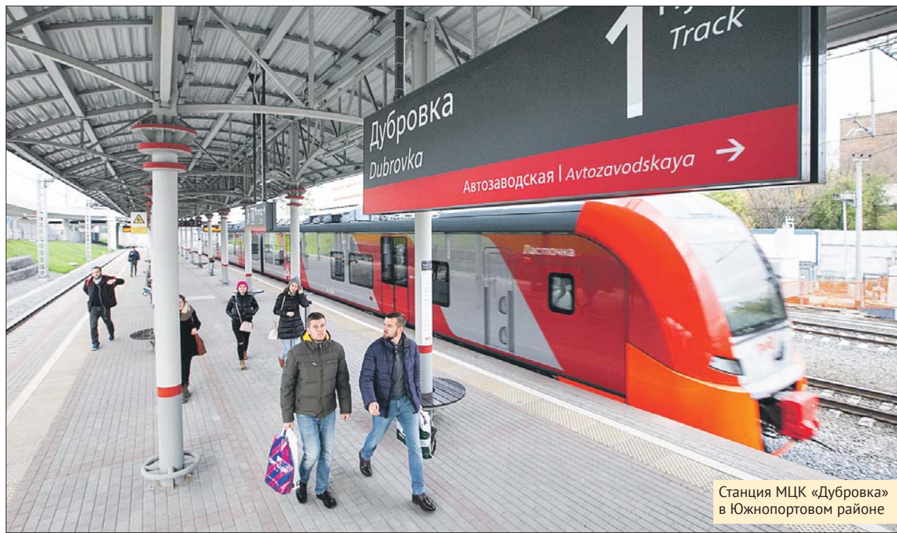
Станция МЦК «Дубровка» в Южнопортовом районе

Благоустройство — это, конечно, хорошо, но жители района хотят большего. Например, им было бы желательно, чтобы офис местного центра госуслуг «Мои документы» в доме на Шарикоподшипниковской улице находился на 1-м этаже. Сейчас людям, среди которых много пожилых, приходится подниматься по лестнице. По просьбам жителей офис перенесут. Не только центр гос-