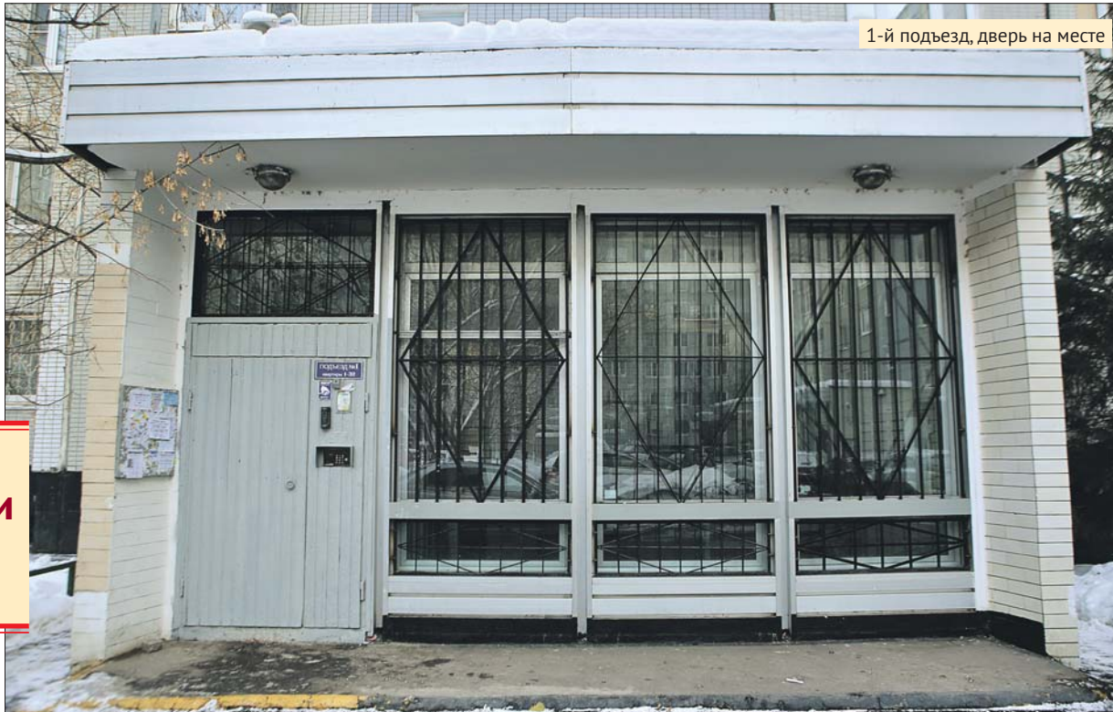
1-й подъезд, дверь на месте

— В этом подъезде работники подрядной ор-