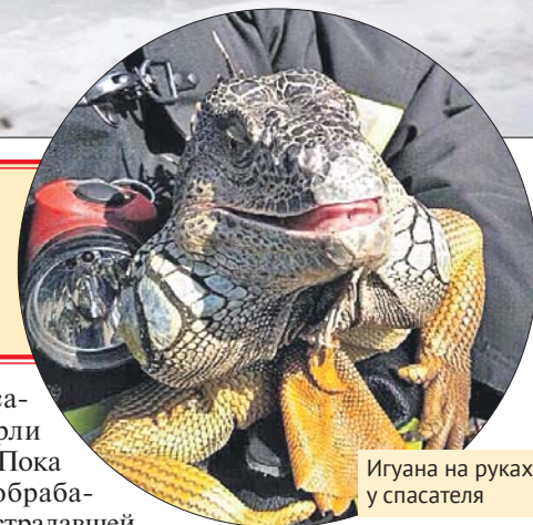
Игуана на руках у спасателя