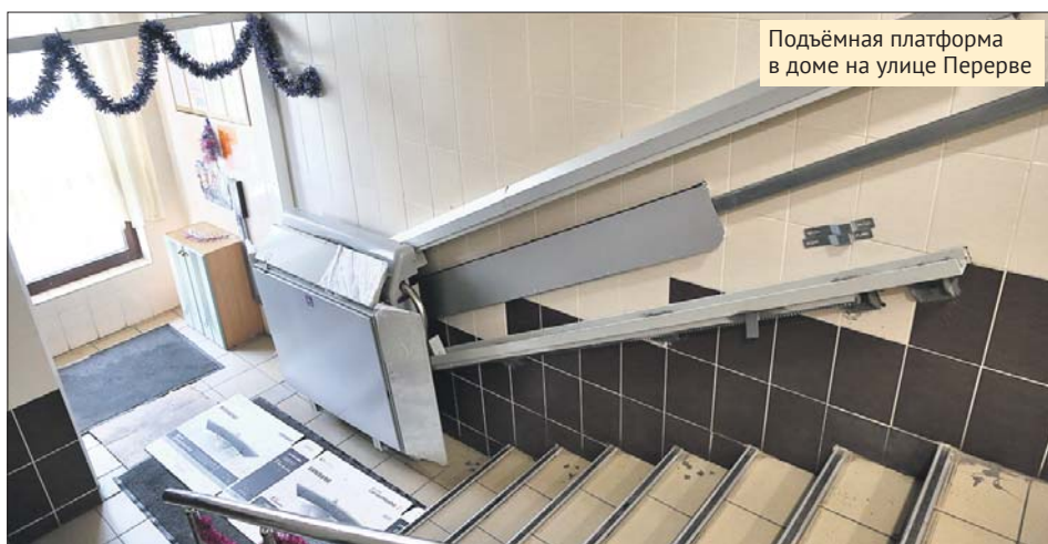
Подъёмная платформа в доме на улице Перерве