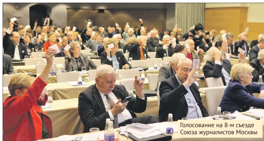
Голосование на 8-м съезде Союза журналистов Москвы