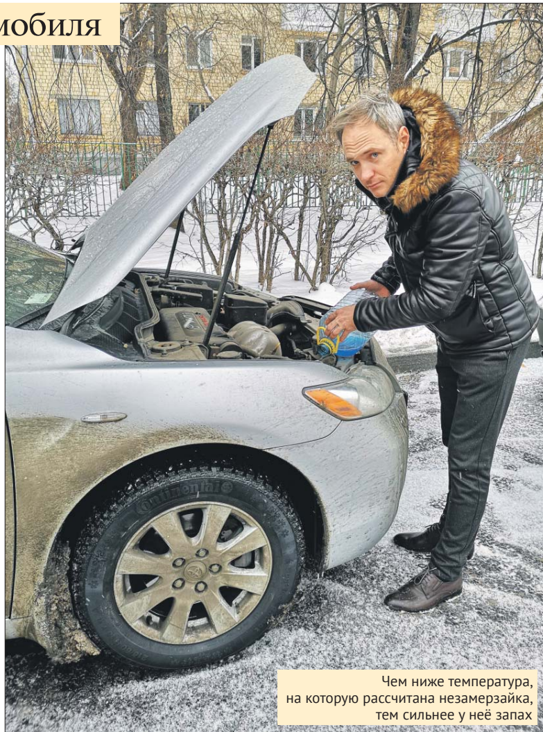
Чем ниже температура, на которую рассчитана незамерзайка, тем сильнее у неё запах

— Это самая безопасная омывающая жидкость, содержащая небольшое количество присадок. Но есть один нюанс! От неё в салоне будет сильный водочный запах. Некоторые водители при длительном использовании даже чувствуют лёгкое опьянение, — рассказывает Евтеев.