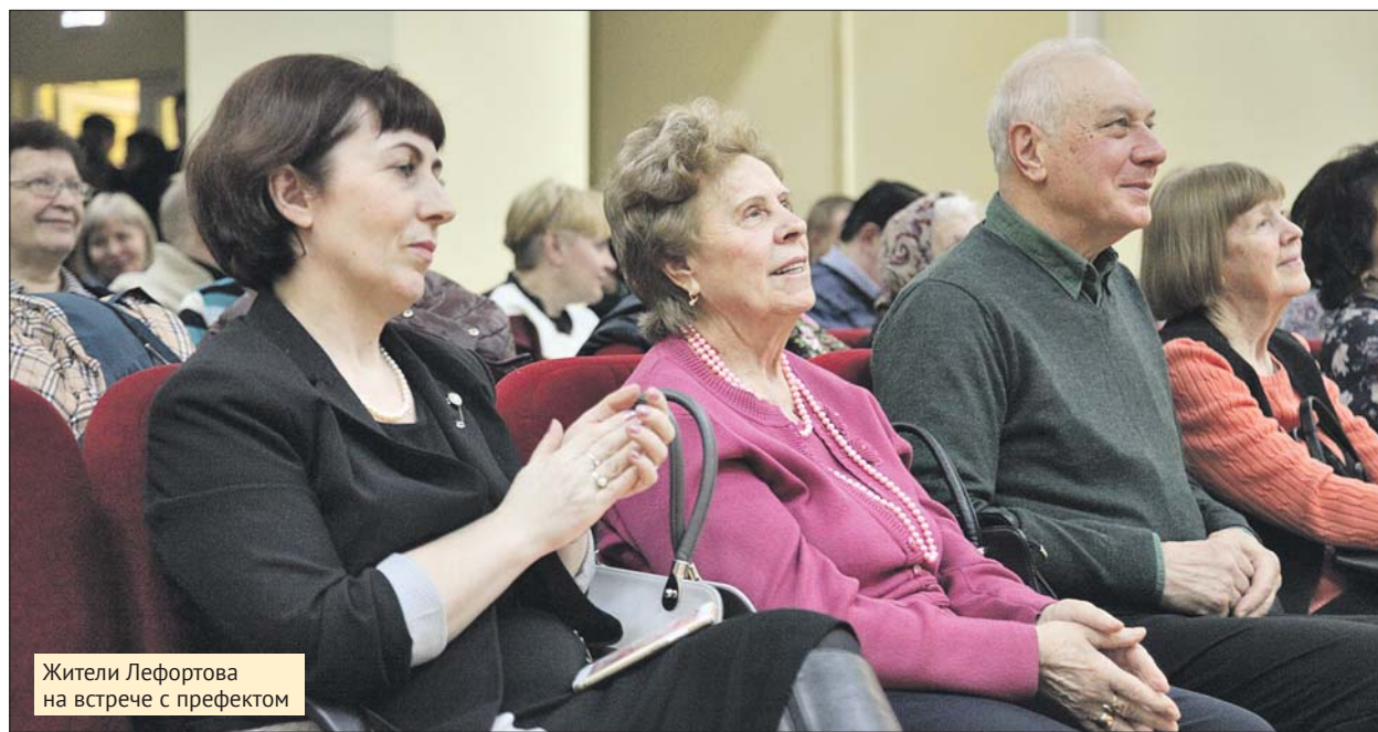
Жители Лефортова на встрече с префектом

В Лефортовском парке появятся точки по продаже мороженого и выпечки