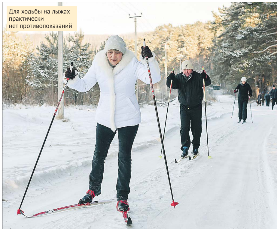
Для ходьбы на лыжах практически нет противопоказаний