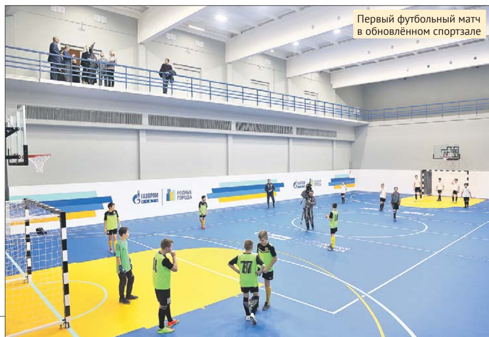
Первый футбольный матч в обновлённом спортзале