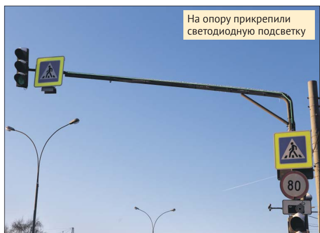
На опору прикрепили светодиодную подсветку