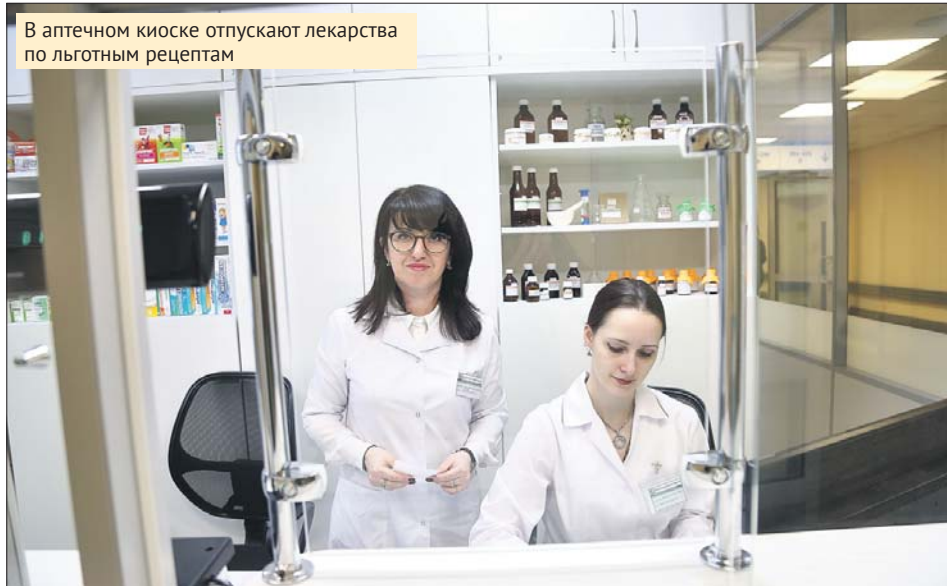
В аптечном киоске отпускают лекарства по льготным рецептам

— Теперь льготникам, среди которых много людей с ограниченными возможностями здоровья, не нужно ехать за лекарствами в другие районы, — сказала глава муницип-