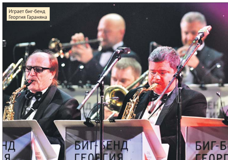
Играет биг-бэнд Георгия Гараяна