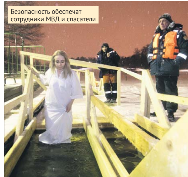
Безопасность обеспечат сотрудники МВД и спасатели