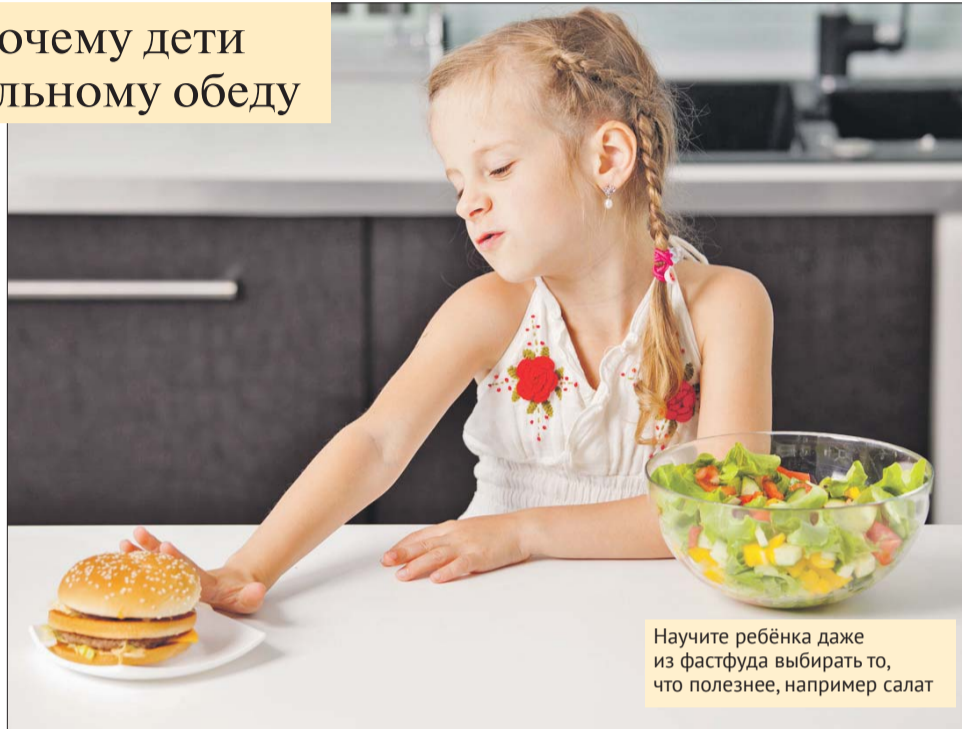
Научите ребёнка даже из фастфуда выбирать то, что полезнее, например салат

— Я всегда спрашиваю у родителей: почему при таком разнообразии кафе вы ведёте ребёнка туда, где много вредной еды? — говорит эксперт. — Предложите ему в следующий раз пойти в другое место, попробуйте что-то новое: тот же бургер, но из натуральных ингредиентов. Кроме того, научите детей даже из фастфуда выбирать то, что полезнее: не фри, а деревенский картофель и салат из свежих овощей. Но самое главное — всё, что связано с едой, ни в коем случае