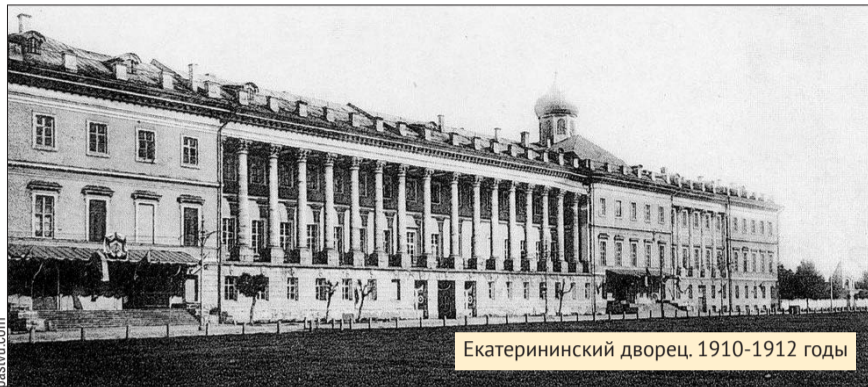
Екатерининский дворец. 1910-1912 годы