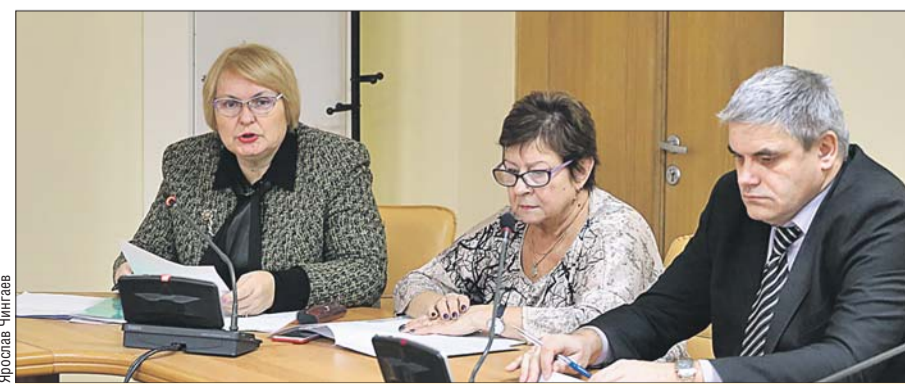
Заседание окружной трёхсторонней комиссии по регулированию социально-трудовых отношений