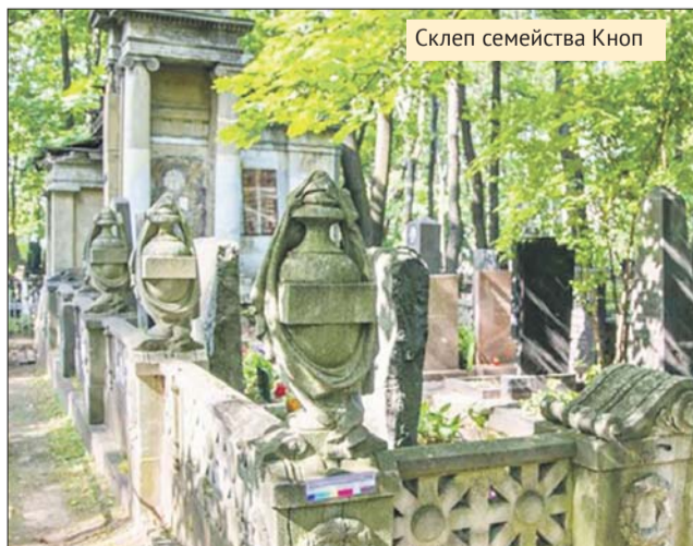
Склеп семейства Кноп