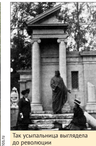
Так усыпальница выглядела до революции