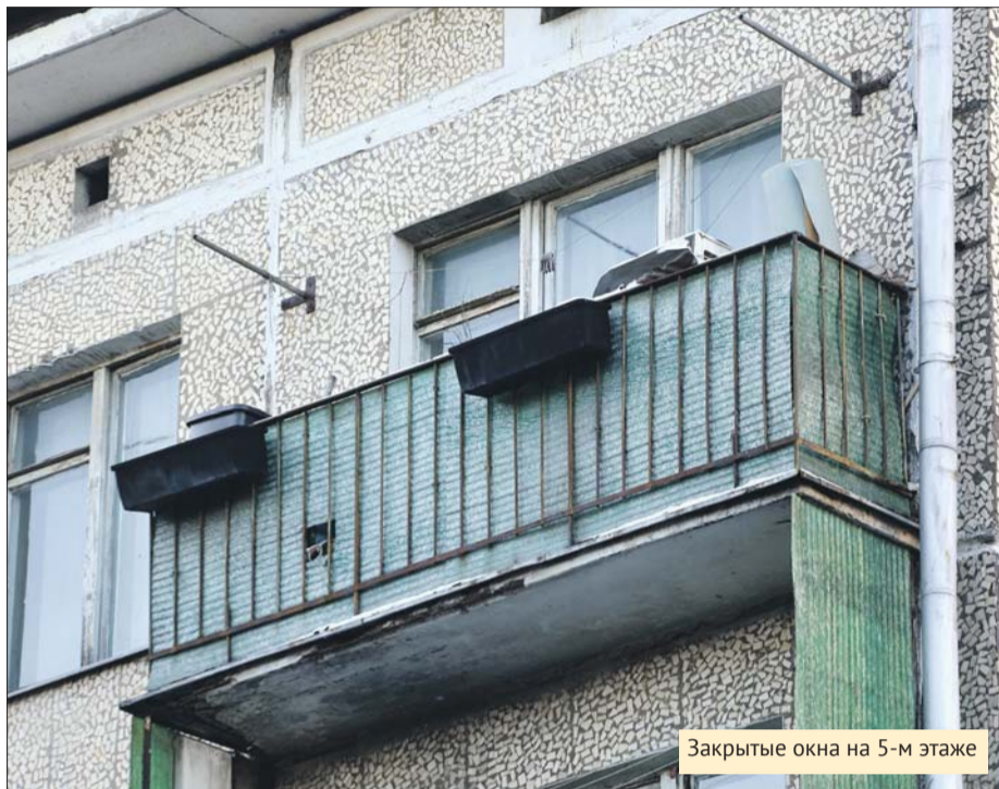
Закрытые окна на 5-м этаже

— По обращению жителей управляющая компания ГБУ «Жилищник» немедленно обследовала подъезд 4 дома 143, корпус 2, на Волгоградском проспекте. В настоящее время окна в квартире закрыты, жители могут