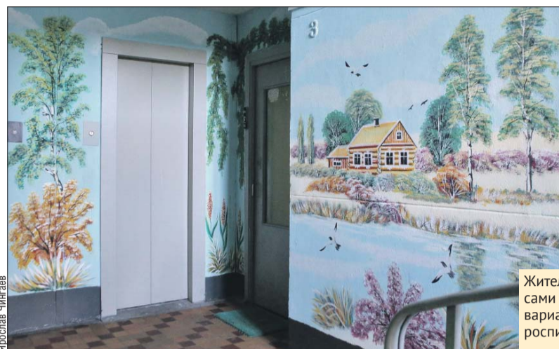
Жители дома сами выбрали варианты росписи

В доме на Шоссейной появился расписной подъезд