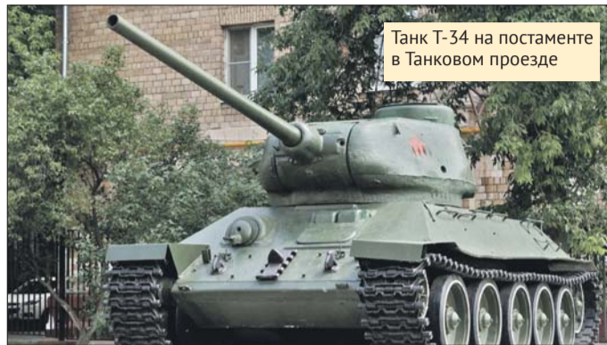
Танк Т-34 на постаменте в Танковом проезде