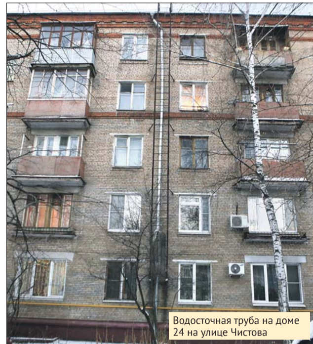
Водосточная труба на доме 24 на улице Чистова