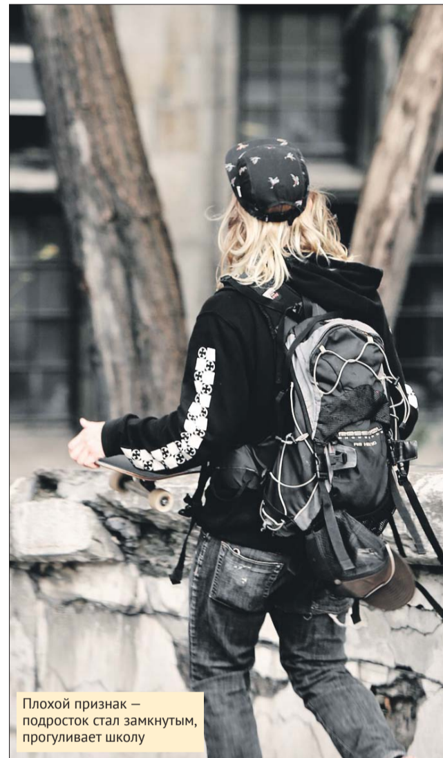
Плохой признак — подросток стал замкнутым, прогуливает школу

становку. Сделайте перестановку в комнате, отправьтесь в экскурсионный тур или просто за город на выходные. Новые впечатления часто вытесняют печальные переживания. Ещё один совет — заняться любым делом, даже через силу. Это может быть хобби, творчество, участие в волонтер-