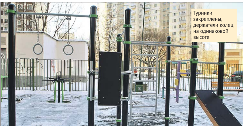
Турники закреплены, держатели колец на одинаковой высоте