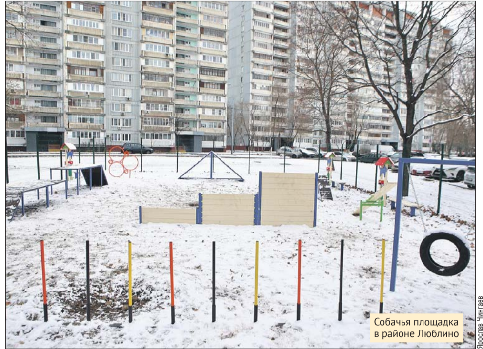
Собачья площадка в районе Люблино

Управа района Люблино: Люблинская ул., 53, тел. (495) 350-1888. ГБУ «Жилищник района Люблино»: просп. 40 Лет Октября, 11, тел. (495) 350-4810 @