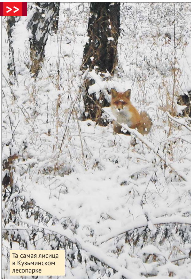
Та самая лисица в Кузьминском лесопарке