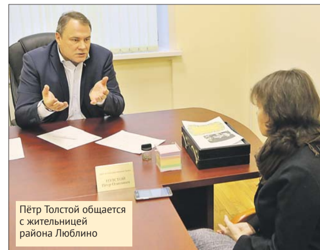
Пётр Толстой общается с жительницей района Люблино