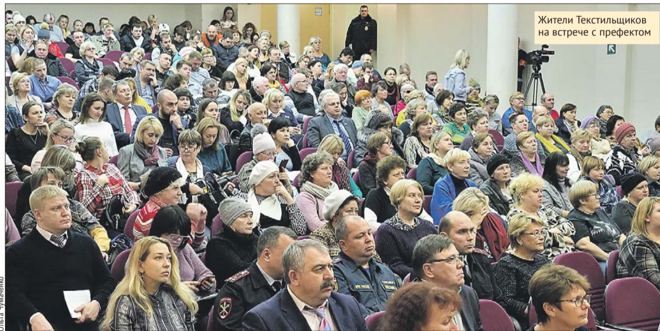
Жители Текстильщиков на встрече с префектом