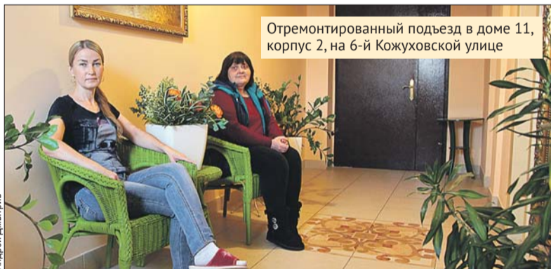
Отремонтированный подъезд в доме 11, корпус 2, на 6-й Кожуховской улице