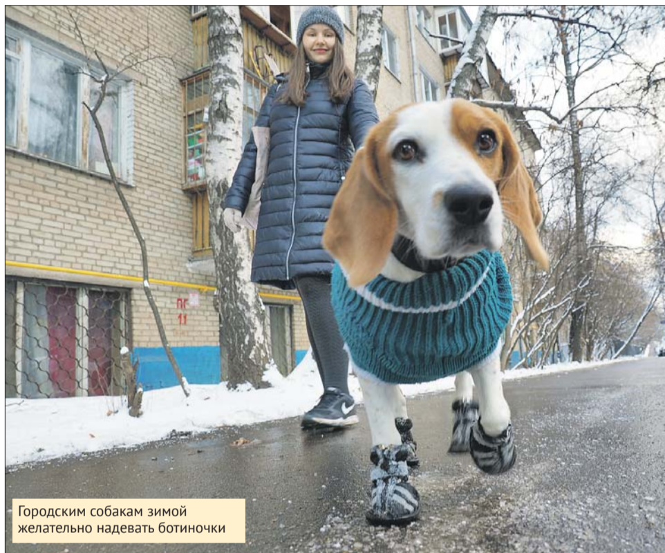
Городским собакам зимой желательно надевать ботиночки

А вот на детских площадках использование реагента запрещено — там лёд и снег дворники ежедневно должны счищать лопатами. Также нельзя использовать противопо-