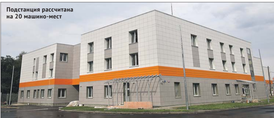
Подстанция рассчитана на 20 машино-мест

Подстанция в Некрасовке построена. Как сообщается на официальном портале мэра