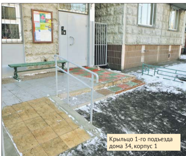
Крыльцо 1-го подъезда дома 34, корпус 1