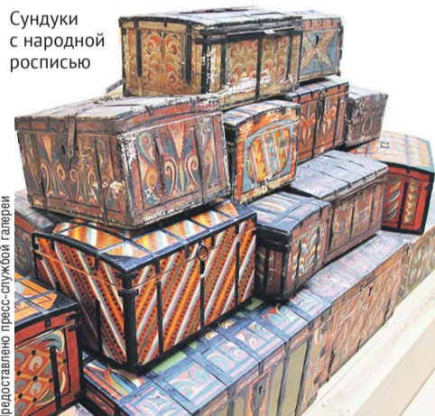
Сундуки с народной росписью