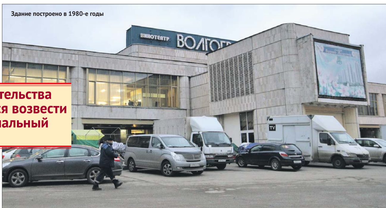
Здание построено в 1980-е годы