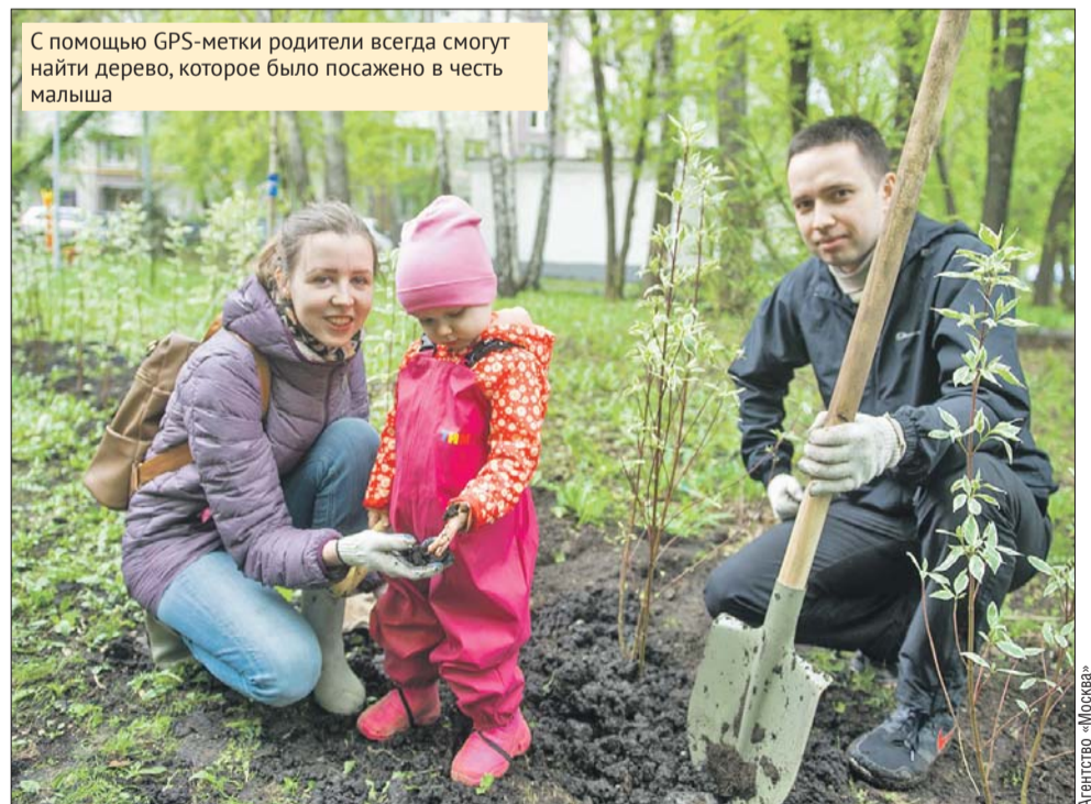
С помощью GPS-метки родители всегда смогут найти дерево, которое было посажено в честь малыша

— С помощью GPS-метки родители всегда смогут найти дерево, которое было посажено в честь их