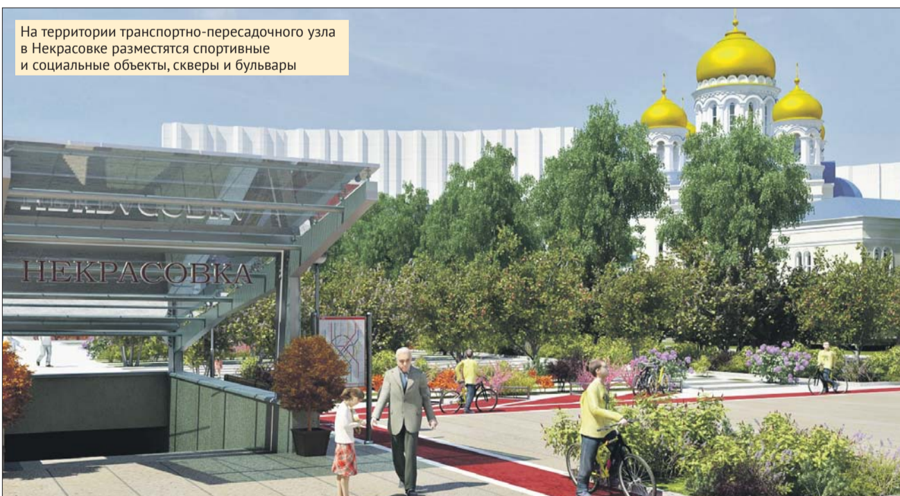
На территории транспортно-пересадочного узла в Некрасовке разместятся спортивные и социальные объекты, скверы и бульвары