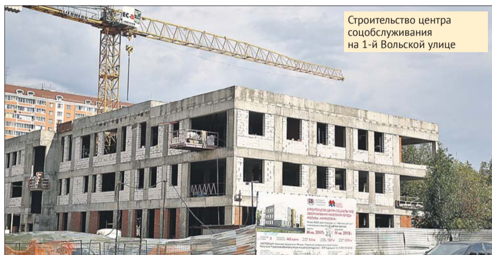
Строительство центра соцобслуживания на 1-й Вольской улице

В исторической части района завершается стро-