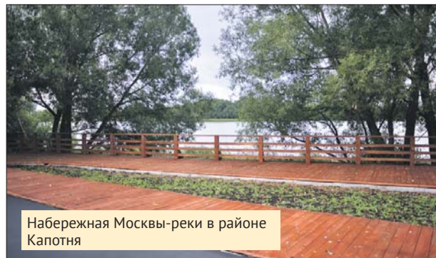
Набережная Москвы-реки в районе Капотня