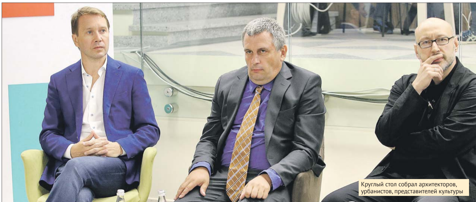
Круглый стол собрал архитекторов, урбанистов, представителей культуры

— Вопросы сглаживания неравенства между центром и периферией, экономических и геогра-