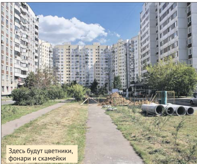
Здесь будут цветники, фонари и скамейки