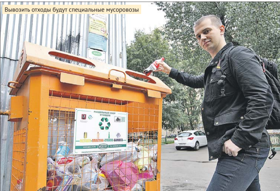
Вывозить отходы будут специальные мусоровозы

В парках округа поставят контейнеры для раздельного сбора мусора