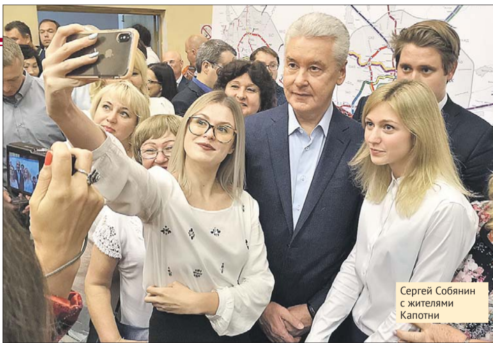
Сергей Собянин с жителями Капотни

— Как минимум раз в год я бываю на МНПЗ и смотрю, что там происходит. К сожалению, всё меняется не так быстро, как хотелось бы, но на самом деле выполняется огромный объём работ, — отметил мэр. — Здесь появилась установка, которая обеспечивает полную очистку воды, так что стоки стали чище, чем вода в Москве-реке. Ситуация с выбросами в атмосферу тоже улучшилась, но всё равно проблемы остают-