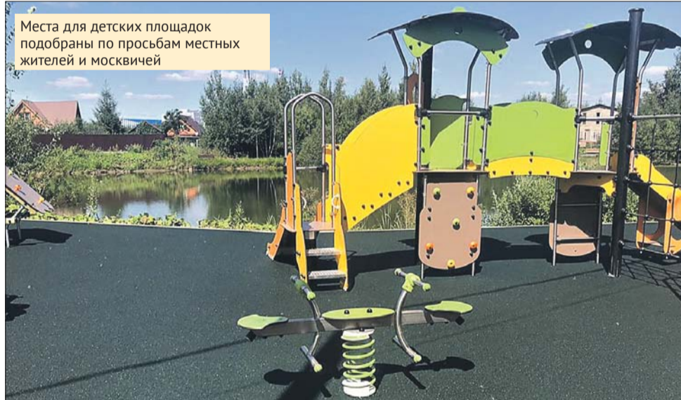
Места для детских площадок подобраны по просьбам местных жителей и москвичей