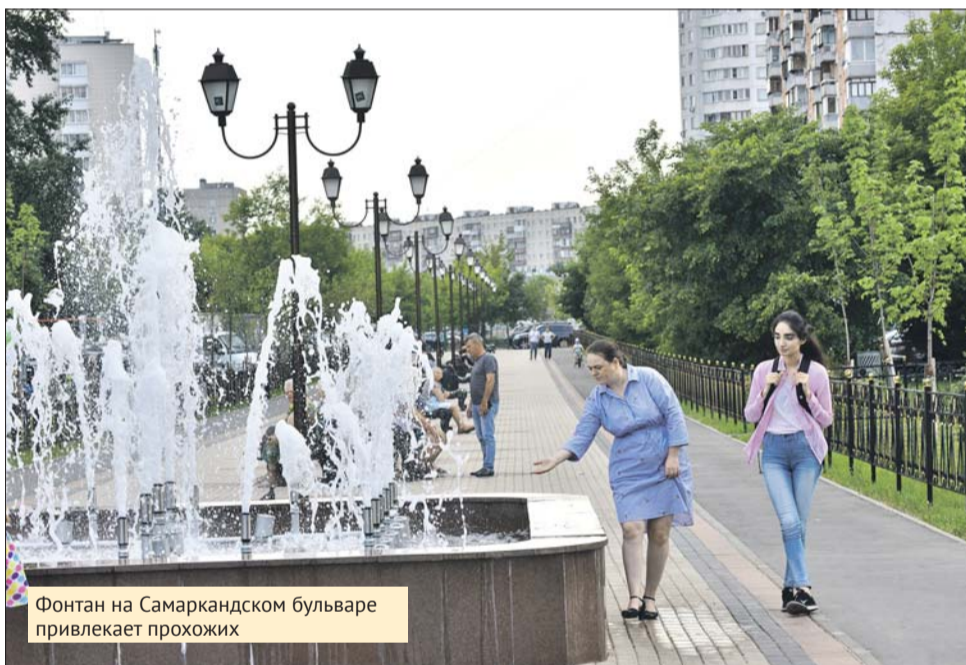
Фонтан на Самаркандском бульваре привлекает прохожих