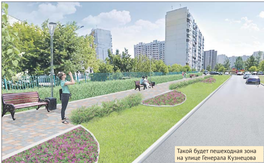
Такой будет пешеходная зона на улице Генерала Кузнецова