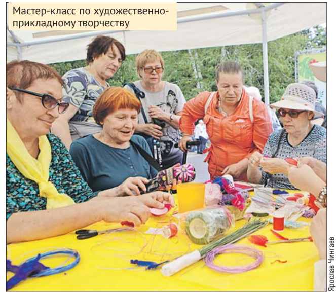
Мастер-класс по художественно-прикладному творчеству