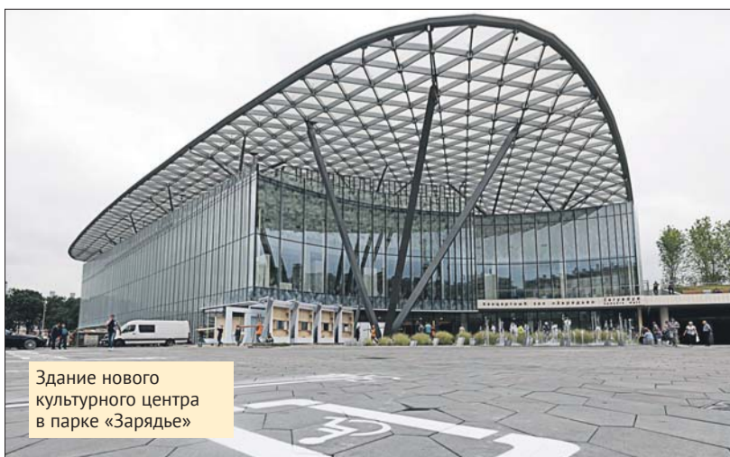
Здание нового культурного центра в парке «Зарядье»