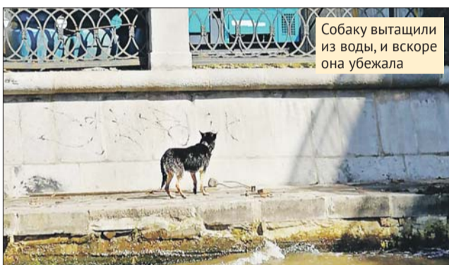
Собаку вытащили из воды, и вскоре она убежала

плыли к тонущей собаке, с помощью верёвки поймали её, подтянули к берегу и вытащили. Мокрый и испуганный спа-