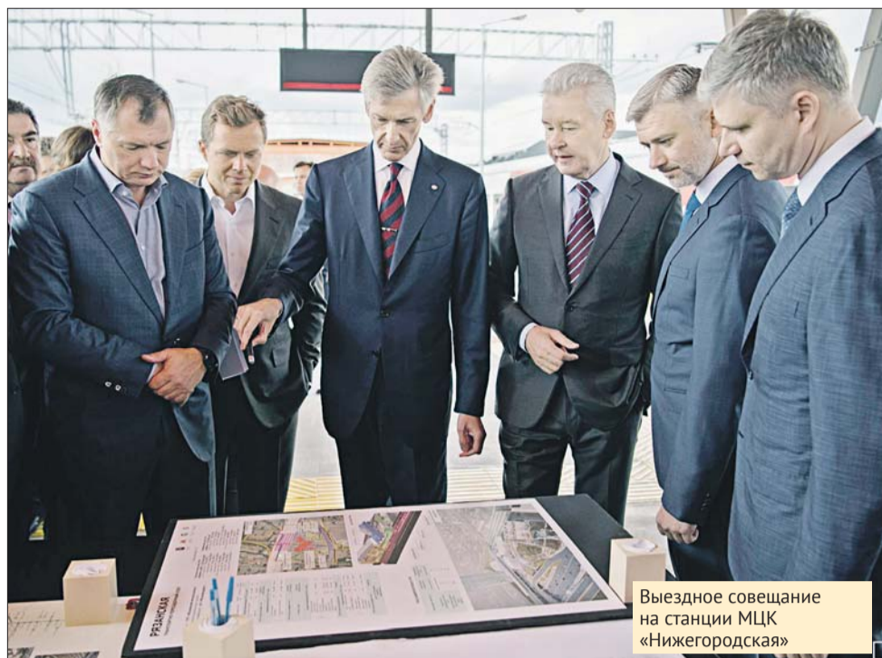
Выездное совещание на станции МЦК «Нижегородская»

центрального диаметра и высокоскоростной пассажирской магистрали, — сказал градоначальник. — Здесь будет совершаться около 500 тысяч проездов пассажиров в сутки. ТПУ «Рязанская» расположится на пересечении