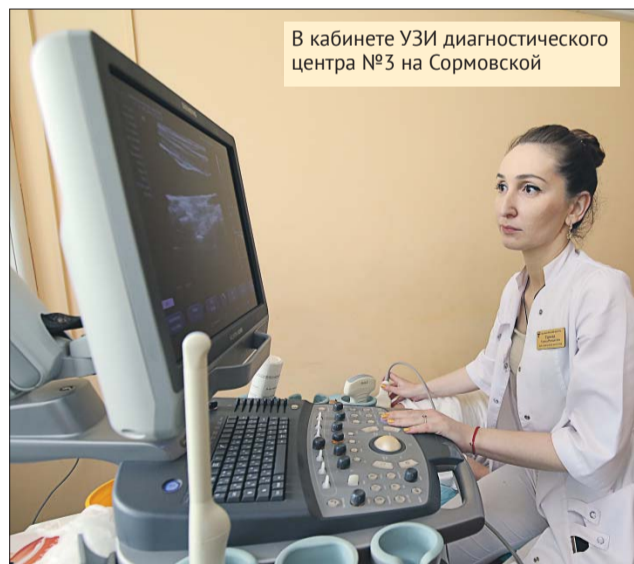
В кабинете УЗИ диагностического центра №3 на Сормовской