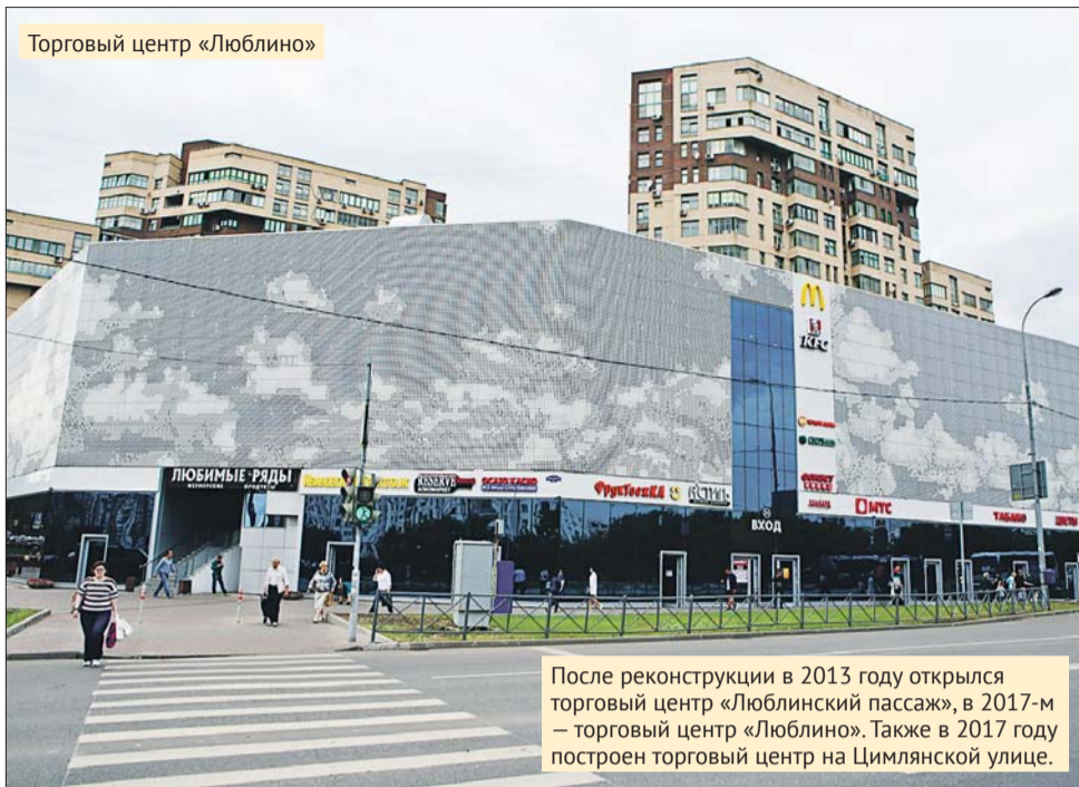
Торговый центр «Люблино»

После реконструкции в 2013 году открылся торговый центр «Люблинский пассаж», в 2017-м – торговый центр «Люблино». Также в 2017 году построен торговый центр на Цимлянской улице.