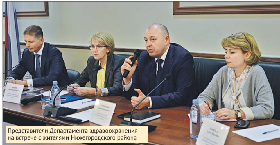
Представители Департамента здравоохранения на встрече с жителями Нижегородского района

В филиале №1 поликлиники №19 на улице Верхняя Хохловка, 2, принимают кардиолог, эндокринолог, уролог, невропатолог, офтальмолог, отоларинго-