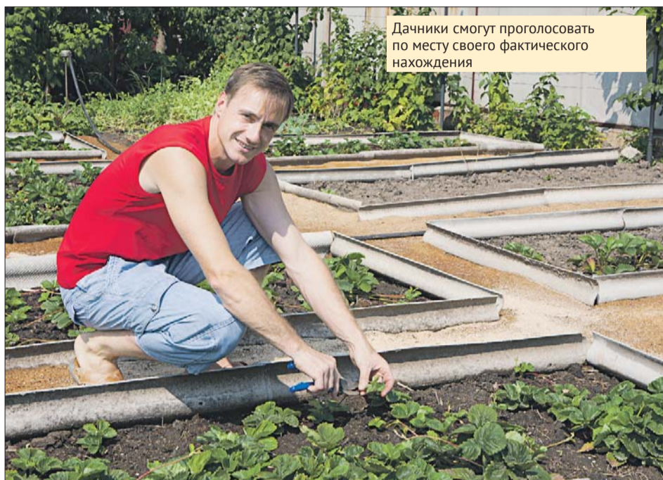
Дачники смогут проголосовать по месту своего фактического нахождения

— В Москве избирается мэр. Будет использоваться видеонаблюдение с трансляцией в Интернет в помещении 128 территориальных и 3,6 тысячи участковых избирательных комиссий, — отметила она.