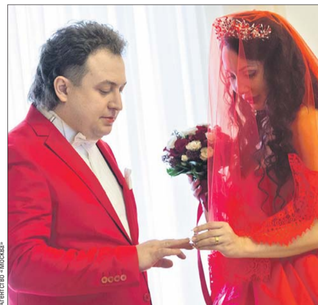
В памятке для молодожёнов об одежде жениха и невесты ничего не сказано