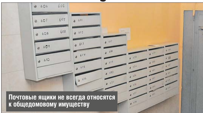
Почтовые ящики не всегда относятся к общедомовому имуществу

Вы писали, что замок почтового ящика должны починить бесплатно, а с меня «Жилищник» просит 350 рублей, ссылаясь на расценки, установленные городом. Должна ли я платить?