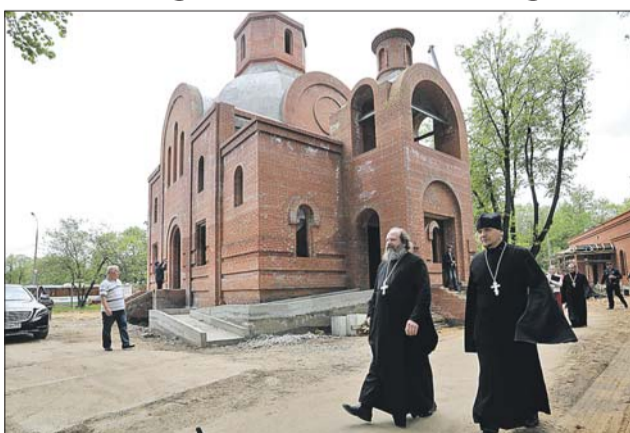
Храм Святого Димитрия, митрополита Ростовского

стр. 6 Столичные юристы бесплатно помогут москвичам по вопросам программы реновации