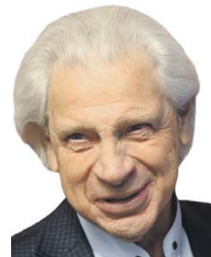
Вице-президент адвокатского сообщества столицы Генри Резник