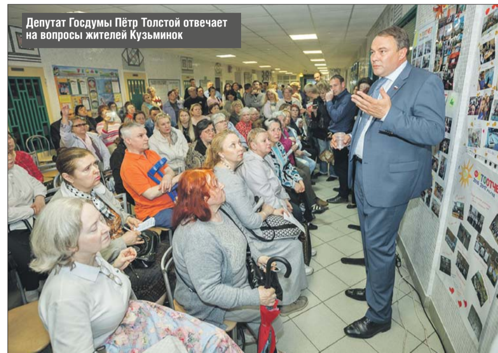
Депутат Госдумы Пётр Толстой отвечает на вопросы жителей Кузьминок

— При получении нового жилья у москвичей