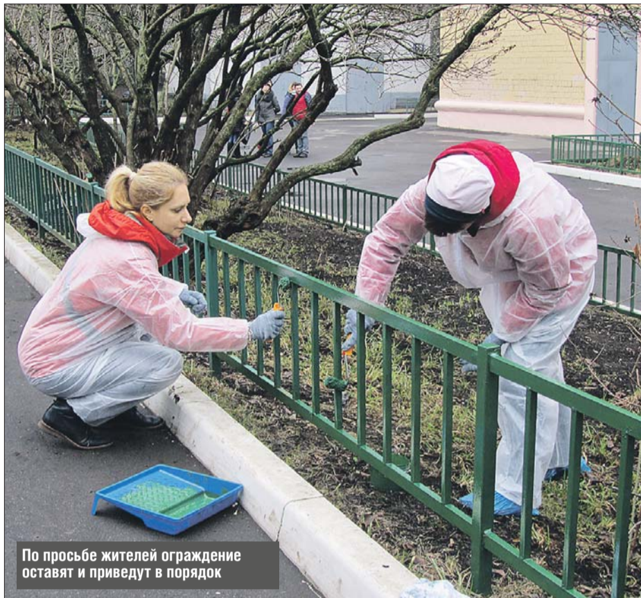
По просьбе жителей ограждение оставят и приведут в порядок