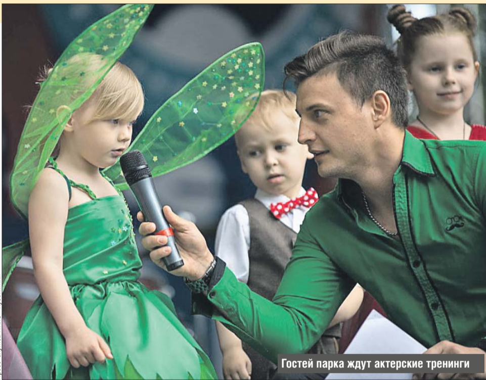
Пресс-служба Парка «Кузьминки»

В 12.00 на площадке около сцены начнётся благотворительный фестиваль «От сердца к сердцу». Преподаватели общества «Глазами матери» научат юных посетителей рисованию, пластилинографии, изготовлению украшений и игрушек. Одновременно будет работать зона аквагрима, игр и пройдёт благотворительная ярмарка.