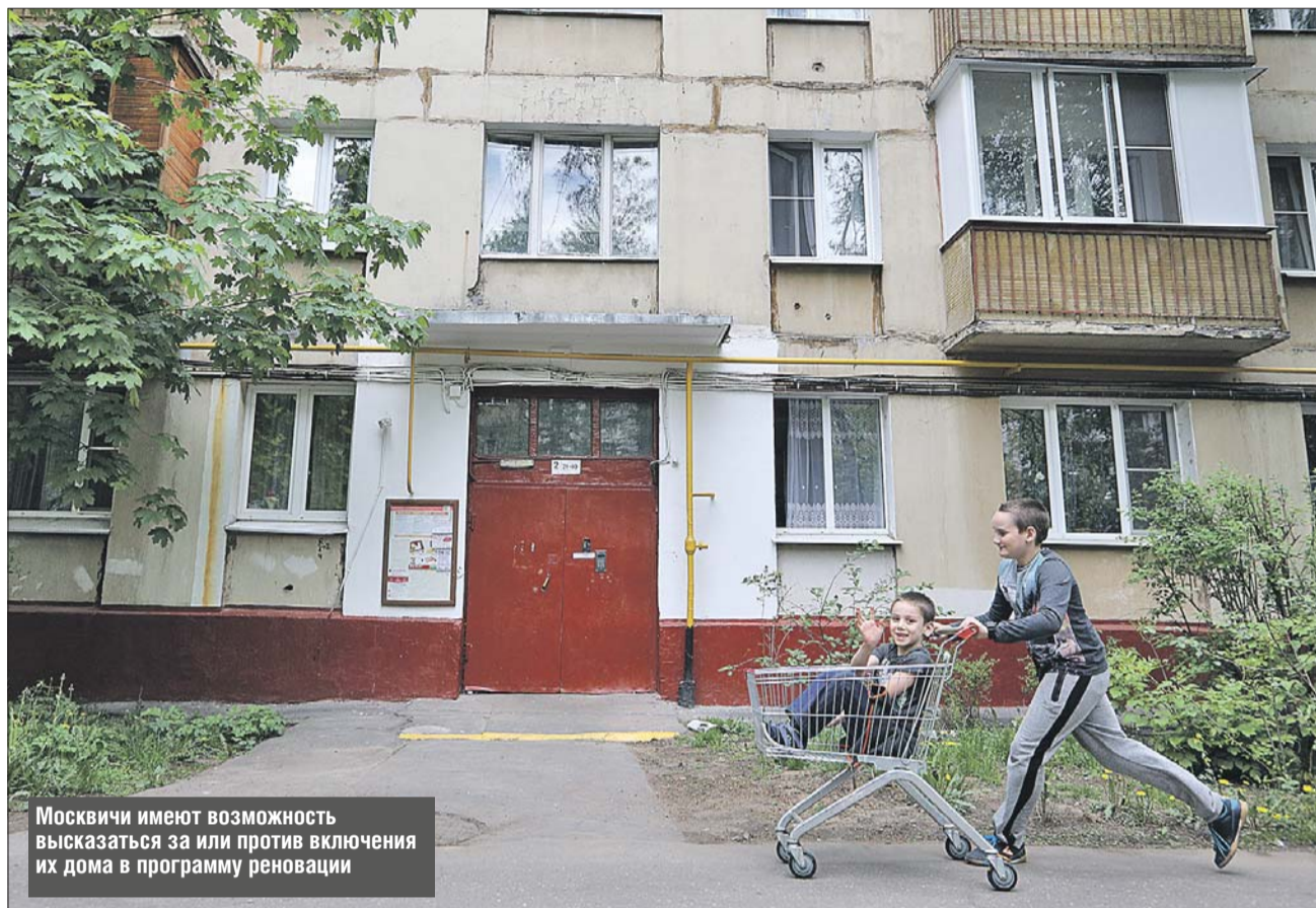
Москвичи имеют возможность высказаться за или против включения их дома в программу реновации