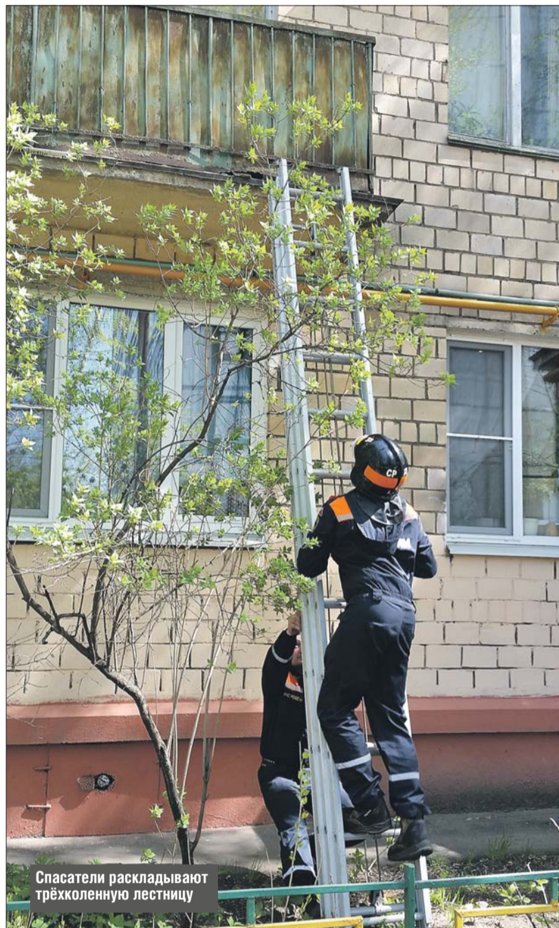
Спасатели раскладывают трёхколенную лестницу

— Мать со вчерашнего утра не отвечает на звонки, а ключи в двери! Никогда такого не было, наверное, мама уже всё... Совсем