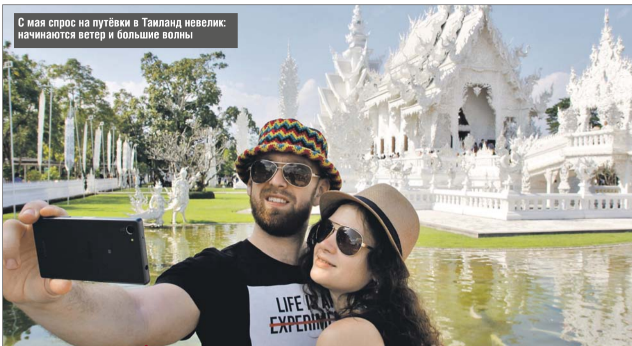
С мая спрос на путёвки в Таиланд невелик: начинаются ветер и большие волны