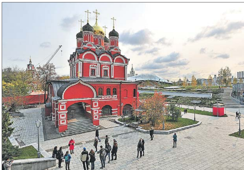
Зарубежным гостям показали парк «Зарядье»