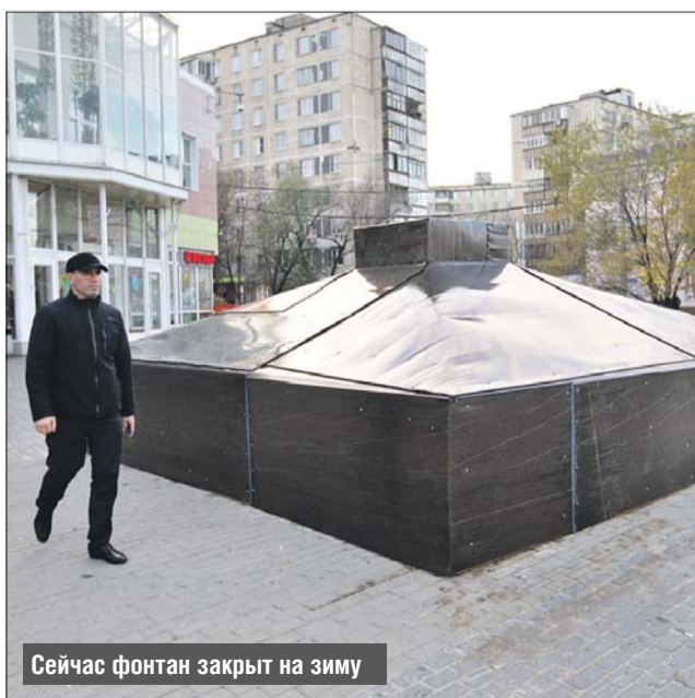
Сейчас фонтан закрыт на зиму