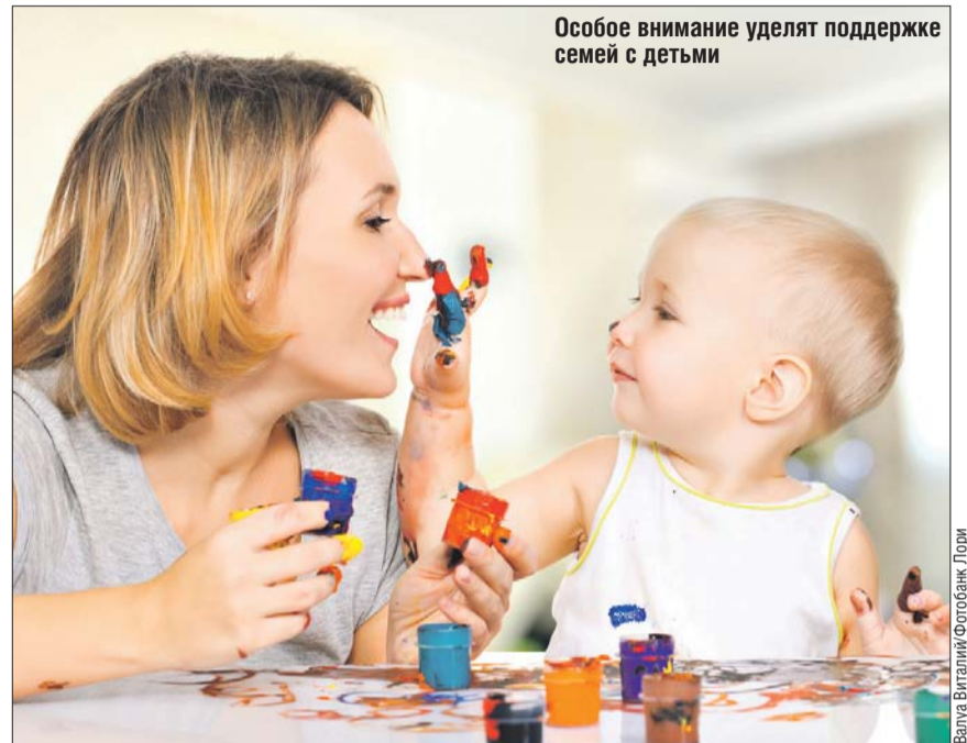
Особое внимание уделяют поддержке семей с детьми