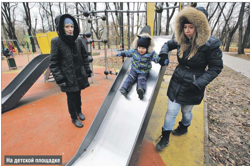
На детской площадке