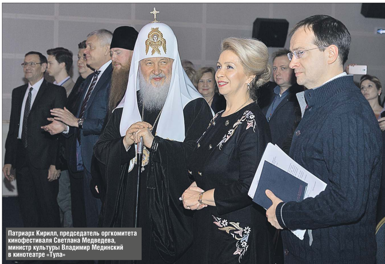
Патриарх Кирилл, председатель оргкомитета кинофестиваля Светлана Медведева, министр культуры Владимир Мединский в кинотеатре «Тула»