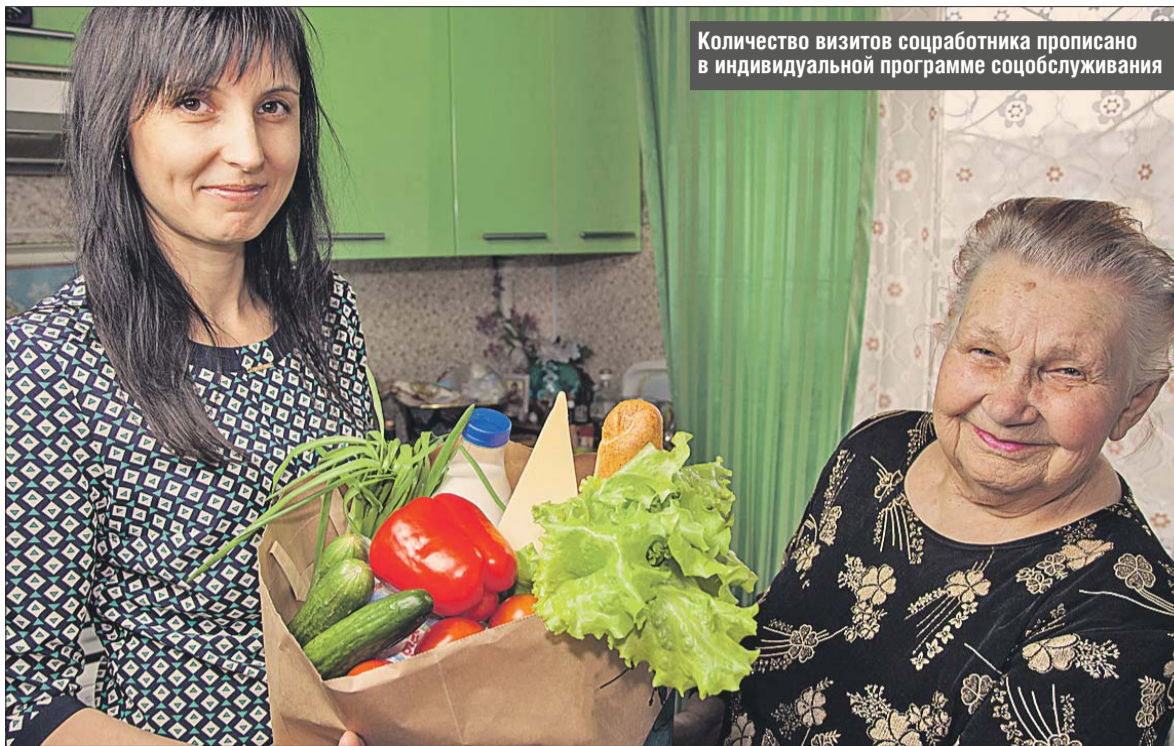
Количество визитов соцработника прописано в индивидуальной программе соцобслуживания

Дополнительное посещение и покупка продуктов, конечно, возможны.