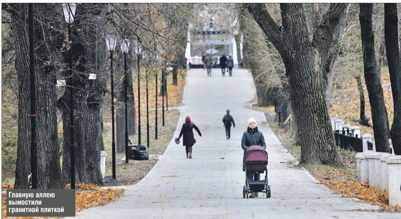
Главную аллею вымостили гранитной плиткой

Лефортовский парк открылся после благоустройства