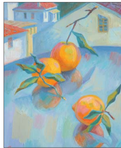
Натюрморт в стиле символизма Антона Стриженко

до 20.00. Полный билет — 100 рублей, льготный — 50 рублей, школьникам — бесплатно. Адрес: ул. Ташкентская, 9. Ольга ВОЛЖСКАЯ