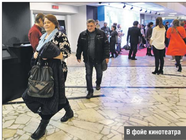
В фойе кинотеатра

Сейчас в «Туле» проходит 14-й Международ-