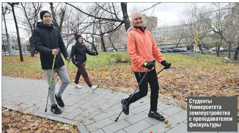
Студенты Университета землеустройства с преподавателем физкультуры

Ворота, ведущие в парк с улицы Красноказарменной, отреставрировали и покрасили. Отсюда начинается широкая аллея, которую вымостили крупной гранитной плиткой. Вдоль прудов протянулась ещё одна дорожка,