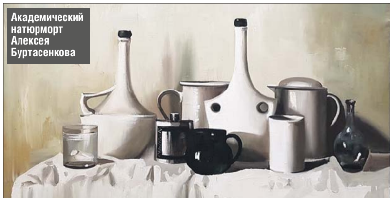
Академический натюрморт Алексея Буртасенкова

— На выставке показаны необычные изображения обычных вещей, созданные в разных художественных техниках: традиционные живописные натюрморты и чёрно-белая графика, геометрические работы в духе кубизма и авангардные сюжеты, мозаика, коллажи, объёмные картины из камней и металла. Все работы дополнены комментариями, которые помогут лучше понять задумку авторов. А чтобы проследить развитие жанра, в экспозиции представлены фоторепродукции известных на весь мир художников разных эпох, — расска-