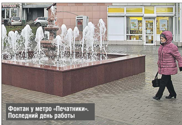
Фонтан у метро «Печатники». Последний день работы