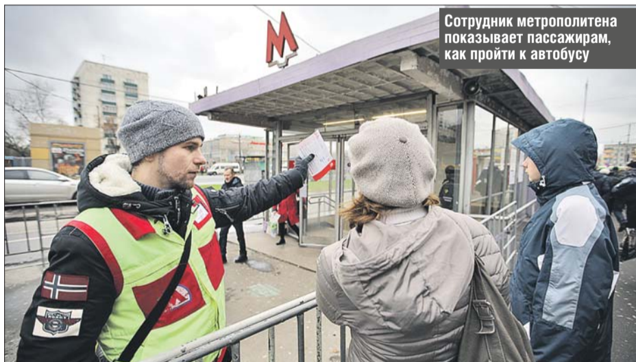
Сотрудник метрополитена показывает пассажирам, как пройти к автобусу