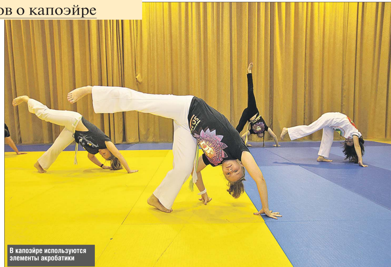
В капозэйре используются элементы акробатики

Сегодня это официальное спортивное единоборство, в котором используются преимущественно техника ног, элементы акробатики и танца. Тренировки и поединки проходят под традиционную этническую музыку и выглядят очень зрелищно.