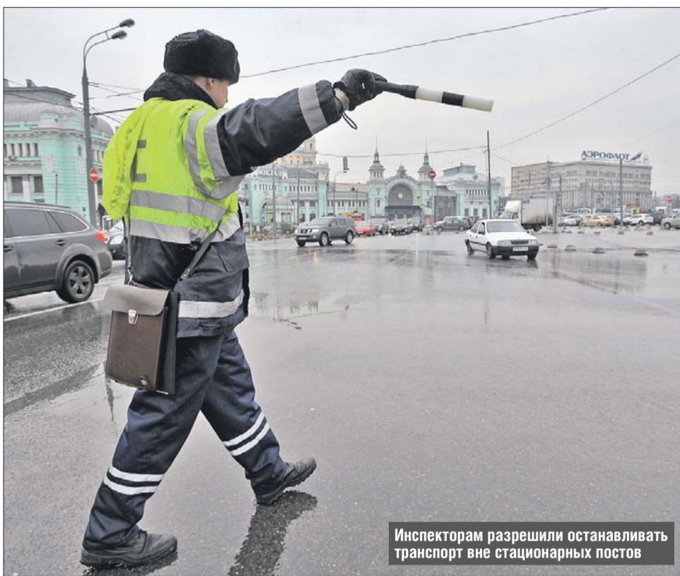
Инспекторам разрешили останавливать транспорт вне стационарных постов