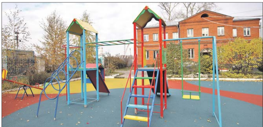
Детская площадка на Рязанском проспекте, 3