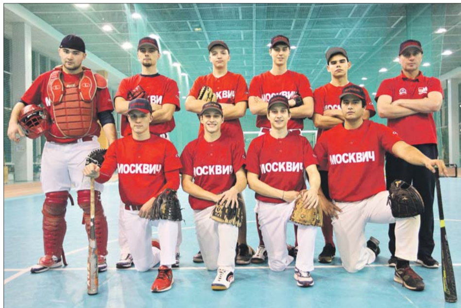
Команда бейсболистов «Москвич» — одна из сильнейших в стране