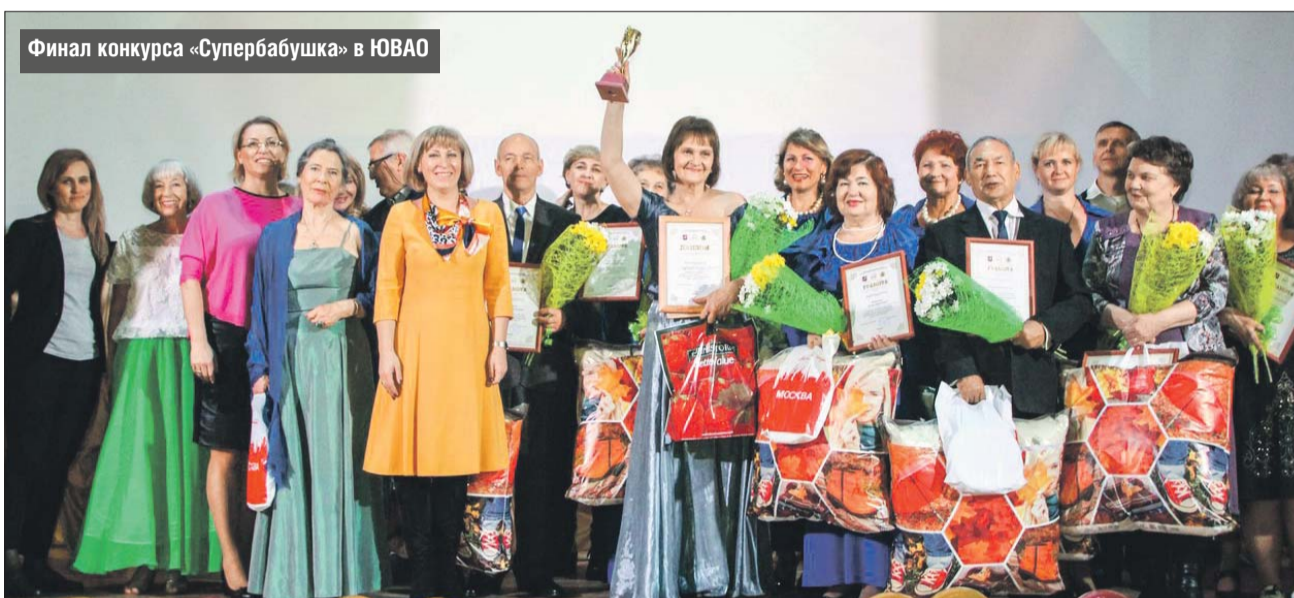
Финал конкурса «Супербабушка» в ЮВАО