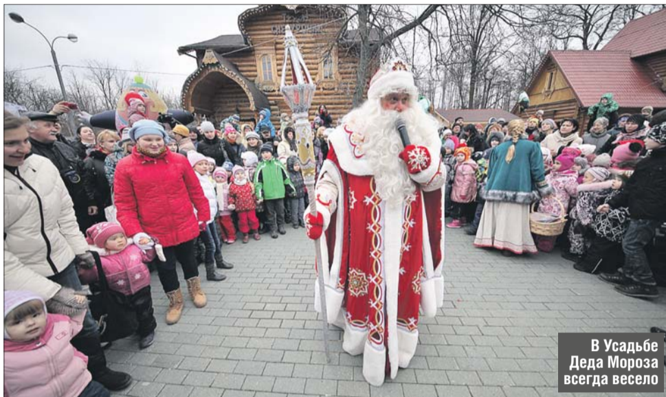
В Усадьбе Деда Мороза всегда весело