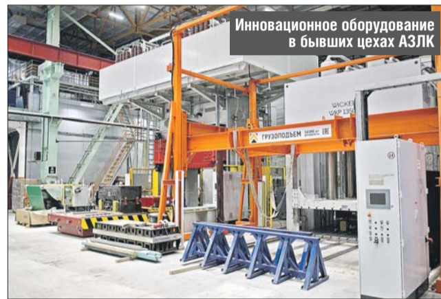
Инновационное оборудование в бывших цехах АЗЛК

ление композитных материалов, по своим свойствам заменяющих металл, и другие передовые технологии.