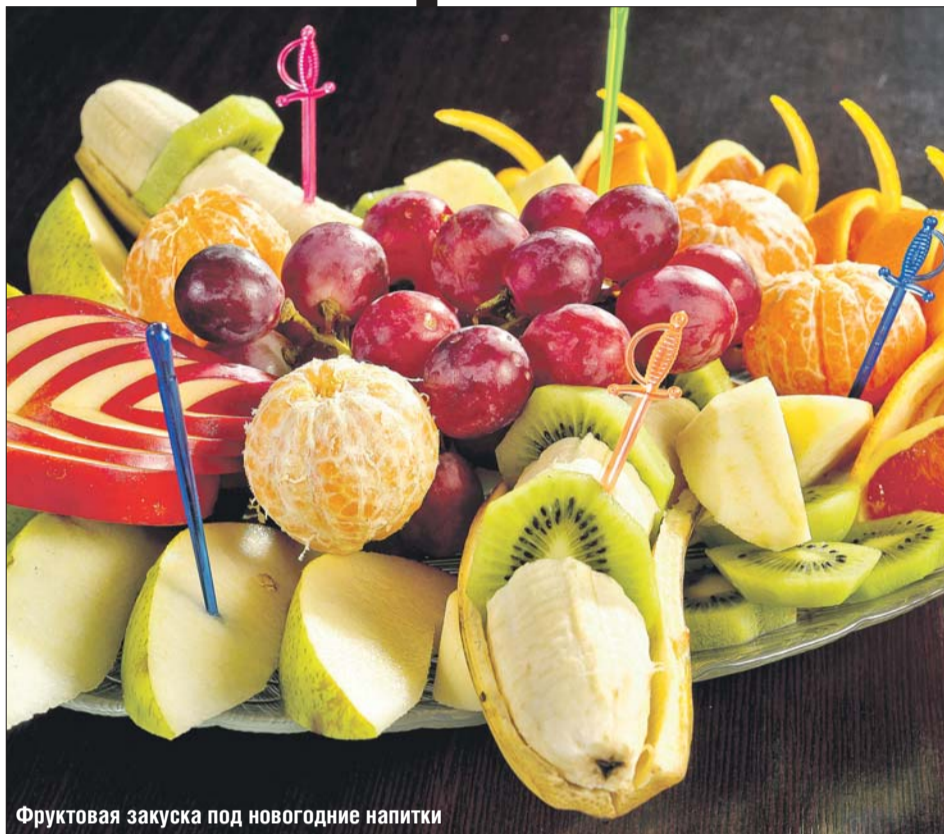
Фруктовая закуска под новогодние напитки

— Людям, склонным к полноте, лучше воздержаться от фруктов, со-