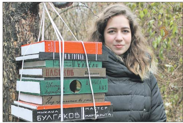
Кормушка для птиц в виде стопки книг