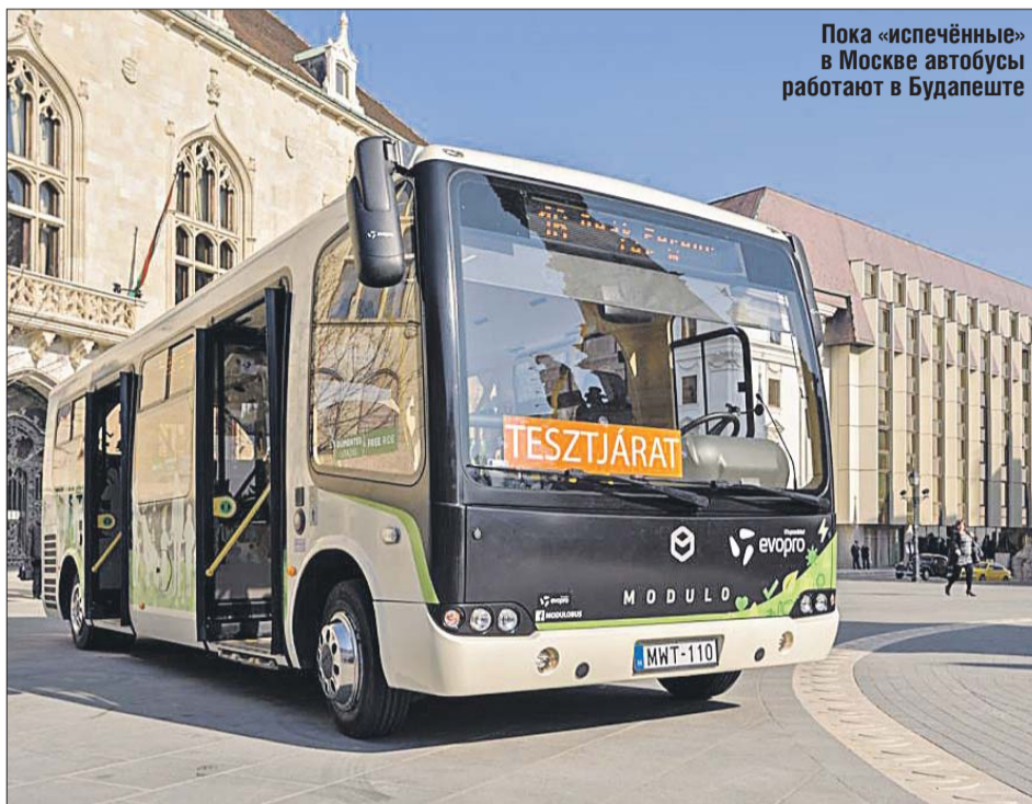
Пока «испечённые» в Москве автобусы работают в Будапеште

За автобус из стекловолокна НЦК был удостоен в 2016 году премии «Сделано в Москве» в номинации «Лучший инновационный экспортноориентированный продукт» и в том же году в Париже — престижной европейской премии InnovationAwards JEC World в номинации «Городской транспорт», наряду с такими компа-