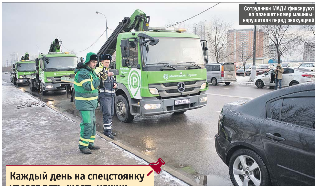
Сотрудники МАДИ фиксируют на планшетах номер машины нарушителя перед эвакуацией

В середине Перервы — вход в торговый комплекс.