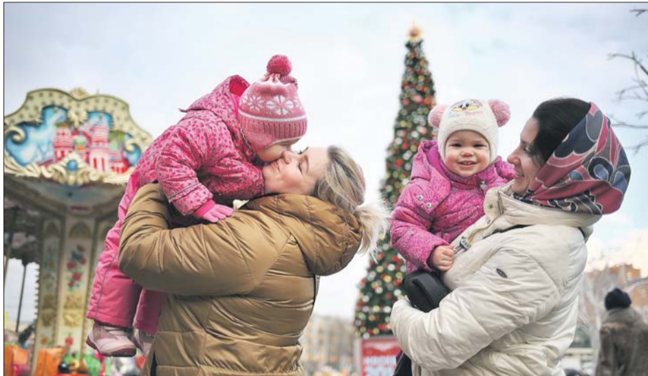
Жители Кузьминок празднуют Рождество

Центром притяжения стала огромная ёлка, украшенная гирляндами и различными игрушками.