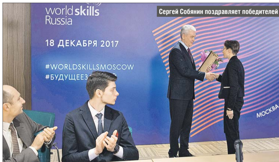
Сергей Собянин поздравляет победителей