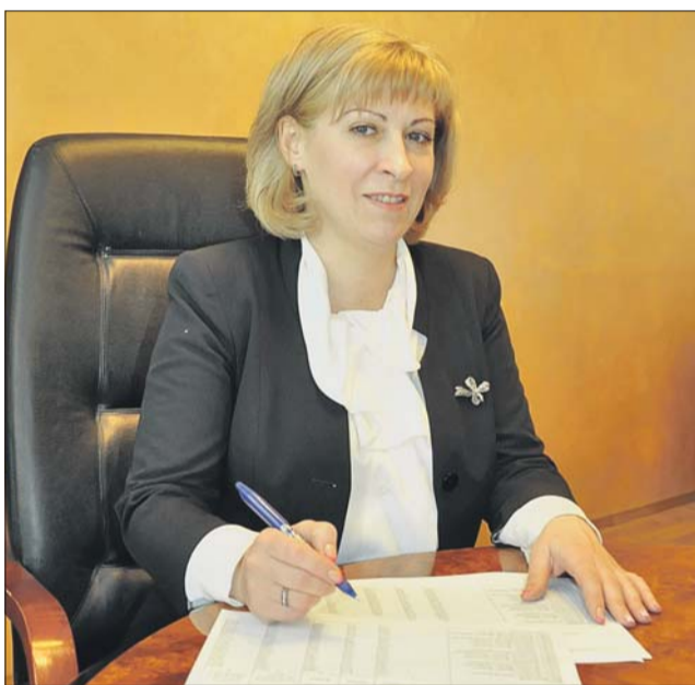
Пресс-служба УСЗН ЮВАО