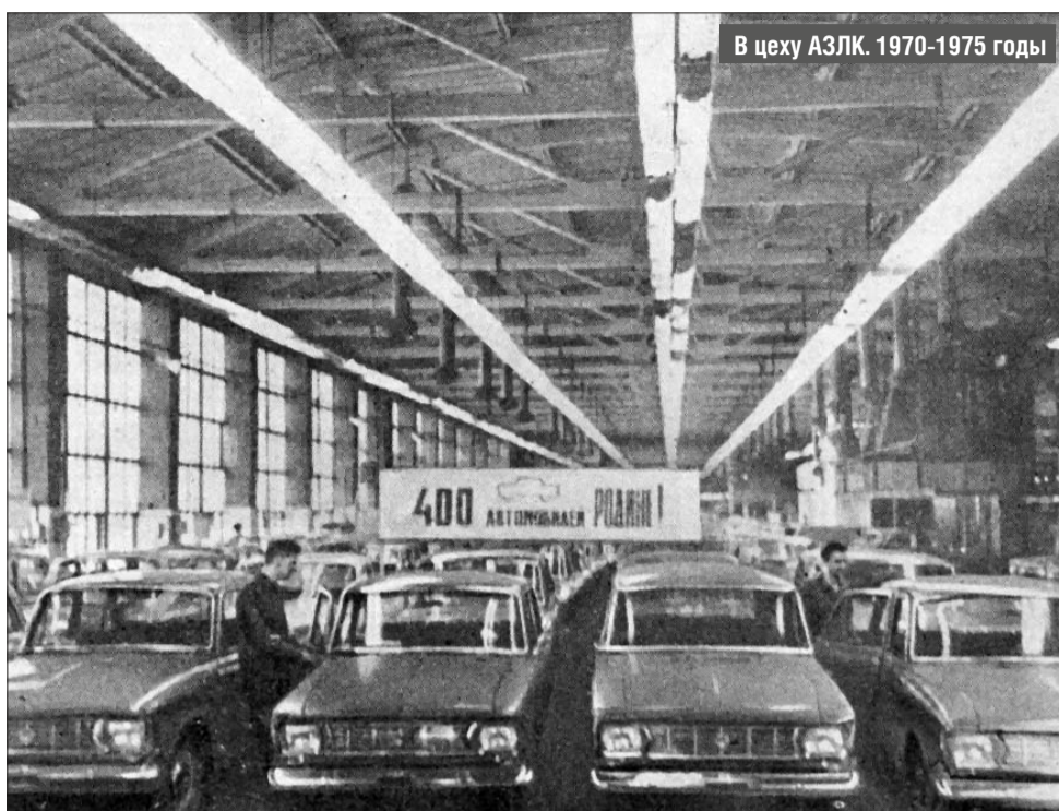
В цеху АЗЛК. 1970-1975 годы

В ноябре руководство пригласило ветеранов АЗЛК на экскурсию, и автозаводцы остались вполне довольны увиденным в родных цехах: началась вторая жизнь завода. Места в технополисе получили компании, использующие самое современное оборудование и производящие качественный продукт: здесь и полиграфия полного цикла, и изготов-