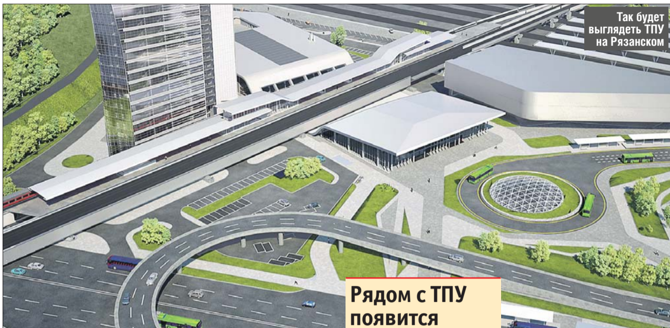
Так будет выглядеть ТПУ на Рязанском