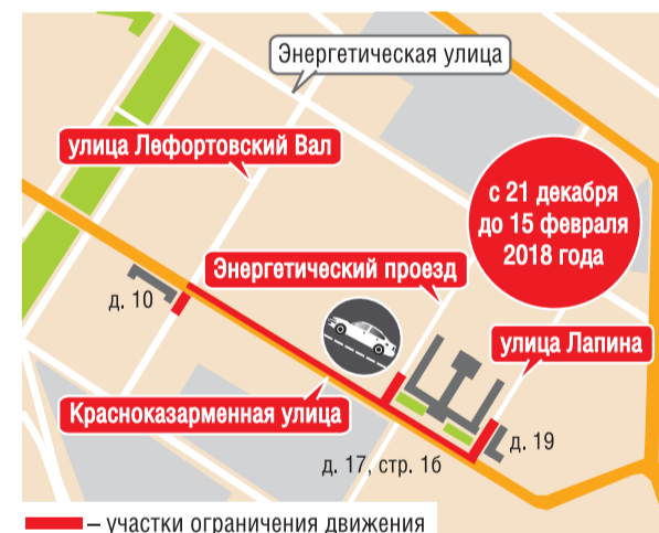
— участки ограничения движения

Кроме того, движение транспорта ограничат на улице Лапина в районе дома 19 и на улице Энергетической в районе дома 17, стр. 16.