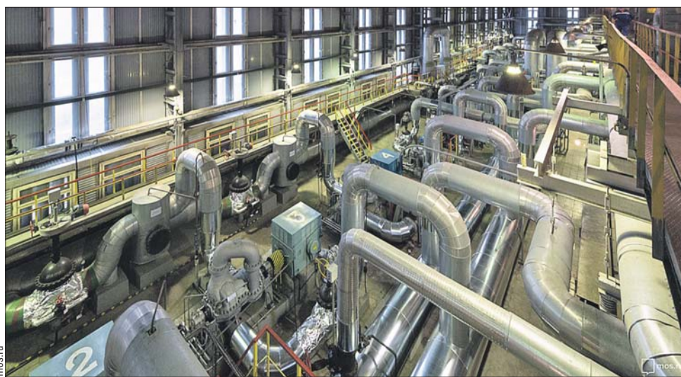
Все системы ТЭЦ работают исправно