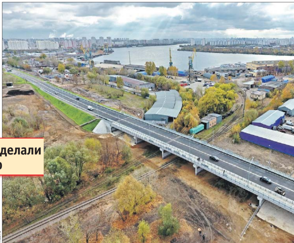
Новый путепровод свяжет несколько районов в двух округах