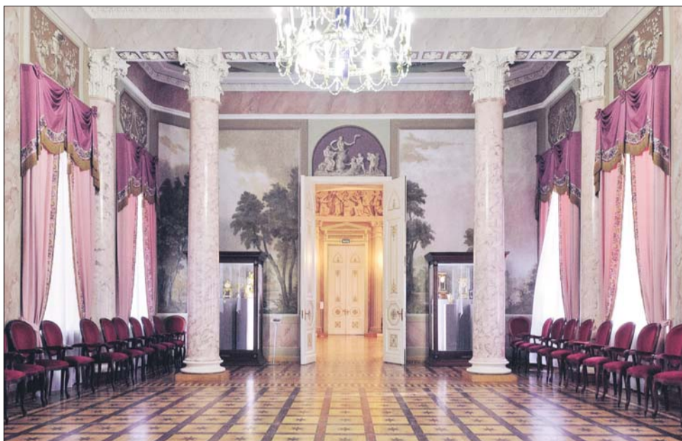
Интерьеры дворца Дурасова

На перформанс «Воображаемые встречи» приглашает Литературный музей-центр Паустовского (ул. Кузьминская, 8). Профессиональные актёры, хореографы и кукло-