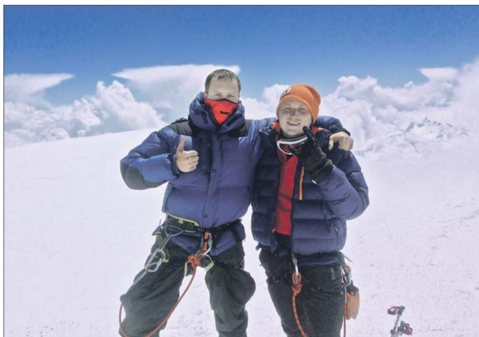
«И ты на вершине, ты счастлив и нем...»

— И тут один коллега по работе говорит: «А давай поедим на Эльбрус». Если честно, то сами не верили в то, что у нас получится,