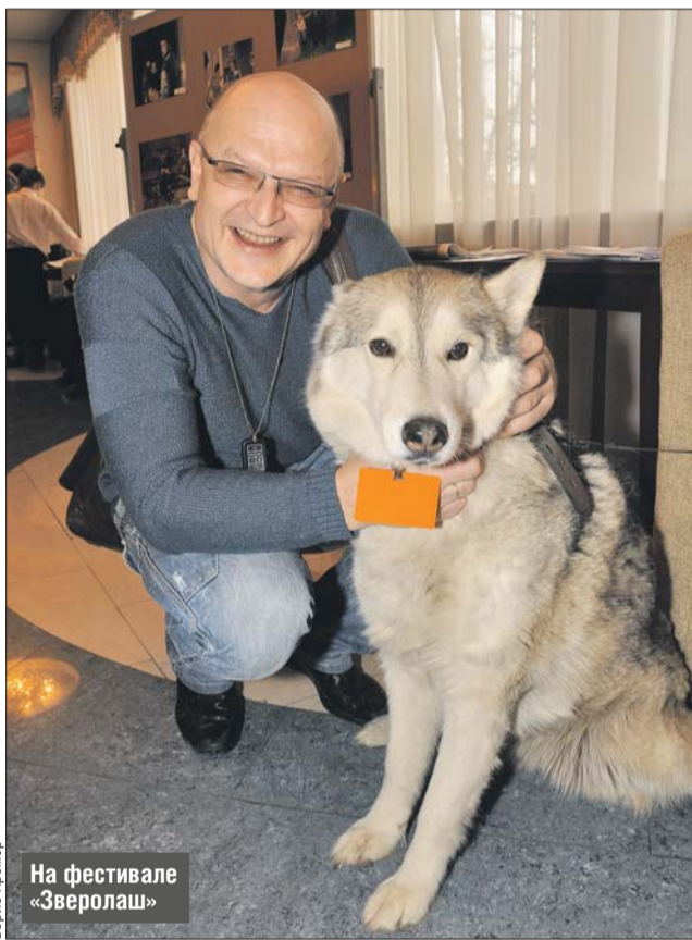
На фестивале «Зверолаш»