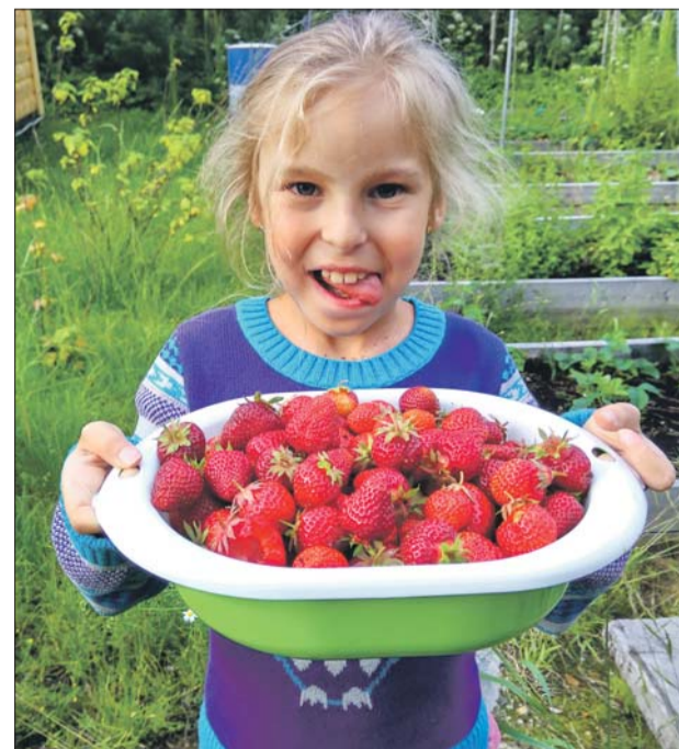
Вот какой урожай клубники собрал прошлым летом житель Выхино-Жулебино