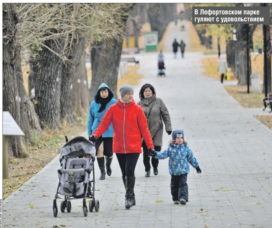
В Лефортовском парке гуляют с удовольствием

ме в среднем 150 рабочих-строителей и крупногабаритная техника, поэтому его были вынуждены закрыть, чтобы быстрее, слаженнее и аккуратнее провести работы.