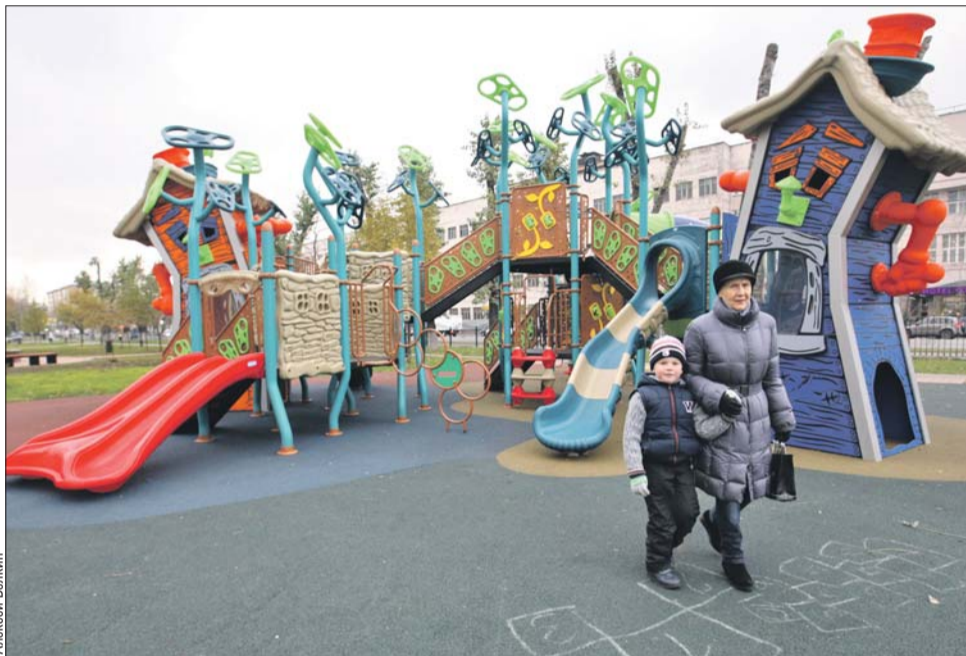
Жительница Шарикоподшипниковской Лилия с правнуком на детской площадке

— Раньше здесь был маленький фонтанчик площадью 2,5 квадратного