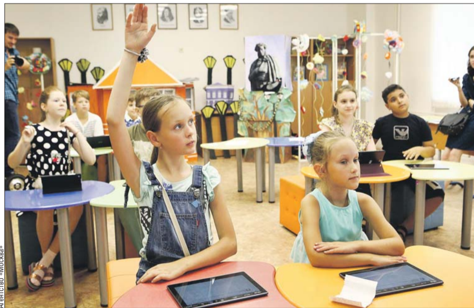
Обучение в школах города почти полностью компьютеризировано