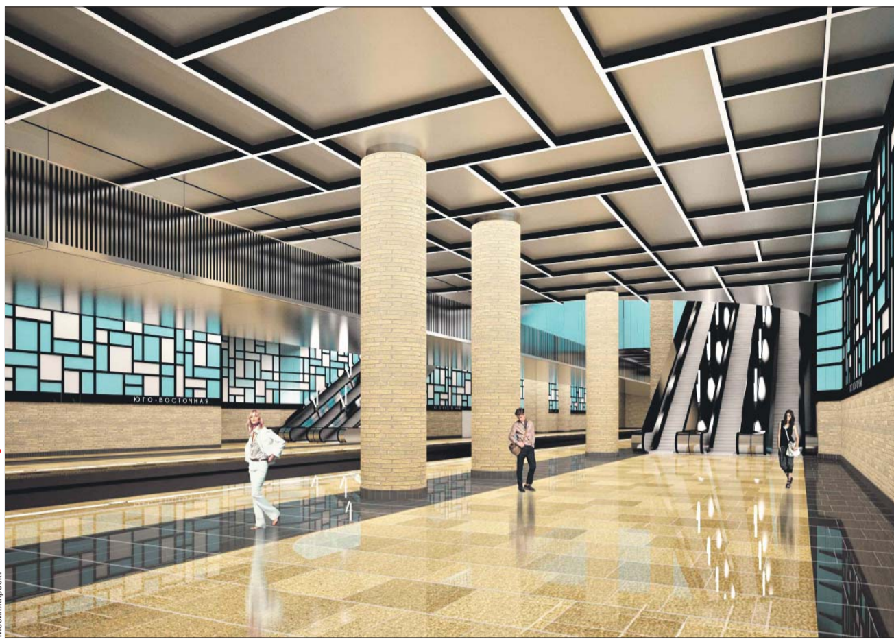
Так будет выглядеть станция «Юго-Восточная»

цинских учреждений. На реализацию программы «Столичное здравоохранение» в городском бюджете и бюджете ОМС на 2018 год запланировано 445 млрд рублей. Перед здравоохранением стоят вполне традиционные задачи, отметил мэр, — обеспечить рост продолжительности жизни москвичей, своевременную профилактику