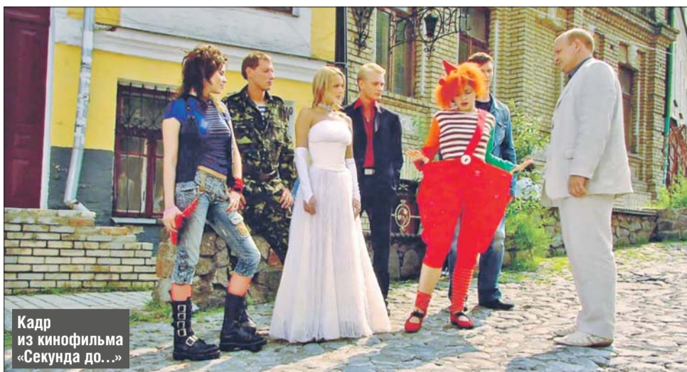
Кадр из кинофильма «Секунда до...»