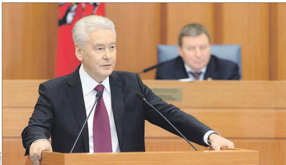
Сергей Собянин выступает в Мосгордуме

Он отметил, что с 2011 года расходы городского бюджета на эти цели были увеличены в два раза, в три раза выросли бюджетные субсидии и льготы на оплату услуг ЖКХ. Москва сохранила привычные льготы на оплату