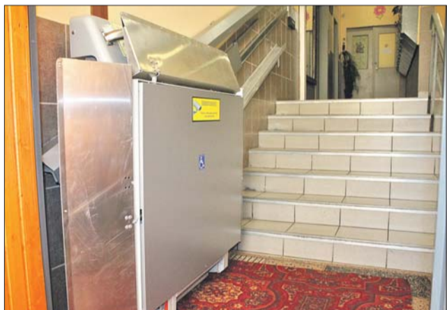
Подъемник для инвалидов в жилом доме

Людям с ограниченными возможностями здоровья стало удобнее посещать ряд предприятий потребительского рынка и услуг на территории района Выхино-Жулебино.