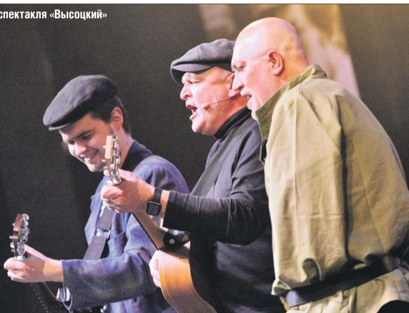
Сцена из спектакля «Высоцкий»

с этим мне вспомнился фильм «Моя Пречистенка», где вы очень убедительно играете Владимира Ленина. Готовясь к этой роли, что-то открыли для себя новое?