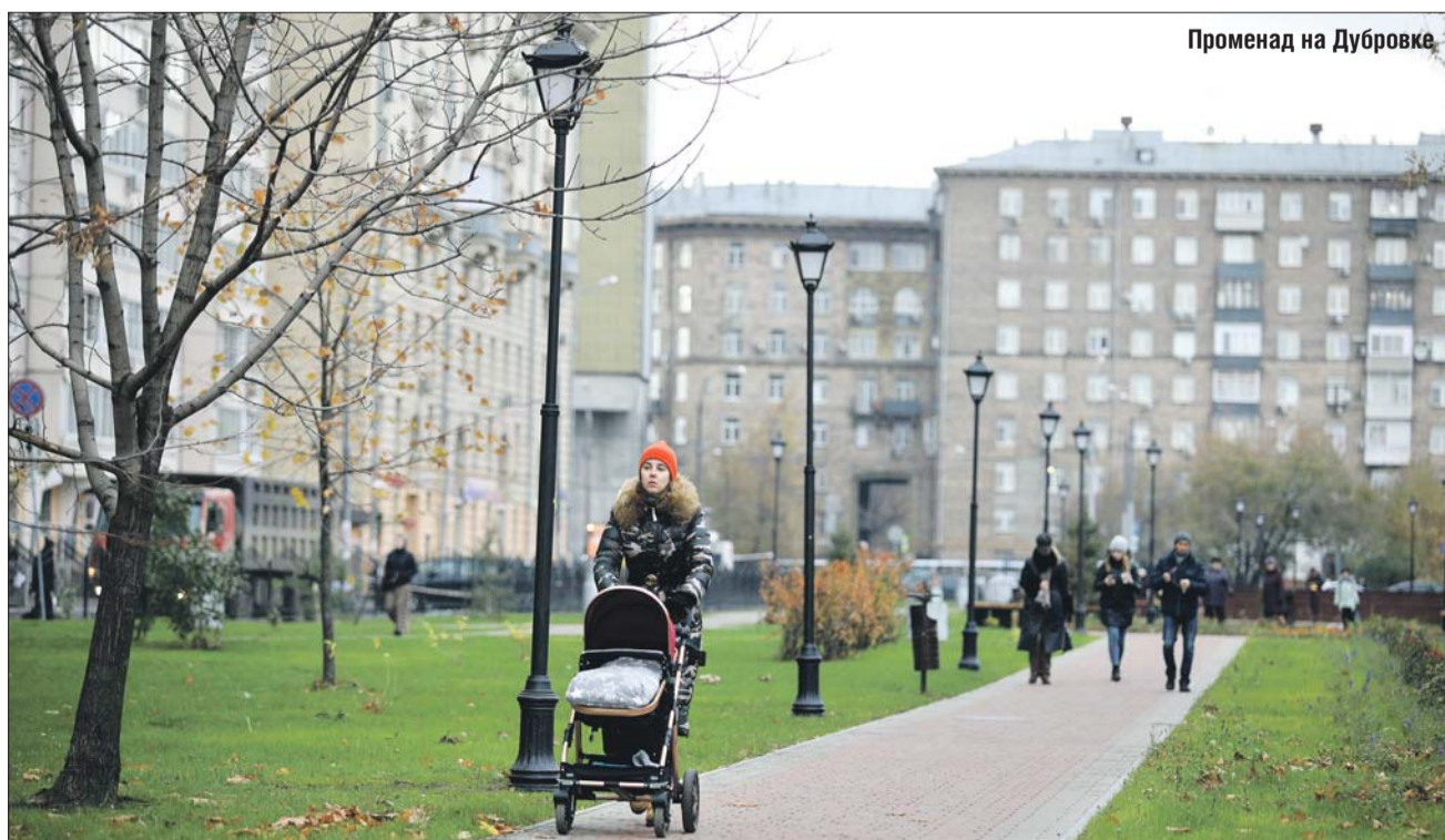
Променада на Дубровке

Для концертов у дома 38 построили деревянную эстраду