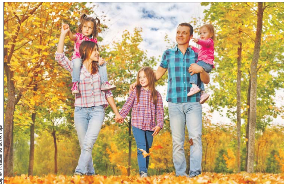
Ежемесячное пособие на ребёнка увеличится