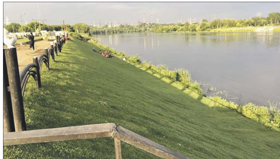
Только что положенный газон в Марьине

50 тысяч метров рулонных газонов уложат в парке 850-летия Москвы в ближайший месяц. Таким образом решено оформить береговой склон, где традиционно любят отдыхать посетители парка.