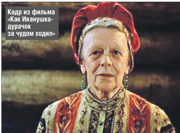
Кадр из фильма «Как Иванушка-дурачок за чудом ходил»