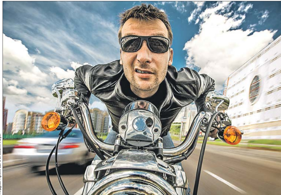
Без шлема — значит, без головы

Такие трагические истории, к сожалению, не редкость. В Интернете можно найти множество ужасающих записей видеорегистраторов, зафиксировавших ДТП