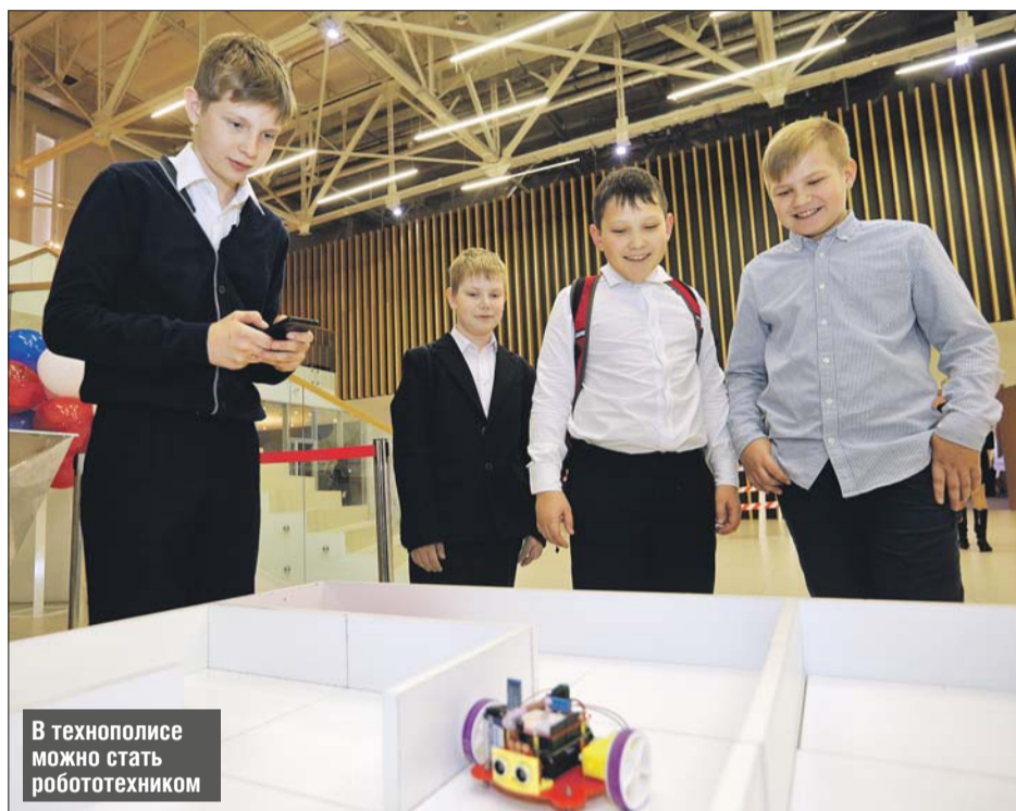
В технополисе можно стать робототехником

Как нам пояснили в пресс-службе Департамента науки, промышленной политики и предпринимательства, привязки к определённому месту учёбы нет и занимаются школьники со всей Москвы. Однако будет учитываться место учёбы школьника. В двух московских «Кванториумах» (технополисы «Москва» и «Мосгор-маш» в ЮАО) обучаются школьники 5-11-х классов (13-17 лет), имеющие способности к физико-математическим наукам.