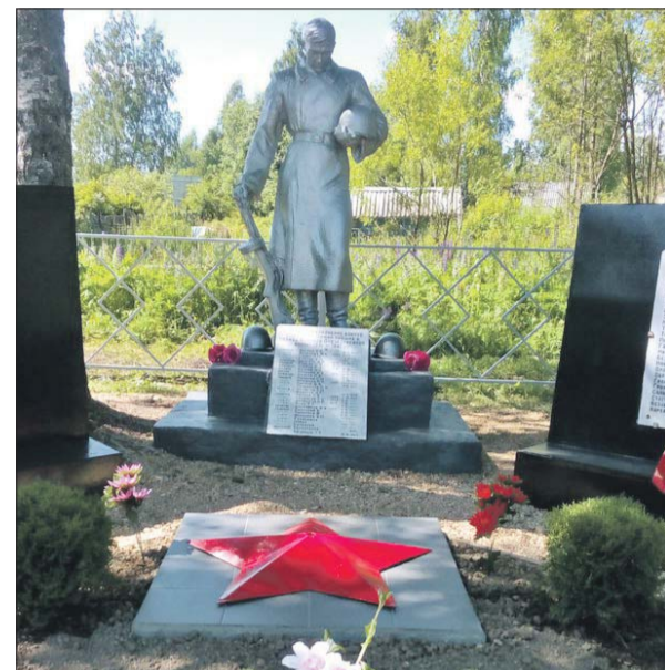
Мемориал погибшим солдатам у деревни Карамзино

Из экспедиции вернулись члены туристическо-поискового клуба «Горизонт» НИУ МЭИ. За две недели 50 студентов реконструировали воинский мемориал в деревне Карамзино Зубцовского района Тверской области.