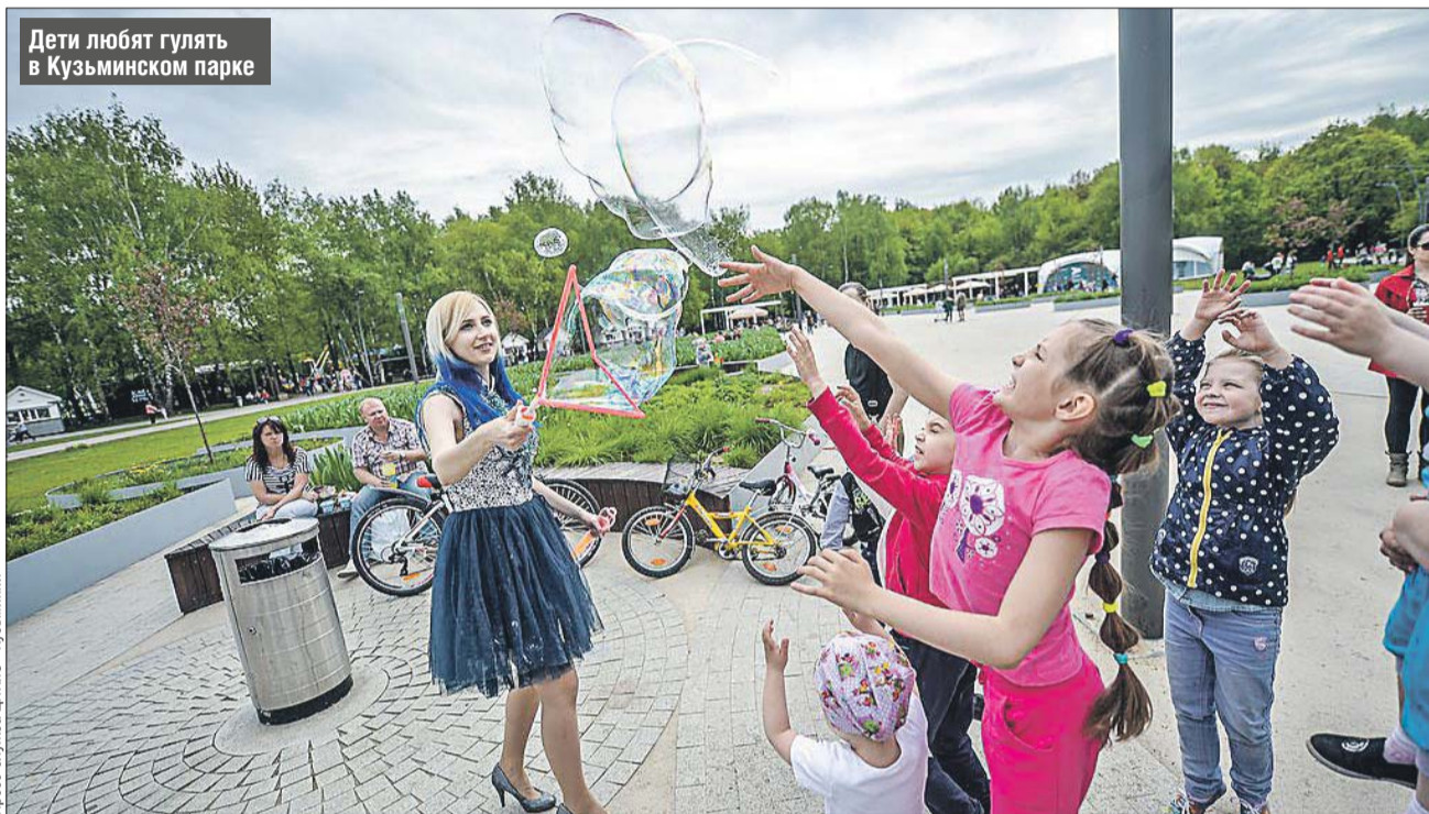
Дети любят гулять в Кузьминском парке

После революции тут долгое время был Институт экспериментальной ветеринарии, а в 1977 году было принято решение организовать парк культуры. Сегодня сама усадьба не входит в состав ПКиО «Кузьминки», однако все посети-