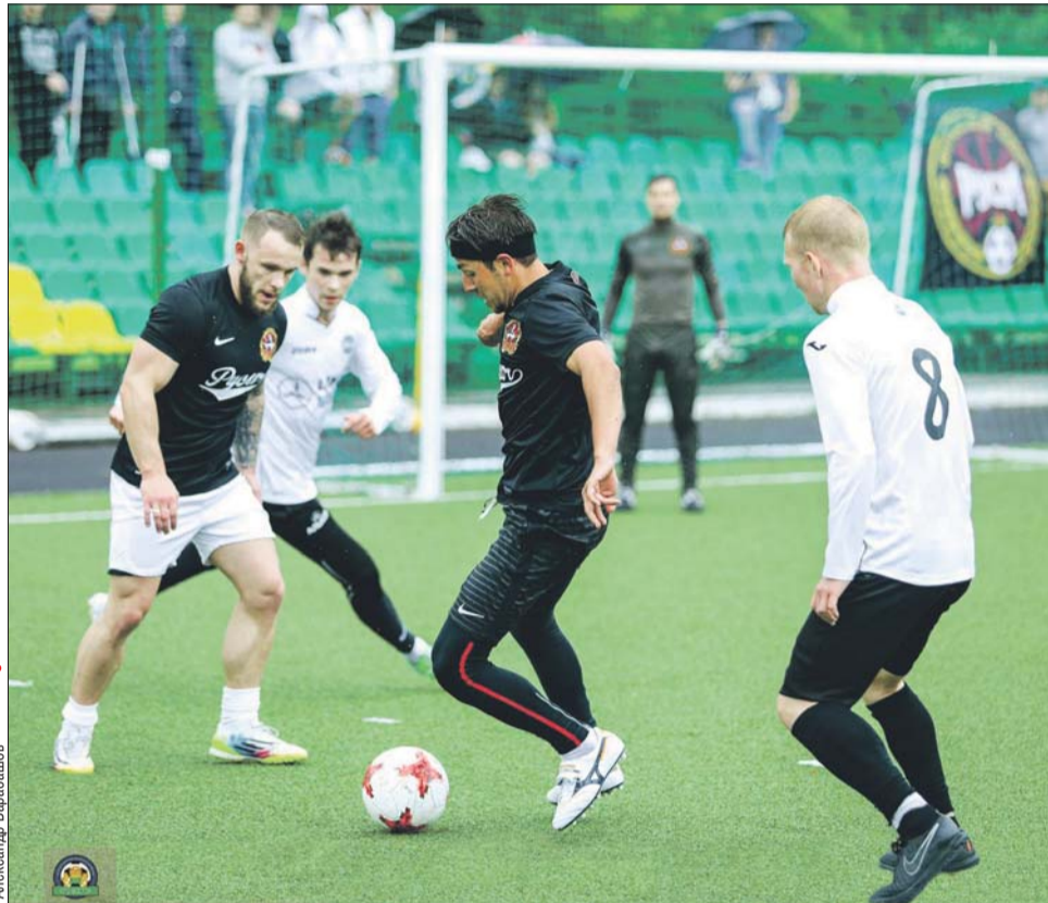
Команда «Русич» (чёрные футболки) вернулась в высшую лигу