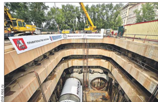
Тоннелеройная машина прокладывает путь в двух направлениях

Всего в столице на строительстве метро сейчас задействовано девять таких комплексов.