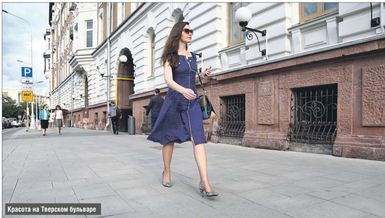
Красота на Тверском бульваре

Осенью, в благоприятное для посадок время, на Бульварном кольце высадят 8,5 тысячи кустарников. На улицах установят новые комфортные лавочки, урны и почти три десятка информационных стел с точками доступа в Интернет.