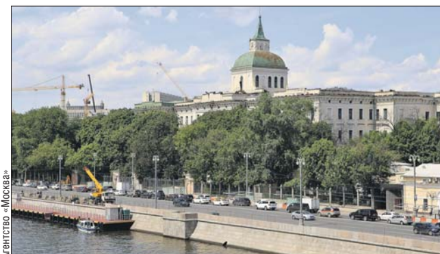
На набережной много уникальных памятников архитектуры

Комплекс зданий на Москворецкой набережной (Китайгородский пр., 9/5) включает 33 строения, девять из которых являются объектами культурного наследия, ещё пять представляют ценные градостроительные объекты. Среди них — Воспитательный дом, построенный по проекту Карла Бланка во второй половине XVIII века.