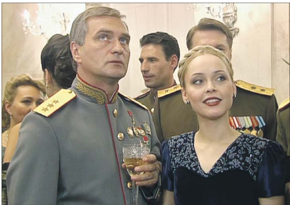
Кадр из фильма «Московская сага»

процесс. Так как часто пишу музыку к кино, мне доводится бывать на съёмочных площадках. Это очень интересно — наблюдать процесс киносъёмки, также и написания музыки. Но я очень люблю и аплодисменты! Если спектакль или фильм получился, на премьере ты выходишь на сцену, кланяешься, тебе дарят букеты — красота! Но поскольку я уже опытный товарищ, не надо это принимать всерьёз. Всё это быстро проходит и становится уже неважно.