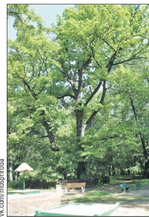
Петровский дуб посадили в 1813 году