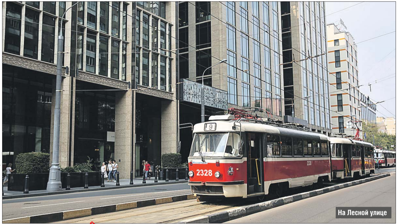
На Лесной улице

Здесь уложат 200 тысяч кв. метров газона, сделают пешеходные дорожки, поставят скамейки, высадят 140 деревьев, а провода воздушных линий электропередачи спря-