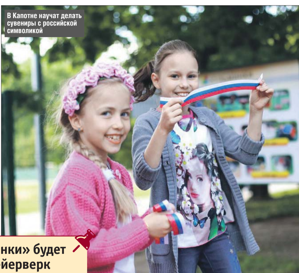
В Капотне научат делать сувениры с российской символикой