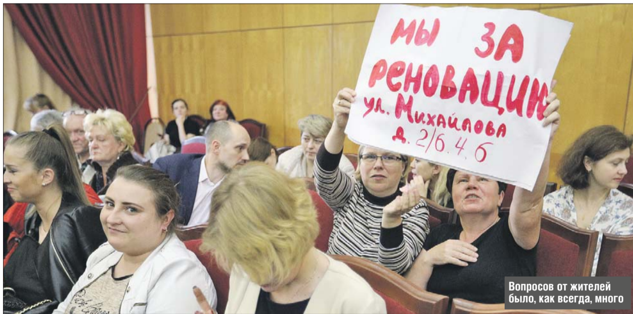
Вопросов от жителей было, как всегда, много

— Уважаемые жители Рязанского района, если