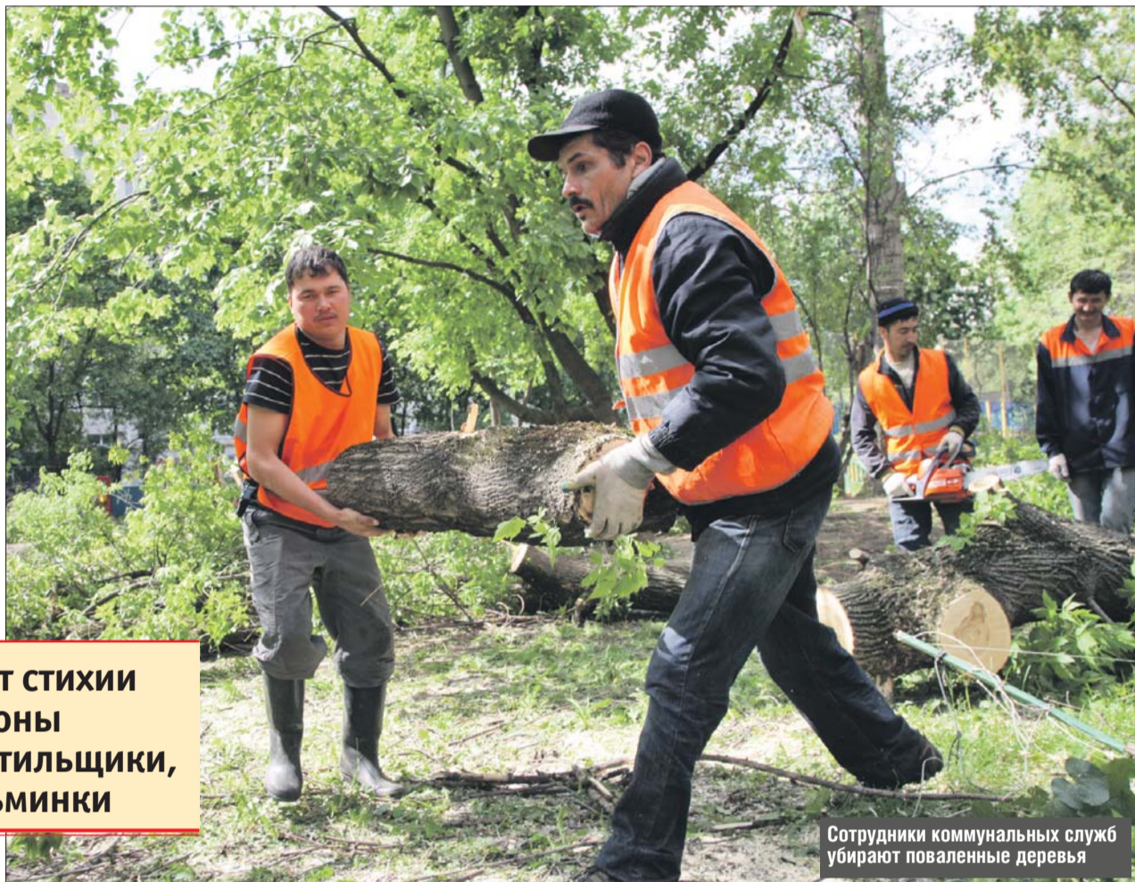
Сотрудники коммунальных служб убирают поваленные деревья

По данным МЧС по ЮВАО, в округе пять человек были госпитализированы, один погиб.