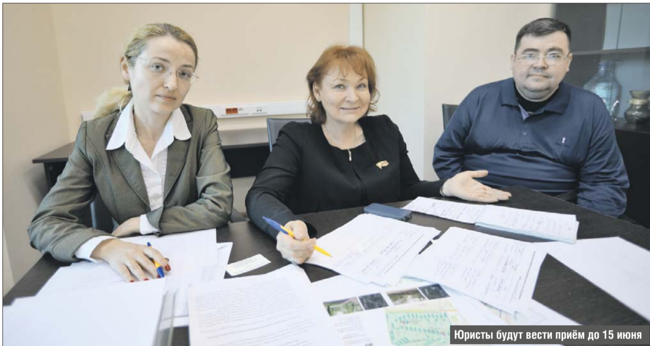
Юристы будут вести приём до 15 июня

П рофессиональные юристы проводят бесплатные консультации для жителей по программе сноса и расселения хрущёвок. Соглашение об этом заключили на прошлой неделе Столичная коллегия адвокатов и Мосгордума.