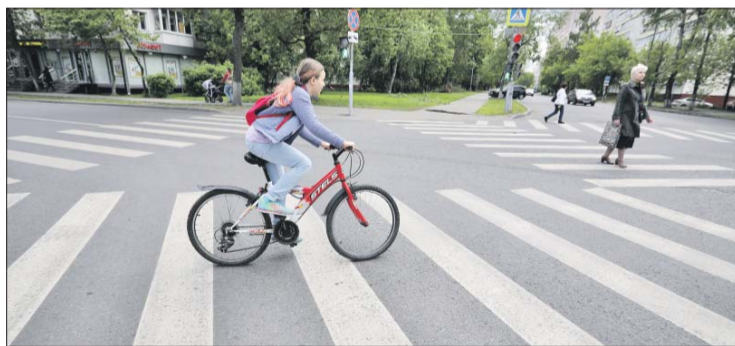
Перекрёсток Новороссийской и Краснодарской улиц

Диагональную пешеходную разметку нанесли на перекрёстке Новороссийской и Краснодарской улиц. Светофоры на переходе отрегулированы таким образом, что загораются для пешеходов одновременно на всех направлениях. Сейчас на перекрёстке