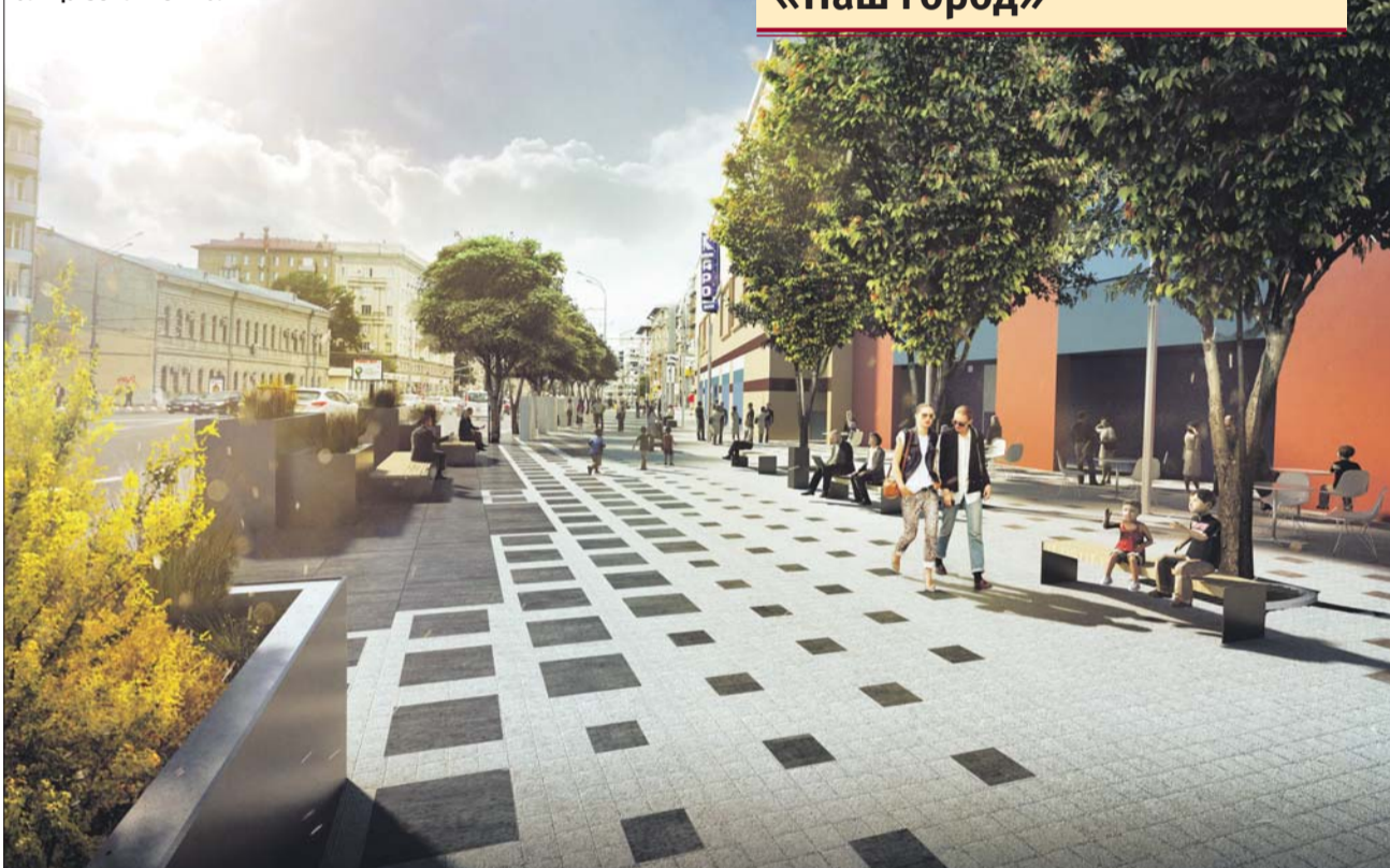
Улица Земляной Вал