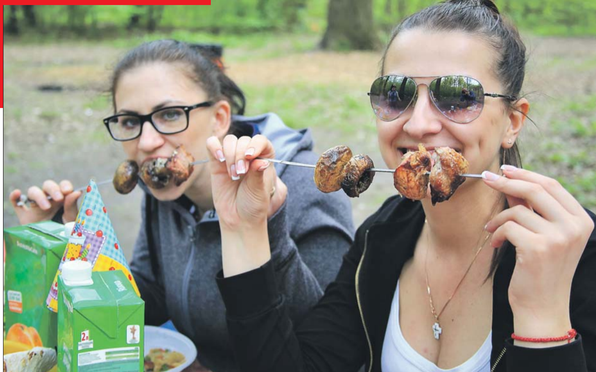
На пикниковых площадках есть столы и скамейки