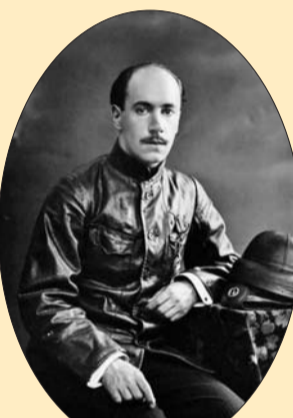
Игорь Иванович Сикорский

Ну а в мировом масштабе это чревато непоправимыми катастрофами. Такая угроза стала очевидной не сегодня и не вчера. Ровно 70 лет назад размышлял об этом очень яркий человек Игорь Иванович Сикорский — великий конструктор, изобретатель, но ещё и богослов, философ. В 1947 году в Америке он написал необычный труд «Незримая борьба», в котором с тревогой говорил о том, что происходит в мире, куда идёт человечество и как убийственны те самые двойные стандарты. Вот цитата из его работы: «Когда у дикаря спросили: «Что такое зло?», он ответил: «Зло — это если кто-то украдёт мою жену и скот». На вопрос «Что такое добро?» он ответил: «Добро — это если я украду чью-то жену и скот». Эти принципы, к сожалению, становятся образцом для руководства нашей цивилизацией».