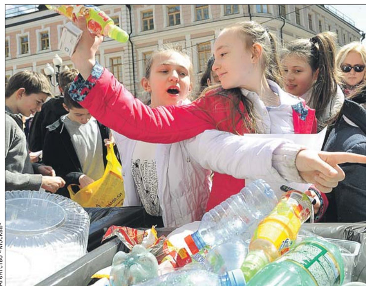
На передвижных пунктах можно будет сдать бумагу, картон, пластик, металл и стекло