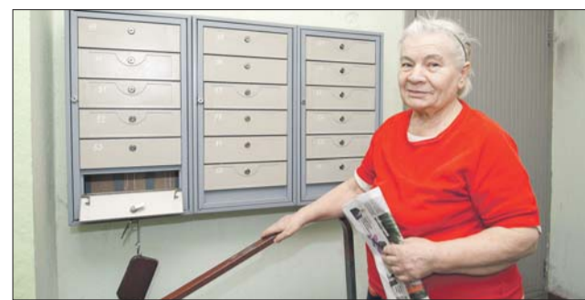
Если сломался замок почтового ящика, надо обратиться в управляющую компанию

Вы написали, что для бесплатной замены замка в почтовом ящике нужно обратиться в управляющую компанию. Я позвонила в «Жилищник», но мне ответили, что подобных услуг не оказывают. Помогите разобраться.