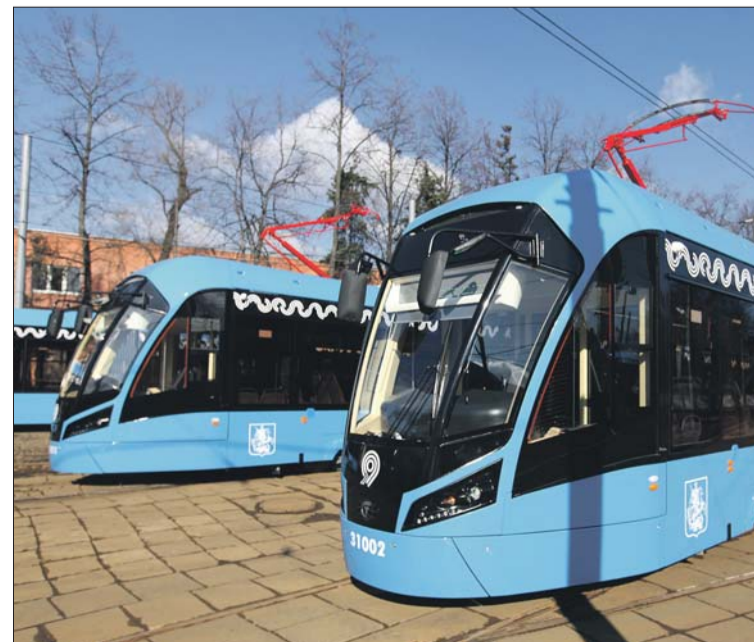
Планируется, что по новым трамвайным путям начнут ходить новые трамваи «Витязь-М»

Сейчас по Лесной улице ходят трамваи, там есть участок действующей линии. Но до Белорусского вокзала он не доходит, пути заканчиваются тупиком. При строительстве нового участка тупик разберут, а линию продлят. А возле Белорусского вокзала появится разворотное кольцо.