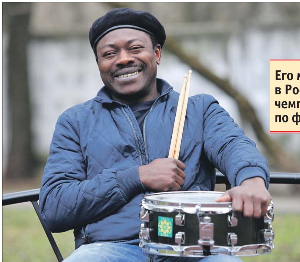
Свою первую ударную установку Симон сделал из старых вёдер, когда ему было 11 лет

Первую трудность представлял русский язык, параллельно с которым надо было осваивать профессию со множеством сложных терминов: — Понимать всё и немного говорить стал толь-