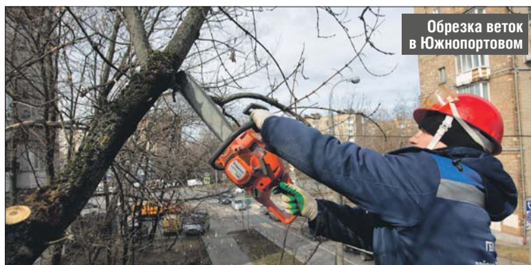
Обрезка веток в Южнопортовом