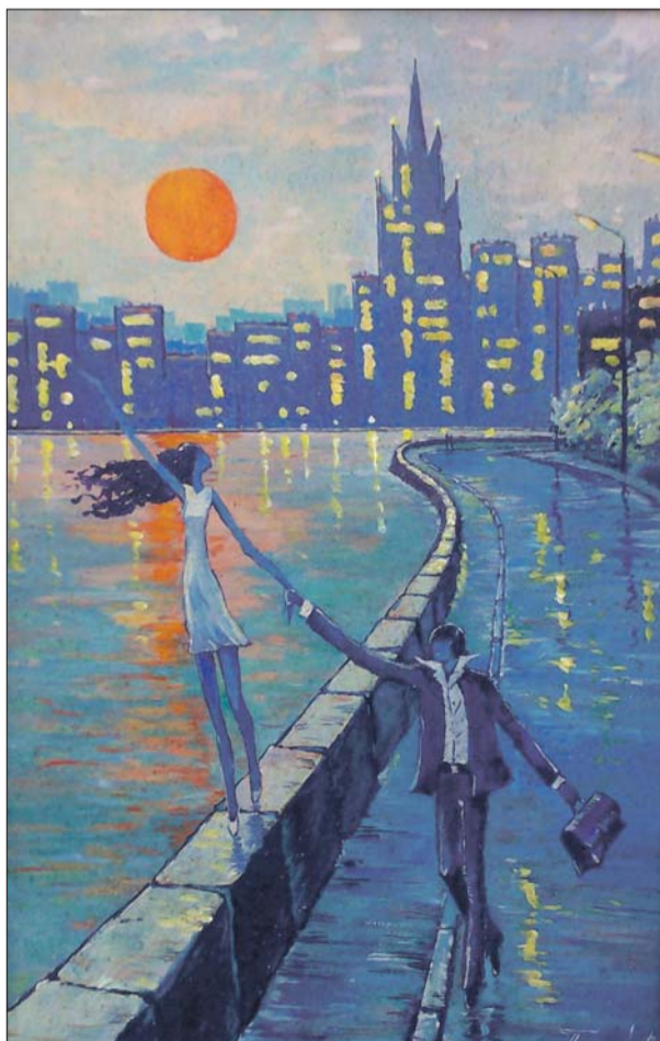
Сюжет картины «Юность» художнику Владимиру Пугачёву навеяла песня «Я шагаю по Москве»