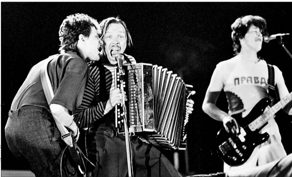
В 1988 году в парке Горького прошёл первый в СССР Международный фестиваль «Музыканты за мир». Выступает группа «Бригада С»

— Было. Первый раз я попал туда, когда учился в железнодорожном техникуме и у нас была там группа — называлась, кажется, «Поющие айсберги». Мы тогда играли на дискотеках, и нас пригласили выступить в ДК АЗЛК. Потом, когда очень корот-