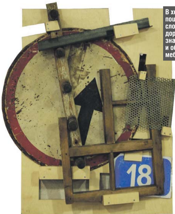
В ход пошли даже сломанные дорожные знаки и обломки мебели