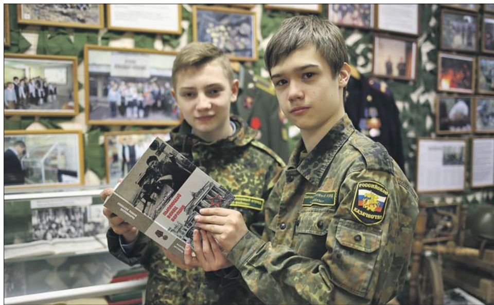
Школьники на презентации книги