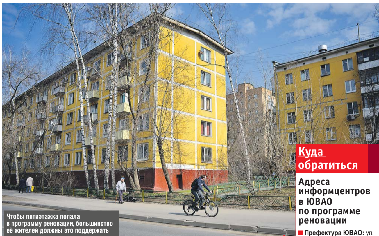
Чтобы пятиэтажка попала в программу реновации, большинство её жителей должны это поддержать

Когда законопроект будет принят в окончательном, третьем чтении, у московских властей появится право про-