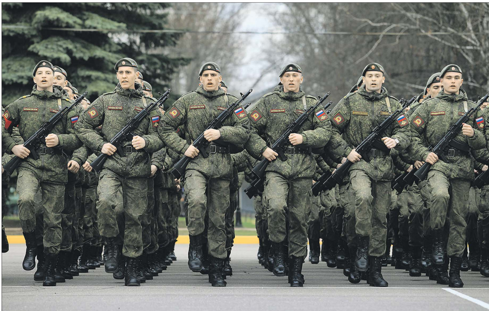
Если призывник имеет детей или престарелых родителей, его направят служить ближе к месту жительства

■ Южнопортовый Школа №2129, ул. 6-я Кожуховская, 8. Тема: «О проведении праздничных мероприятий, посвящённых празднованию Дня Победы в Великой Отечественной войне. О благоустройстве дворовых территорий и ремонте подъездов».