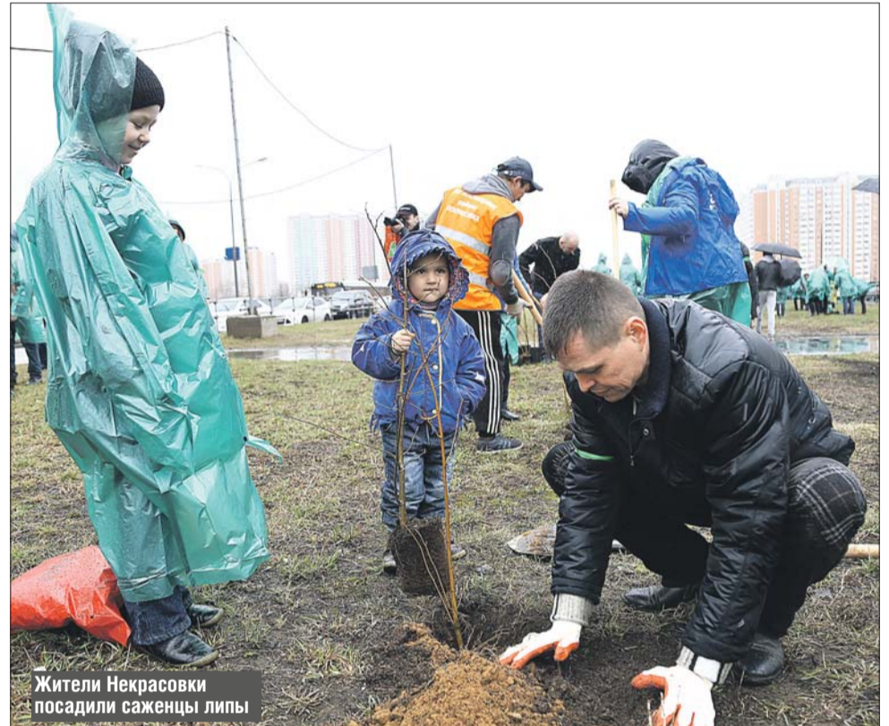
Жители Некрасовки посадили саженцы липы

8 апреля в районе Некрасовка прошёл первый весенний субботник. Десятки человек, несмотря на дождь, пришли поучаствовать в этом мероприятии. Инициативная группа жителей посадила на полукруге между улицами Покровской и Рождественской первую липовую аллею.