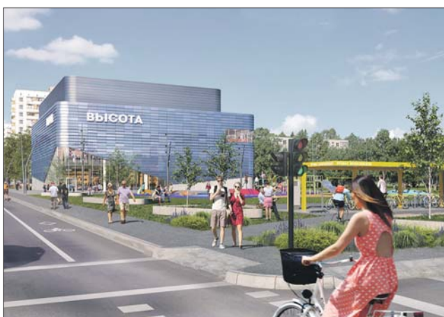
Макет кинотеатра «Высота»

стр. 4 Атракционы на ВДНХ возведут строители парижского Диснейленда