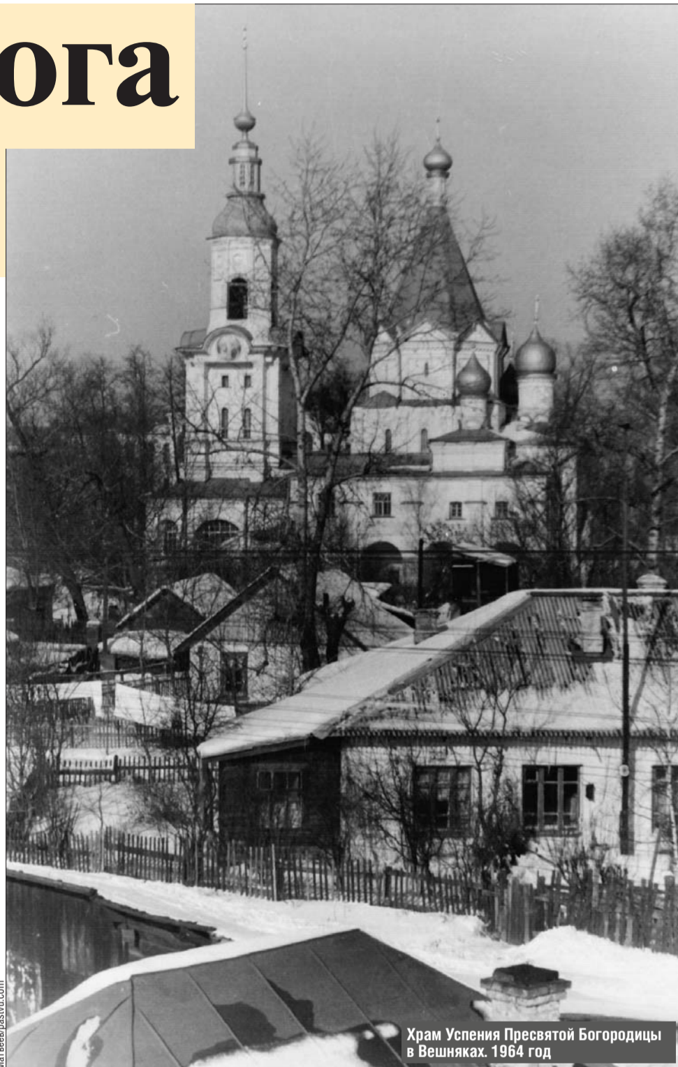
Храм Успения Пресвятой Богородицы в Вешняках. 1964 год

— Ая говорю — бес! Или мне позвонить Петру Степановичу?