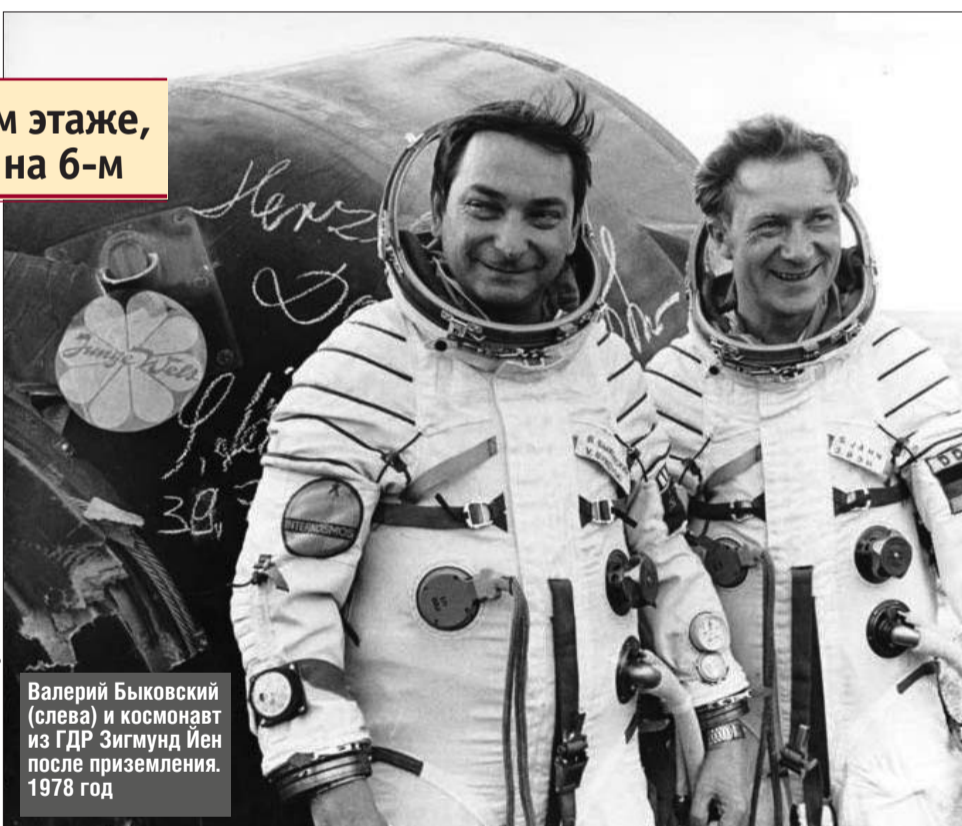
Валерий Быковский (слева) и космонавт из ГДР Зигмунд Йен после приземления. 1978 год