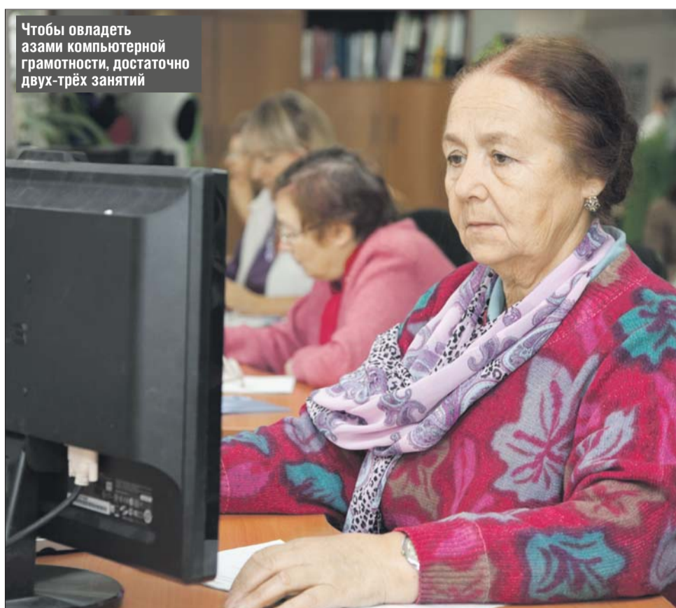
Чтобы овладеть азами компьютерной грамотности, достаточно двух-трех занятий

Чтобы исчез страх, надо как можно больше практиковаться. Даже если дома нет компьютера, можно прийти в библиотеку и поупражняться, во многих современных чи-