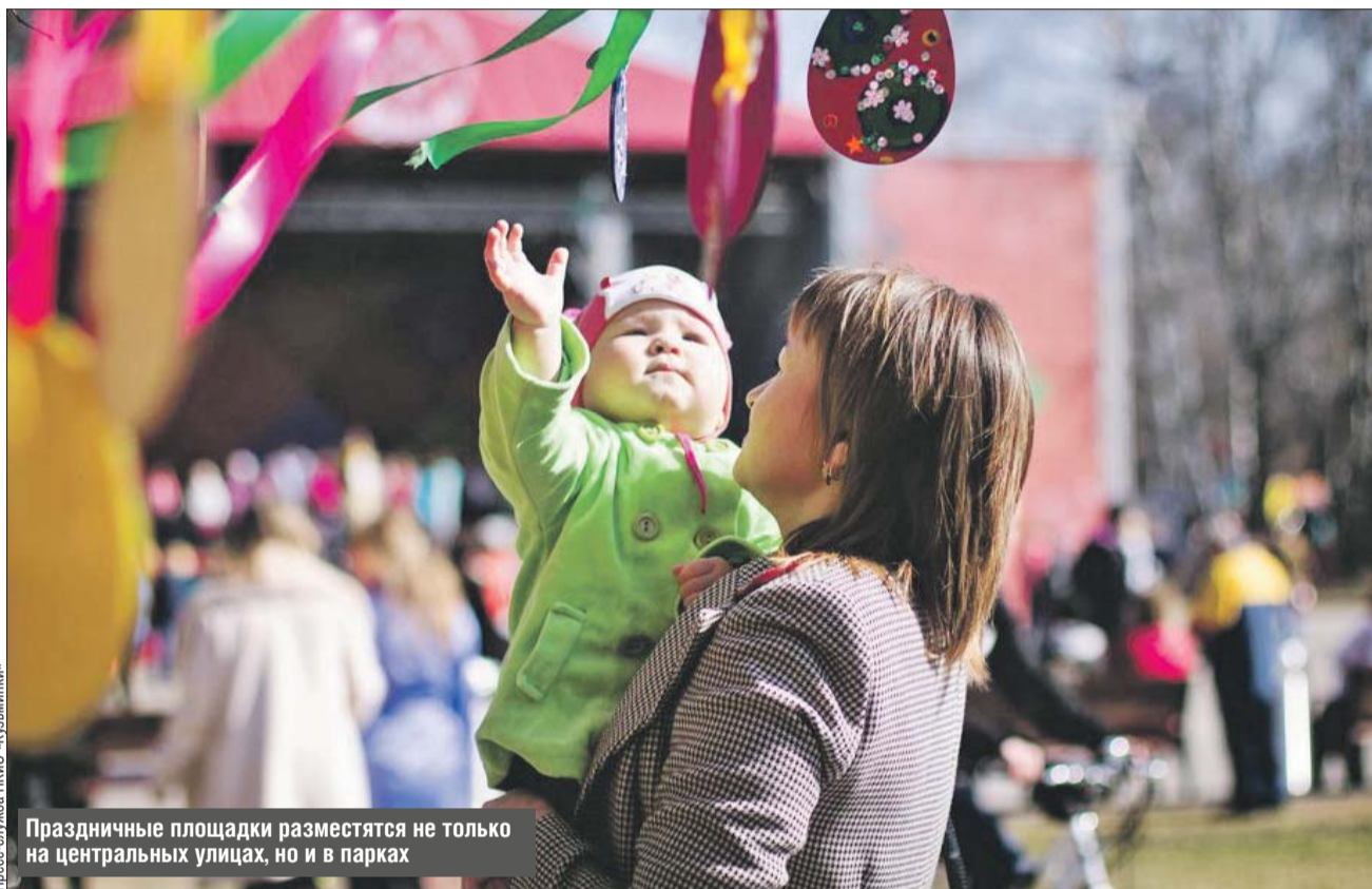
Праздничные площадки разместятся не только на центральных улицах, но и в парках

В парке культуры и отдыха «Кузьминки» 15