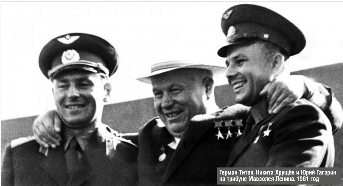
Герман Титов, Никита Хрущёв и Юрий Гагарин на трибуне Мавзолея Ленина. 1961 год

— Наша часть находилась на 7-м этаже, а космонавты — на 6-м, — вспоминает Наталья Торопова. — Почему-то я часто сталкивалась с Германом Титовым: вбегаю в здание, а он выходит, всегда очень красивый, в костюме-тройке. И вот один раз я бегу, он мне навстречу. И говорит: «Девушка, мы с вами точно лбами когда-нибудь столкнёмся!» А я ему: «Герман Степанович, нет, я вас оббегу и дальше побегу». Он засмеялся: «Хитрая какая!»