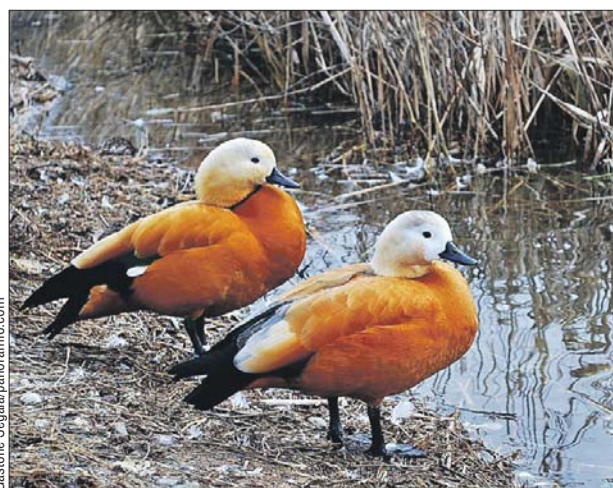
В 1950-х годах отдельные пары уток стали покидать пруды Московского зоопарка и гнездиться в городе

На природной территории «Кузьминки-Люблино» на Люблинском пруду поселилась пара огарей.