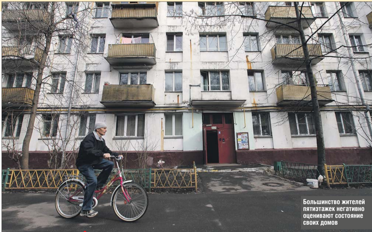
Большинство жителей пятиэтажек негативно оценивают состояние своих домов

Большинство опрошенных, проживающих в пятиэтажном жилом фонде, негативно оценивают состояние своих домов: 70% граждан считают, что они подлежат сносу, а 16% согласны на капитальный ремонт или реконструкцию. Только 8% жителей, которые приняли участие