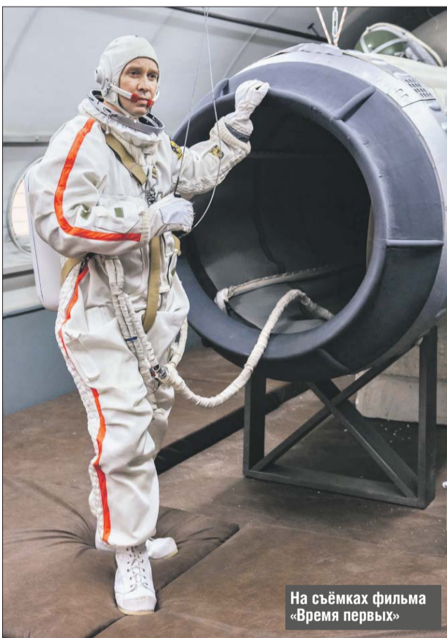
На съёмках фильма «Время первых»