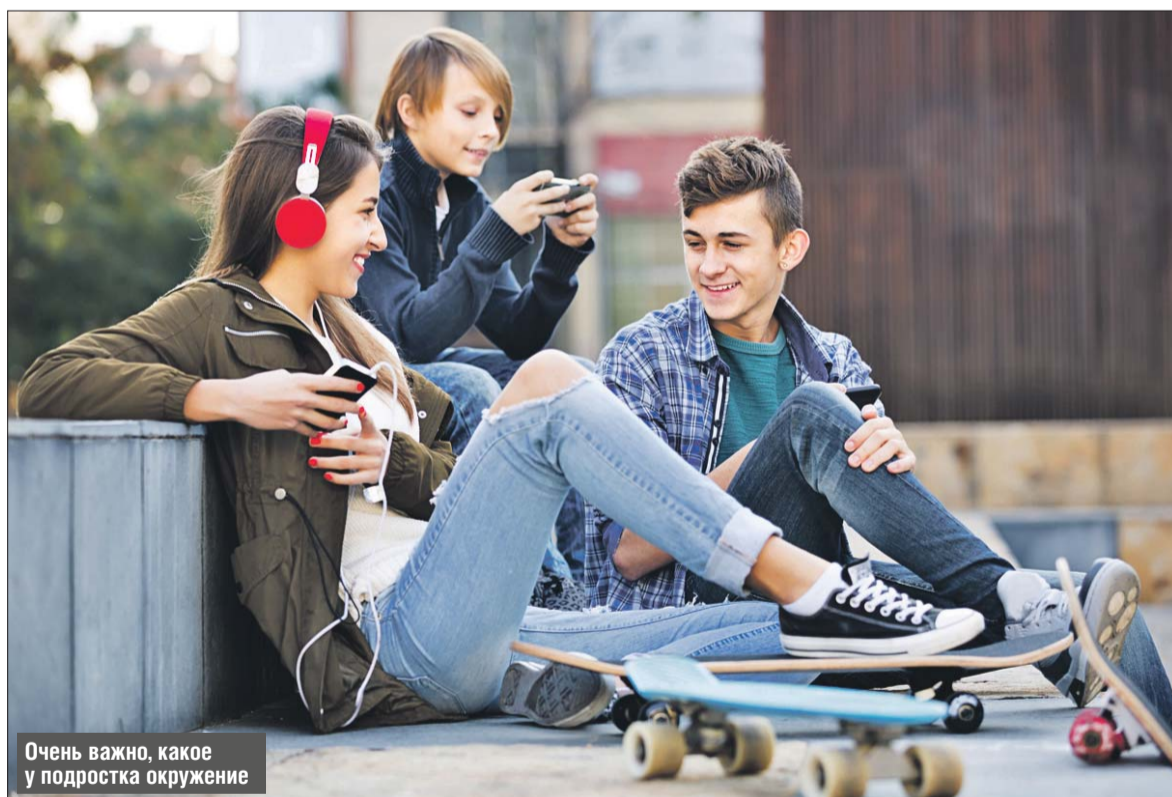
Очень важно, какое у подростка окружение