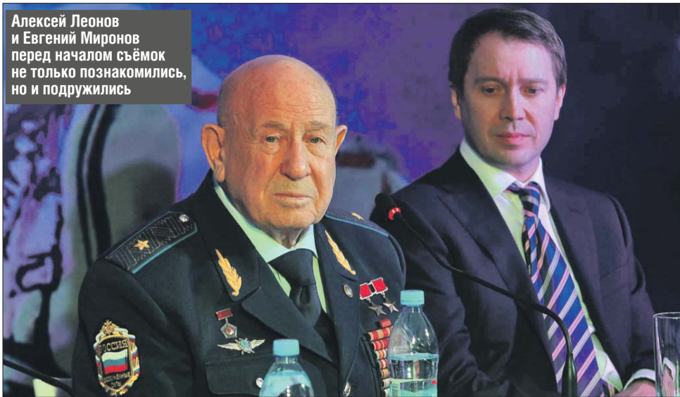
Алексей Леонов и Евгений Миронов перед началом съёмок не только познакомились, но и подружились

— Да, я был в ноябре на Байконуре, присутствовал при запуске ребят, которые, кстати, и сейчас всё ещё находятся на орбите: по их глазам я старался понять их психологическое состояние. К полёту в космос до сих пор многие, как и я сам, относятся как к чуду.